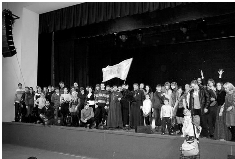
Во время концерта

будем непобедимы. Не принимать поспешных решений в отношении кого-либо — поможет вам внутренне состояться, сохранить цельность души. Учитесь управлять своей волей. Тогда возможно соработничество с Богом. Всегда сила русского народа была в Православной вере. Она давала то, что ничто другое не может дать. Познаете Бога — многое будет разрешаться в вашей жизни, личной, семейной и общественной».