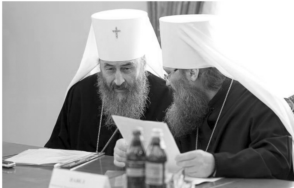
Идет заседание Синода Украинской Православной Церкви Московского Патриархата

ПРАВОСЛАВНОЙ ЦЕРКВИ МИТРОПОЛИТОМ ОНУФРИЕМ