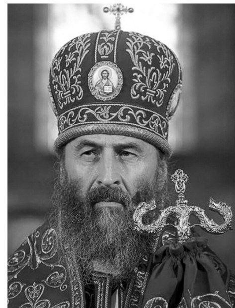
Онуфрий, Местоблюститель Киевской митрополичьей кафедры митрополит Черновицкий и Буковинский

— Можно так сказать, потому что они меньше понимают и любят Церковь. Они думают, что это человеческая организация, которой можно манипулировать. Нет ясного понимания, что Церковь