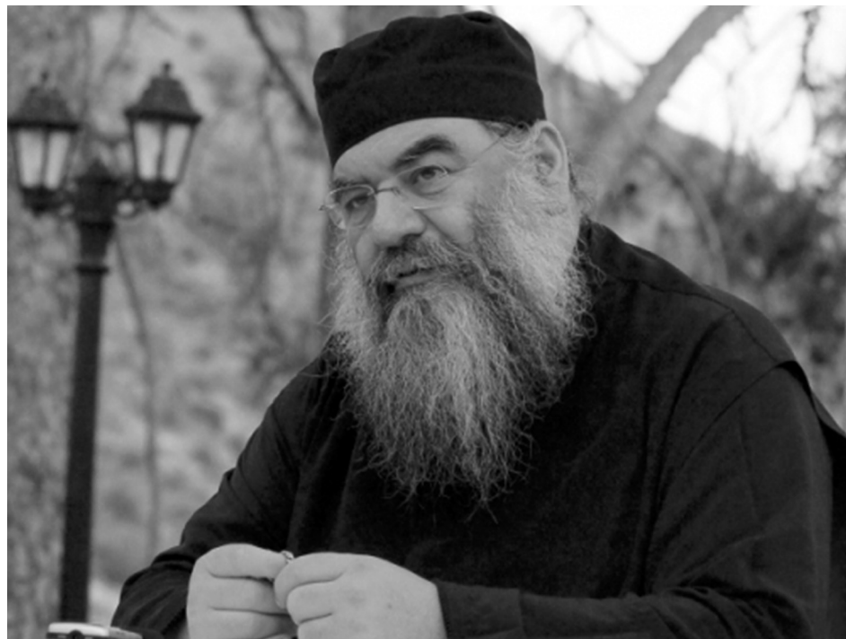
Митрополит Лимассольский Афанасий

Немного погода опять вздыхает: – Эх, что же с нами творится, мы идем в мир! Если и было у нас что, потеряем!