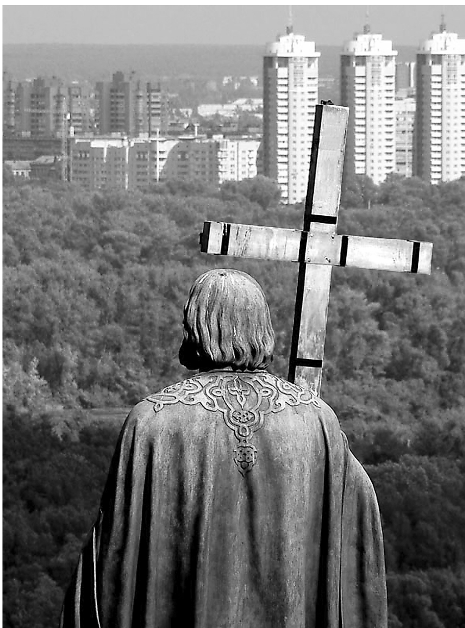
"Ангелом и человеком Творец, ... судьбы государств и народов устрояй..." (Икос 1 акафиста святому равноапостольному князю Владимиру)

То же самое происходит и в наших трудовых коллективах. Как часто мы конфликтуем, как часто мы добиваемся своего! Как часто, прокладывая путь вперед, обезпечивая свою карье-