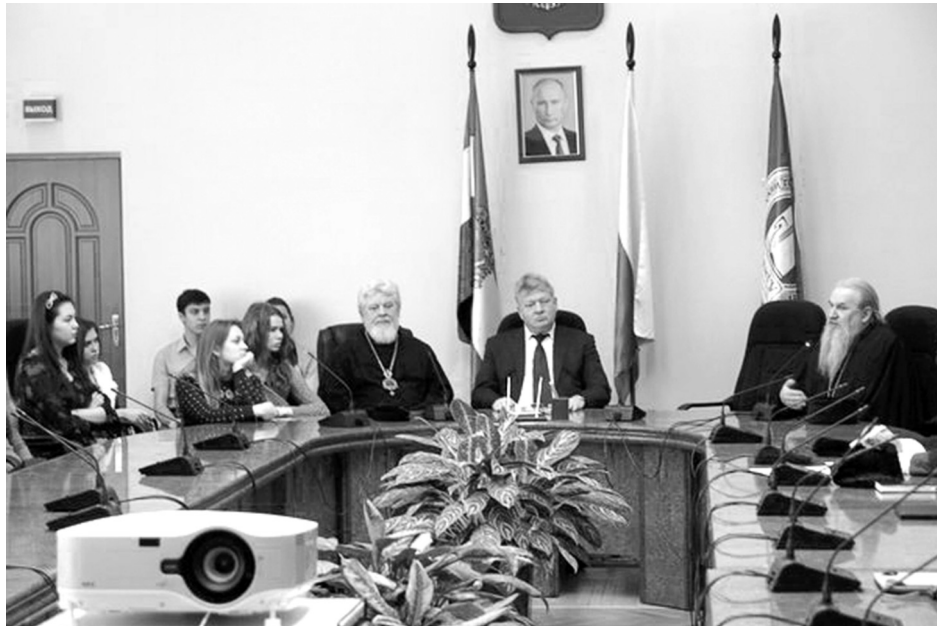
В зале заседаний