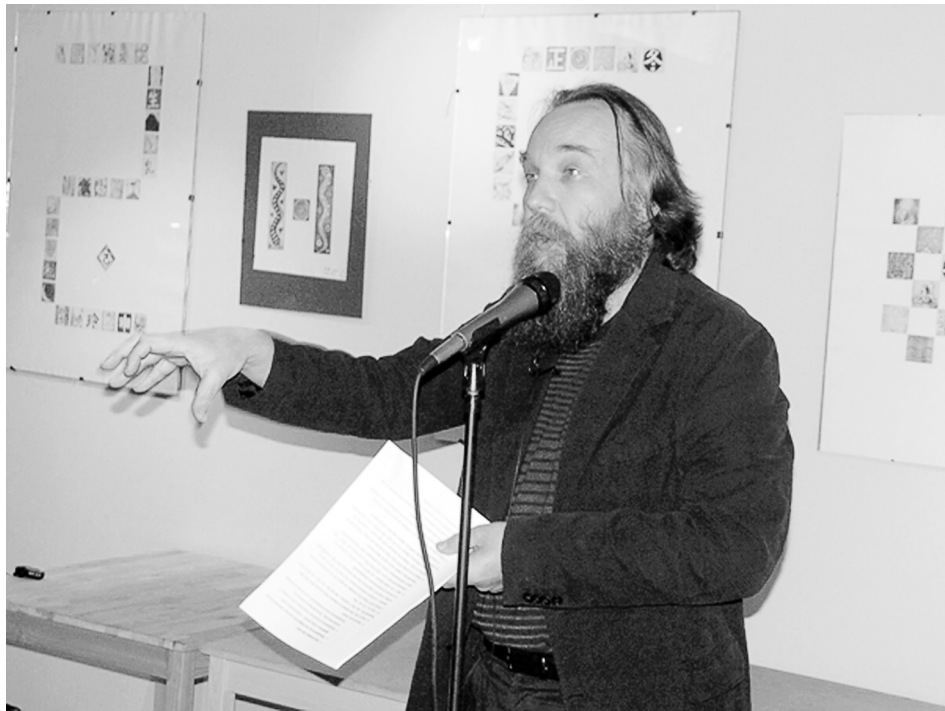
Александр Гельевич Дугин