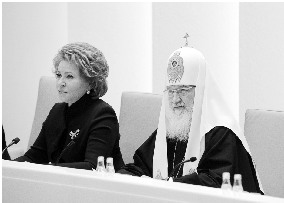
Святейший Патриарх Кирилл и председатель Совета Федерации В. И. Матвиенко

Русская Православная Церковь, свидетельствуя о непреходящих евангельских идеалах и ценностях, всегда призвала и будет призывать людей руководствоваться этими ценностями в своей семейной, общественной и профессиональной жизни и деятельности. Учение Христово в течение веков глубоко