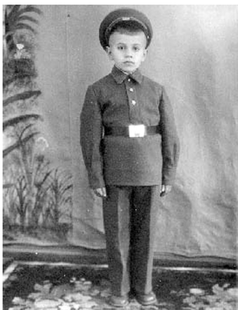
Школьная форма 60-х годов прошлого столетия

День начинался как обычно: урок, перемена, еще сорок пять минут трудов, когда третьеклашки, затаив дыхание, расположившись в своих черно-коричневых партах-домиках, познавали мир и себя. Потом наступила долгожданная перемена, когда учительница, вооружившись черпаком и подносами со ста-