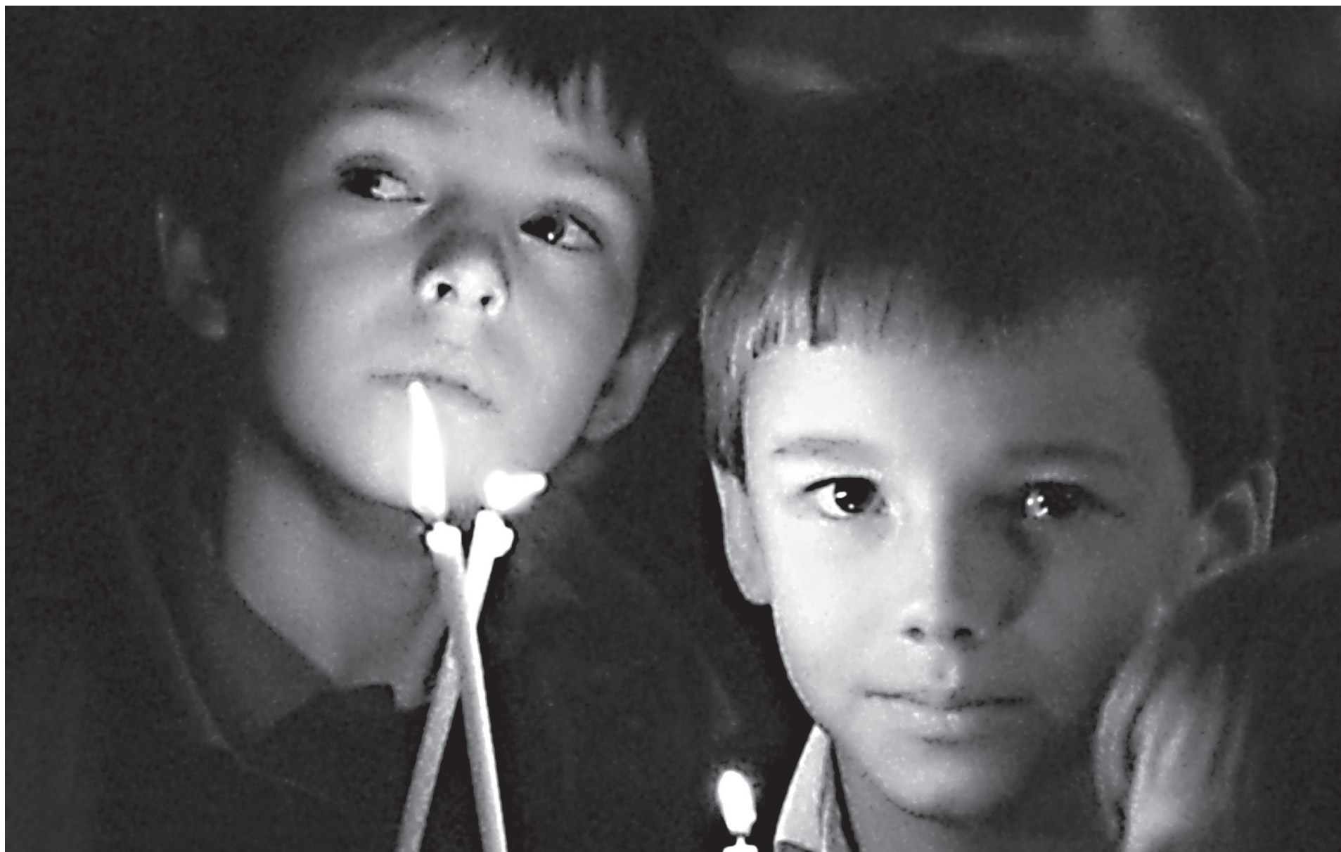
«Воздаждь ми радость спасения Твоего...»

Да же у человека, не способного к анализу собственных мыслей, собственных деяний, и то всегда есть некое самооправдание, когда он впадает в грех распутства или пьянства, когда он делает что-то, что лишает его образа человеческого, только чтобы усладить свою похоть. Ведь он же не бездумно это делает – какие-то мысли всегда предшествуют. Вот с этой мыслительной части души, как говорит Григорий Палама, все начинается. Мысли подталкивают человека к формированию образов, мысли создают некое притяжение ко греху, мысли направляют человеческую волю.