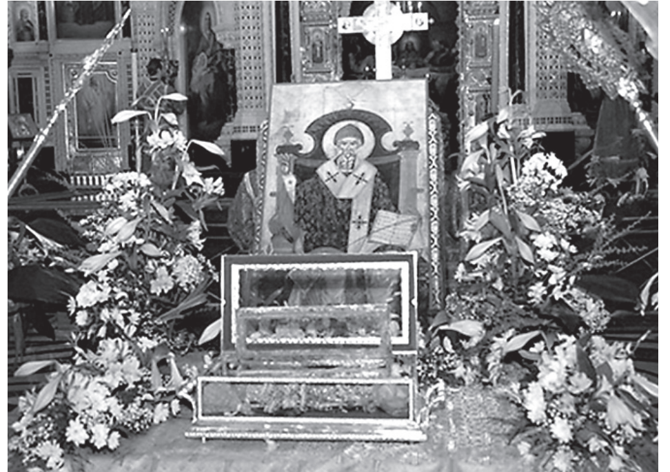
Десница свт. Спиридона Тримифунтского