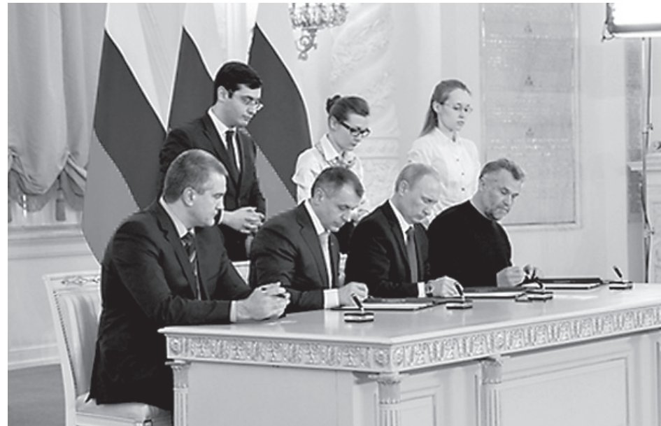
Подписание договора о вхождении Республики Крым в состав Российской Федерации

Соответственно, подписание соглашения об ассоциации означало бы, что Украина уже не может стать участником Таможенного союза с Россией, Белоруссией и Казахстаном. И тогда мы, столкнувшись с конкуренцией европейских товаров через украинский рынок, опосредованно вынуждены будем принимать меры тарифной защиты. То есть, Украина сама себя вытал-