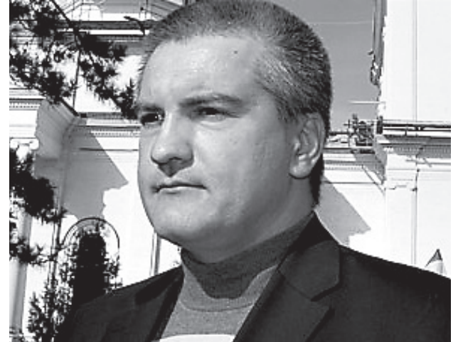
Сергей Валерьевич Аксенов

Продажные киевские средства массовой информации обвиняют Россию в аннексии Крыма. Больше бреду я не слышал за всю свою жизнь. Россия откликнулась на наш искренний призыв, выполняя долг перед соотечественниками, единокровными братьями. И сейчас мы ощущаем ее могучую поддержку каждую минуту. Я могу лишь пожелать вам, многократно преданным и продан-