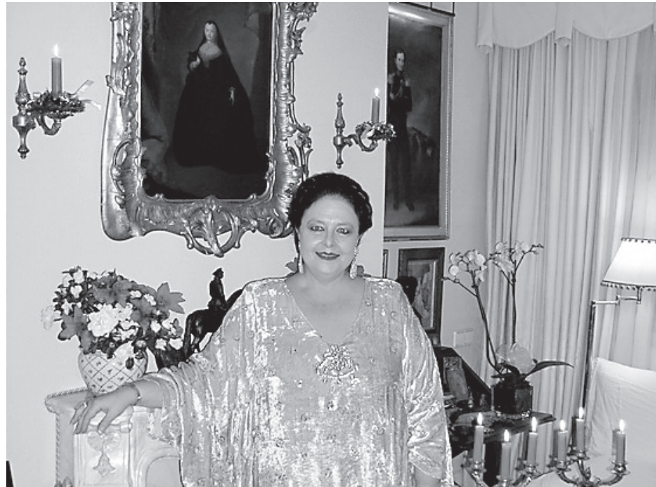
Мария Владимировна Романова