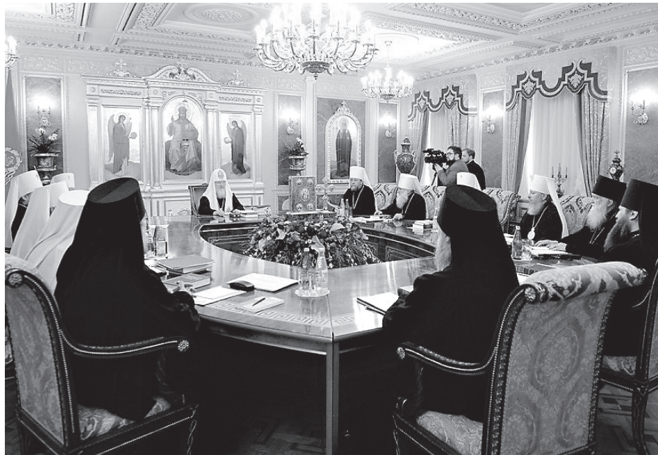
Заседание Священного Синода