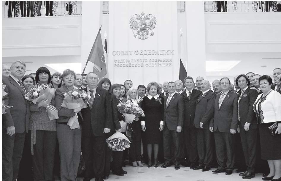
Делегация Республики Крым в Совете Федерации

суда Украины о том, что ее действие невозможно без изменения Конституции Украины.