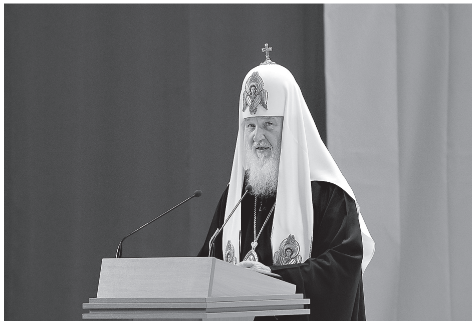
Патриарх Московский и всея Руси Кирилл

Перейдем к конкретным вопросам. Что нужно сделать, чтобы сегодня церковная журналистика была актуальной? Чтобы она несла такое послание Церкви и обществу, вокруг которого бы возникали дискуссии, рождался бы