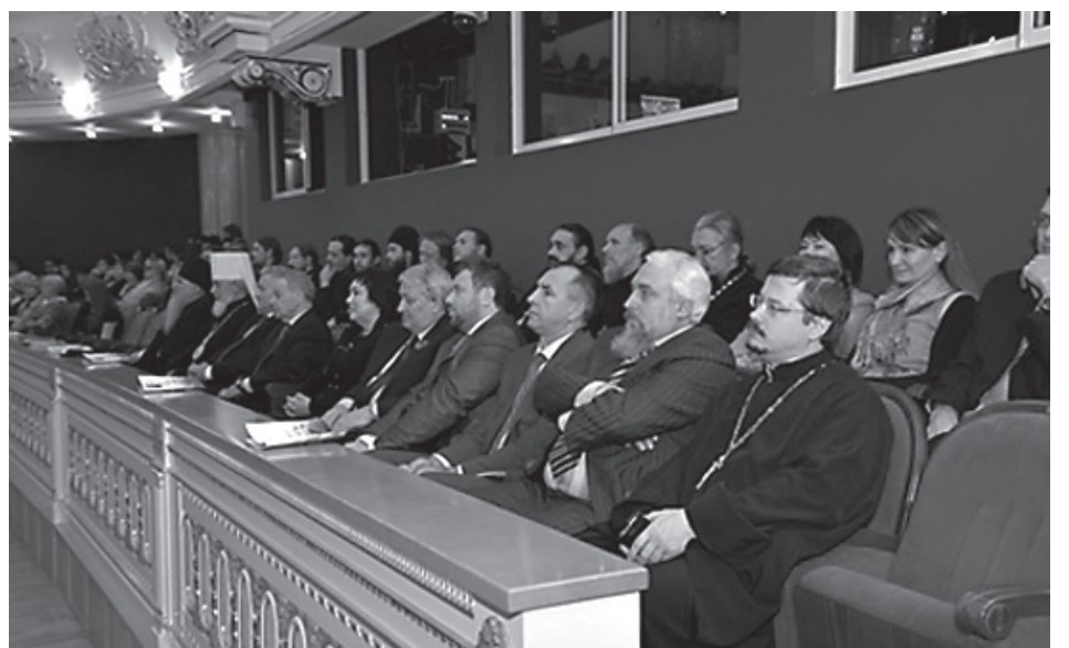
Почетные гости во время конференции