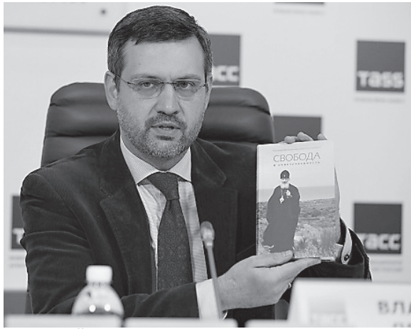
В. Р. Легойда открывает фестиваль

В шестой раз собрались в столице нашей Родины все, кто проповедует Христа посредством печатного или зримого слова в нашей необъятной стране. Неудивительно, что за десять лет, прошедших с момента проведения первого фестиваля православных СМИ «Вера и слово», этот форум стал представительней и собрал в пансионате «Клязьма» более 400 посланцев из 167 епархий Русской Православной Церкви. Фестиваль традиционно позволил встретиться, обменяться опытом, сверить мысли и планы руководителям пресс-служб и отделов по связям с прессой со всех епархий России, а также Украины, Белоруссии, Латвии, Узбекистана и других стран. На юбилейный фестиваль съехались и те, кто создает православные фильмы, интернет-ресурсы, занимается организацией православного радиовещания, и другими проектами в сфере СМИ. Словом, прекрасное место с чудной природой вокруг, очень удобное для проведения такого рода встреч, было на несколько дней заполнено духом веры и правды. Стало обителью, где проходили встречи и дискуссии, презентации и круглые столы на тему православной журналистики.