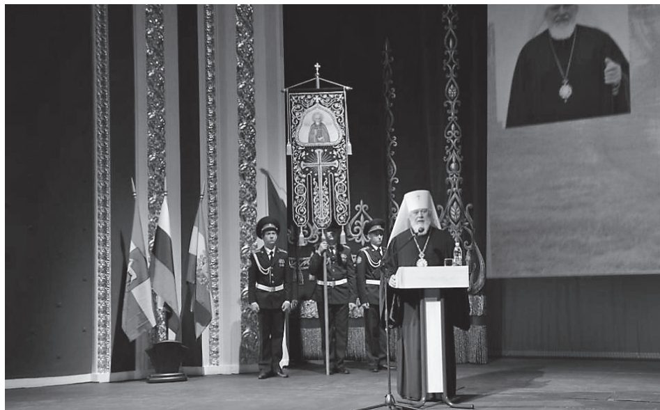
Приветствие митрополита Самарского и Сызранского Сергия участникам форума

нет порядка в головах. Нет порядка в наших сердцах. Мы не выстроили свое отношение к важнейшим событиям истории нашей страны.