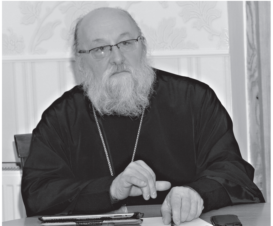
Протоиерей Александр Авдугин во время интернет-проповеди