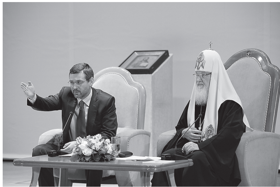
Встреча участников фестиваля со Святейшим Владыкой

У меня однажды был очень интересный разговор с прихожанкой, которая говорила о священнике, принимавшем ее исповедь. Она назвала батюшку, который, на мой взгляд, ничем особенно не отличался. Поэтому свидетельство этой женщины было для меня очень важным. Она сказала: «Когда батюшка меня исповедовал, то я поняла, что он тоже в этот момент исповедуется». Это произвело такое сильное впечатление на женщину, способную критически оценивать то, что вокруг нее происходит, что она стала глубоко верующим человеком. В этом простом пастыре она увидела не того, кто с высоты своего положения принимает исповедь, но человека, который способен отождествить себя с ее проблемами и говорить не просто от лица учителя, а говорить от лица заинтересованного участника процесса выхода человека из-под давления и влияния греховных наклонностей.