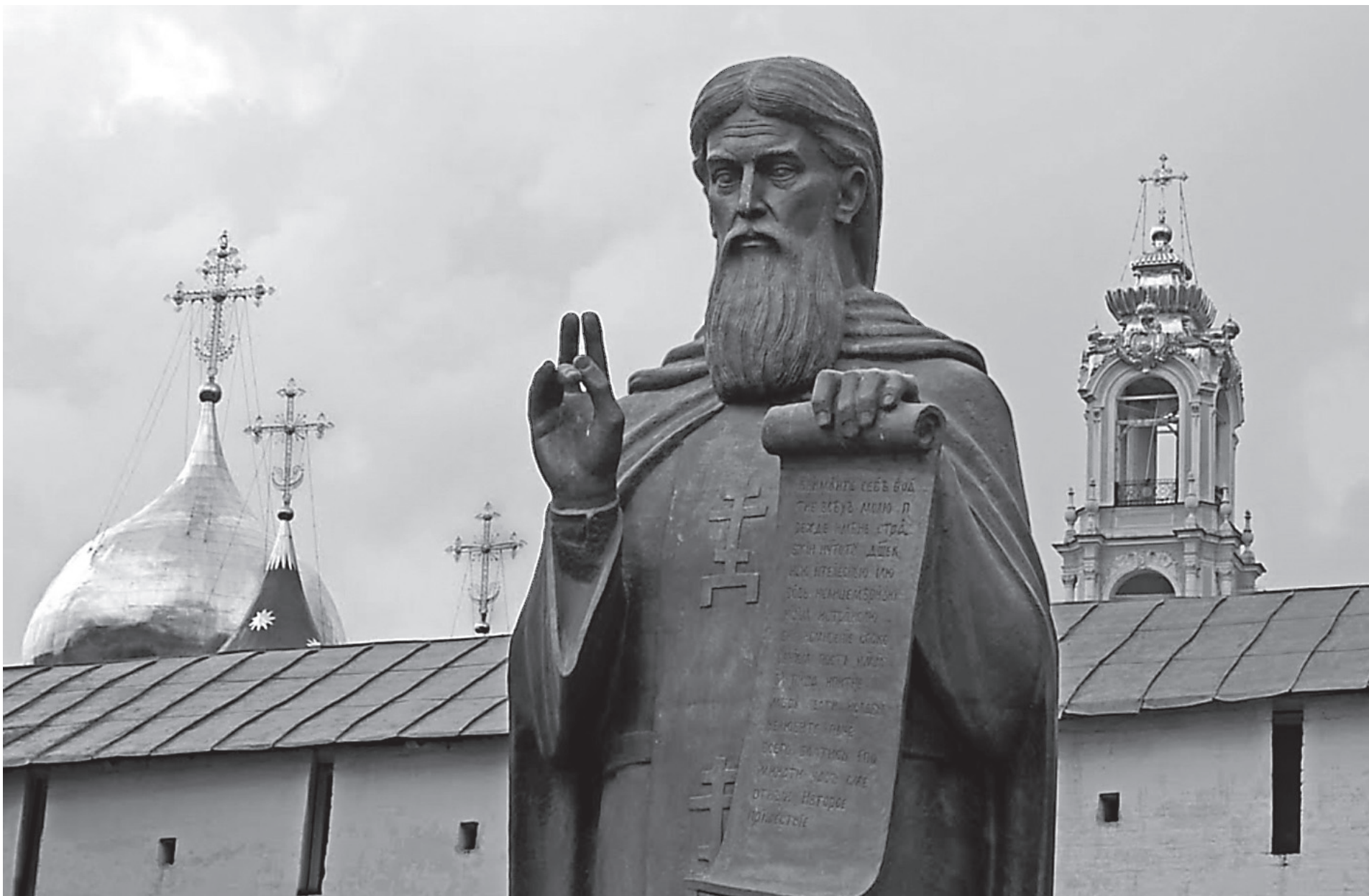
Памятник Преподобному Сергию Радонежскому работы В. А. Чухаркина

Предстательство Преподобного Сергия, родившегося 700 лет тому назад, было явлено нашей Церкви особенным образом в этот год, в течение которого было сделано очень многое. И Лавра, как вы видите, преобразилась буквально до неузнаваемости, и многие храмы, посвященные Преподобному Сергию, были отреставрированы, но, может быть, самое главное, что произошло, — то, что образ Преподобного Сергия, его личность, его значение для Церкви нашей, для народа нашего, для судеб государства нашего стали понятными для огромного числа людей, которые только слышали когда-то об этом имени, но не могли себе представить масштаб личности Преподобного. Смиранный старец, заложивший в лесных дебрях сей Свято-Троицкий монастырь, посвятивший свою жизнь молитве, созерцанию, исполнению послушаний, физическим трудам, никогда не готовивший себя ни к какой политической деятельности и даже отказавшийся от призыва святителя Алексия принять архиерейский сан, будучи внешне самым простым и незаметным человеком, так повлиял на судьбу нашего Отечества, что сегодня мы говорим: если бы не Преподобный Сергий, то не было бы Куликовской битвы, не было бы последующего развития нашей страны, которое привело к освобождению от татаро-монгольского ига, а затем и к великому процветанию.