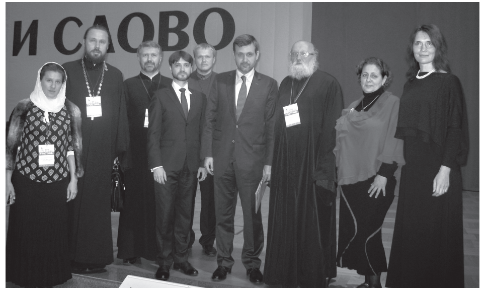
Победители конкурсов фестиваля «Вера и слово». Фото на память

Удивительно, но книги дали понять, что человек без веры ущербен, сколь бы образован и нравственен не был.