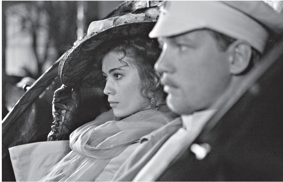
Фрагмент из фильма «Солнечный удар»

Второй слой: несколько тысяч людей, которых скоро зверски убьют. Они все еще желают понять смысл происходящего. Центральный персонаж — тот самый блестящий офицер с волжского парохода — наблюдает за происходящим и мучается непониманием: с чего, Бога ради, началось падение России в этот темный ужас, выстуженный ветрами крымской осени?