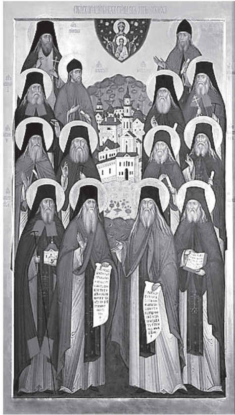
Икона оптинских старцев

ра фильма Никиты Михалкова. Люди порой настолько не готовы уважать или хотя бы выслушивать чужую точку зрения, что по самым острым темам даже приходится закрывать для комментариев интернет-страницы и сайты».