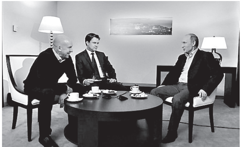
Во время интервью