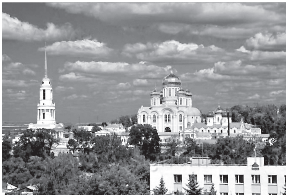
Рождество-Богородицкий Задонский монастырь. Общий вид

История России - это история героев и подвижников. Чаще всего