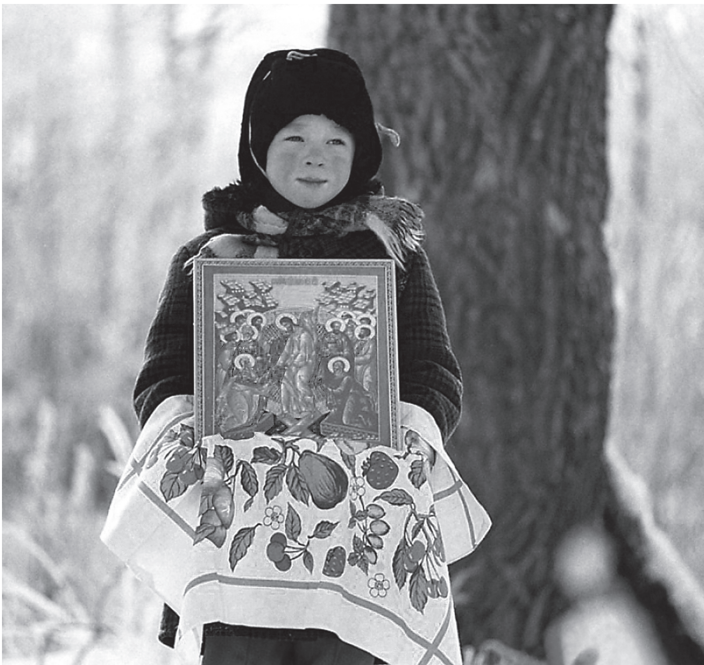
С нами Бог!

Хотел бы начать с удивительных слов, сказанных апостолом Павлом в Послании к Ефессянам. Мы слышали сегодня такие слова: «Христос есть мир наш, Он из обоих соделал одно, упразднил существующую посреди нас преграду, дабы из двоих соделал в Себе Самом одного нового человека, устраивая мир» (Еф. 2,14-15). Более сильных слов, обращенных к миссионерам, невозможно представить.