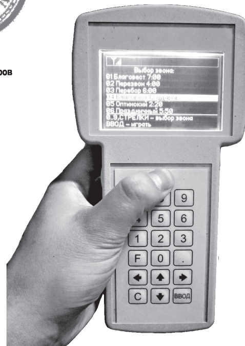
КОЛОКОЛА от 4кг до 18тонн