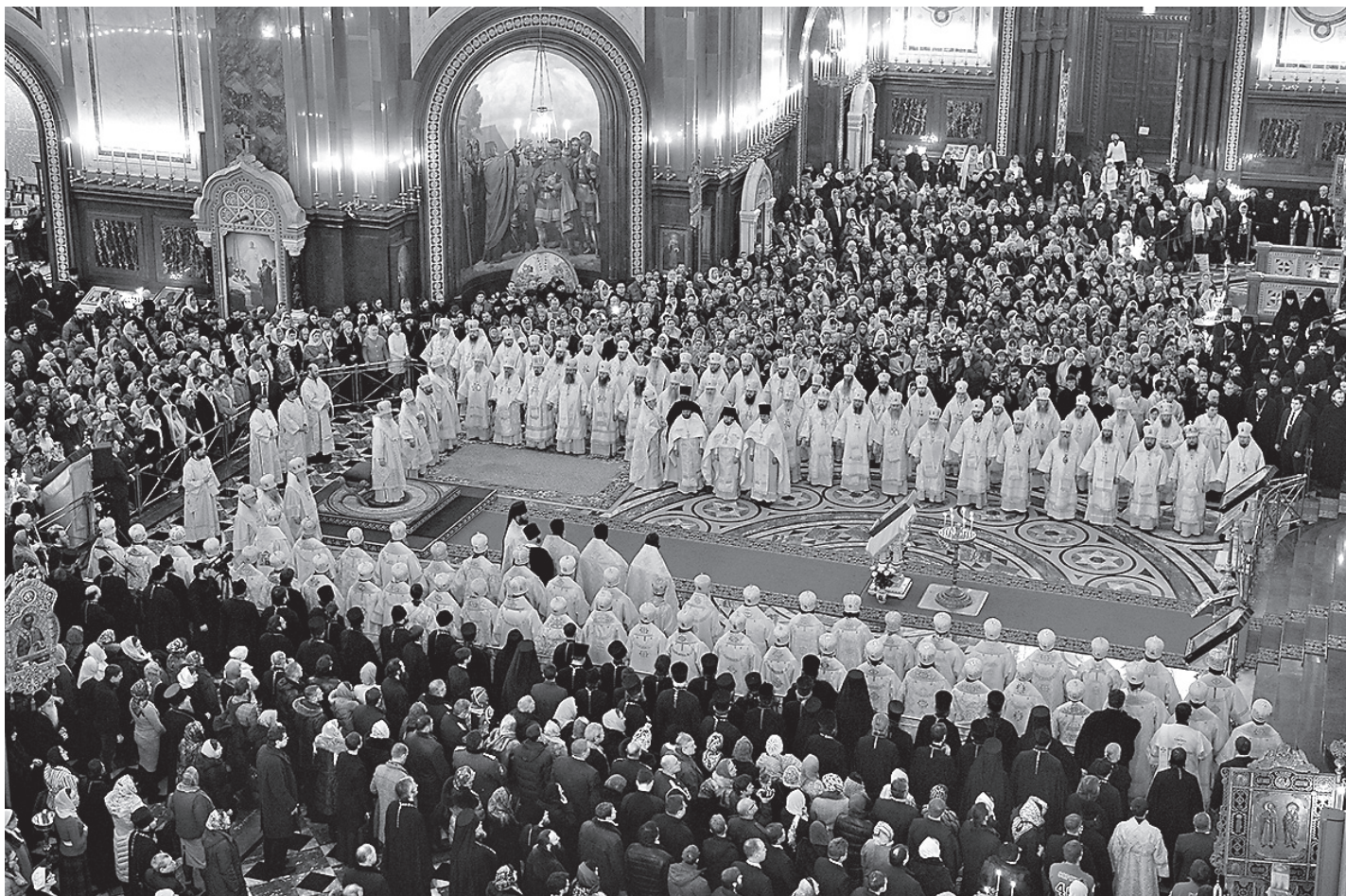
Божественная литургия в Храме Христа Спасителя

Обращаясь к вам, мои дорогие, в преддверии этого важного события, хотел бы сказать о том, что в вашем служении имеет особую важность и требует особой ответственности. Это нечто простекает из замечательных слов, которые мы слышали сегодня в отрывке из послания апостола Иакова (Иак. 3,11-4,6), а также в евангельском чтении (Мк. 11,23-26). Апостол Иаков говорит удивительные слова: не может из одного источника истекать горькая и сладкая вода. Мы слышим его пронзительные слова: Бог гордым противится, а смиренным дает благодать. Эти слова в каком-то смысле очерчивают определенные параметры, в том числе и миссии Церкви в современном мире, включая ее образовательную деятельность. Все те, кто посвящает себя этой деятельности, должны быть людьми целомудренными не только в прямом смысле