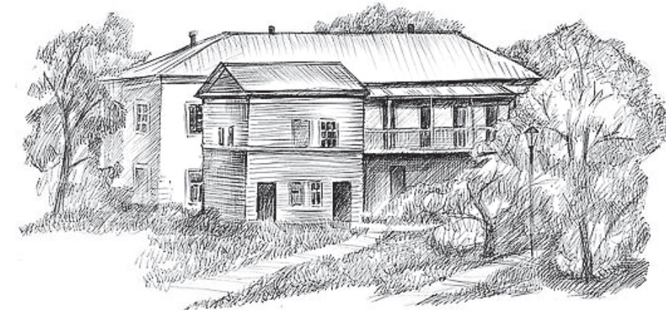
Келья святителя Феофана. Рис. Л. А. Вороновой

очень тесным из-за его обширной библиотеки. Тогда настоятель Вышенской пустыни и одновременно ученик святителя о. Аркадий (Честонов) решил построить для него отдельные кельи. Зимой 1866 года он приступил к постройке над каменной просфорней второго деревянного этажа. Помещение для владыки Феофана вышло просторное и вполне удобное. Сначала святитель не уединялся полностью, но потом окончательно ушел в полный затвор, перестав принимать посетителей.