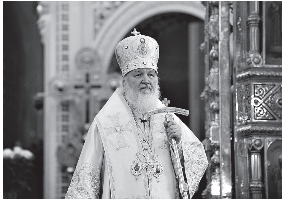
Патриарх Московский и всея Руси Кирилл

Нынче справедливо говорится о необходимости создания многополярного мира, об образовании нескольких центров силы на международной арене. И действительно, любая, в том числе и