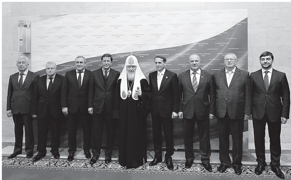
Фото на память с участниками Рождественских Парламентских встреч

Владимир Филиппов призвал педагогов к участию в инициативной Президентом России Владимиром Путиным разработкой «Стратегии развития воспита-