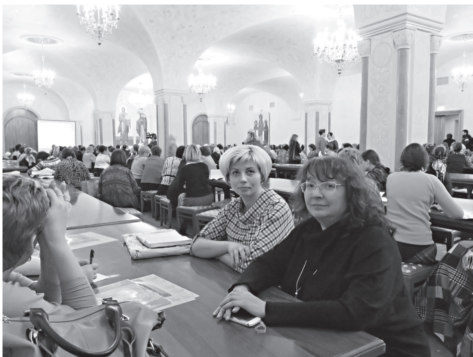
Сотрудники НФ ДЕОЦ на одной из секций Рождественских чтений

Теме православного образования и воспитания на Рождественских чтениях была посвящена еще одна из многочисленных секций – педагогическая мастерская «Поезд творческих идей (для учителей ОПК, заместителей директоров школ по воспитательной работе, социальных педагогов и др.) как совместный проект Екатеринбургской и Кубанской епархии и Минобрнауки Краснодарского края. Этот проект стал