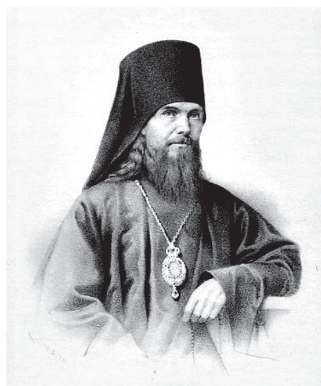
Святитель Феофан Затворник