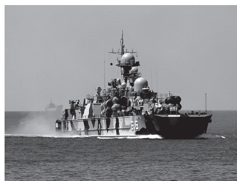
Ракетный корабль на воздушной подушке «Бора» «МОРСКОЙ РАЗРУШИТЕЛЬ»