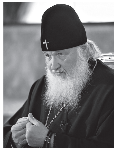
«...раскаяться никогда не поздно»

— Ваша семья ведь изрядно пострадала от советской власти.