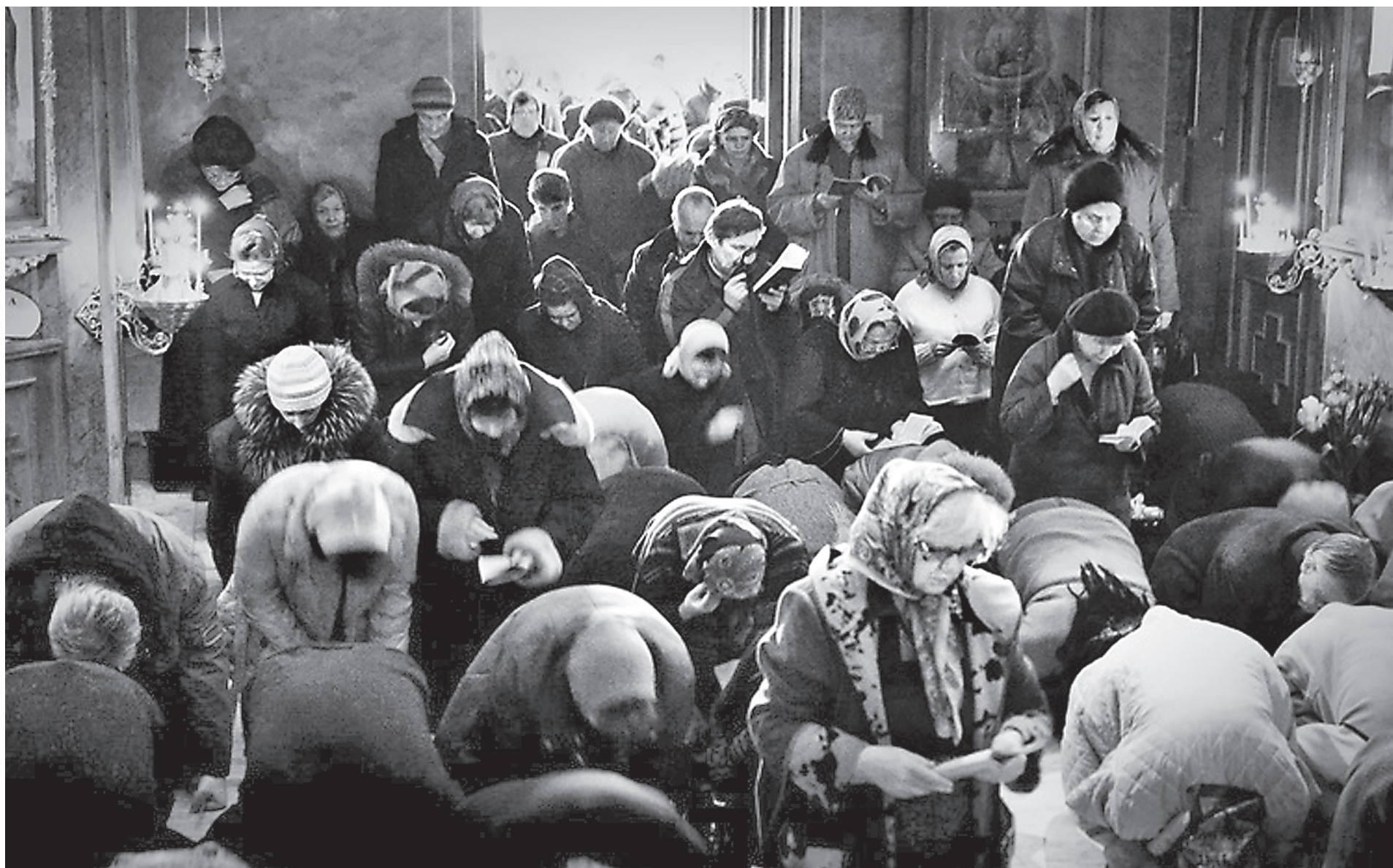
«Великий Канон» преподобного Андрея Критского

С амопознание есть одна из важных целей Великого поста. Это очень непросто – познать самого себя, потому что в каждый момент жизни мы разные. На это различие влияют внешние условия, а также искушения диавольские. И то, что еще вчера казалось невозможным и недопустимым, сегодня совершаем с легкостью. И напротив – иногда следующий день помогает нам многое понять, увидеть в самих себе и раскаяться в грехах своих.