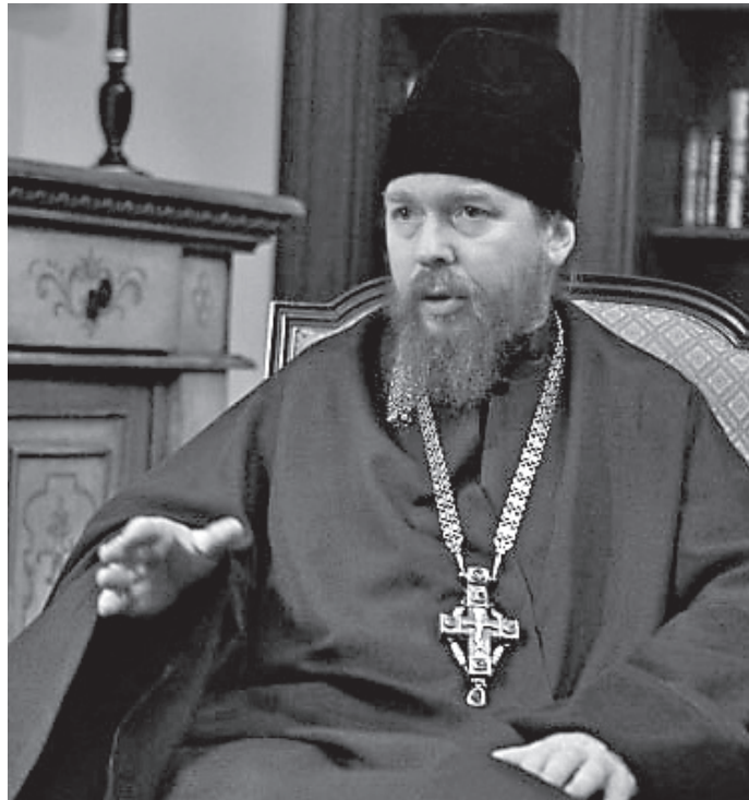
Архимандрит Тихон (Шевкунов)

«Нам не дано предугадать, как наше слово отзовется, / И нам сочувствие дается, как нам дается благодать».