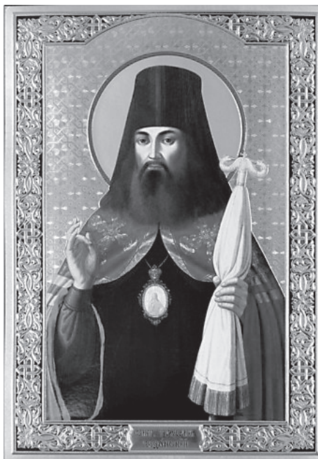
Святитель Тихон Задонский

сыновья царствия Божия, сердцем от мира отлучившиеся и всякие скорби в мире терпящие, желают к тому Отечеству прийти. Христианину истинному в этом мире жизнь есть не что иное, как всегданнее страдание и крест. Когда странник в Отечество, в дом свой возвратится, то домашние, соседи и друзья его радуются ему и приветствуют его благополучное прибытие. Так, когда христианин, окончив свое в мире странствование, придет в Отечество Небесное, радуются о нем все Ангелы и все святые жители небесные. Странник, пришедший в Отечество и дом свой, в безопасности живет и успокаивается. Так и христианин, вошедший в Небесное Отечество, успокаивается, живет в безопасности и ничего не боится, радуется и веселится о блаженстве своем. Отсюда видишь, христианин: 1) Жизнь наша в этом мире есть не что иное, как странствование и переселение, как говорит Господь: «Вы пришельцы и переселенцы предо Мною» (Лев 25,23). 2) Наше истинное Отечество не здесь, но на небесах, и для него мы созданы, Крещением обновлены и Словом Божиим позваны. 3) Не должны мы, как позванные к небесным благам, земных искать и к ним прилепляться, кроме нужных, как-то: пищи, одежды, дома и прочего. 4) Человеку-христианину, живущему в мире, нечего более желать, как вечной жизни, «ибо где сокровища ваше, там