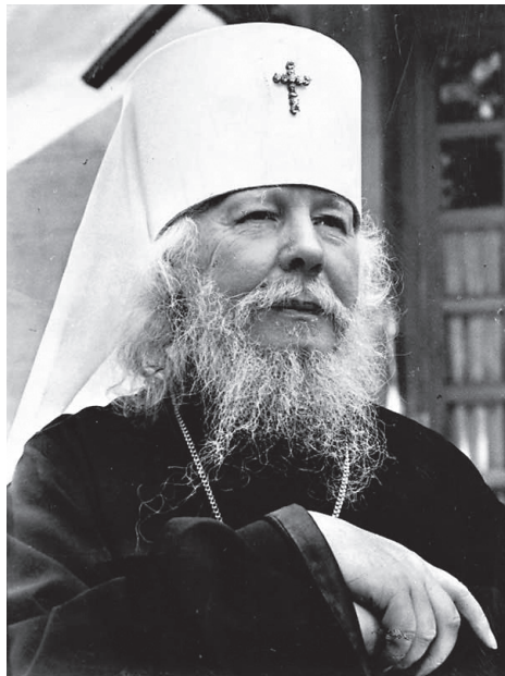
Митрополит Санкт-Петербургский и Ладужский Иоанн (Снычев)

Да, христианство есть, несомненно, религия мира и любви, а не вражды и ненависти. Да, главнейшая заповедь христианства — это заповедь любви — любви к Богу как к средоточию всяческого добра и блага: милосердия и долготерпения, красоты, гармонии, справедливости. Но именно потому совер-