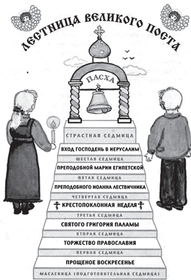
В церковнославянском языке слово «неделя» означает «воскресенье». Неделя же называется «седмичей».