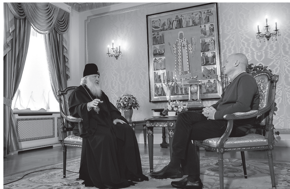
Во время интервью

— Я сомневаюсь во многом, кроме одного - Божьего бытия. В этом у меня никогда сомнения не возникали. Может,