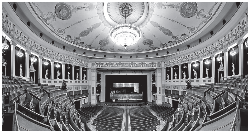
Новосибирский государственный академический театр оперы и балета. Внутреннее убранство

Тангейзер (его историческим прототипом является немецкий поэт-миннезингер (немецкий средневековый поэт певец,