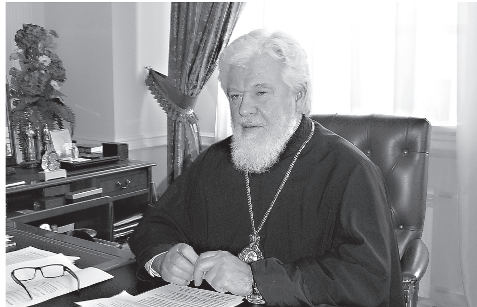
Митрополит Самарский и Сызранский Сергий

Нельзя не сказать и еще об одном вызове. Сегодня принято принижать роль Церкви в таких сферах, как культура и искусство. Оторванная от народа творческая интеллигенция всячески старается замолчать, скрыть связь