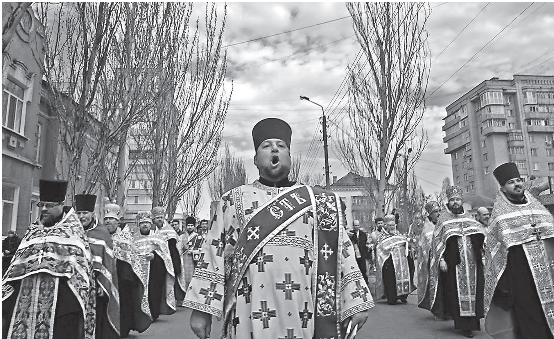
«Христос Воскресе!»