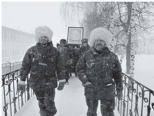
Самарские казаки на канавке Пресвятой Богородицы в Дивеево

СОВЕРШАЮТ ПОСТОЯННЫЙ КРЕСТНЫЙ ХОД САМАРСКИЕ КАЗАКИ