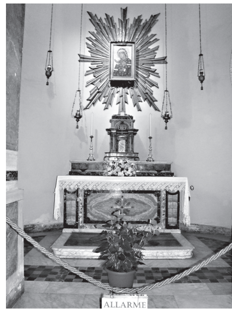
Рим. Эдесская икона Божией Матери, перед которой св. прп. Алексий молился 17 лет в церкви, в Эдессе