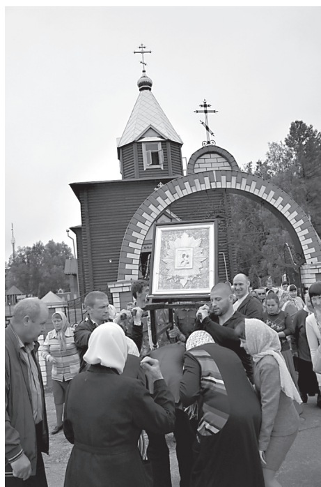
«Радуйся, в бедах наших Помощница!»

- Да, основной состав у нас - 10 казаков, то есть 2 смены по 5 человек. Каждые три недели мы меняемся. К нашему крестному ходу приезжали паломники даже из соседних обла-