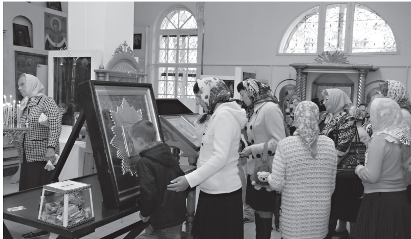
«Радуйся, Избавительница Наша от всех бед!»

Если окинуть взглядом историю, то выясняется, что без казаков не обошлись нигде. Они были и среди