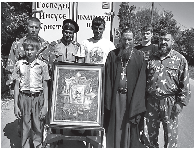
Одна из остановок казачьего крестного хода