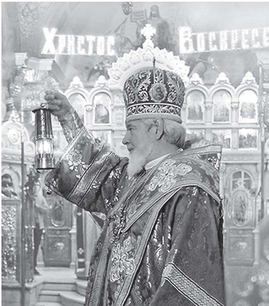
Пасха нетления, мира спасение

Вот почему у каждого в детстве должен быть воспитатель, как раньше его