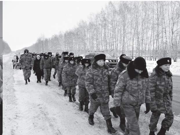
Кадеты Нижегородской митрополии в казачьем крестном ходе по Дивеево