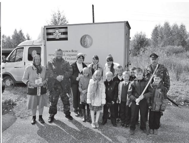
Подрастающие патриоты Родины