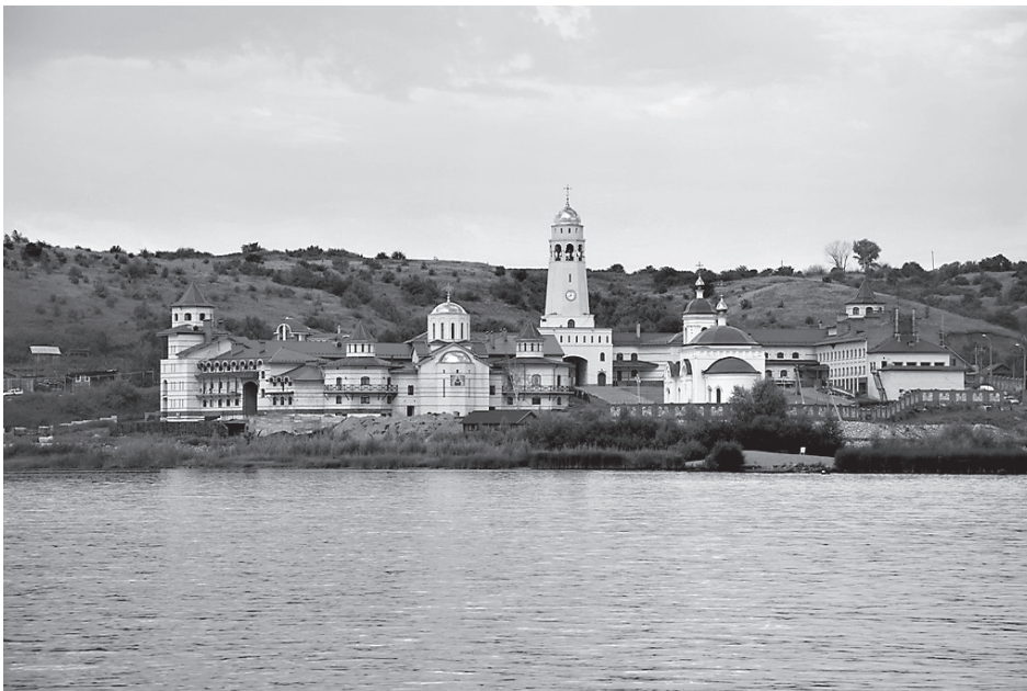
Свято-Богородичный Казанский мужской монастырь в Винновке

Православная вера – это наша правда и наше национальное самосознание.