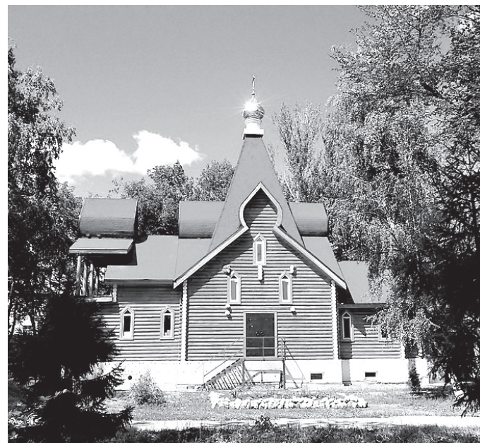
Храм Смоленской иконы Божией Матери в п. Управленческий

– Был обычным школьником, а к вере пришел в 10-м классе. Я работал в составе строительной бригады под руко-