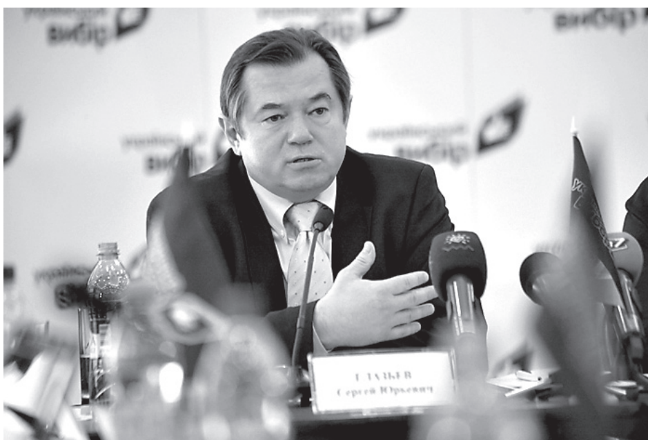
Доктор экономических наук, профессор С. Ю. Глазев

Понимание технологии поражения сознания когнитивным оружием не дает от него автоматической защиты. Даже весьма умные, честные и порядочные люди, обладающие большим жизненным и политическим опытом, могут стать объектом поражения. Ярким примером его успешного применения является наше собственное политическое сознание, в котором легко путаются причинно-следственные связи. Оценки и рейтинги, фабрикуемые американскими институтами исходя из своих интересов, воспринимаются как истинные вопреки объективной реальности. Эффективно провальные результаты макроэкономической политики выдаются за большие достижения, а ответственные за катастрофические последствия своих решений лица объявляются лучшими в мире министрами, банкирами, специалистами, самыми влиятельными и умными людьми. И как ни странно, это до сих пор работает. Развернутая американцами сеть агентов влияния по-прежнему формирует макроэкономическую политику, подставляя Россию под удары ведущейся США валютно-финансовой войны. И хотя ущерб от проводимой под руководством американских агентов влияния макроэкономической политики уже намного превысил материальные потери СССР вследствие