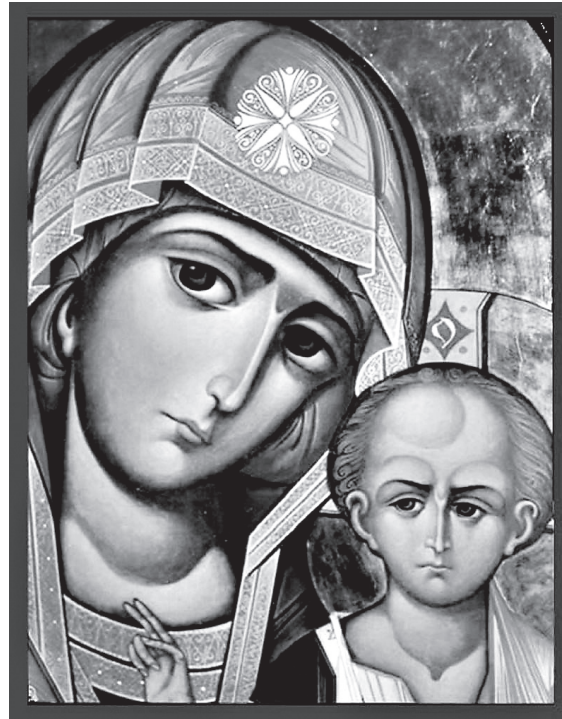
Икона Божией Матери «Казанская»

Мы знаем, что христианство являет небывалую любовь к человеку. К каждому, без исключения, человеку, который на языке Писания называется нашим ближним. Как никогда, должны мы сегодня услышать апостола Иоанна Богослова: «Кто говорит, что любит Бога, а брата своего не любит, тот лжец». Без любви к ближнему не существует веры. Невозможно любить Бога, не любя ближнего. Но мы призваны также любить Бога. И эта любовь должна быть конкретно выражена.