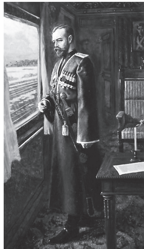
Николай II 2 марта 1917 года в царском вагоне

После отбытия Николая II из Ставки Верховного главнокомандования генерал-адъютант М. В. Алексеев запросил телеграммами всех командующих фронтами о желательности отречения Государя от престола в пользу Наслед-