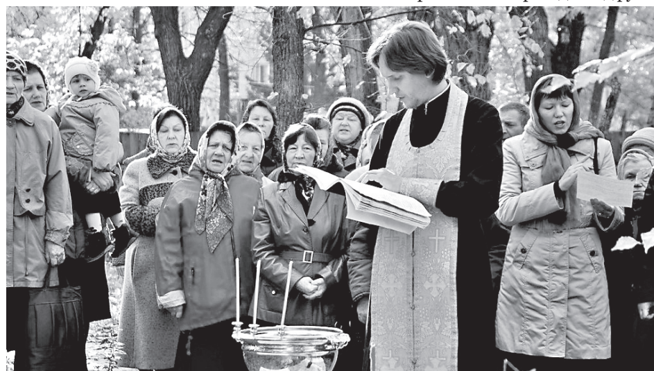
Освящение купола храма

– В приходе идет активная жизнь, в которой я стараюсь участвовать, что нас ждет нового?