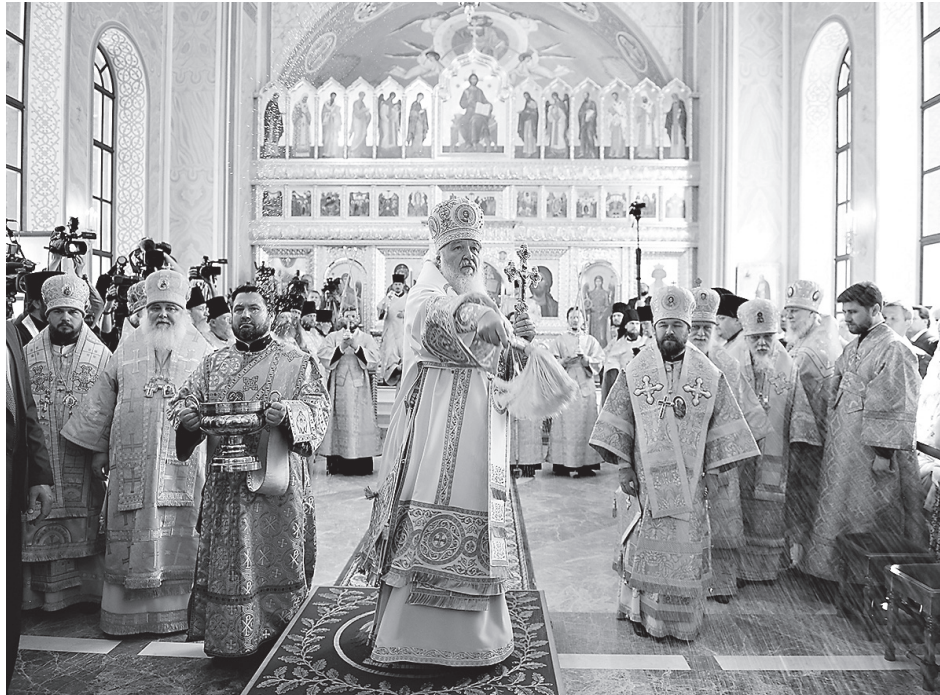
Освящение Князь-Владимирского храма в знаменитом Епархиальном доме Москвы

- Нам еще нужно отделать часть помещения. Но главная историческая часть здания на первом и втором этажах, где находится Соборная палата и храм святого Владимира, отреставри-