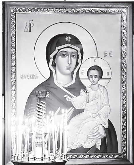
Икона Божией Матери «Смоленская»

Солнце играло в куполах храма, а солнечные блики и отражения, падавшие на землю, создавали чувство, что вот так он и выглядит – незримый Божественный свет. Ветерок что-то нашептывал скромницам березам, и они в ответ шелестели глянцевыми листочками. Во дворе храма стоял деревянный крест. Именно здесь владыкой Сергием в октябре 2008 года было освящено место под церковь.