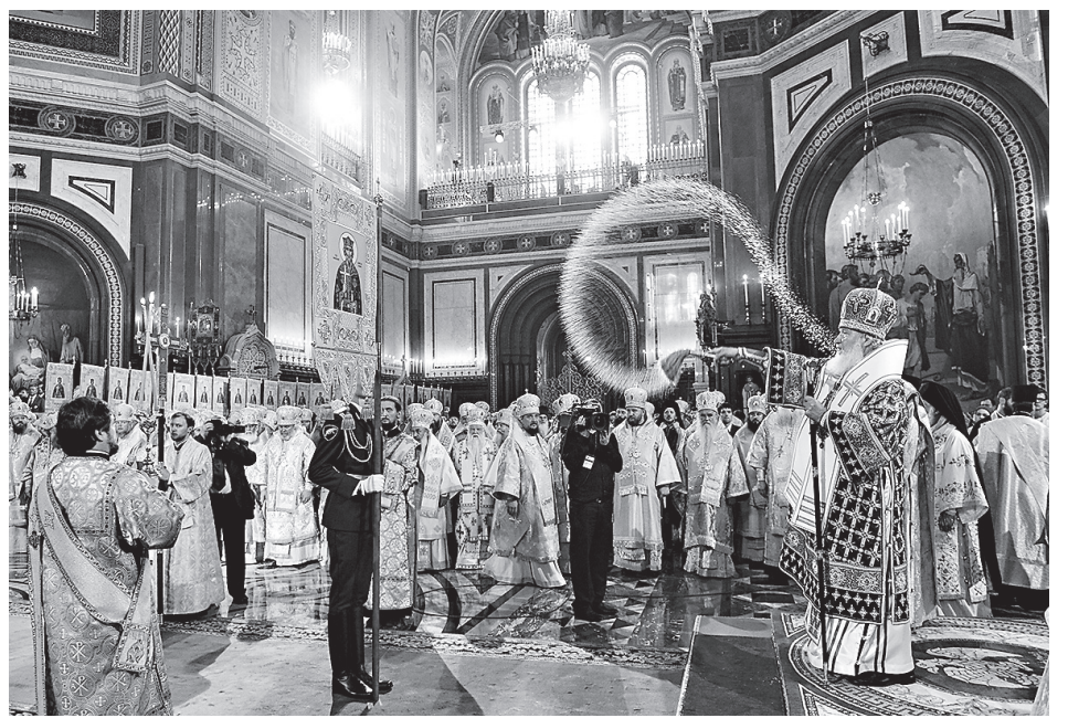
Освящение хоругвей в Храме Христа Спасителя

Затем Предстоятель освятил хоругви с изображением святого Владимира, которые будут переданы во все епархии Русской Православной Церкви. Надпись на хоругвях гласит: «Сия хоругвь сооружена по благословению Патриарха Московского и всея Руси Кирилла в шестое лето его Первосвятительского служения в память тысячелетия преставления святого равноапостольного князя Владимира и освящена Святейшим Патриархом в кафедральном соборном Храме Христа Спасителя в лето от Рождества Христова 2015».