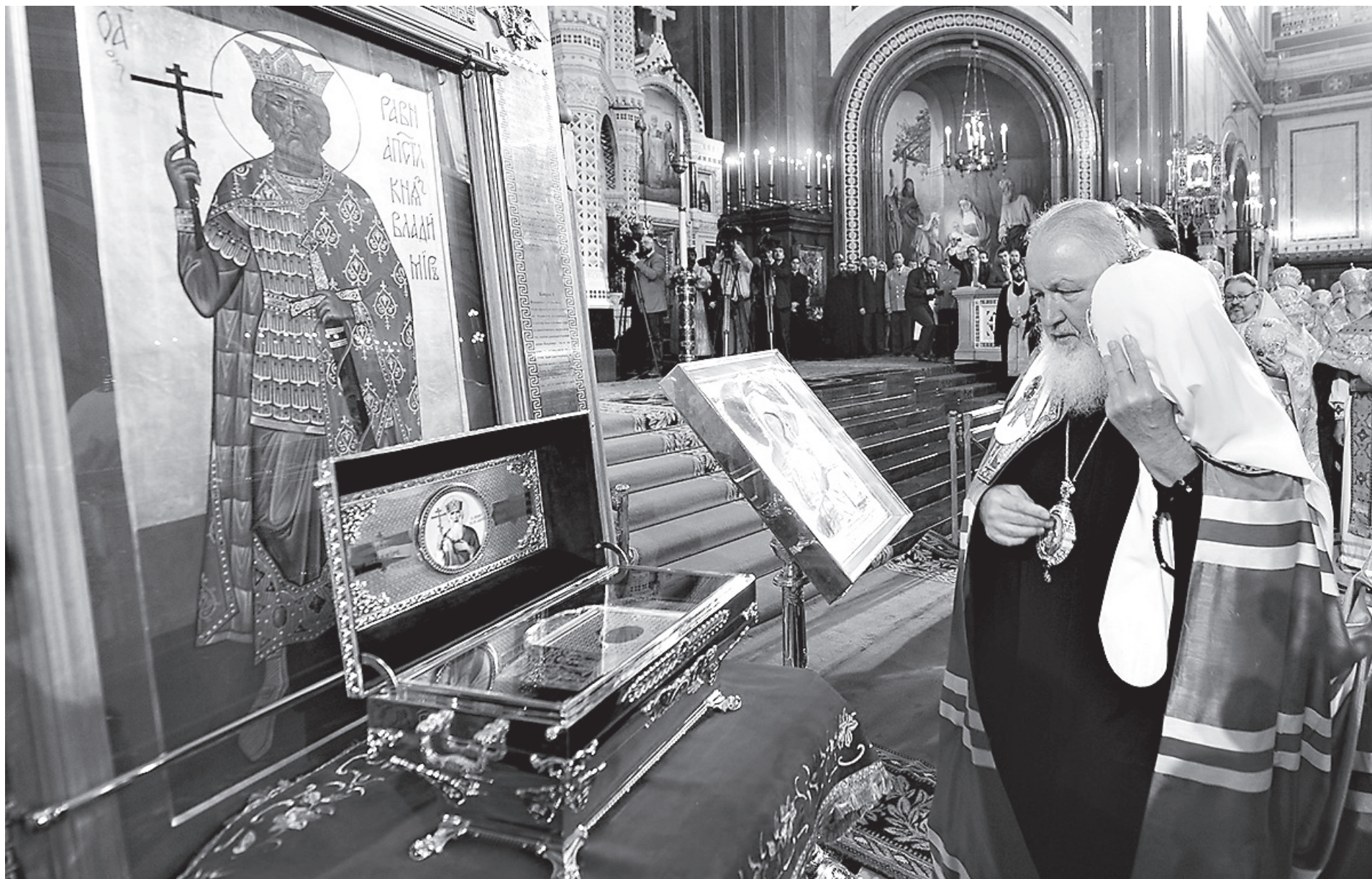
«...Радуйся, премудрый просветителю народа русского...»

В нынешнем году вся Церковь Русская, а вместе с ней и весь православный мир отмечают тысячелетие преставления святого равноапостольного Великого князя Владимира.