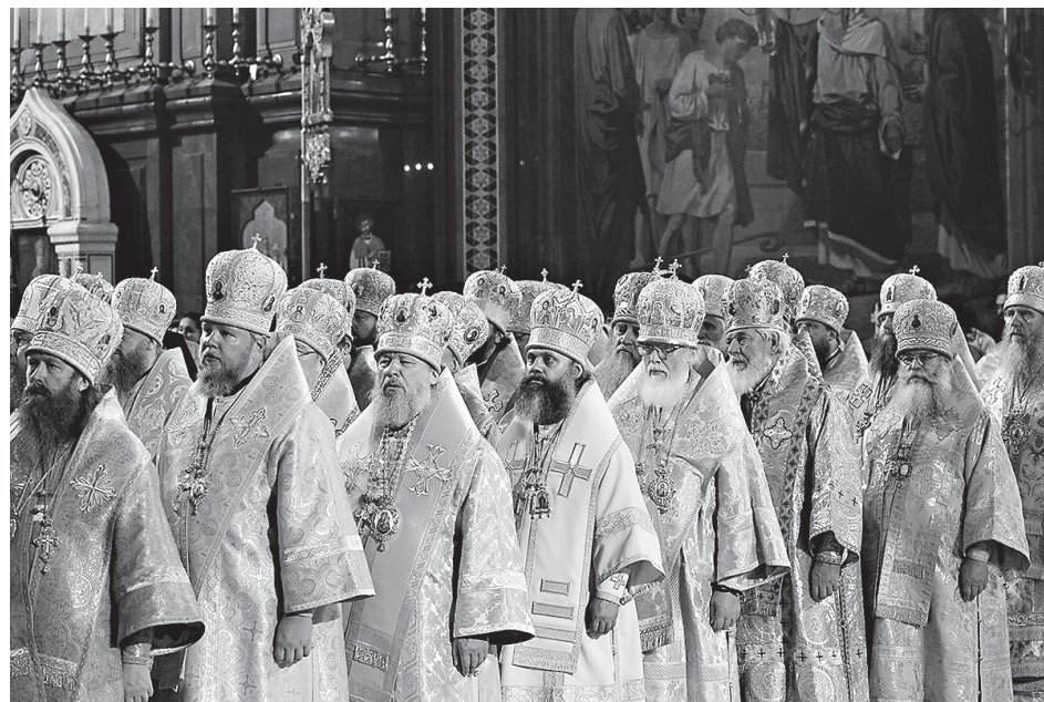
Божественная литургия в день памяти святого равноапостольного князя Владимира

Еще молимся Тебе, Спасителю нашему, чрез благоверного Великого князя Владимира благоволившему избрати род наш в наследие Свое и в купели Крещения даровати Духа Святого, о еже Церковь нашу Святую от расколов и нестроений соблести, в единомыслии веры ея утвердити, и миром оградити, рцем вси Господу, услыши и помилуй».