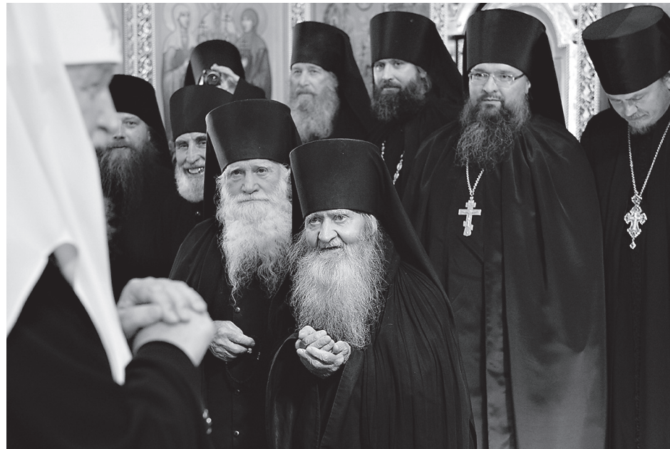
Встреча Первосвятителя с братией Саввино-Сторожевского монастыря

«Сегодня народ наш переживает особый период своего долгого исторического пути, - считает Его Святейшество. - Россия находится на подъеме, и, несмотря на тяжкие внешние обстоятельства, сила народная действует таким образом, что абсолютное большинство людей не очень-то и чувствует их на себе. Дай Бог, чтобы все это и было так. У Отечества нашего есть все необходимое, чтобы защитить своих людей, дать им возможность мирно и спокойно жить, иметь духовное и материальное благополучие».