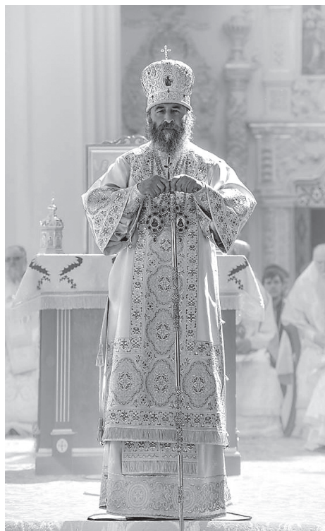
Блаженнейший митрополит Киевский и всея Украины Онуфрий