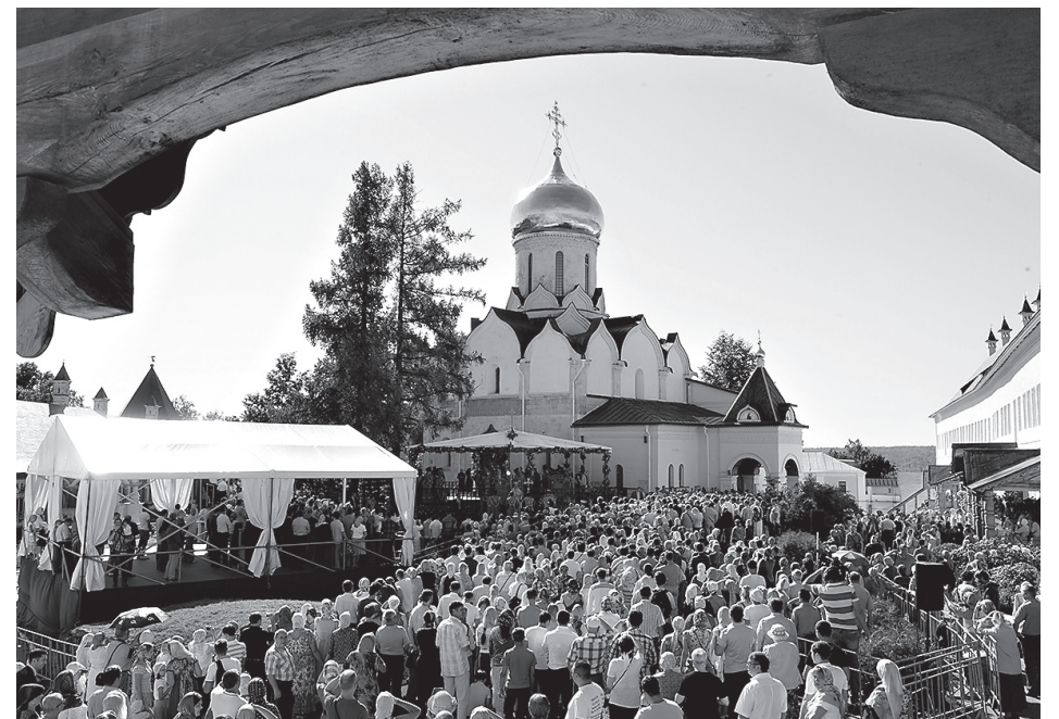
Божественная литургия в Саввино-Сторожевской обители

«Сказанное не означает, что Церковь призывает пренебрегать материальным фактором. Святой Иоанн Златоуст, отвечая на вопрос, как может спастись богатый, говорит: «Никогда не переступай черты необходимости». Вот то, что необходимо, ты и должен иметь. Но когда люди приобретают то, что им не нужно, приобретают ради приобретения, когда не знают, что выдумать, чтобы утешить свою плоть, требующую все больше и больше для своего удовлетворения, — вот тогда и наступает грех, - подчеркнул Предстоятель Русской Церкви. - Если человек зарабатывает на пропитание своей семьи, на то, чтобы обеспечить образование для детей, на все необходимое для жизни, то это неременное условие всякого труда. Человек трудится, в том числе, для созидания материальных благ. Но «никогда не переступай черты необходимости». Это особенно важно для молодых людей. У того же Златоуста есть замечательные слова: «Как огонь, прикасаясь к горючим веществам, возгорается в сильное пламя, так и юность, имеющая много денег, способна воспламенить пламя, сжигающее душу». Потому что у молодого человека меньше сдерживающих факторов и обстоятельств, ему еще многое хочется испытать, получить и то, и другое, и третье. А наша современная жизнь, с переизбытком рекламы, разжигает потребности, каких могло бы и не быть. Получив средства, человек теряет голову и возжигает пламя, способное, по слову Иоанна Златоуста, погубить душу».