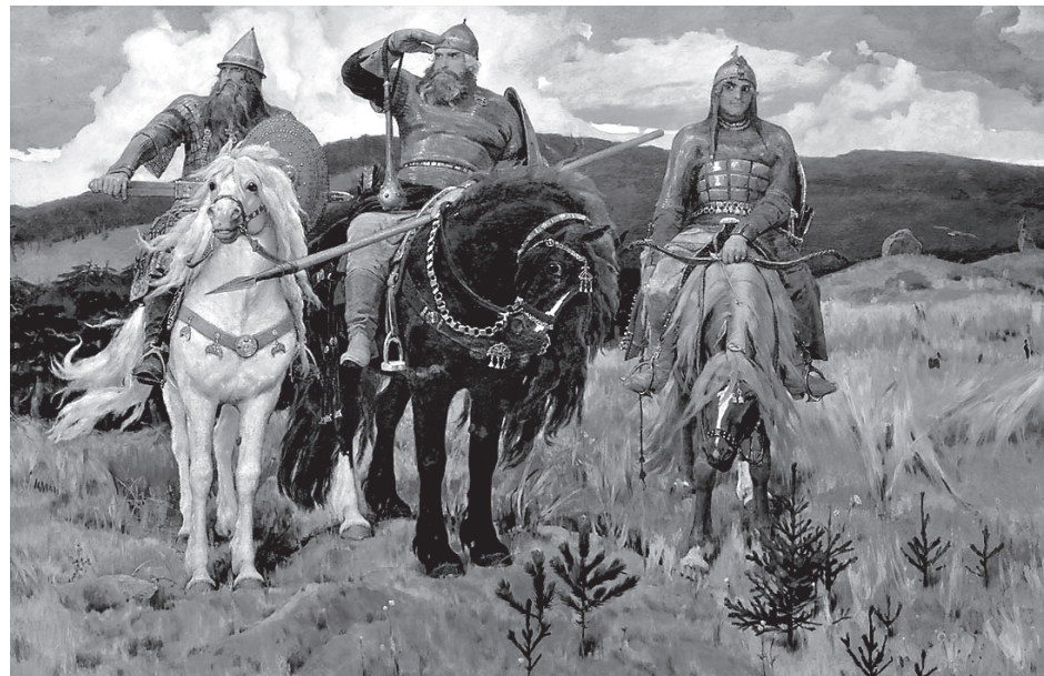
Богатыри. Художник В. М. Васнецов

Киев лихорадочно восстанавливал боеспособность частей и соединений, потерпевших поражение в августе-сентябре 2014 года. Справедливо полагая, что второй раз после лета 2014 года провернуть трюк с отпускниками России будет гораздо сложнее (США тоже готовились поймать за руку и предъявить всему миру «доказательства агрессии»), украинские власти (точнее, их американские кураторы – сами местные «интеллектуалы» до этого бы не додумались) торопились перейти в новое наступление, пока ополчение еще не обрело нормальную боеспособность.