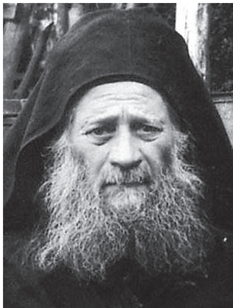
Старец Иосиф Исихаст

У каливы Старца я сидел и тянул четочку, а он мне рассказывал о молитве, об отцах, за которыми ухаживал, когда они состарились. И в этом месте, у его каливы, мир благоухал, как лилия и роза, хотя вокруг была одна сушь и ничего не росло, кроме низкого каменного дуба. Однажды я стал нюхать воздух, и Старец меня спросил: «Что это ты делаешь?» - «Старче, пахнет лилиями и розами». - «Вот балда! Подойди поближе, к двери». Я подошел к двери в келью Старца и вдохнул аромат. Я вошел: вся келья благоухала так, что даже моя борода и одежда стали источать аромат. Старец мне сказал: «Это от молитвы. Разве ты не понимаешь? Благоухание - это имя Христово». Должно быть, он много молился той ночью. От Иисусовой молитвы благо-