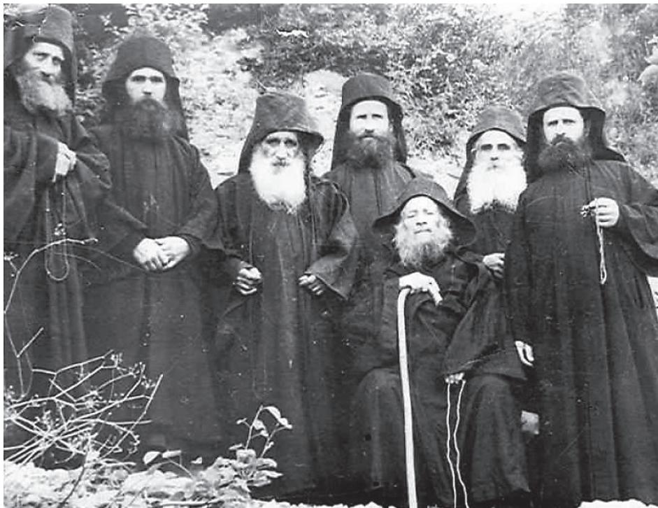
Братство Иосифа Исихаста

«Не считай себя человеком, если не получил благодати. И без благодати напрасно мы, люди, родились в мир».