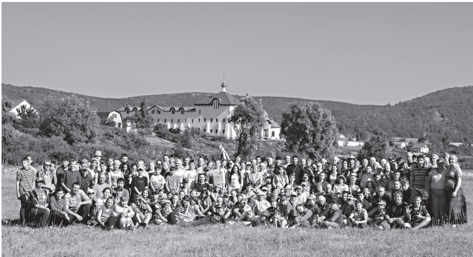
Паломники у стен Заволжского Свято-Ильинского женского монастыря в с. Подгоры

Во время одного из привалов – на Гавриловой поляне – иерей Вячеслав