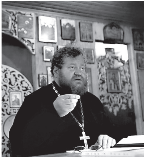
Протоиерей Олег Стеняев

Как известно, в человеческой истории существуют архетипы характеров. Современные политики сознательно или бессознательно пытаются воспроизводить тип Нимрода, походить на него. Речь идет о таких