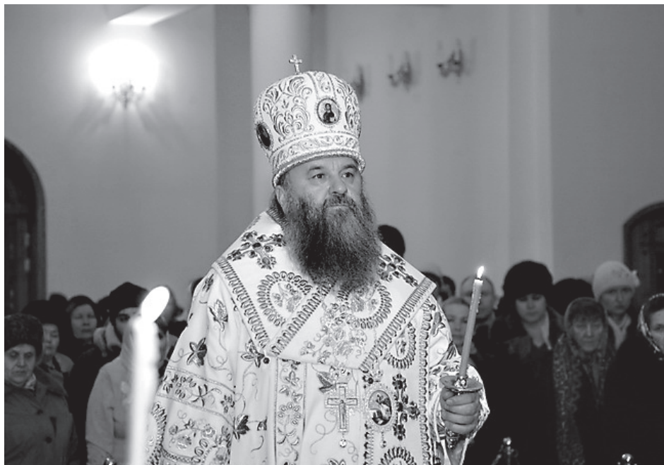
Митрополит Санкт-Петербургский и Ладужский Варсонофий

- Владыка, как необходимо вести работу по привлечению в