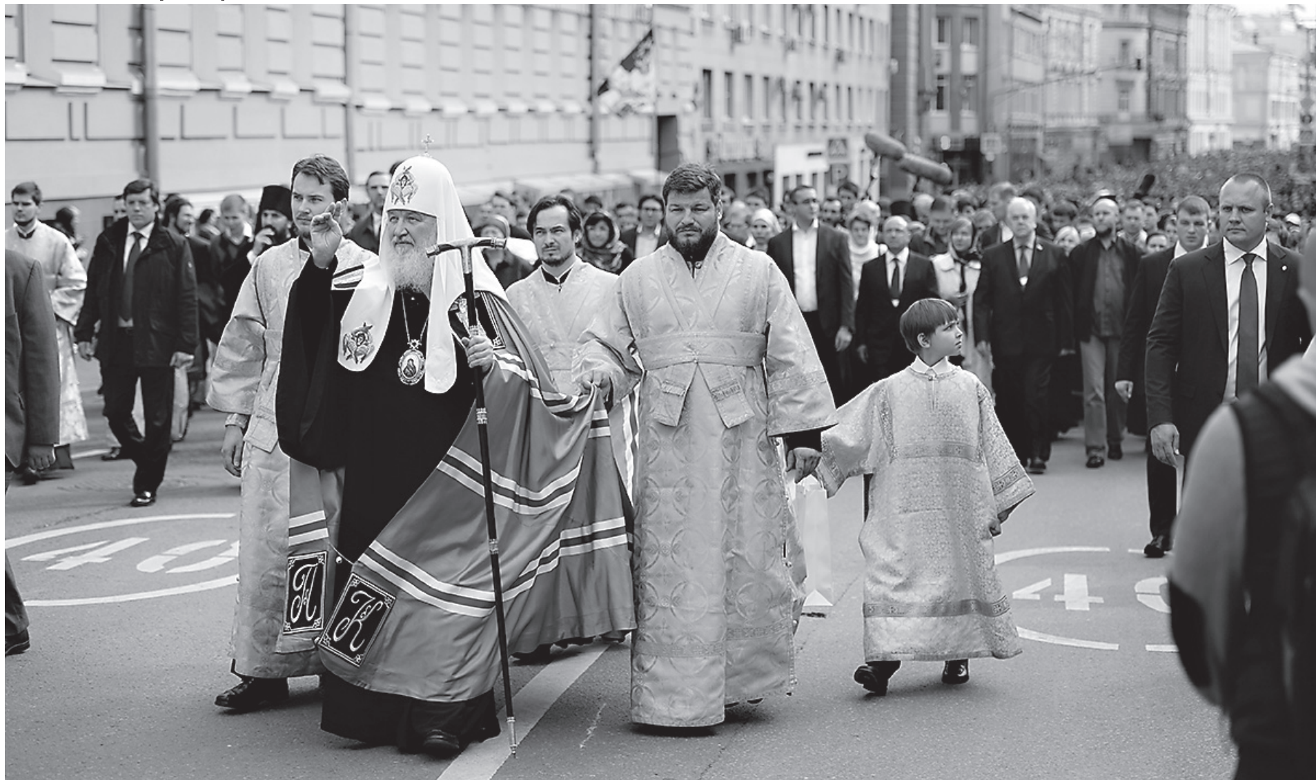
«Яко с нами Бог»

6 сентября после Божественной литургии в Патриаршем Успенском соборе Московского Кремля Святейший Патриарх Московский и всея Руси Кирилл возглавил крестный ход из Кремля к Высоко-Петровскому ставропигиальному монастырю. Торжественное шествие было посвящено 700-летию начала служения в Москве святителя Петра и 700-летию основания Высоко-Петровской обители.