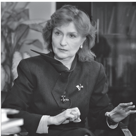
Наталья Алексеевна Нарочницкая

- Спокойно и уверенно продолжать быть русскими. К сожалению, интеллектуальная и образованная часть наших граждан в значительной мере всегда была настроена нигилистически. Можно процитировать Петра Струве,