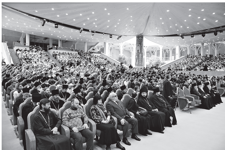
В зале заседаний

как приоритетную для нашей социальной работы.