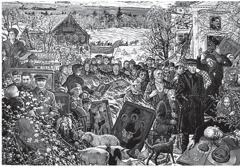
Картина Ильи Глазунова «Раскулачивание»

Этот, на первый взгляд, ветхий старичок, некогда староста сельской церкви, был обучен грамоте, читал и по-церковнославянски, имел хороший, зычный баритон и знал наизусть все церковные службы. Пока храм не закрыли богоборцы, он пел на клиросе вместе со своим сыном - отцом Ромки Поликарпом - известным на всю окру-