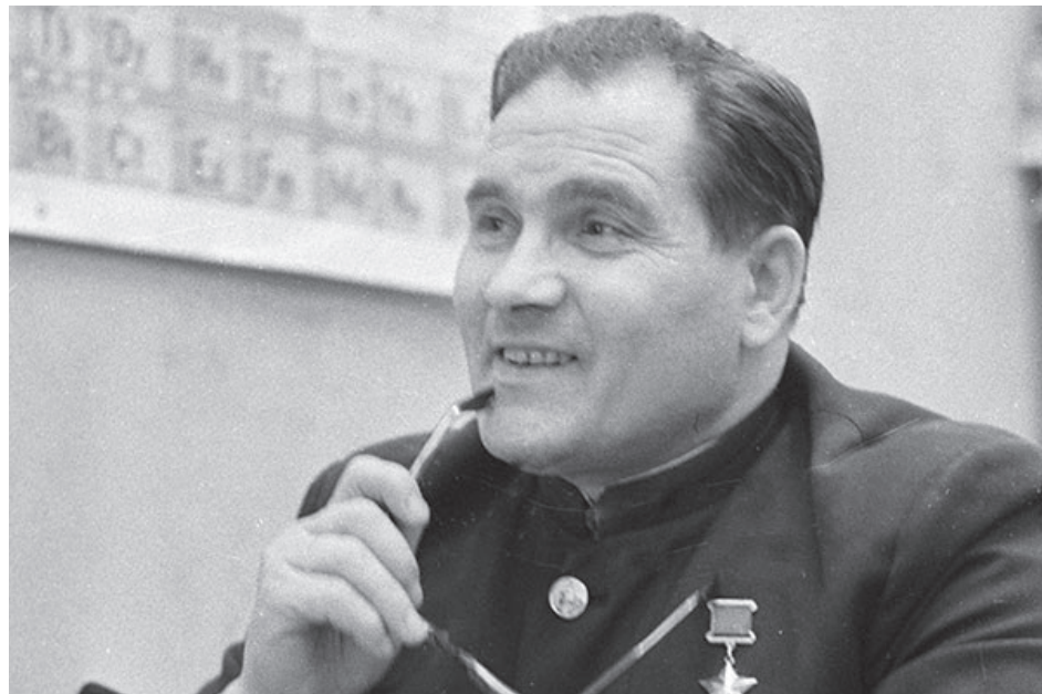
Летчик Михаил Девятаев

Неудивительно, что заключенные боялись такого исхода значительно больше, чем «гуманного» расстрела. За