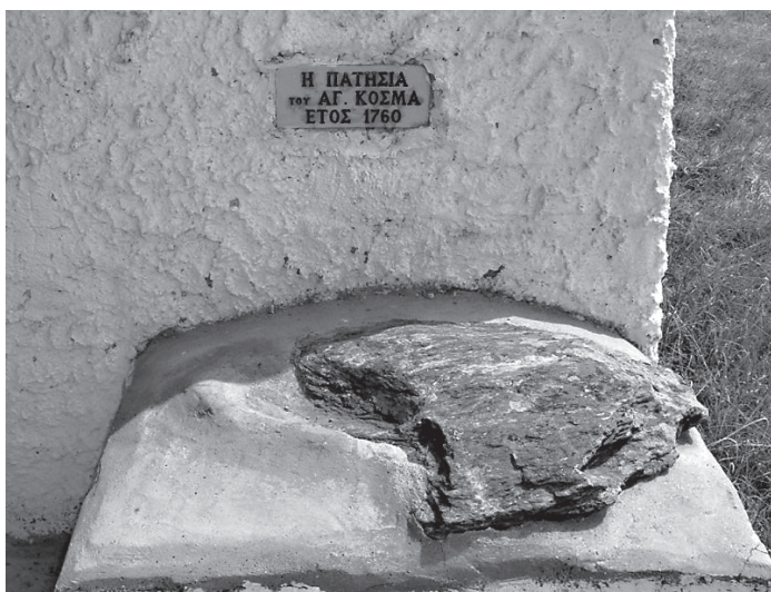
Камень, на котором стоял Косма Этолийский во время своей проповеди

Невиновных буду вынуждены разделить скорби и беды с виновными. Когда от Бога будут ниспосланы нака-