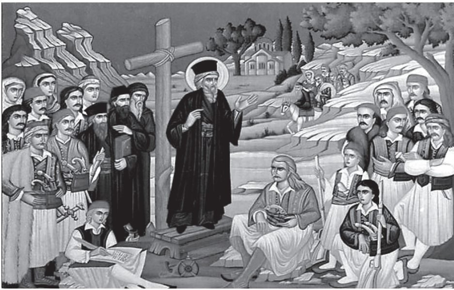
Проповедь святого Космы

Пророчества были и остаются руководством к действию – или для всех людей, или для жителей того или иного населенного пункта, где он проповедовал.