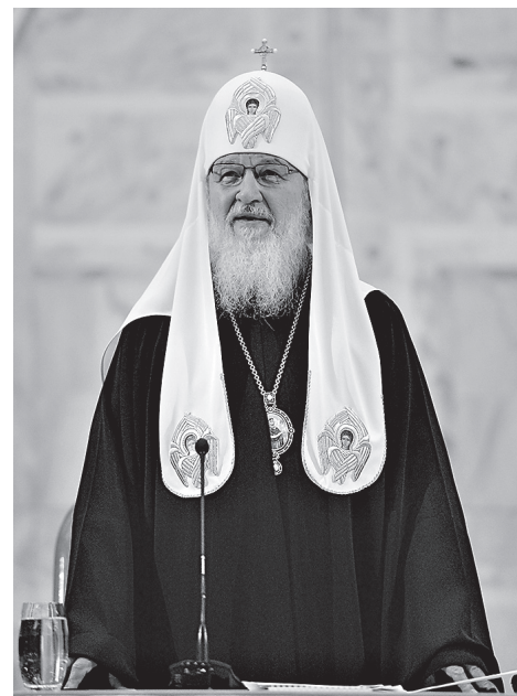
Патриарх Московский и всея Руси Кирилл

Теперь я хотел бы сказать несколько слов о том, какие я вижу направления социальной работы и какие, с моей точки зрения, приоритеты мы должны для себя определить. Думаю, самая главная тема — это помощь семье. Так, Церковь ведет широкую антиабортную кампанию. Мы выступаем за то, чтобы принципиально,