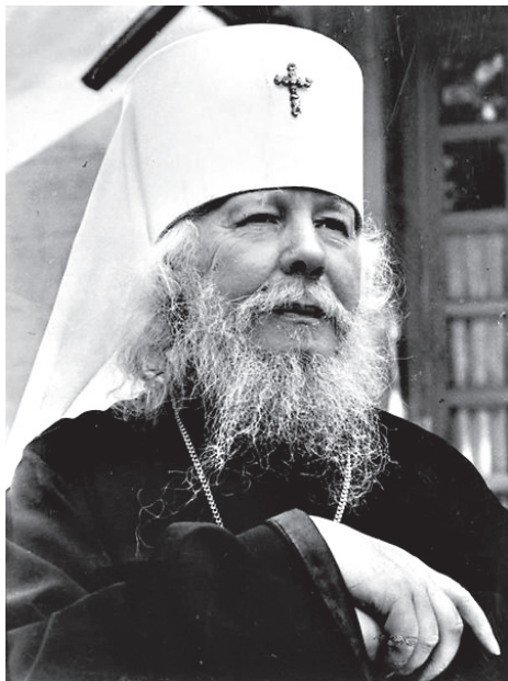
Митрополит Иоанн (Снычев)

М ногие знают митрополита Иоанна (Снычева) как патриота, поборника великой сильной России. Его голос звучал как тревожный набат, поднимающий народ на великую брань с врагами Отечества. Брань не плоти, но духа. Гораздо менее известна его деятельность на поприще миссионерства. Когда мудрое и очистительное слово владыки Иоанна пробуждало нацию от духовного сна, вновь и вновь напоминало всем: Русь - подножие Престола Господня, народ русский - хранитель чистоты православной веры. Сегодня мы хотим рассмотреть основные направления миссионерской деятельности владыки Иоанна в Куйбышевской епархии в период атеистической политики советского государства.