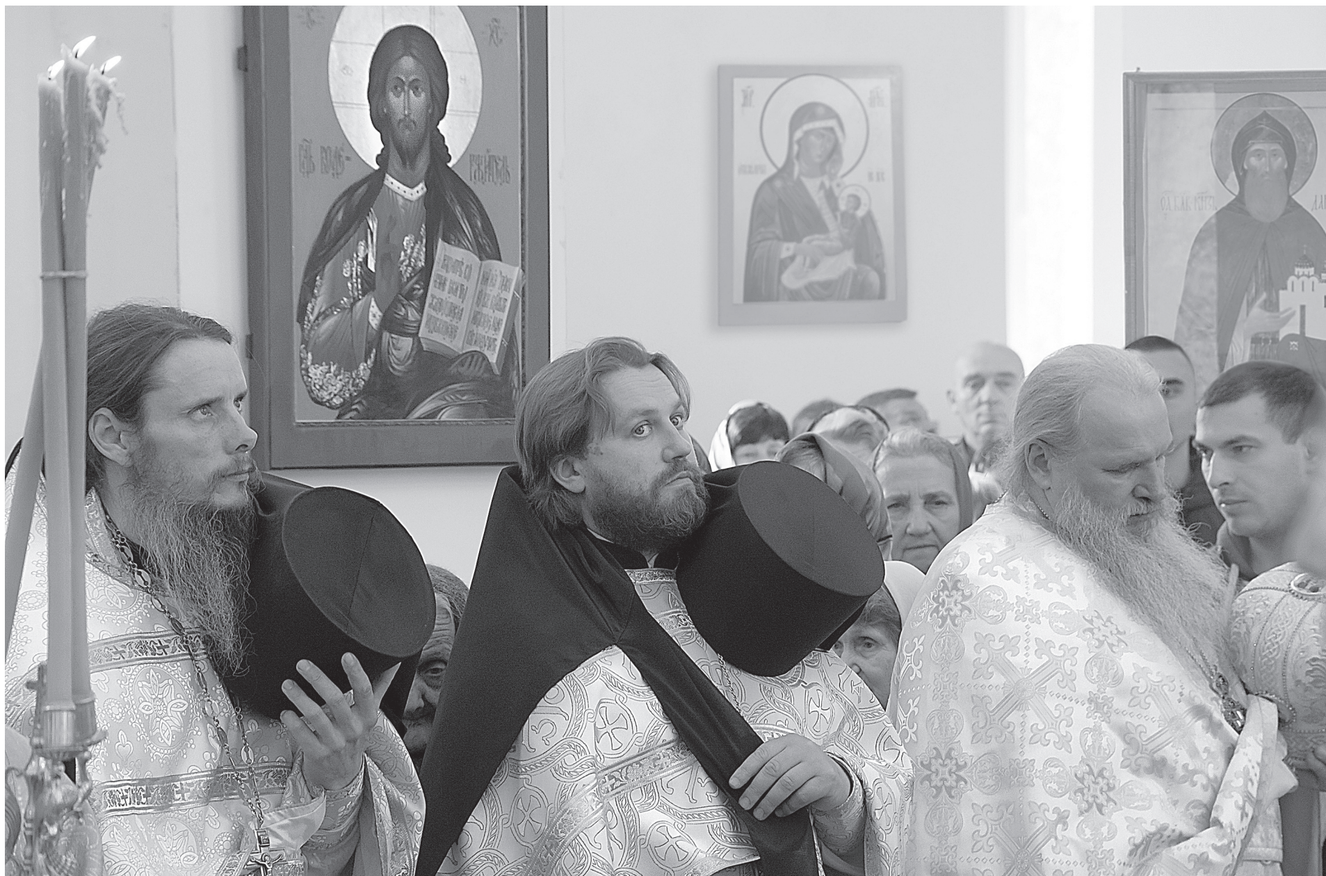
«Первопрестольницы Российстии... молитесь мир вселенной даровати и душам нашим велию милость!»

Н а сегодняшний день выпало замечательное чтение из Второго послания к Коринфянам (2 Кор. 3,12-18). Апостол Павел, как бы укоряя, говорит, что иудеи читают слова Моисея, покрыв голову. Но дело не в том, что голова была покрыта, — таков был древний обычай, и даже в храмы, в молитвенные помещения люди всегда входили с покрытыми головами. Речь о том, что у древних было закрыто видение богооткровенных слов пророка Моисея, и, обращаясь к христианам Коринфа, апостол Павел говорит, что Господь есть Дух — не истукан, не идол, а Дух. А затем он делает из этого утверждения парадоксальный вывод: где Дух, там свобода, а где свобода, там способность предстать пред Богом и воспринимать в духе свободы все, чему Он нас учит.