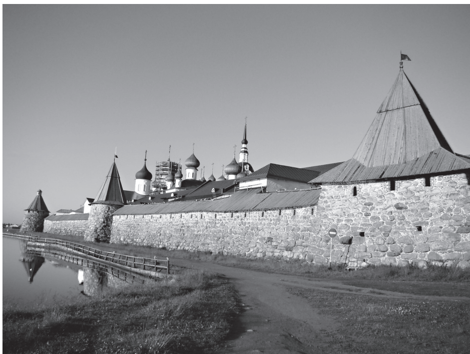
Стены и башни монастыря

С западного крутого склона горы мы спускаемся по лестнице в 294 ступени вниз, и даже у меня, повидавшей всякое в горах Памира и Кавказа, захватывает дух. За мной шумно спускается группа школьников с шутками и толкотней.