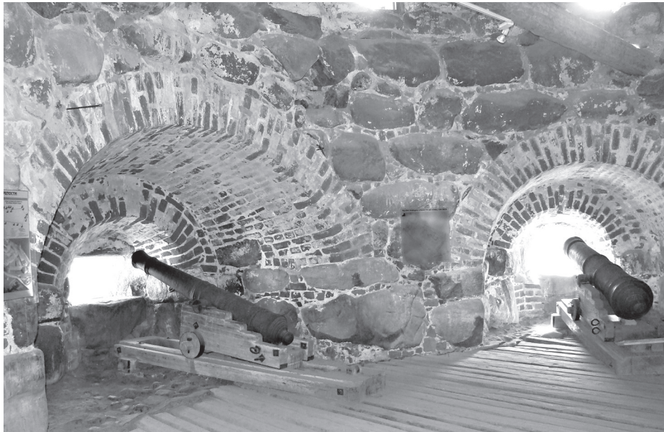
Пушки в амбразурах пушечных бойниц. Пряничная башня