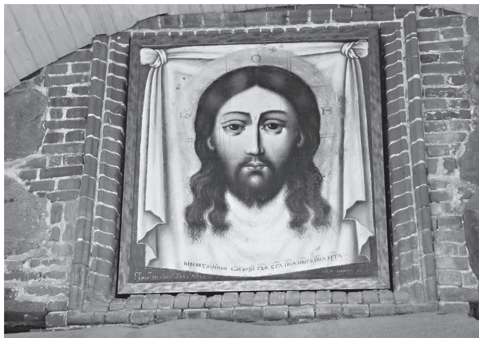
Образ Спаса на убрусе над Святыми вратами

Утреннее солнце осветило залив. Море, к счастью, спокойное. В 7 часов утра подошли два монастырских катера, наш – в честь свт. Филиппа, с иконой на мачте. На палубу вышли поморы – капитан и его помощник: невысокого роста, коренастые, с длинными до плеч седыми волосами и продубленной на соленом морском ветру кожей. Люди