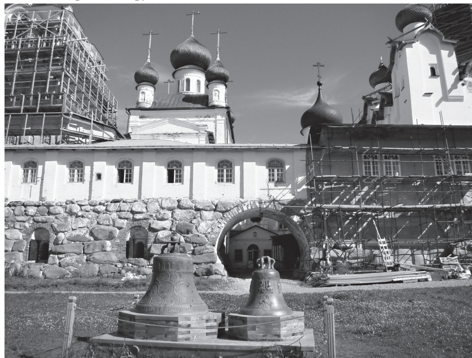
Монастырские колокола. За ними видна церковь Свт. Николая Чудотворца

В начале XX в. монастырь имел 19 храмов, 30 часовен, 6 скитов, 3 пустыни, мастерские, училище для детей и трудников, ГЭС, метеостанцию, Ботанический сад; дамбу длиной 1,5 км и соединившую остров Большая Муксалма с Соловецким; озерно-канальную систе-