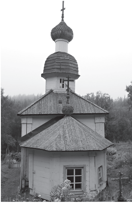
Анзер. Деревянная церковь Воскресения Христова