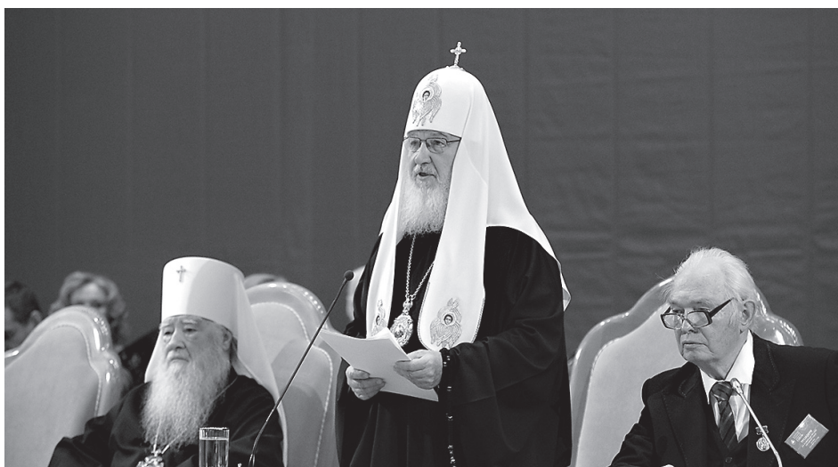
Государству необходимо помнить об ответе перед Богом

Однако цивилизация, культурно-исторический тип — это явление социального, культурного, но не сакрального характера. И хотя каждая цивилизация призвана предлагать свои открытия и достижения для всех людей, для всего мира, она не может быть поставлена на