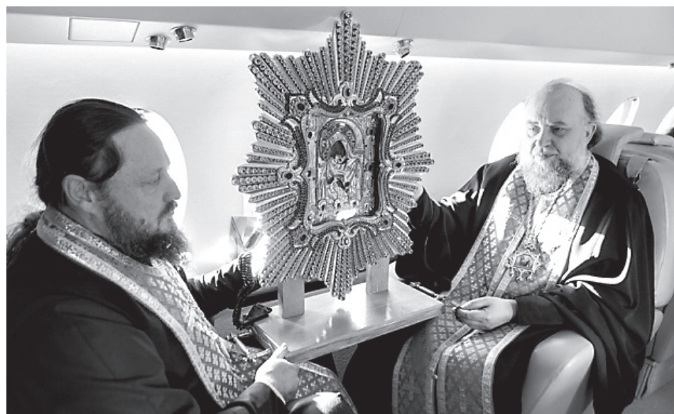
Крестный ход в небе над Украиной

не забываем разбираться с «сепаратистами» и «террористами».