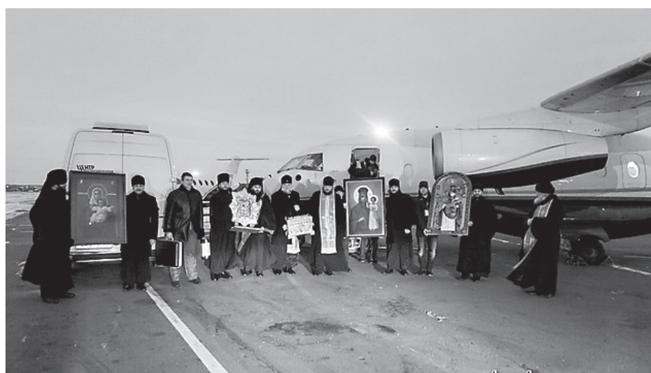
Перед началом крестного полета над Украиной

Вашингтон и Киев рассчитывали, что это пройдет. Однако против такой тенденциозной трактовки Соглашений прямо и открыто выступил наш президент. В том числе на сессии Генеральной Ассамблеи ООН. Там Владимир Владимирович еще раз дал понять, что Москва выступает приверженцем политической реформы на Украине. Но все изменения в Конституцию, в закон о проведении местных выборов «в отдельных районах Донецкой