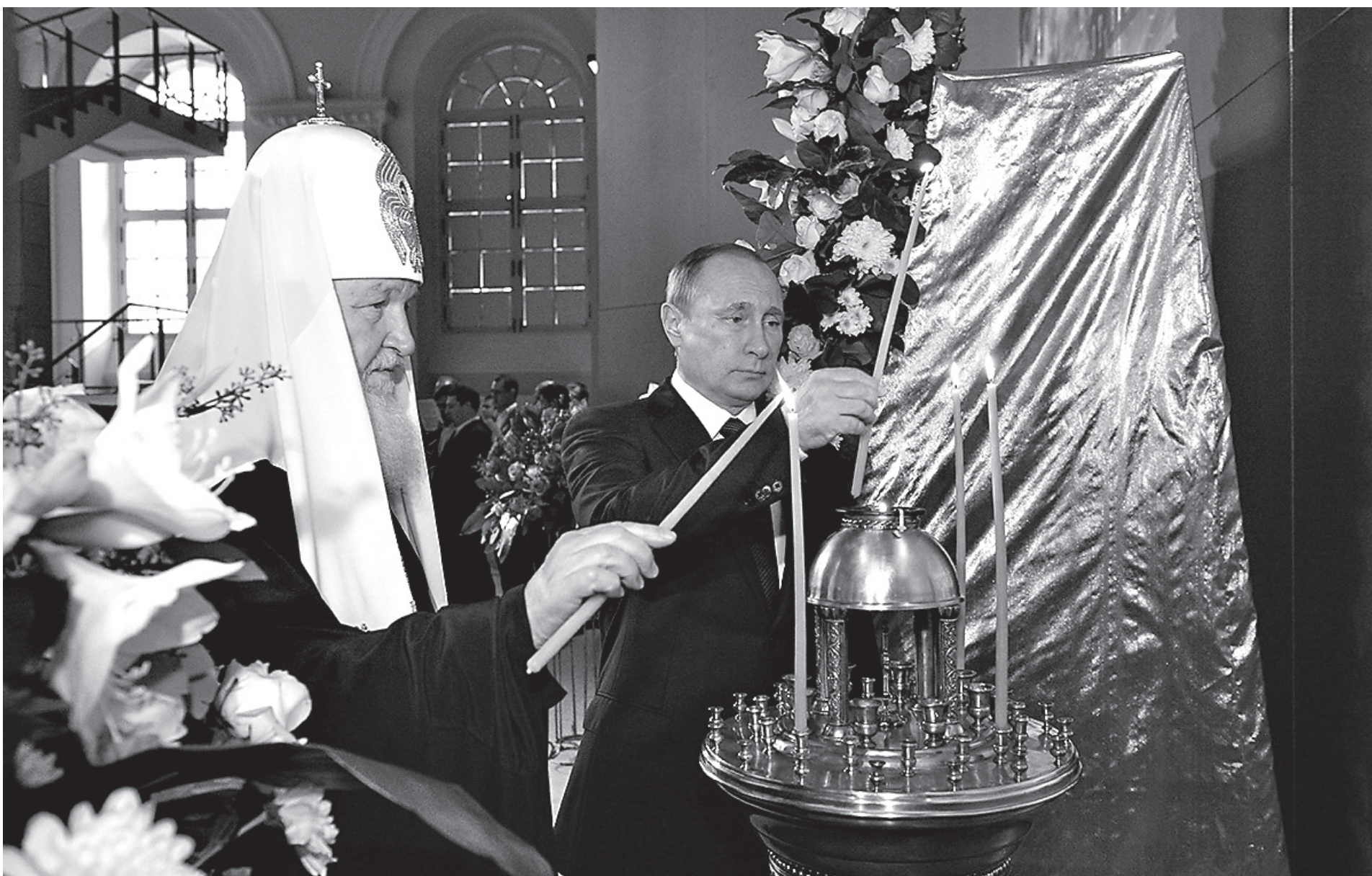
В праздник единства

С уществуют различные чисто светские способы сохранять и укреплять единство. В первую очередь, это законодательство, которое формирует общее юридическое пространство. Кроме того, это воспитание в определенных категориях, включающих в себя идею патриотизма. В-третьих, это сложная система обеспечения безопасности государства внутри и вовне.