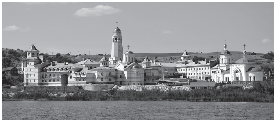
Свято-Богородичный Казанский мужской монастырь

Спасо-Преображенский девичий монастырь появился в конце XVI - начале XVII в.в. Таким образом, можно сказать, что вскоре после образования