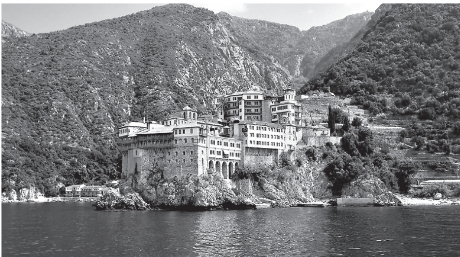
Святая Гора Афон

Диаконалиссы как особое женское церковное служение появились около IV века по Рождестве Христовом (хотя о диаконалиссе Фиве упоминается в Послании апостола Павла к римлянам, историки считают, что в то время чин поставления в диаконалиссы еще не сложился). В последующей византийской традиции диаконалиссами могли стать незамужние женщины старше 50 лет: вдовы, девы, а также монахини. Порядок чинов рукоположения диаконалиссы и диакона почти не различался (но молитвы поставления, конечно, были разными) — диакону в конце поставления вручали Чашу, и он шел причащать верующих, а диаконалисса ставила Чашу обратно на св. престол. Этим выражалось то, что диаконалисса не имела богослужебных обязанностей (единственная известная самостоятельная роль диаконалиссы в