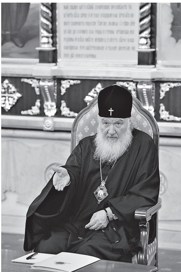
Патриарх Московский и всея Руси Кирилл

В далекие 1970-е годы, когда советские люди редко выезжали за границу, я по долгу службы был в Сан-Франциско. И вот я ехал в маленьком грузовичке с русским монахом, священником. Он был из аристократического рода графов Урусовых, но принял монашество и жил, как подобает монаху, в бедности,