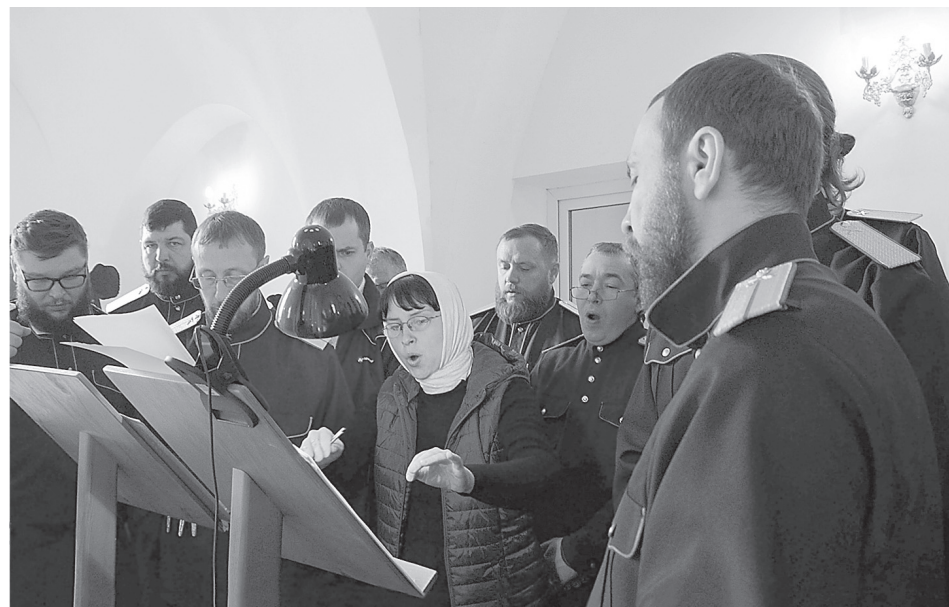
Архирейская служба в Троице-Сергиевом храме, г. Самара, октябрь 2015 г

что Русь - страна минора. Понимаешь, его будет петь вся Волга и через 100, и через 200 лет», - сказал батюшка. Это были самые мучительные несколько дней в моей жизни, когда я думал, что ничего больше написать не смогу. Давил груз ответственности. А когда писал, пришло осознание: ты не сам пишешь, это Господь дает. Вначале ничего не получалось. Но вдруг как-то полилось, и я начал записывать. В результате казачьими песнями у меня исписана целая тетрадь.