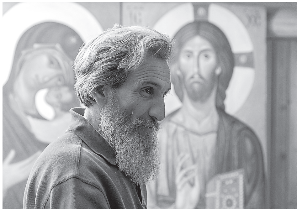
Известный сербский иконописец Владимир Кидишевич

А митрополит Амфилохий (митрополит Черногорский и Приморский Амфилохий (Радович) – архиепископ Сербской Православной Церкви, один из крупнейших христианских мыслителей нашего времени. Родился 7 января 1938 г. в селе