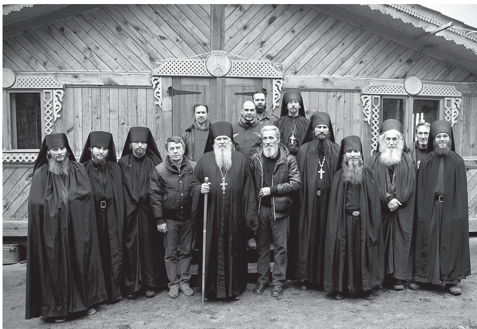
С братией Заволжского монастыря в честь Честного и Животворящего Креста Господня

В архитектуре все должно быть природным: камень, кирпич, краски. Сегодня считают, что это плохо, что надо заменить раствор извести гипсокартоном, дерево на окнах пластиком. А люди почему-то принимают все это, думая, что так лучше. Я