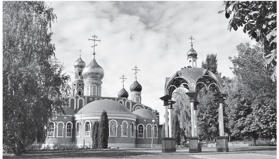
Свято-Воскресенский мужской монастырь

Сегодня монастырский комплекс, кроме древней Казанской церкви, включает в себя 2 новых храма: один освящен в честь Преподобного Сергия, а другой в честь Пресвятой Троицы. Также построены просторные братские корпуса и странноприимный дом (гостиница для паломников), 47-метровая колокольня в виде маяка. В монастыре собрана богатая библиотека, а в день престольного праздника (21 июля 2013 года) был открыт и небольшой музей истории села и обители. В монастыре, стоящем на самом берегу Волги, была укреплена береговая полоса, и