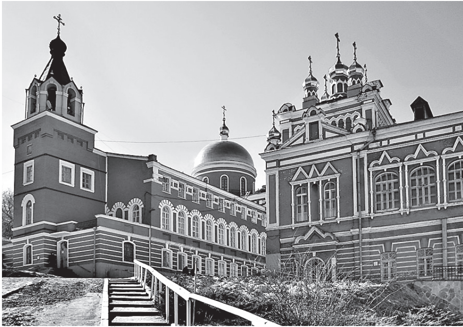
Самарский Иверский женский монастырь