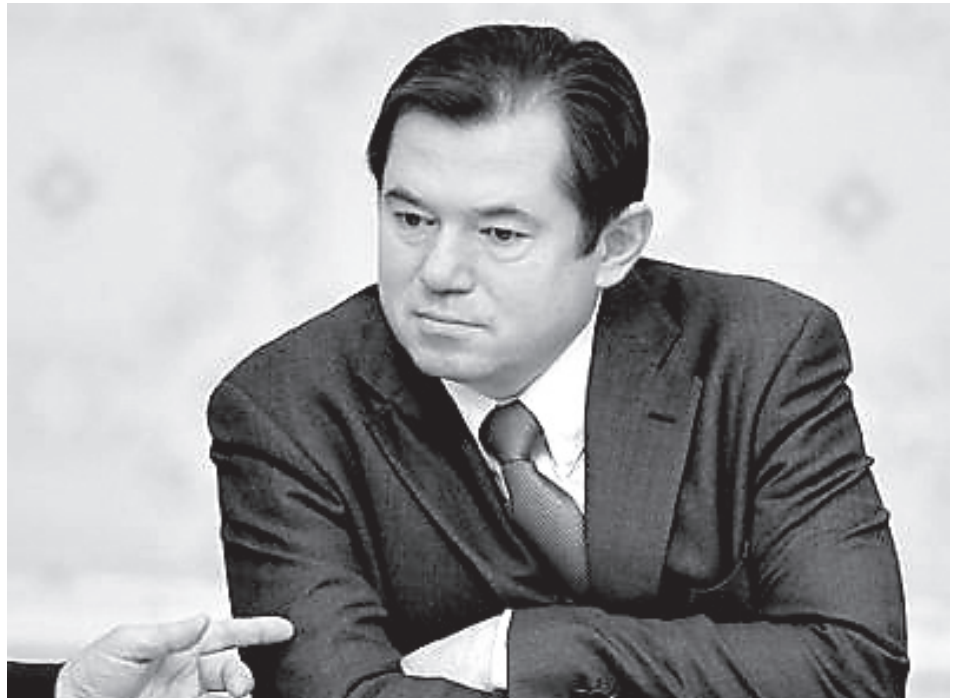
Сергей Юрьевич Глазев

Поэтому нынешняя украинская власть не имеет ничего общего с национальными интересами Украины и ничего не может принести, кроме катастрофы гуманитарной, экономической и, к сожалению, скорее всего, вскоре и технологической. Последнее следует из того, как американская компания «Вестингауз» пытается использовать украинские АЭС для сбыта своего ядерного топлива с риском повторения Чернобыля теперь уже на Южной Украине, где уже десятки аварий произошли с американскими ТВЭЛ. Эта катастрофа, которая развивается на наших глазах, и она будет глуб-