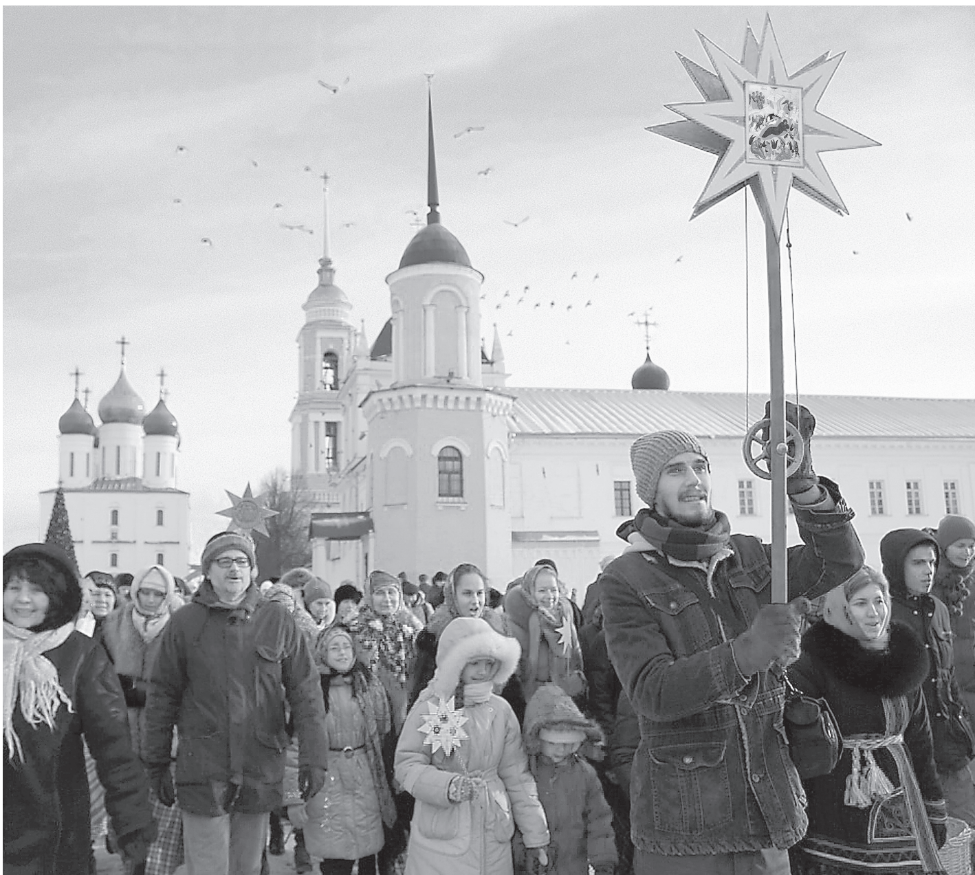
«Рождество Твое, Христе Боже наш...»

Из Рождественского послания Патриарха Московского и всея Руси Кирилла архипастырям, пастырям, диаконам, монашествующим и всем верным чадам Русской Православной Церкви