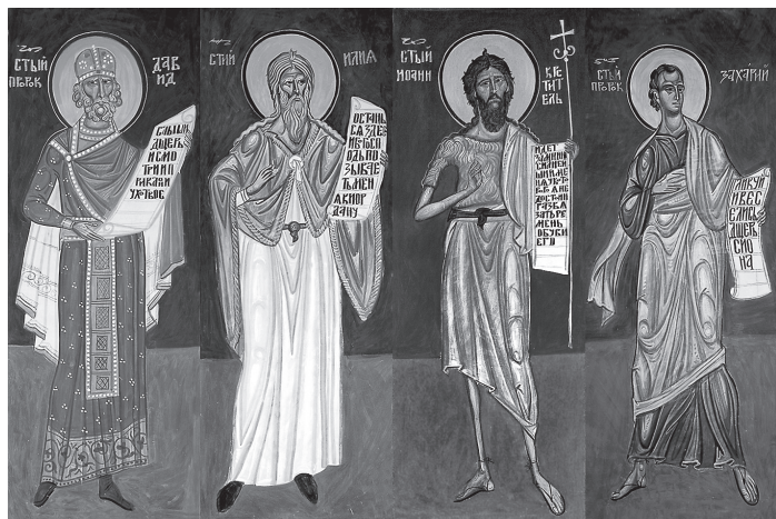
Фрески, выполненные Владимиром Кидишевичем

Беседовал архимандрит Георгий (Шестун), настоятель Заволжского мужского монастыря в честь Честного и Животворящего Креста Господня, председатель редакционного совета «Православной народной газеты»