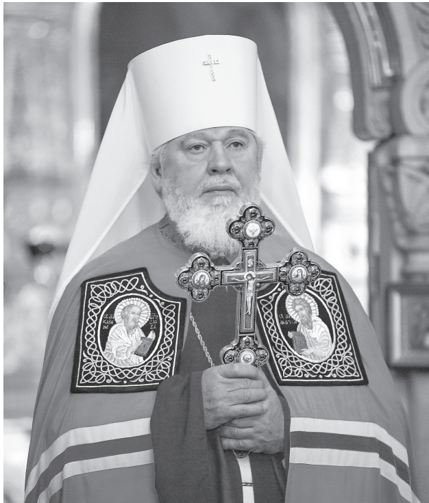
Митрополит Самарский и Сызранский Сергей

РОЖДЕСТВЕНСКОЕ ПОСЛАНИЕ ВЫСОКОПРЕОСВЯЩЕННЕЙШЕГО СЕРГИЯ, МИТРОПОЛИТА САМАРСКОГО И СЫЗРАНСКОГО, БОГОЛЮБИВЫМ ПАСТЫРЯМ, МОНАШЕСТВУЮЩИМ, МИРЯНАМ И ВСЕЙ БОГОЛЮБИВОЙ ПАСТВЕ САМАРСКОЙ И СЫЗРАНСКОЙ ЕПАРХИИ РУССКОЙ ПРАВОСЛАВНОЙ ЦЕРКВИ