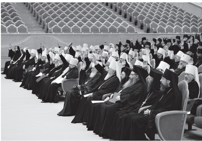
Идет Архиерейский собор, 2016 г.

Необходимо также отметить, что вступление Русской Православной Церкви в данную межхристианскую организацию стало возможным лишь после принятия ею в 1950 году «Торонтской декларации», которая по сей день остается одним из ее основополагающих документов. Декларация подчеркивает, что «Всемирный совет церквей не является и никогда не должен стать сверх-Церковью», его цель — лишь «способствовать изучению и обсуждению вопросов единства Церкви». Как особо оговорено, «членство во Всемирном Совете не подразумевает, что каждая Церковь