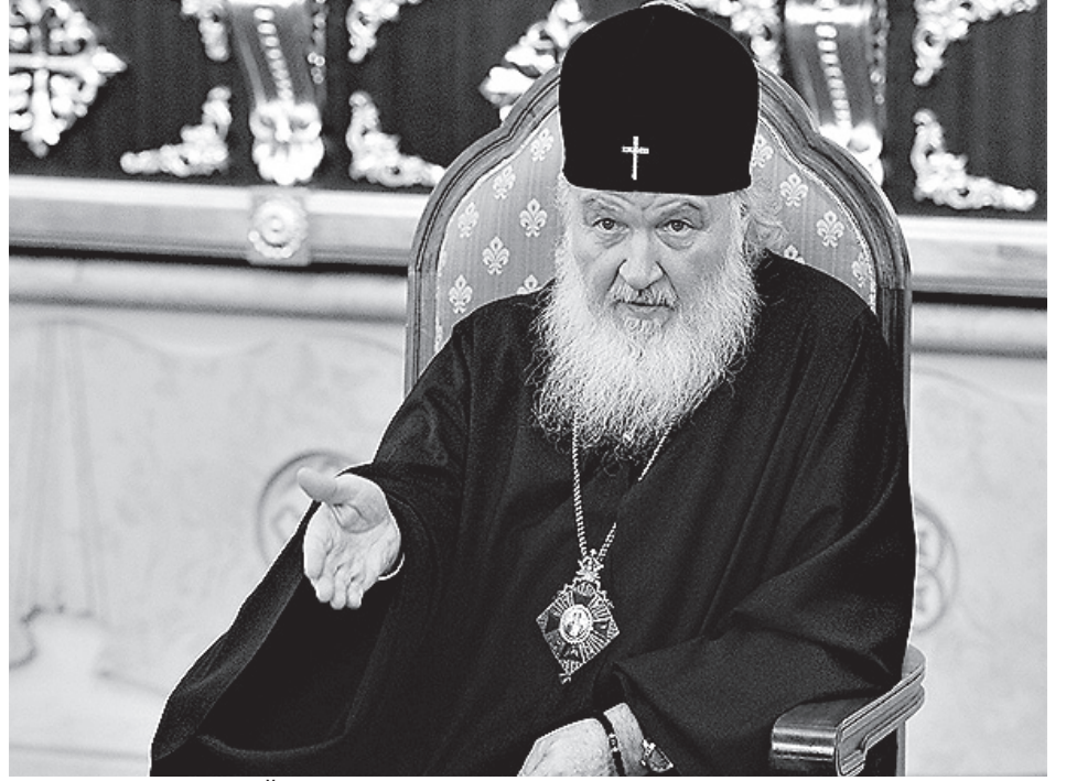
Патриарх Московский и всея Руси Кирилл

Странники секуляризма говорят о безрелигиозном обществе. Но тогда что такое «законы природы», которые можно и нужно «открывать», «естественные» права, наконец, что такое линейная модель истории, на которую они опираются, если не часть религиозного мифа? В неавраамических культурах модель времени циклич-