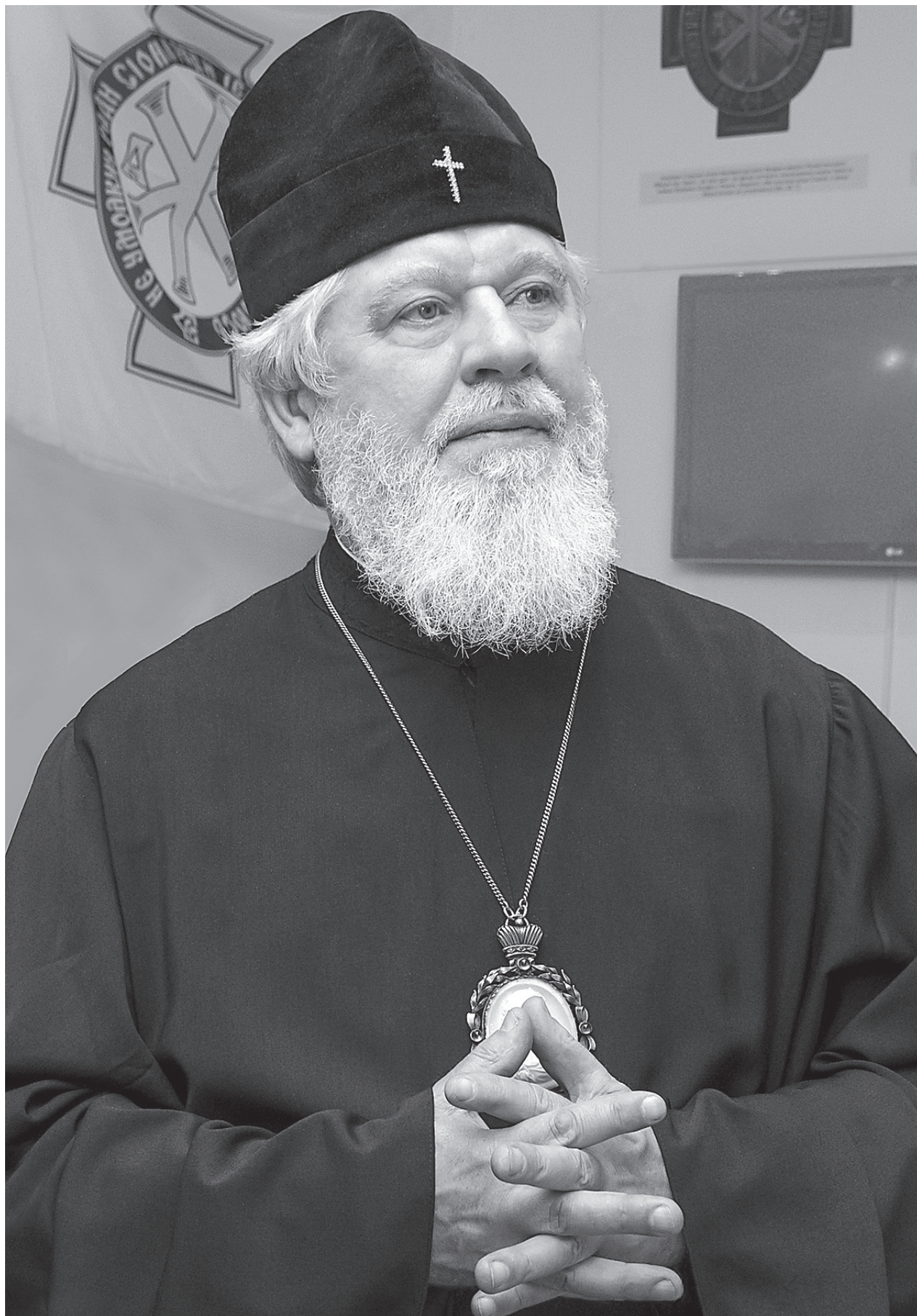
Митрополит Самарский и Сызранский Сергей