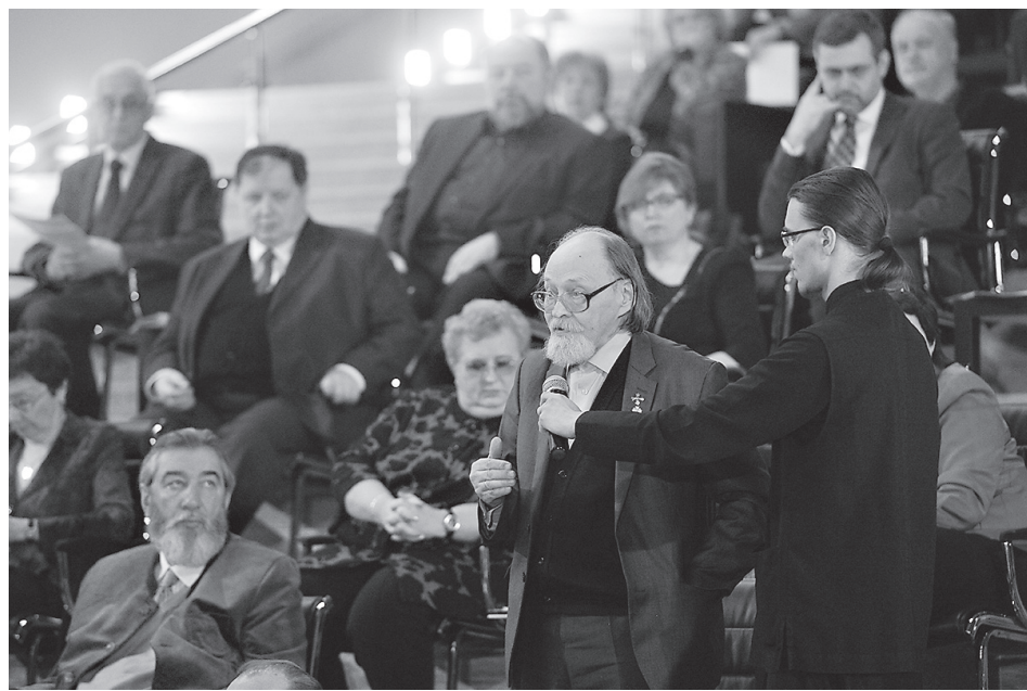
Всеволод Юрьевич Троицкий на заседании Общества русской словесности

Истинный националист — враг всякого шовинизма и нацизма. «Национализм, — свидетельствует И. А. Ильин, — есть любовь к историческому облику