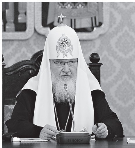
Патриарх Московский и всея Руси Кирилл

С другой стороны, традиция — это действительно не все прошлое, и мне часто приходится об этом говорить. Мы ведь выкидываем мусор из дома, мы же не сохраняем все, что остается от прошло-