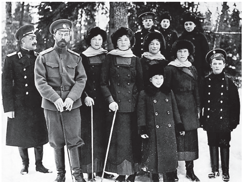
Царская семья в Екатеринбурге

Анна, устроившись в своей инвалидной коляске, молча глядела на Государя с любовью и состраданьем.