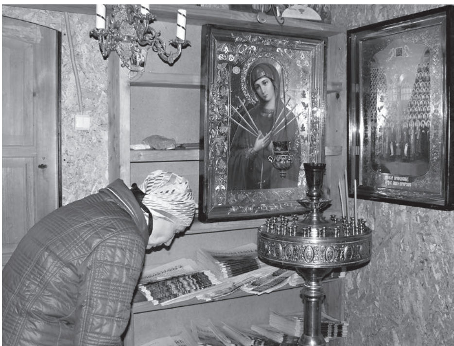
Раба Божия Надежда молится у иконы Киевских святых и Божией Матери «Семистрельная»

В Самаре в первую очередь пошли в храм Всех Святых. Это лучшие ощущения из тех, что мы испытали за последнее время. Люди приветили нас, дали