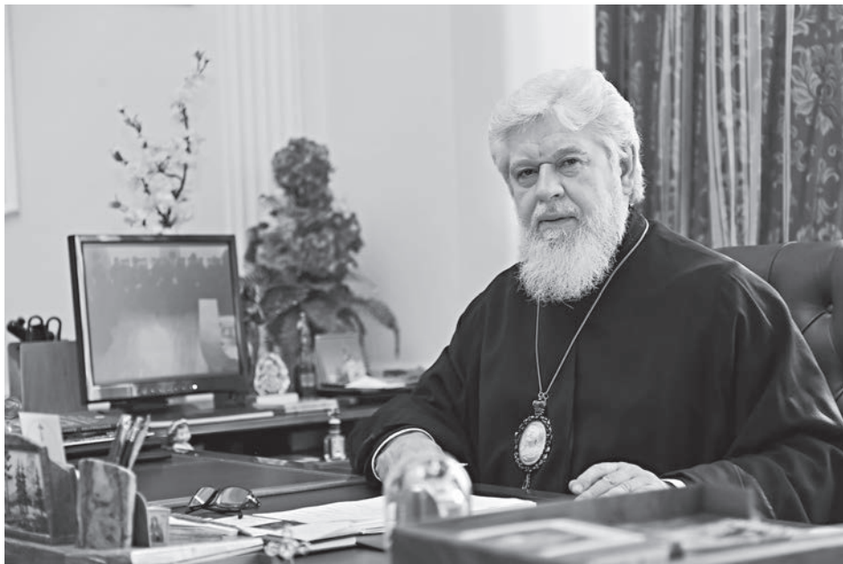
Самарский архипастырь в рабочем кабинете