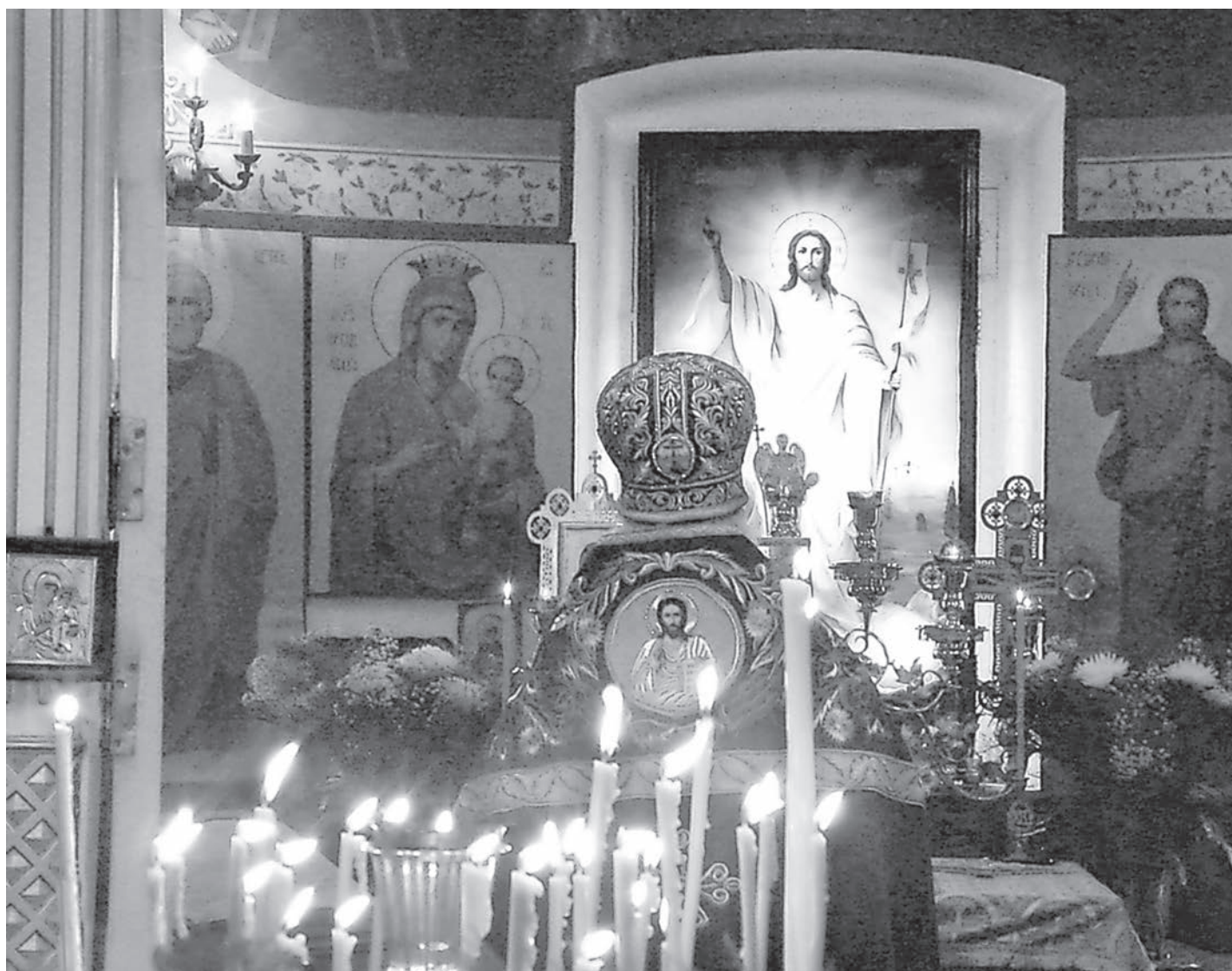
«Воскресение Твое, Христе Спасе, Ангели поют на небесах...»

ПРЕОСВЯЩЕННЫЕ АРХИПАСТЫРИ, ВСЕЧЕСТНЫЕ ПРЕСВИТЕРЫ И ДИАКОНЫ, БОГОЛЮБИВЫЕ ИНОКИ И ИНОКИНИ, ДОРОГИЕ БРАТЬЯ И СЕСТРЫ!