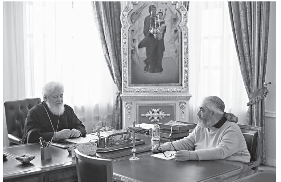
Во время беседы

- Во-первых, каждый человек все-таки избирает профессию по внутреннему расположению, чтобы она приносила ему радость, утешение. Главное, понять, что ты владеешь этим знанием, чтобы проявить себя, не ранить душу, помочь семье, жить и трудиться обществу на благо. К сожалению, такая высокая мотивация сегодня часто отсутствует, мы становимся эгоистами и потребу-