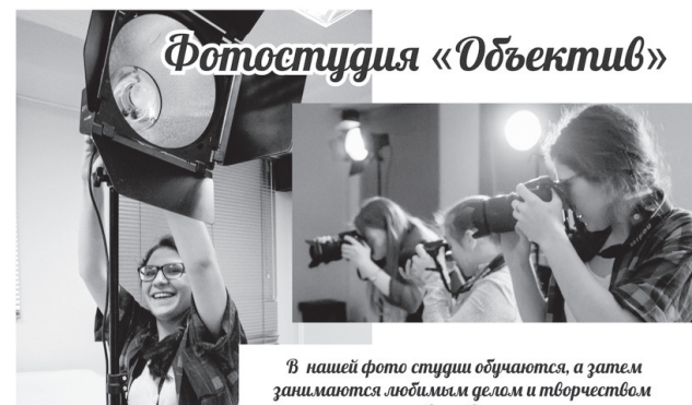
В нашей фото студии обучаются, а затем занимаются любимым делом и творчеством с 12 до 18 лет.

Детский епархиальный образовательный центр