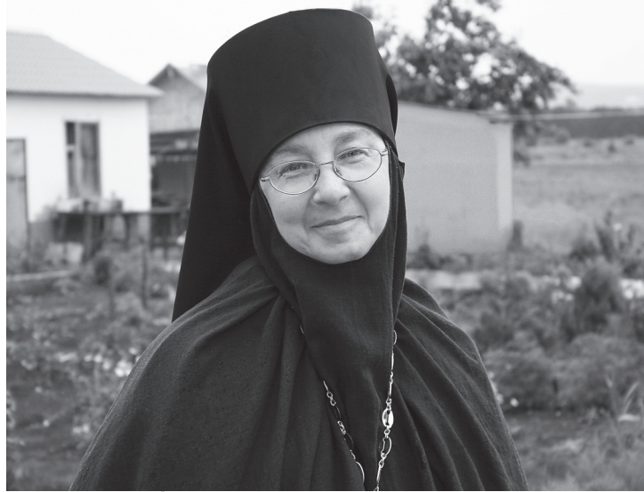
«Я рада, что люблю вас всех...»