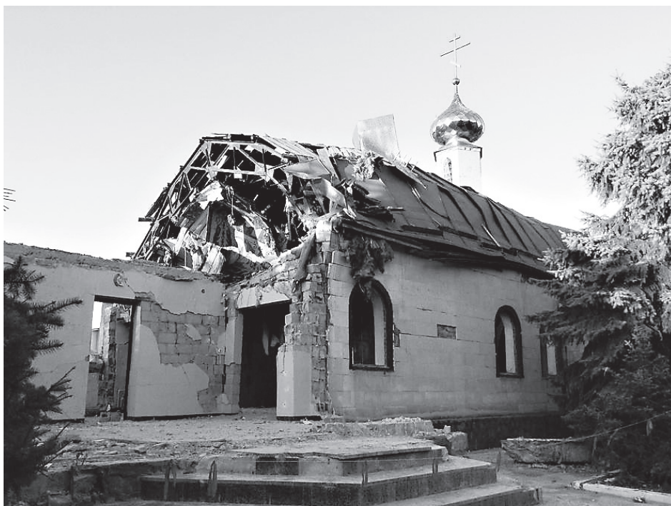
Многострадальная Донецкая земля

В акте третьем процесс идет вяло, и его решено извне подхлестнуть. Количество перебежчиков остается малым – авторитет митрополита Онуфрия перевешивает. Пропаганда киевскими официальными лицами нового раскола вызывает кислую отрыжку. На сцену выходят коллативы самостоятельности – участники националистических формирований, изображающих на сей раз евангельских праведников и ревностных прихожан. Депутаты Рады принимают закон о «самоопределении» (читай: о переделе церковных объектов). Повсеместно организуются собрания, на которых клирики и миряне сталкиваются с напльвом невесть откуда прибывших людей, агрессивно продавливающих присоединение к УПЦ(О). При попытках захвата церковных зданий происходят столкновения, льется кровь. В Киево-Печерскую и Почаевскую Лавры вводятся подразделения Нацгвардии, официально для избежания беспорядков и насилия, в действительности для подготовки передачи лаврских комплексов раскольникам. Это пока еще не