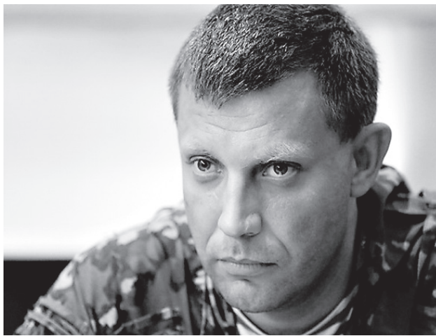
Глава ДНР Александр Владимирович Захарченко

Война, по словам Захарченко, не сломила жителей Донбасса. И он не сомневается, что их упорство приведет Донбасс к победе. «На каждые 10 тысяч тонн добытого угля приходится одна шахтерская жизнь. Менталитет, сложившийся у жителей Донбасса, отличается от менталитета жителей многих других регионов Украины. Мы смотрим на вещи через призму смерти. Если мы идем к поставленной цели,