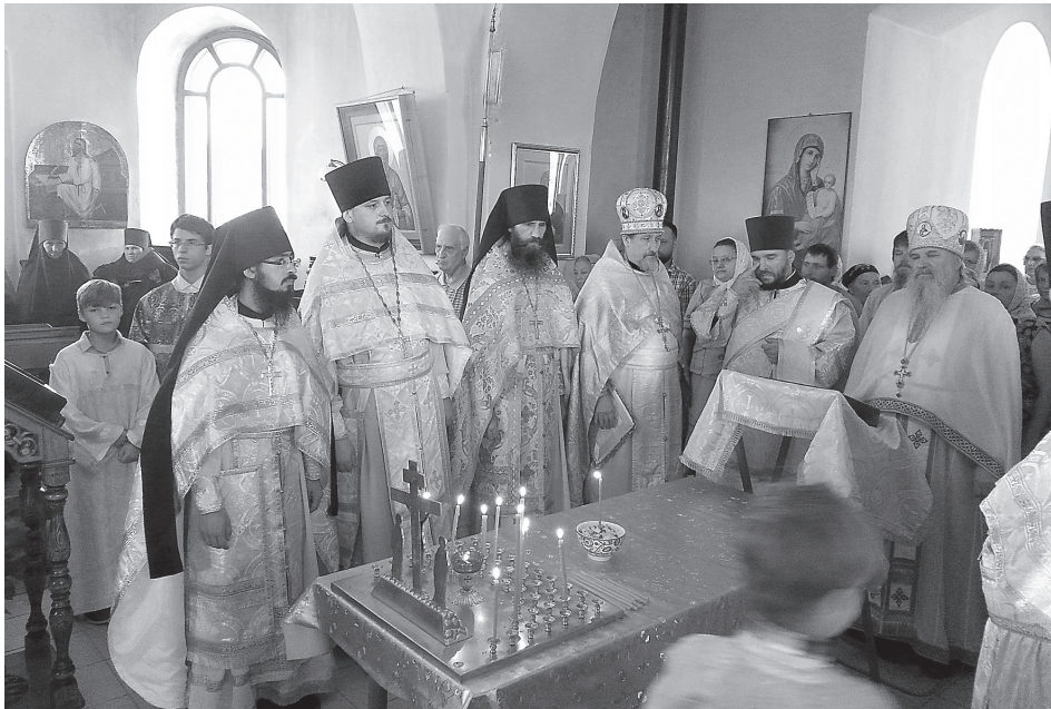
«Со святыми упокой...»