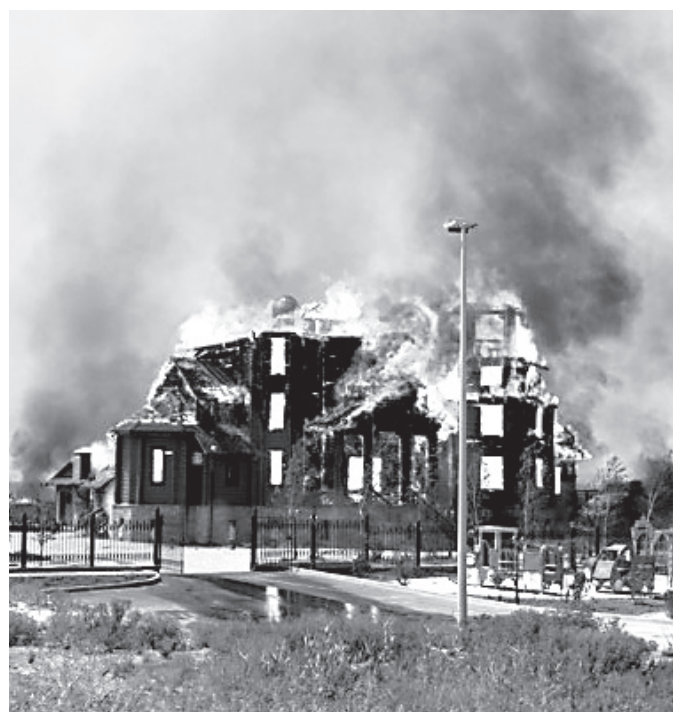
Благовещенский храм в Горловке

В шестом, заключительном акте Украинская Церковь обретает своих новых мучеников. Обвинения в неблагонадежности подталкивают официальные власти к уголовным преследованиям и судебным процессам. Иерархия находящейся вне закона УПЦ МП изолирована, заключена под домашний арест. Сотрудники СБУ применением силы желают добиться того, чего