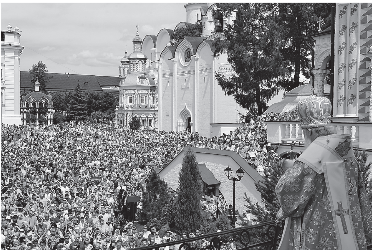
В обители Преподобного Сергия

Главная заслуга Преподобного Сергия перед русской землей в том, что он поверил в саму возможность Руси стать святой, переступить через мирскую вражду и подчиненность иноверцам и увидеть Божественное призвание русского народа — стать полноправным преемником византийской христиан-