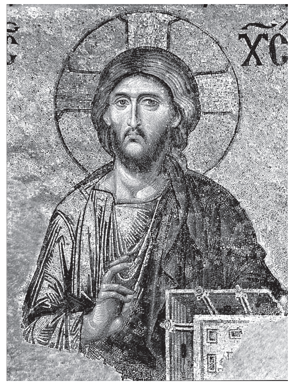
Господь Вседержитель. Мозаика храма св. Софии Константинопольской

- Особенно в последние три года я потерял чувство Бога, не чувствую Христа. Раньше я чувствовал Его. Как Он внезапно явился мне, так внезапно Господь решил бросить меня. Почему? Чтобы научить Его любить, не позволяя мне почувствовать Его присутствие, любить Его с верой, просто верить. Хотя я подвизаюсь, но не чувствую многие вещи, с высохшей душой, которая похожа на пустыню, на Сахару, которая находится здесь, где я живу, на Святой Горе Афон. Я подвизаюсь, но не имею ни одной слезинки, молось и чувствую, что Господь не дает того, что давал мне, но Он Бог, я не могу поставить Бога в свои рамки. Если захочет и когда захочет, Он придет. Спустя время снова вернется этот дар Божий, но я вел ту же борьбу - Господь знает, что чувствует каждый человек.