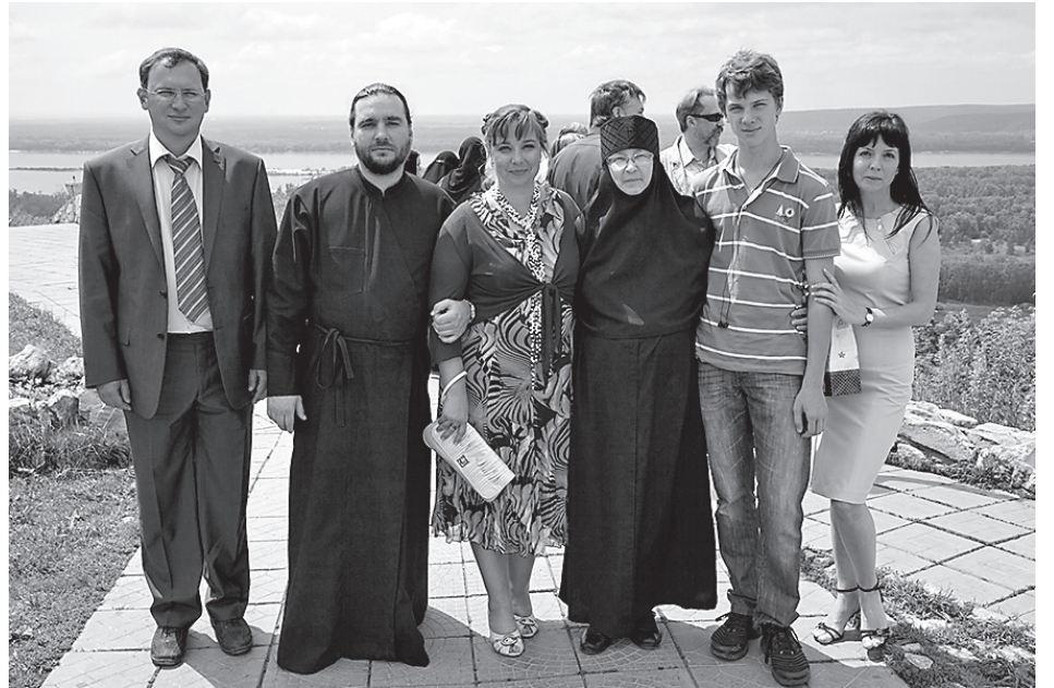
В семейном кругу, 2011 год

Почему важна семейная иерархия? На чем зиждется послушание? Что могут сделать для своих взрослых детей, ушедших из Церкви, православные родители?