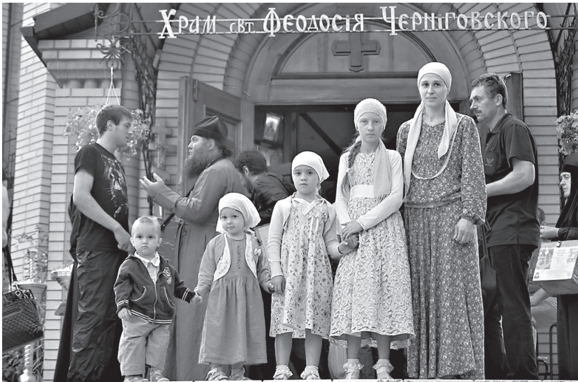
Крестоходцы (Всеукраинского крестного хода за мир)