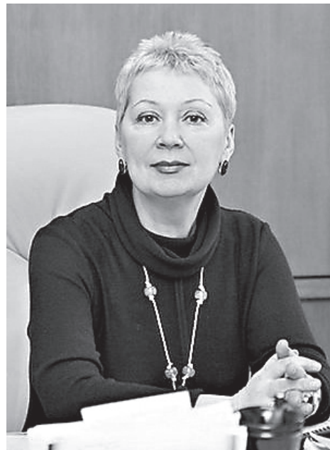
Новый министр образования и науки РФ Ольга Юрьевна Васильева

С мена министра образования стала не рядовой заменой одного чиновника на другого. Назначение на пост министра Ольги Васильевой, преподавателя и крупного специалиста по истории Русской Церкви советского периода, человека с отчетливо выраженными патриотическими взглядами, означает, что вслед за Министерством культуры уже второе ведомство так называемого социального блока возглавляет не просто чиновник, а человек, для которого важнее всего смыслы, а не форма.