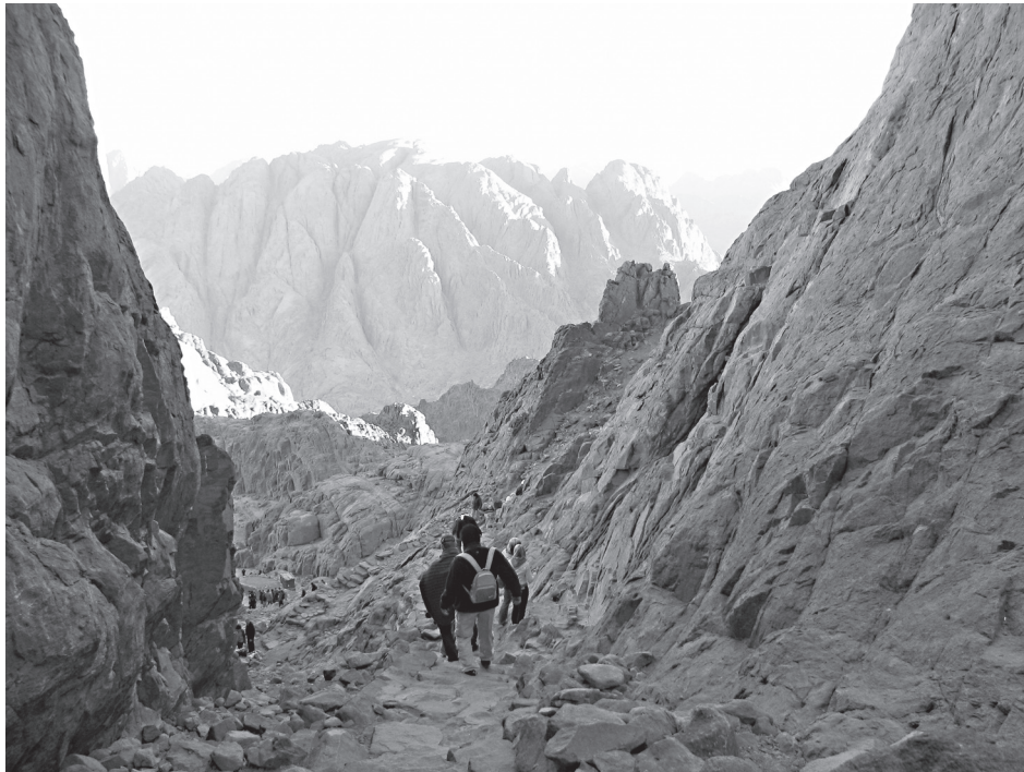
Спуск с горы Синай

Спускаясь к монастырю, я долго не могла его увидеть. Высокие гранитные скалы, как стены, заслоняли равнину, лишь на короткий миг, на поворотах, открывая панораму обители с высоты птичьего полета.