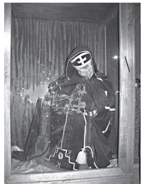
Монах Стефанос, живший в 6 веке. Костница

На всю жизнь я запомню этот день. Люди сидели и роптали, словно народ Израильский у горы Синай. Наказание последовало неотвратимо. Около десяти человек остались на берегу – не пропустила таможня на КПШ. Не потому, что кто-то был греш-