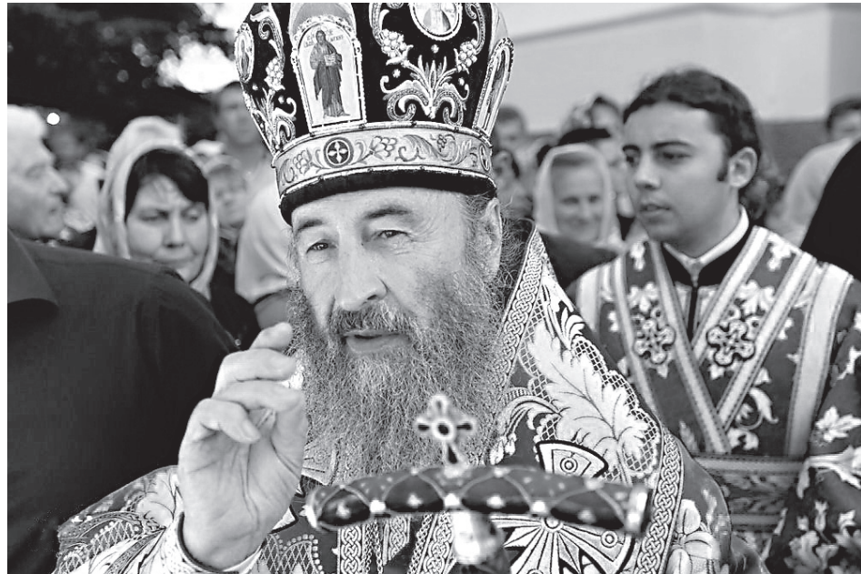
Блаженнейший митрополит Киевский и всея Украины Онуфрий

— Совершенствование — это изначальная цель, поставленная Богом еще в Раю и подтвержденная Христом в