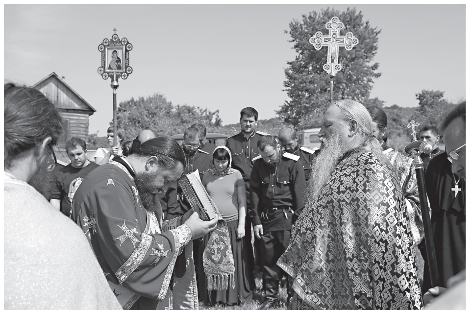
Во время освящения меда

Этот мед, бережно разлитый в аккуратные баночки, а еще тот, что принесли верующие в разнообразных сосудах, был заранее выставлен для освящения около источника Илии Пророка, где был отслужен водосвятный молебен. Так же, как в IX веке в Константинополе, воду освятили частицей Животворящего Креста, и люди прикладывались к нему, принимая на себя капли животворящей воды, щедро кропимой архимандритом Георгием, веря в