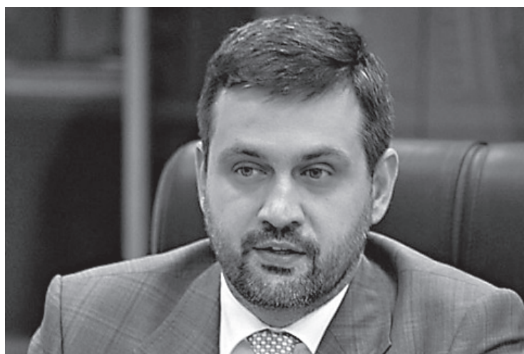
Владимир Романович Легойда

«Церковь постоянно говорит и говорила о гонениях на христиан, но в целом в мире делали вид, что этого нет. Сейчас, после встречи, это стало невозможным. И в этом важный практический результат встречи», – указал он.