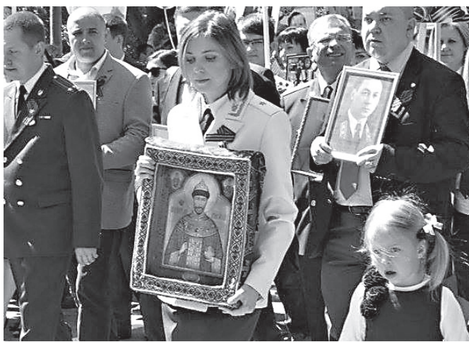
Прокурор Крыма Наталья Поклонская во время шествия «Безсмертного полка»

— На первый взгляд, такое сочетание выглядит весьма странным: Император Николай II был расстрелян в 1918 году, за 23 года до начала Великой Отече-