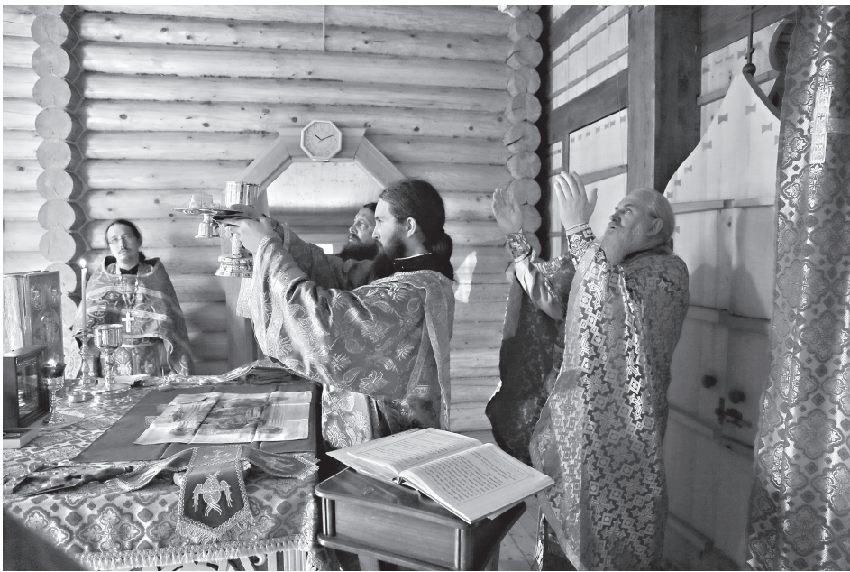
За Божественной литургией