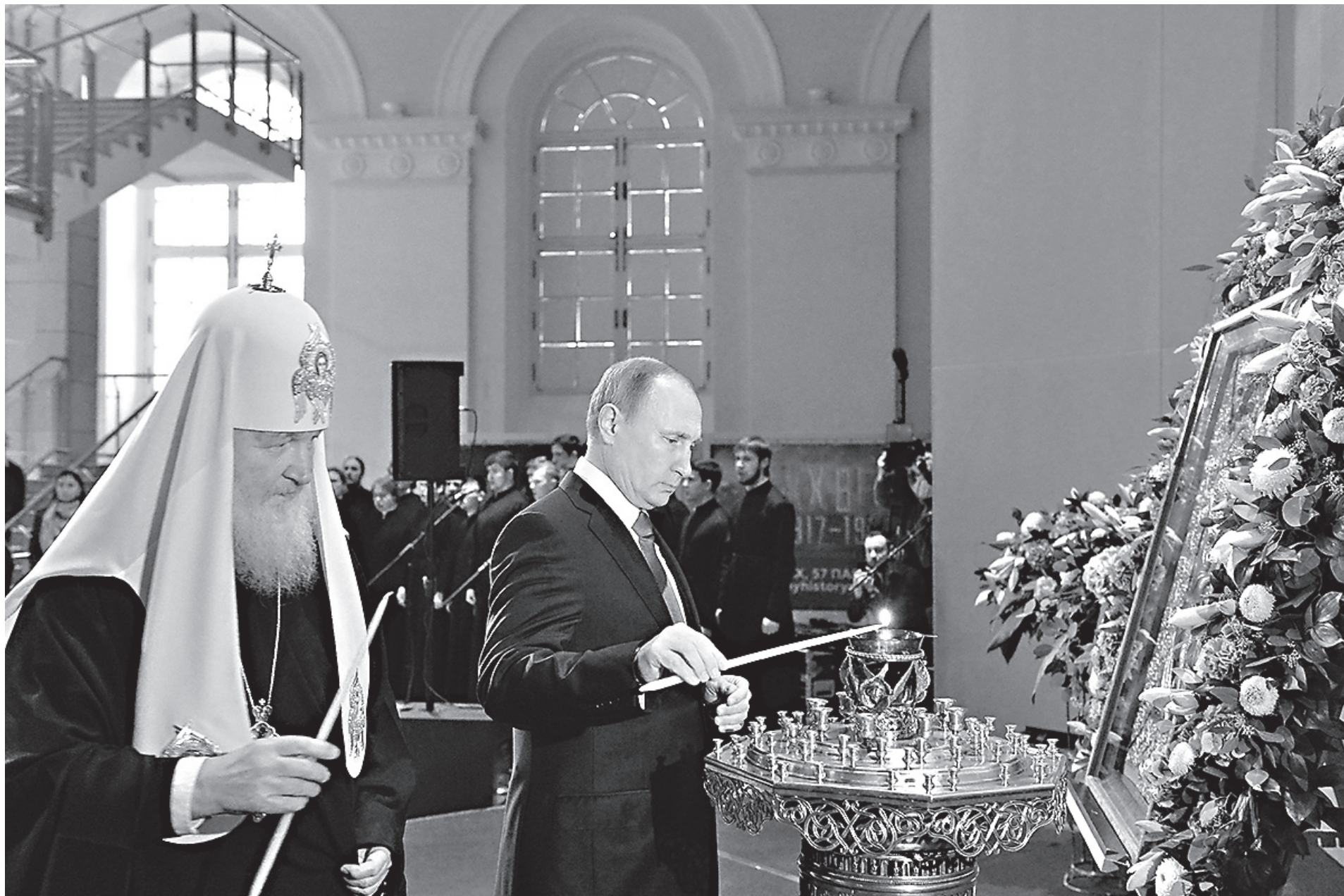
Лидеры России перед открытием памятника великому князю Владимиру на Боровицкой площади в Москве

К огда речь заходит о взаимоотношениях России и Запада, даже о самом словосочетании «Россия и Запад», то обычно возникает два типа ассоциаций. Первая связана с представлением о том, что западное общество неизменно является носителем передовых идей и достижений, с ним ассоциируются комфорт, материальное благополучие и научно-технический прогресс; российское же отстает в своем развитии. При этом, для того чтобы встать на «правильные» рельсы, России стоит только перенять социальное, политическое, экономическое направления развития, которые характеризуют жизнь Запада, то есть копировать существующие модели и внимательно изучать тенденции развития западного общества. Как показала история, такой подход «догоняющего развития» едва ли можно назвать отвечающим национальным интересам; кроме того, сам принцип «догонять» априори предполагает отсталость. Если мы догоняем, то мы всегда отстаем, поэтому в самом этом подходе, который представляет западную модель как идеал и как пример для развития, есть нечто опасное для развития России.