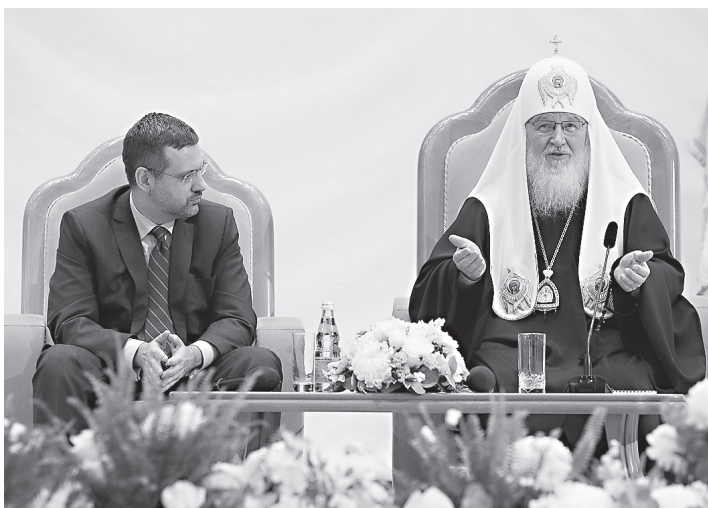
Святейший Патриарх Кирилл на встрече с православными журналистами

Я не вполне с этим согласен, ведь новости — это же церковная летопись! Вот летописцы в старину — разве они философские мысли клали на пергамент или на бумагу? Да нет же, они лишь фиксировали происходившее — но ведь сейчас цены нет этим