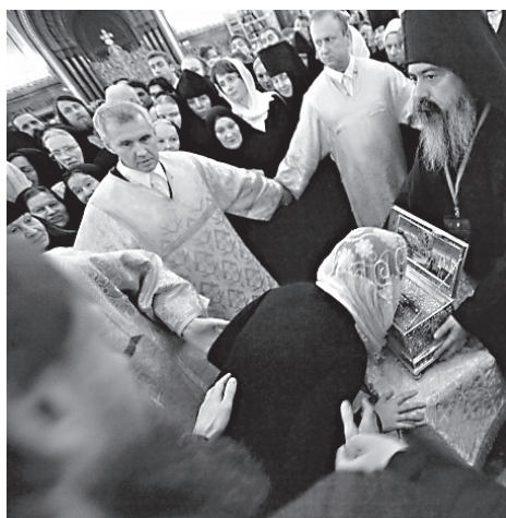
У Пояса Пресвятой Богородицы

У мамы этих детей — назовем ее Тамарой — начались проблемы с женским здоровьем сразу по рождении их старшего брата. Хождения по врачам и назначаемые ими лекарства не давали никакого результата, а через пять лет женщине стало еще хуже. Ребенок рос беспокойным и постоянно болел, что добавляло проблем в семье. Непростые отношения сложились со свекровью, с которой жили вместе из-за отсутствия