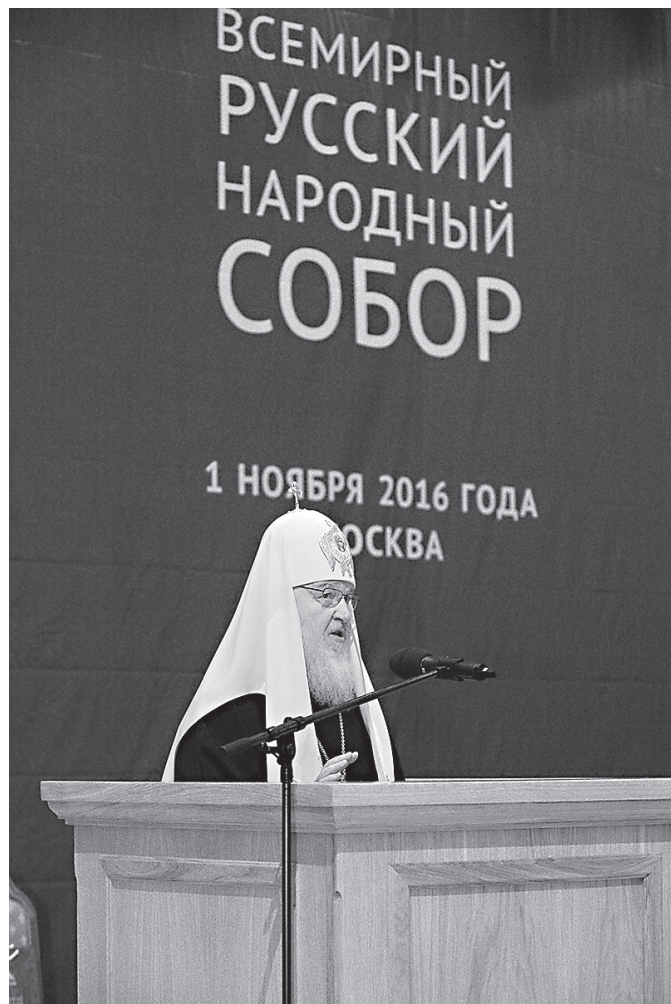
Патриарх Московский и всея Руси Кирилл

Таково различие подходов по широкому спектру глобальных про-