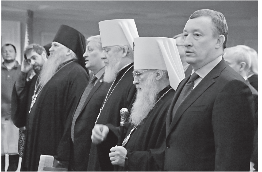
Самарский архипастырь с лидерами Самарского отделения МОО «Союз православных женщин»