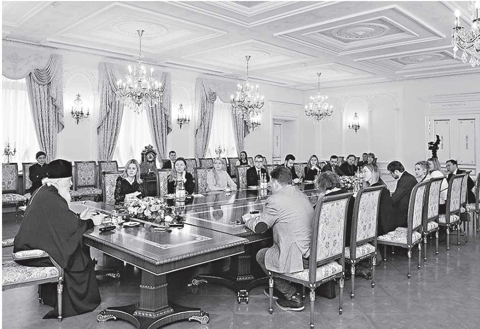
За чаепитием со Святейшим Патриархом

все больше и больше осознавали недопустимость создания границ в нашем таком маленьком мире, в том числе при помощи политических, экономических и прочих средств. Перед миром стоит много проблем, которые сегодня можно решать только сообща, — да и почти все проблемы можно решить только сообща. Вот почему очень важно, чтобы недоразумения в политической сфере не разрушали потенциал человеческого общения. Дай Бог, чтобы Церковь способствовала разрушению стен и ни в коем случае не помогала воздвигать эти стены между людьми, между народами, между государствами.