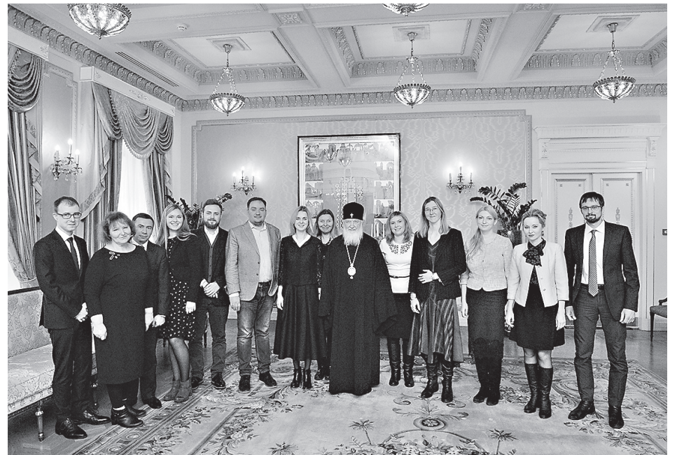
Радость встречи с Предстоятелем Русской Православной Церкви

Сегодня у нас прилагаются большие усилия, чтобы увеличить количество населения. В частности, выплачивается материнский капитал – очень хорошее дело, которое я полностью поддерживаю. И результаты уже есть, но ведь они микроскопические. Число официально совершаемых абортов многократно ниже реального (некоторые говорят – три миллиона в год, другие пять, подсчитать невозможно), но сокращение числа абортов хотя бы на миллион в год привело бы к увеличению населения на 10 миллионов за 10 лет, – если говорить не о духовной, не о