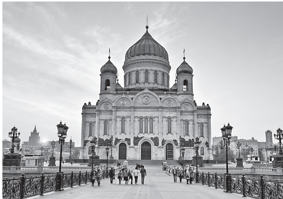
Дорога, которая ведет к Храму

Прискорбно наблюдать за публичными низкопробными спекуляциями на тему его физического состояния в последние годы жизни, за искажением его видения будущего Церкви и Украины, воплощенного в его молитве, за попытками протолкнуть свои амбициозные устремления, выдавая