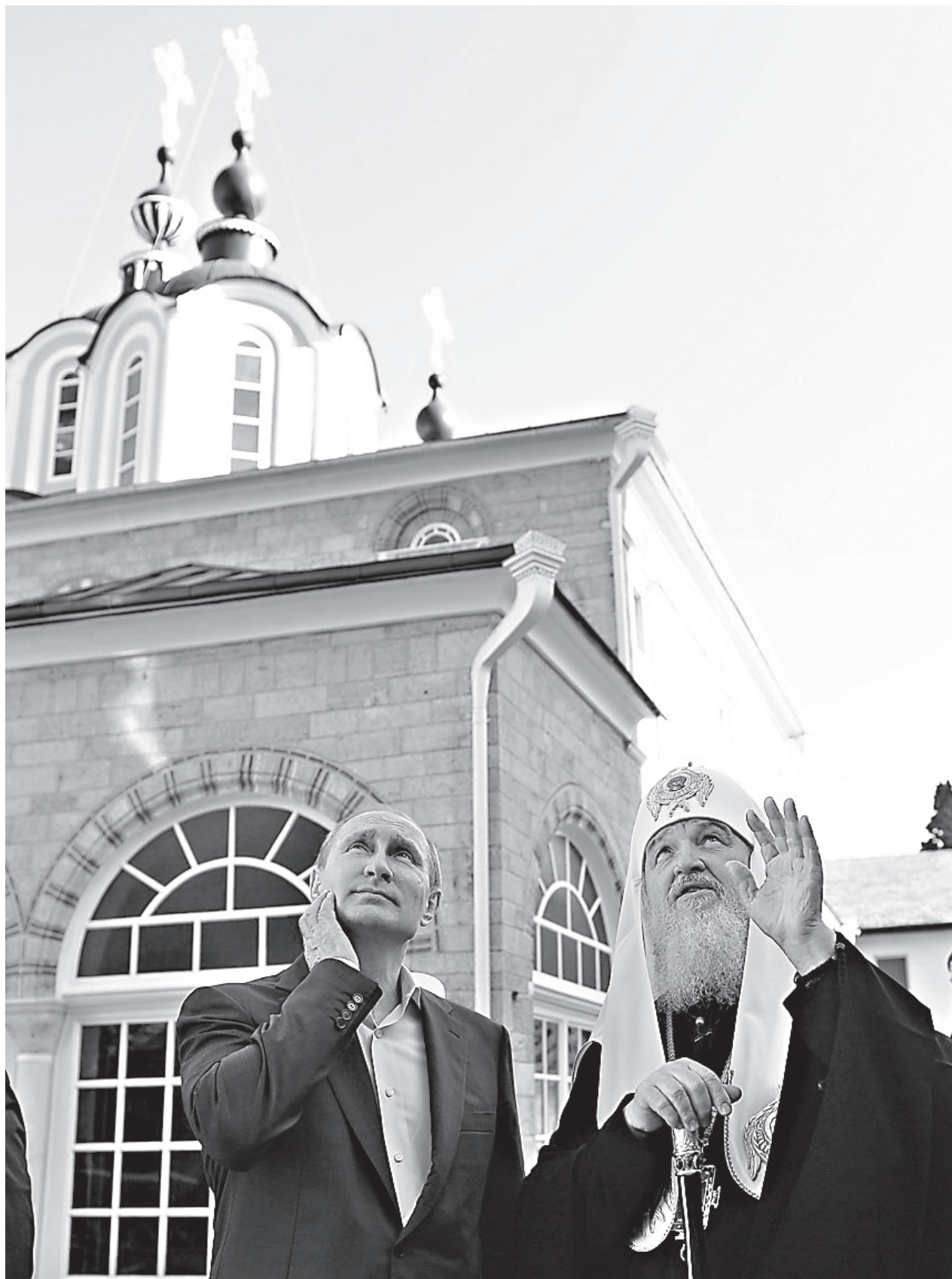
Святейший Патриарх Кирилл с Президентом России В. В. Путиным в Русском на Афоне Пантелеимоновом монастыре. 28 мая 2016 г

Главное служение, которому Церковь посвящает себя, — это служение благодати Божией. Получив ее от Самого Господа в день Пятидесятницы, она призвана раз-