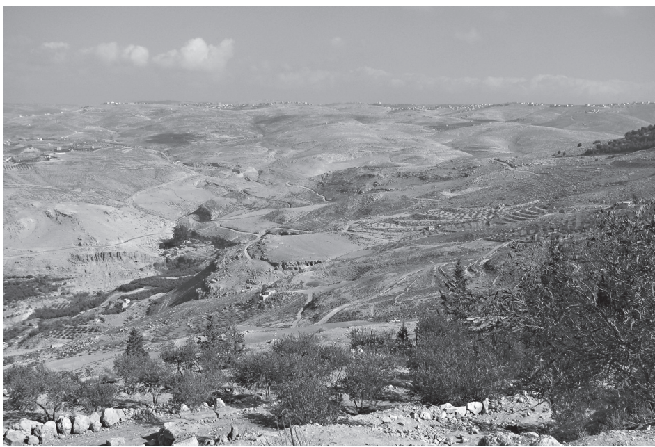
Вид на землю Обетованную

Широкая автострада международного класса проходит по Аравийской пустыне. От Акабы до Петры около 130 км. В пути Георгий знакомит нас с Иорданией. Относительно молодая страна с высоким процентом прироста населения – около 300 тыс. чел. в год. В деревнях семьи имеют по 5-8 человек детей, в городах – меньше. На всю страну только 3 дома для престарелых, т. к. дети и внуки не бросают стариков. Правящая рели-