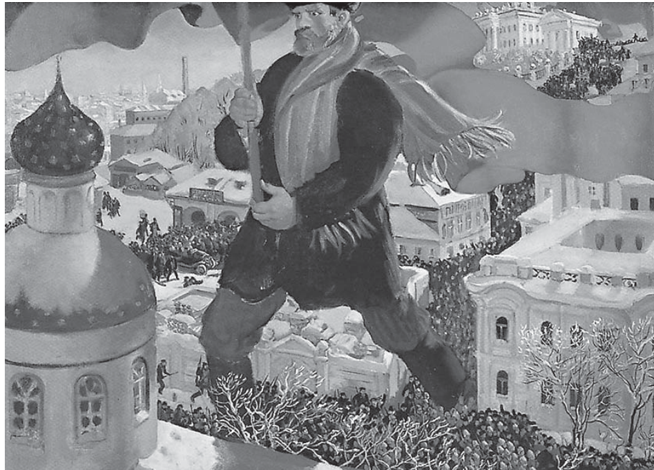
Б.М. Кустодиев. Картина «Большевик»

нистрирования. Особенное рвение в этой учебе проявлял Александр Невский, который много раз ездил в орду и налаживал с ней плодотворное сотрудничество.