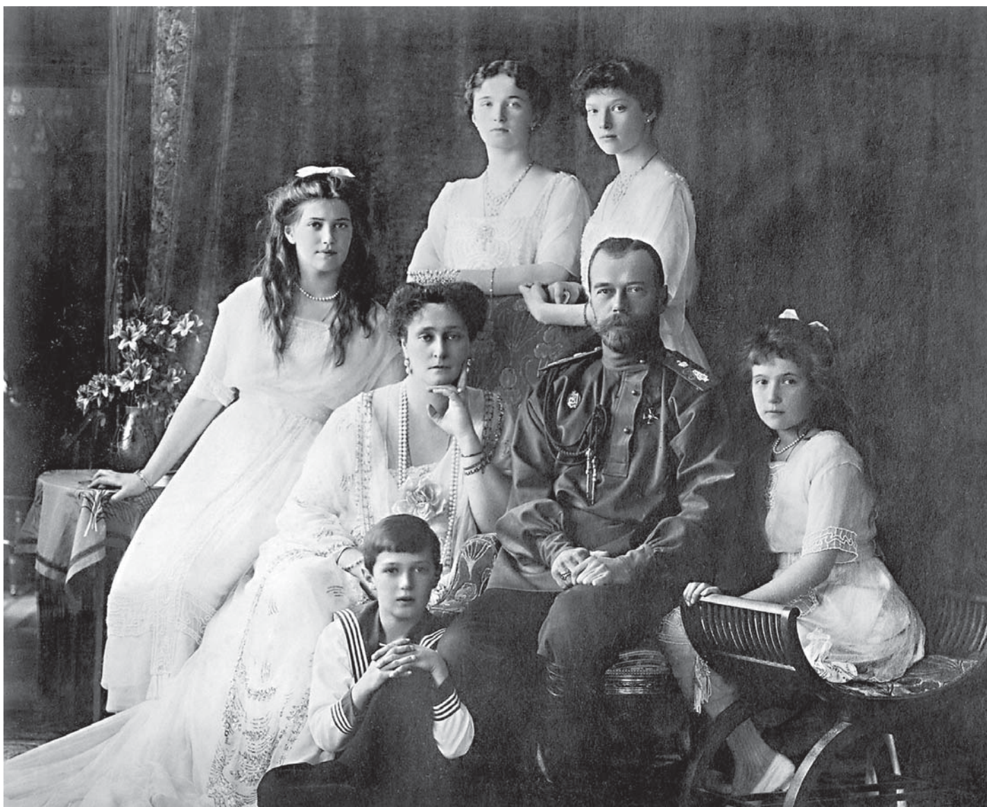
«Святые Царственные страстотерпцы, молитесь Бога о нас!»

Господь забрал к Себе этих замечательных людей. Для нас это трагедия, но не для Бога, потому что, в отличие от нас, Бог видит все. Он видит вечность, и то, где они сейчас, это лучше, чем то, где остаемся мы. Нам это трудно понять, потому что нам не дано опыта соприкосновения с иной жизнью. Но иная жизнь существует, а значит, смерти нет. И чем яснее мы будем это понимать, переживая умом и сердцем, тем мы будем сильнее. Тогда у нас будет иной взгляд и на нашу временную жизнь, ведь то, что нам кажется иногда очень важным, чему мы посвящаем все силы своей души, своего сердца, своего разума, с точки зрения Божественной перспективы и вечности очень часто таковым не является.