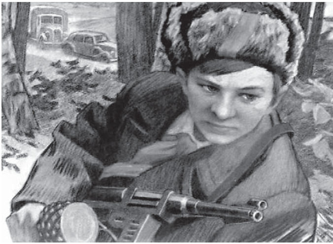
Партизан Валя Котик

А осенью 1941 года отчаянный мальчишка совершил настоящую диверсию — устроив засаду у дороги, он гранатой подорвал машину с гитлеровцами, уничтожив нескольких солдат и командира отряда полевой жандармерии.