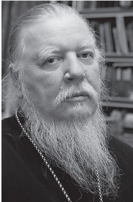
Протоиерей Димитрий Смирнов

Перейдя к общей ситуации в сфере защиты семьи, председатель Патриаршей комиссии отметил, что Церковь и просемейные общественные организации давно говорят о необходимости системных изменений законодательства для защиты семьи. Он напомнил о выраженной Архиерейским Собором в 2013 году официальной позиции Русской Православной Церкви: «Церковь утверждает, что государство не имеет права на вмешательство в семейную жизнь, кроме случаев, когда существует