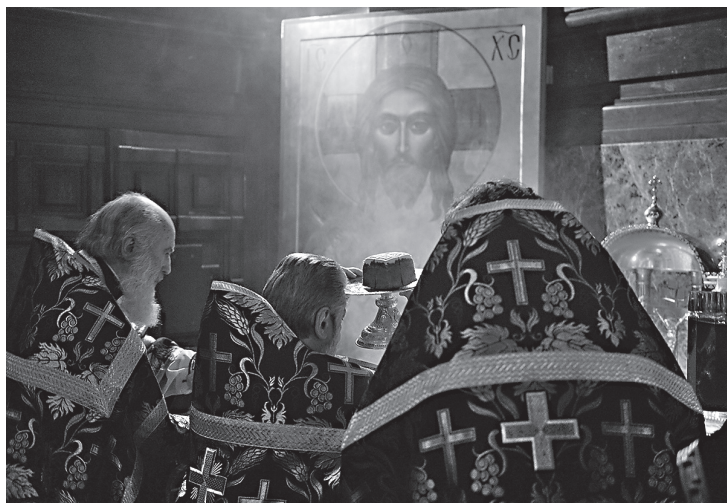
Литургия Преждеосвященных Даров

Однако, здесь возникал вопрос. Как говорит Святитель Василий Великий, верующие его времени привыкли прича-