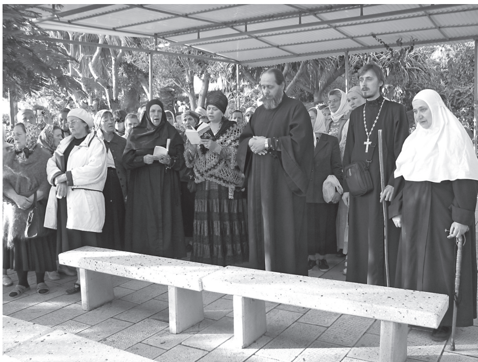
Пение заповедей Блаженств

После купания в Иордане мы отправляемся на гору Блаженств – место Нагорной проповеди Иисуса Христа. Вернее сказать – это холм, немного возвышающийся среди про-