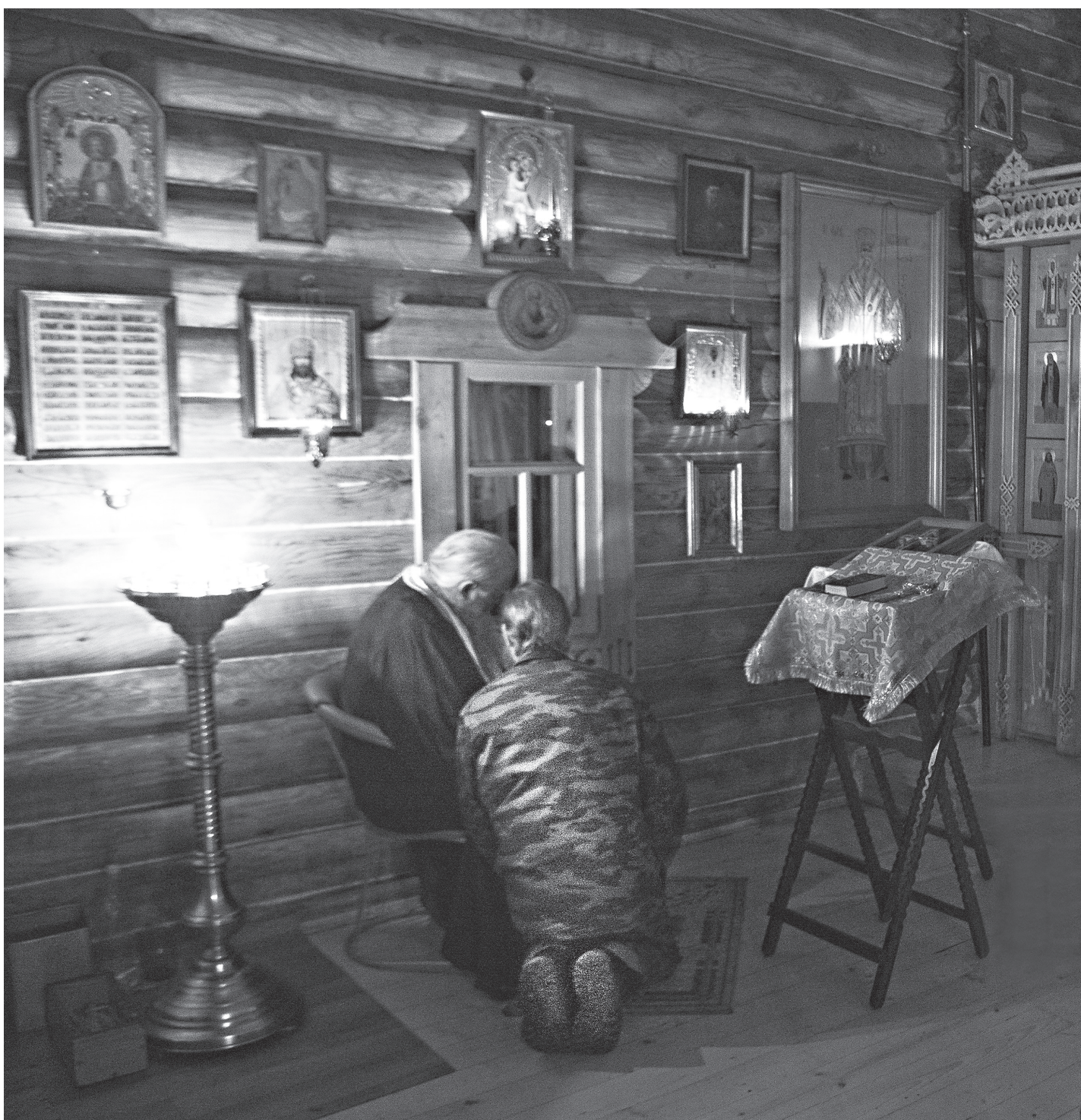
«И даждь, Господи, в сердце моем смирение и помыслы благи...»

Тот же Иоанн Златоуст говорит: «Ничто не дает нам такой возможности избежать геенны огненной, как милосердие». Действительно, совершая дела милосердия, мы проверяем