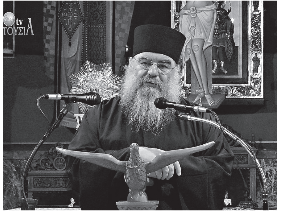
Митрополит Лимассольский Афанасий

Так что великим благословением для человека является умение молиться. И нужно этому учиться. Ведь в каждой повседневной вашей жизни вы можете встретить множество сложностей, скорбей, разочарований. От этого в нашу эпоху много молодежи зашло в тупик. В юности, когда человек еще довольно незащищен, ко всему проче-