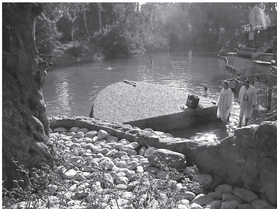
Крещение украинских паломников

17 декабря, среда. Иудейская пустыня. Мелодичный перезвон колоколов встречает нашу группу еще на подходе к монастырю Герасима Иорданского (пам. 4/17 марта). Над входными воротами развеваются полотнища синего греческого и красного святигробского флагов. Вдоль стен входной арки тянется ряд икон. Среди них фотопортреты Патриарха Алексия II. По краям свисают траурные черные ленты в безмолвной скорби: «Мы помним». Игумен архимандрит Хризостом (Тавулареас) лично знал Патриарха.