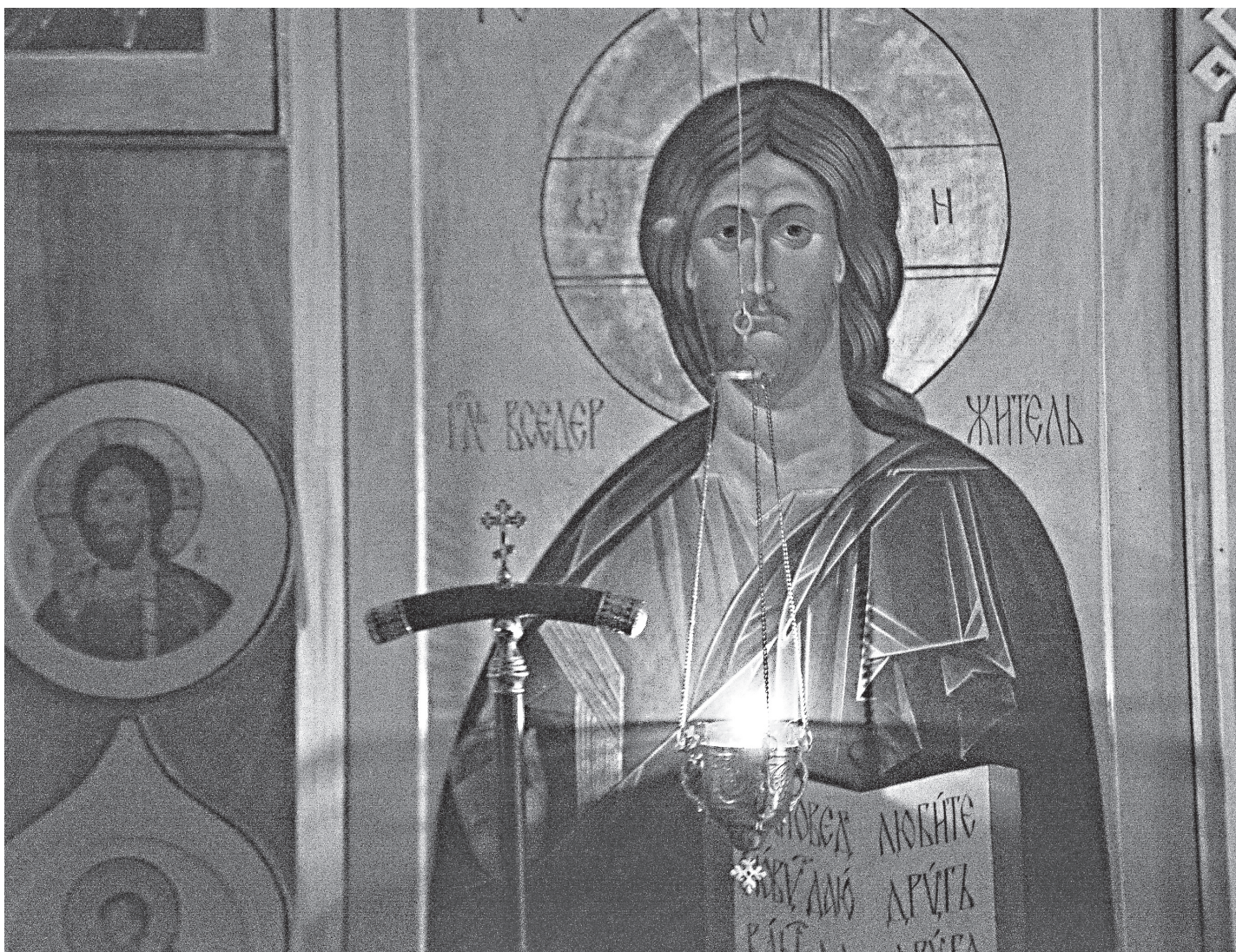
«Господи и Владыко живота моего...»

И вот нам посылаются кресты, причем страдаем мы будто не по своей вине. Как бы со стороны, извне приходят болезни, скорби, случаются аварии на дорогах, ведущие к гибели или инвалидности. Человек иногда оказывается буквально раздавлен тяжестью страдания, он не видит смысла в своем существовании — все померкло, жизнь закончилась. А Господь говорит: «Отвергнись себя, возьми крест — тот самый, который тебе посылается, — и следуй за Мной». И когда люди именно так воспринимают посланный им крест — не страдания, порождаемые нашей греховностью, а скорби, которые от нас