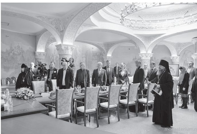
Заседание Попечительского совета

Представитель Президента также добавил, что Нижегородская земля всегда была и остается одним из крупнейших духовных центров России и всего православного мира: на террито-