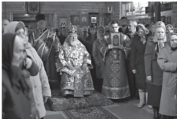
За Божественной литургией