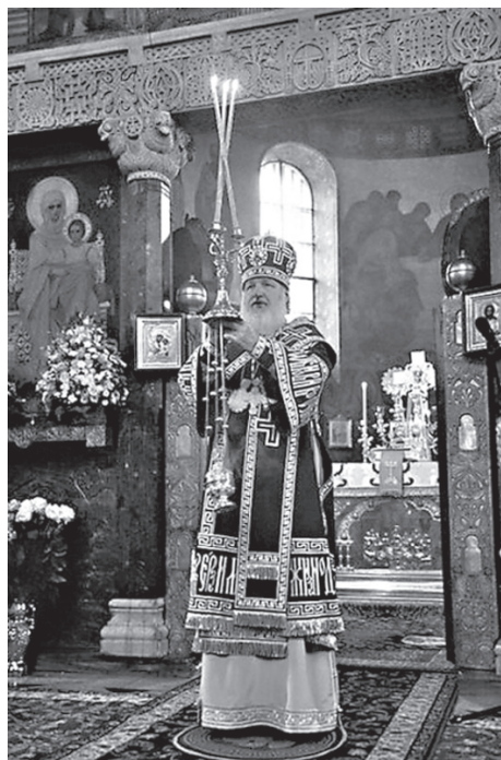
«Свет Христов просвещает всех!»

Проповедник В Афинском храме в честь святого Ферапонта, который находится в районе Зографу, есть хороший обычай. Во