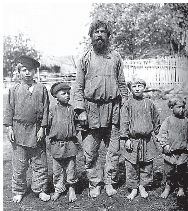
Трудовая крестьянская семья

Поэтому положение дворовых людей было двойственным. С одной стороны, их повинности не были чрезмерно выматывающими и непосильными, и зачастую к ним относились как к членам семьи — дворовые люди исполняли обязанности нянек у юных дворян. Например, знаменитая пушкинская Арина Родионовна как раз была из этой категории людей. В отличие от крестьян, порой видевших барина раз в несколько лет, дворовые люди всю жизнь жили с ними бок о бок. И прикреплены они были не к земле, то есть с продажей имения кре-