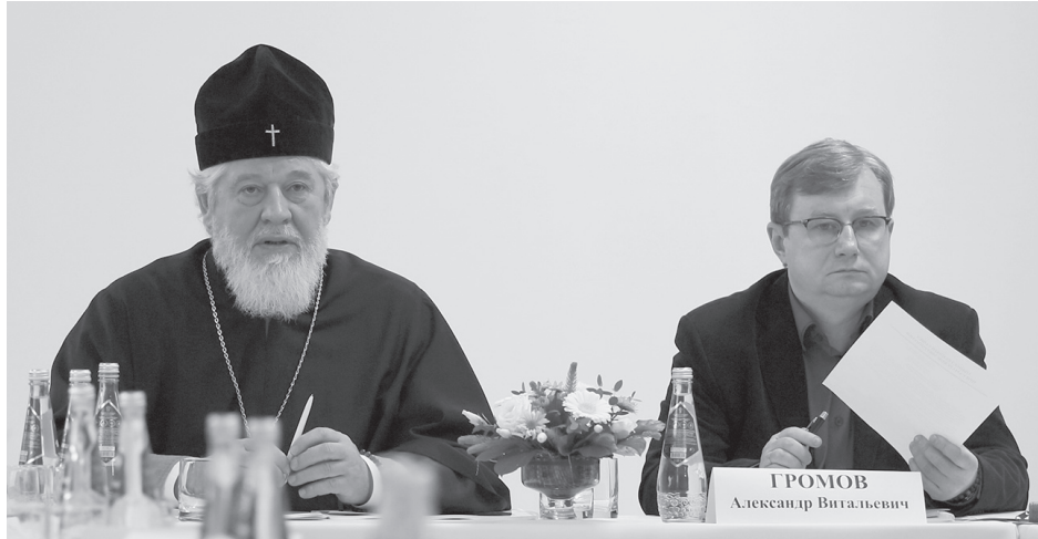
Во время заседания Общественного совета при митрополите Самарском и Сызранском Сергие

Итак, если человек стремится показать иное бытие, мир Божественный и чувствует в себе такое призвание, то имеет смысл становиться художником,