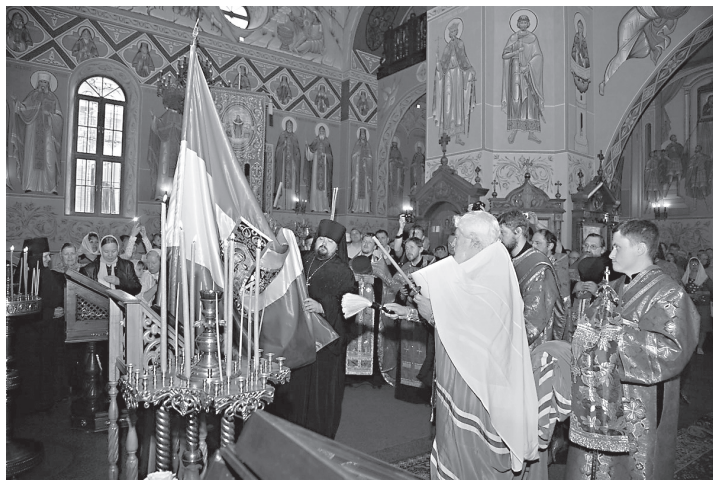
Освящение копии Самарского Знамени

После торжественного молебна Самарское Знамя пронесли во главе