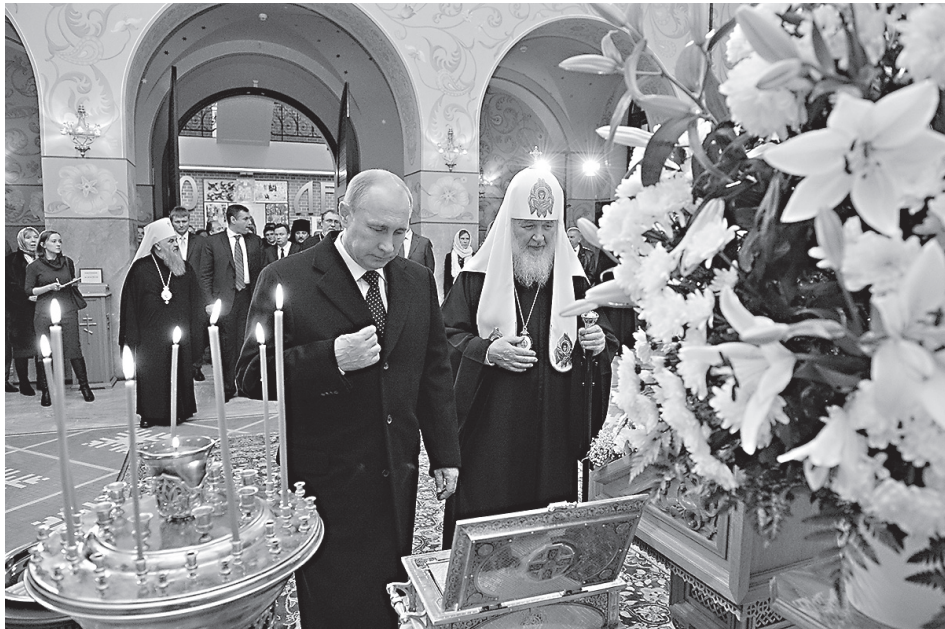
Патриарх Московский и всея Руси Кирилл и Президент РФ В.В. Путин

Рождению этого материала, как и во многих других случаях, предшествовало письмо в редакцию. Один из наших читателей, инженер из Тамбова, прислал следующее послание: