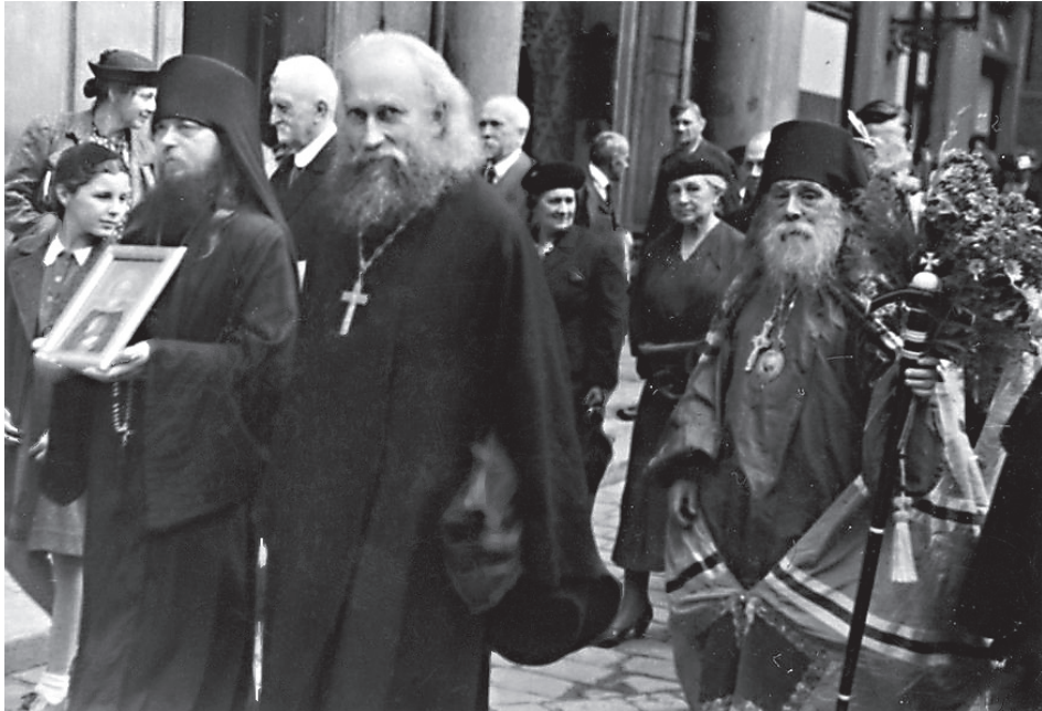
Во время крестного хода

Местом его служения был определён храм свт. Николая на Староместской площади.