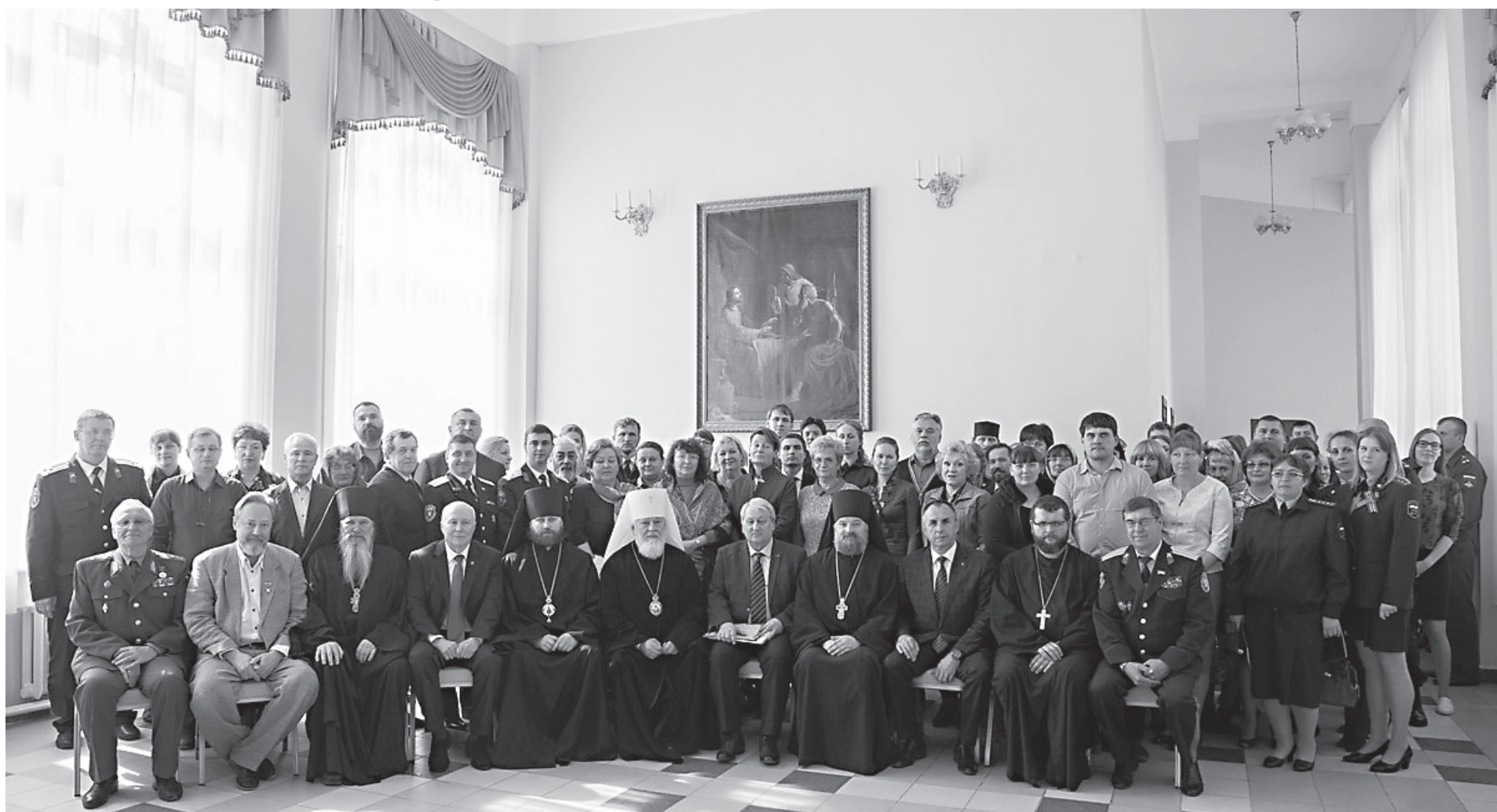
В единстве - наша сила

В основе отношений, как между отдельными человеческими личностями, так и между человеческими сообществами, должно лежать сотрудничество и взаимодействие, но только не в ущерб своим интересам и без проведения новых разделительных линий и наклеивания ярлыков «мир цивилизованный», «мир варварский», «ось добра» или «ось зла».