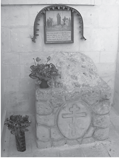
Камень Иоанна Предтечи перед Казанским храмом