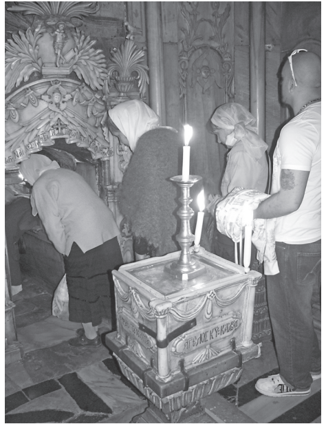
Наши паломники в приделе Ангела