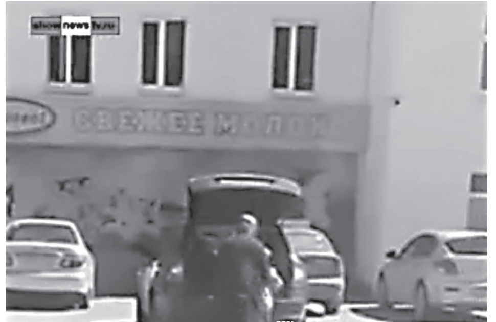
Фрагмент клеветнического репортажа о священнике с сыном, обошедшего все центральные СМИ

Отношение к неоязычеству, которое признано деструктивной технологией, запущенной с целью подорвать