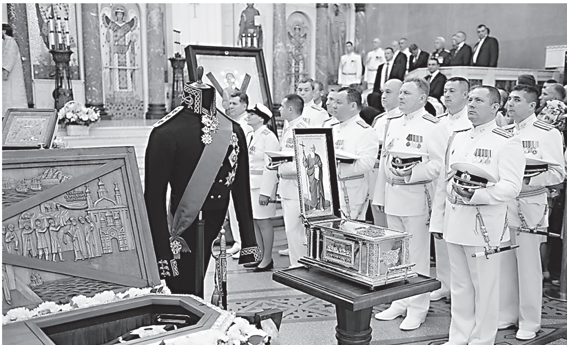
Мощи св. прав. Феодора Ушакова в Никольском Морском соборе г. Кронштадта

П ример адмирала Феодора Ушакова должен сегодня развеять всякие сомнения у сомневающийся, у скептиков, у людей, зараженных религиозным релятивизмом или вообще не думающих о вере. Господь по-разному являет Свою силу, и через праведного Феодора Он особым образом явил силу нашему воинству. Не бывает так, чтобы в сражениях не было потерь, особенно во времена, когда суда подходили почти вплотную и палили из всех пушек. В этой смертельной дуэли не могло не быть поражений, но у адмирала Феодора Ушакова их не было. Никаким полководческим талантом объяснить это невозможно, да и сам адмирал никогда не объяснял свои победы собственными знаниями или опытом. Он был человеком удивительной жизни, исключительно скромным. Он жил, как монах, и все, что имел, отдавал флоту, Родине и Церкви — и жалование, и время, и силы, и всю свою жизнь. И неслучайно в новейшее время в народе нашем, в Церкви возникло движение за прославление адмирала Феодора Ушакова в числе святых земли Русской. В самом начале этого процесса не все считали возможным прославить адмирала как общецерковного святого — всегда в больших делах есть разномыслие и дискуссии. Но для того чтобы никакое разномыслие, никакие дискуссии этот процесс не остановили, святой Феодор был включен в лик местночтимых угодников Божиих в Саранской и Мордовской епархии, где погребены его останки.