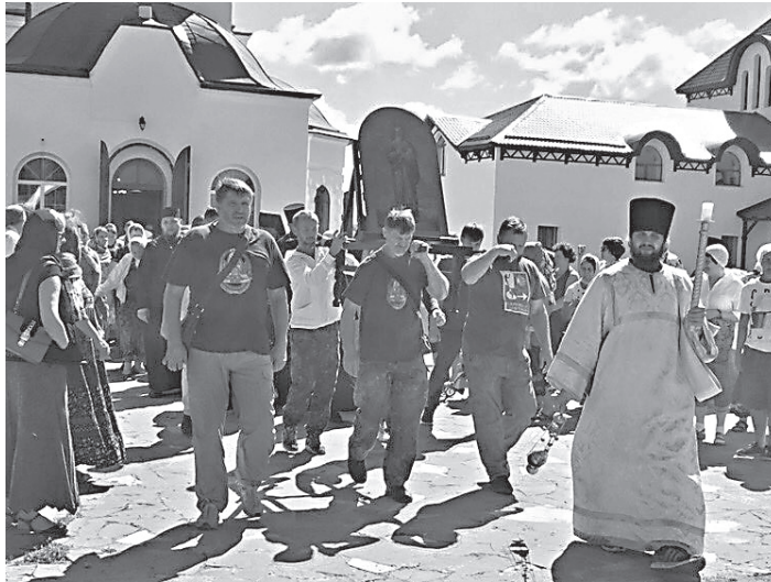
Начало крестного хода от Ильинского храма женской обители

Д ень памяти Пророка Илии в нашей стране известен не только верующим. В древней Руси он был самым почитаемым святым. Из истории земной жизни пророка родилось поверие о том, что святой Илия является покровителем земледелия, повелителем грома и дождя. Это и объяснимо, если представить природу нашей земли как живое свидетельство бытия Божия. Красота и гармония в любом уголке планеты. Живите, любуйтесь, радуйтесь и благодарите Бога. Житие Илии Пророка показывает, как природа может служить наказанием людям за их грехи.