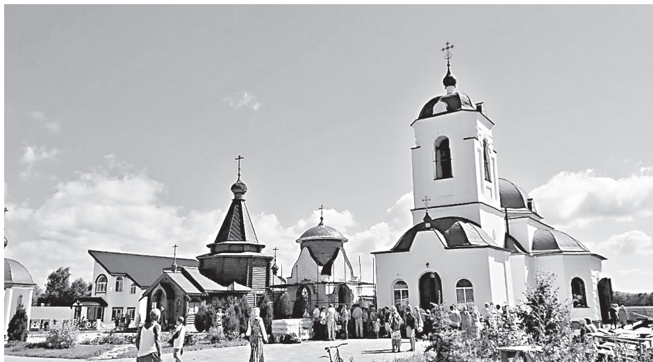
Заволжский Свято-Ильинский женский монастырь, общий вид

Илия Пророк был отшельником и жил вдали от суетного мира. Так и Заволжский монастырь - островок мира и покоя. Насельницы его с любовью встречают каждого, кто приезжает в обитель. А в день престольного праздника таких был полон храм. Служба в храме Илии Пророка - светлая, торжественная, необычная. Все здесь по-другому. Пение монахинь древним распевом уносит в далекие времена. Солнце льется в окна алтаря, и он весь сияет и лучится ярким уютным светом. В храме распахнуты все двери, легкий ветерок, кажется, спешит украсить службу запахом полевых цветов. Те, кого не вместил храм, стоят прямо на улице.