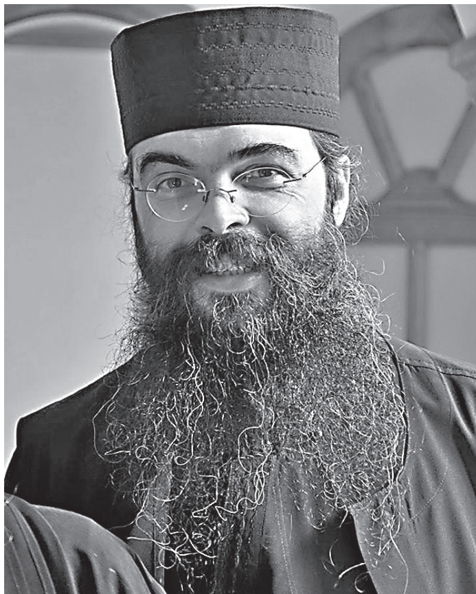
Архимандрит Андрей (Конанос)

В уме сегодняшнего человека нет просветления, чтобы он мог бы выбрать для себя правильное. Поэтому большинство людей, как говорит святой Порфирий, – это запутанные души. Несчастные и измученные люди! Они не знают, чего хотят, куда