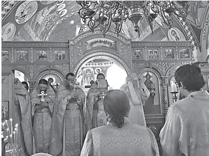
Во время Божественной литургии