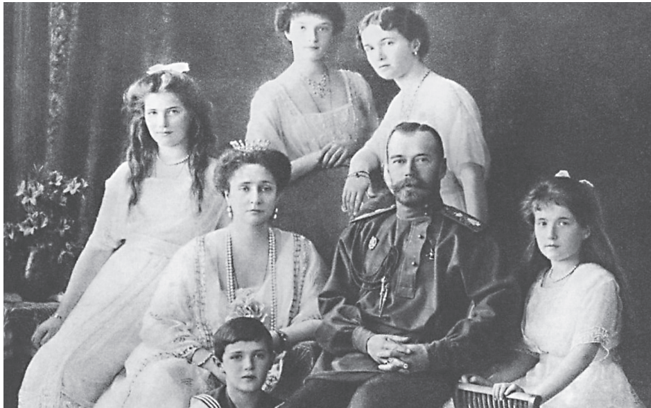
Семья последнего русского Императора

Но банальная причина в другой стороне. Когда возник интерес к Романовым? Именно тогда, когда Леонид Ильич Брежнев, а затем и Михаил Сергеевич Горбачев пытались улучшить отношения с Букингамским дворцом. Ее величество королева Елизавета Вторая говорила, что она не приедет в Россию до тех пор, пока перед ней не извинятся за судьбу Николая Второго.