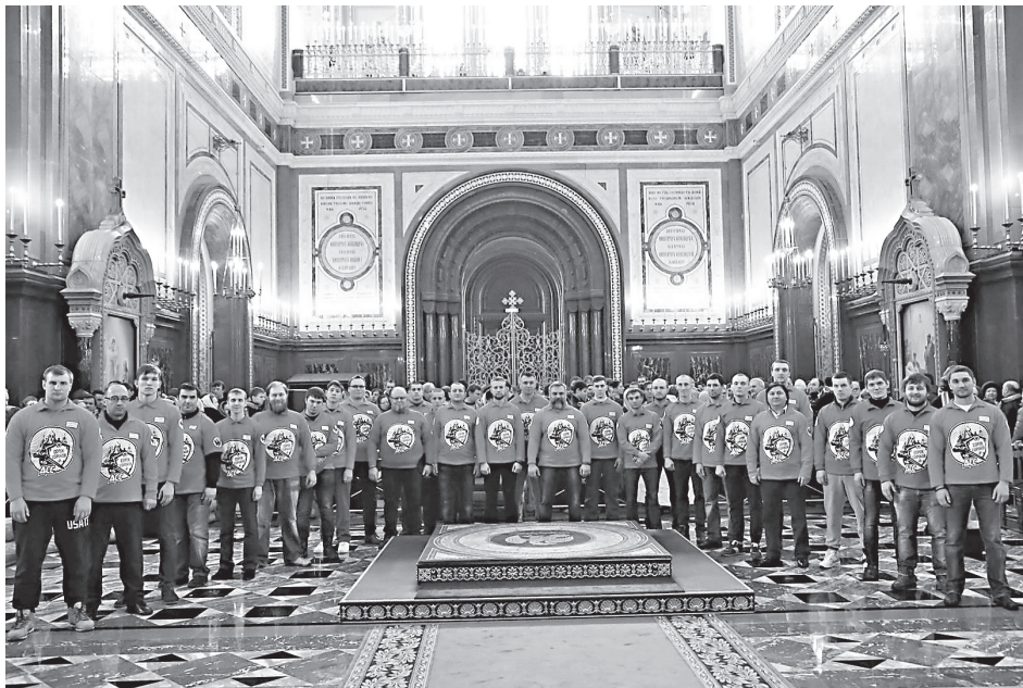
Добровольцы общественного движения «Сорок сороков»