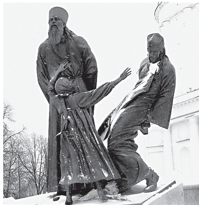
Памятник священникам и мирянам – жертвам советской власти в городе Шуя Ивановской области около колокольни Воскресенского собора

К 1936 году верховная власть страны, вероятно, пришла к выводу, что два десятилетия под руководством коммунистической партии и лично товарища Сталина достаточно сплотили советское общество, переобразовав его граждан в новый тип человеческой расы, позже получивший ироническое название homo sovieticus. Эта убеждение отразилось в новой советской Конституции 1936 г., получившей название «сталинской». Одним из завоеваний этой Конституции стала отмена категории «лишенец». Сейчас нам трудно представить, с каким восторгом была воспринята многими эта Конституция. Все бывшие «лишенцы» и члены их семей, находящиеся до этих пор словно на краю пропасти, привыкшие жить в непрестанном страхе перед новым витком репрессий, лишённые права защитить себя и близких от