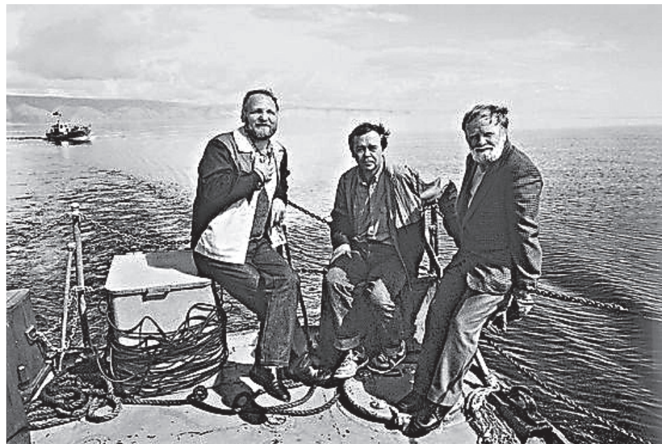
Русские писатели Владимир Крупин, Валентин Распутин и Василий Белов в 80-е годы прошлого века