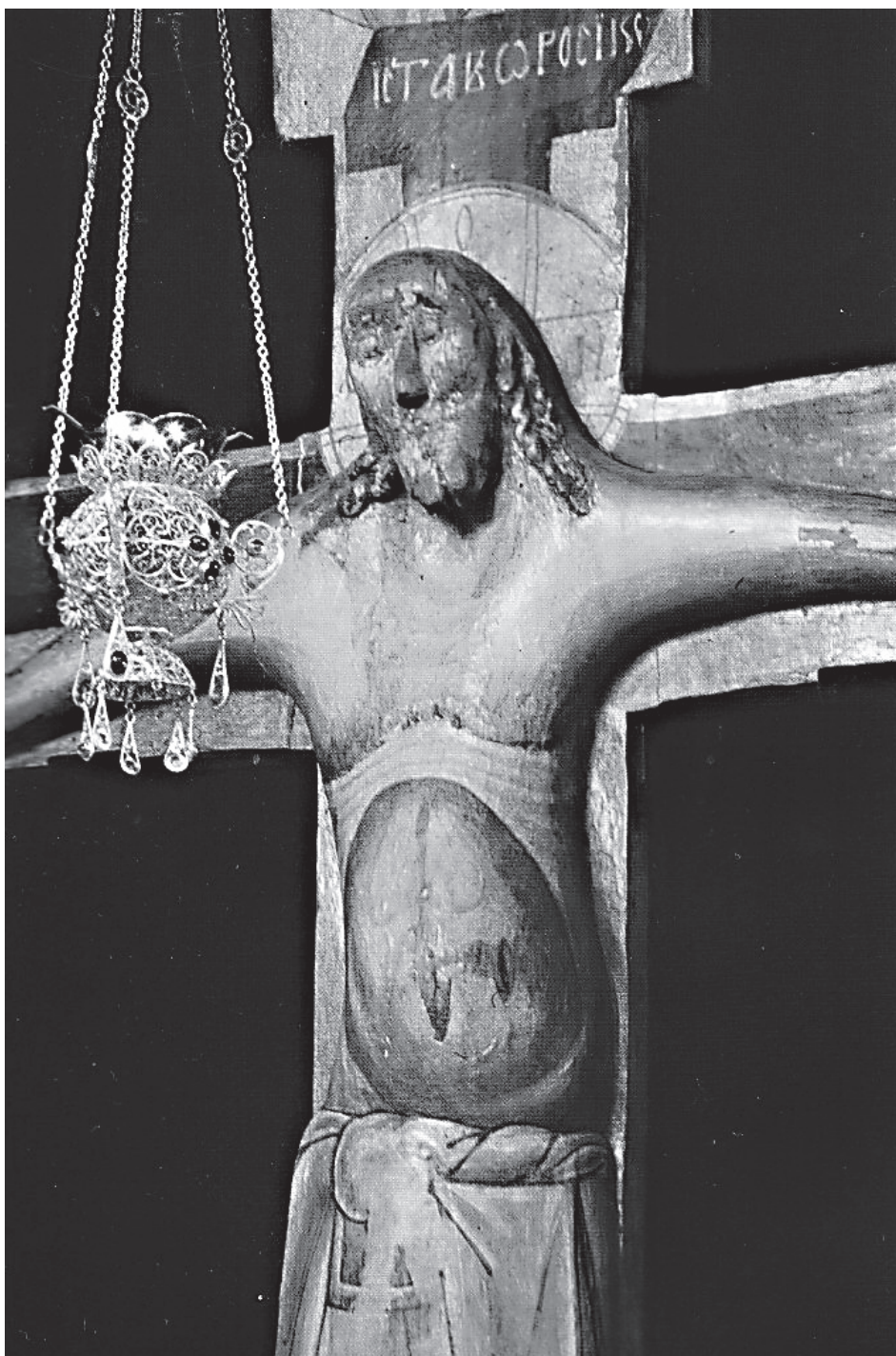
Животворящий Крест Господень, село Годеново

Не каждое страдание есть крест. Например, если человек, который злоупотребляет алкоголем, в состоянии алкогольного опьянения садится за руль и кого-то убивает, после