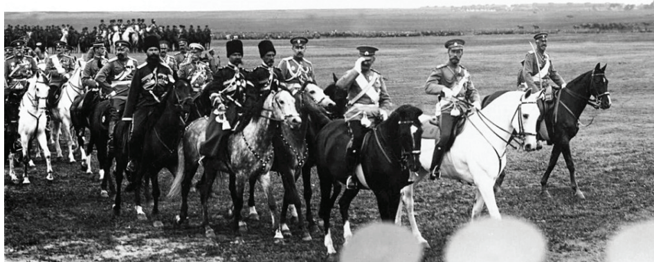
Император Николай II и датский король Фридрих VIII со свитой на военном поле объезжают фронт выстроенных на смотр войск. 7 июля 1909 г.

Для удобства мы выбрали официальный трейлер «Матильды» под номером 3. Вот так вот сразу - не много, не мало: их встреча изменила целое государство. Господа, а что так скромненько? Чего же не больше? Чего не