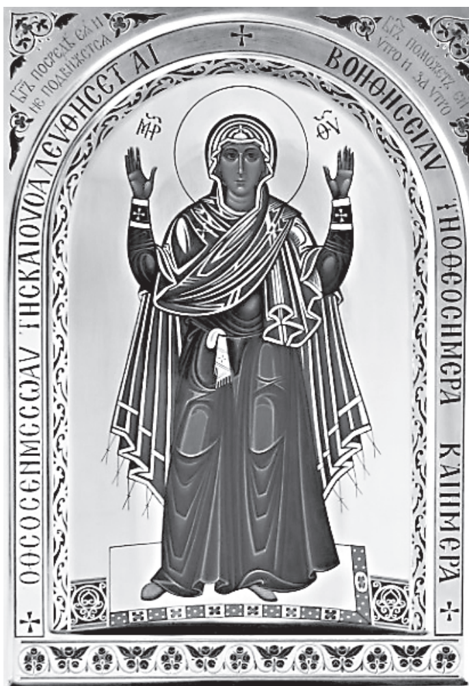
Икона Божией Матери «Неушжимая Стена»

Несмотря на примитивность драматургии немецкой пьесы, построенной на эксплуатации набора клише, и ее явный идеологизированный харак-