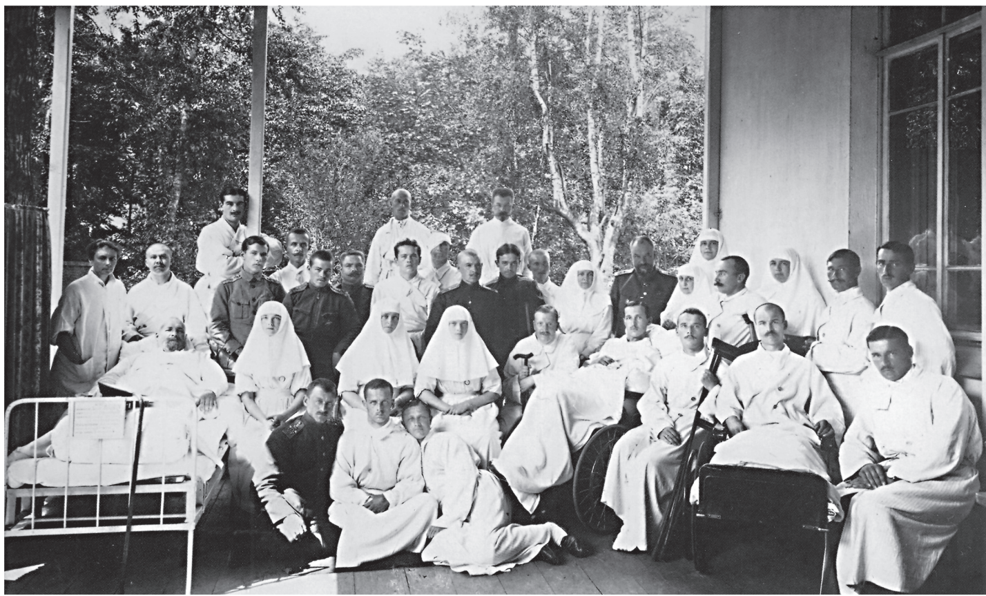
Императрица Александра Федоровна с дочерьми Великой Княжой Ольгой Николаевной и Великой Княжой Татьяной Николаевной в группе раненых в Царскосельском лазарете. 1916 г.

Семья императора Николая II отдала под военные лазареты не только свой главный дом на Дворцовой площади, но и почти все загородные двор-