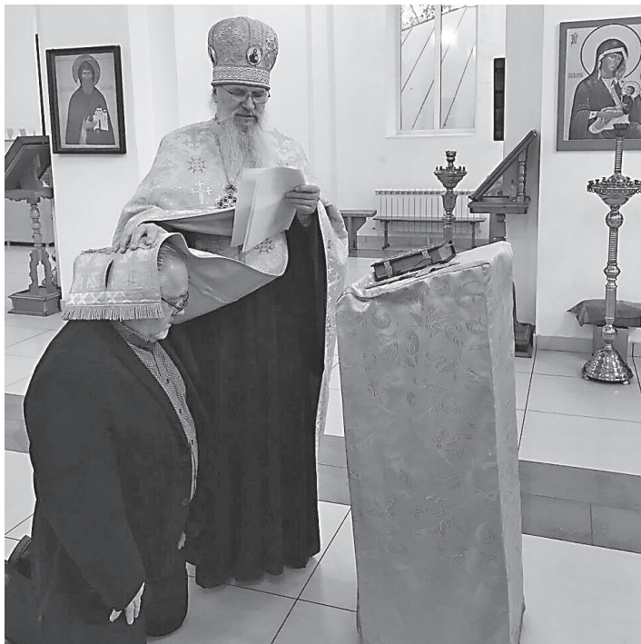
Во время чина присоединения к Православной Церкви