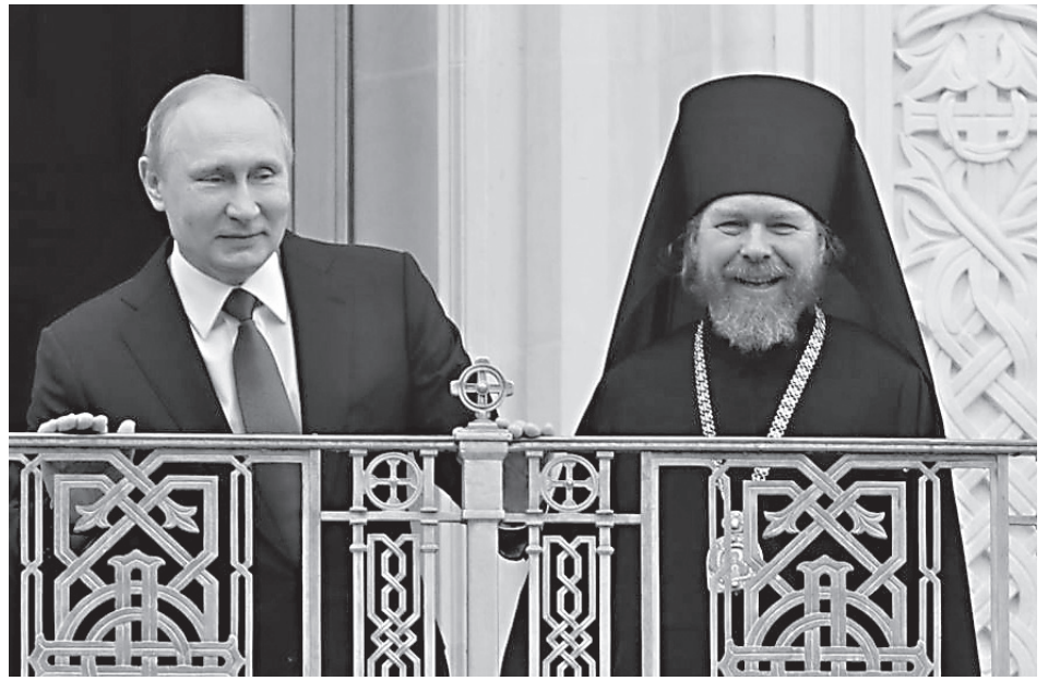
Президент РФ Владимир Владимирович Путин и епископ Егорьевский Тихон (Шевкунов)

Избранная митрополитом Сергием церковная политика нашла как понимание в церковной среде, так и жесткое осуждение и противостояние. Самое скверное, что мы можем сделать из нашего безопасного сегодня, — приняться судить конкретных людей той и другой стороны. Среди поддержавших Декларацию митрополита Сергия были великие святые: архиепископ Иларион (Троицкий) — один из самых мужественных новомучеников двадца-