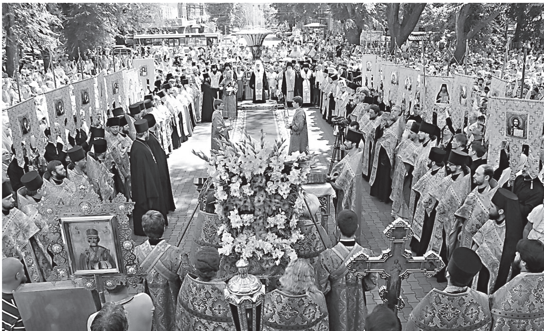
Украинский антивоенный крестный ход, 27 июля 2016 г.

Ч еловечество сейчас вступило, не побоюсь этого сказать, в очень тяжелый глобальный кризис. Речь идет не только об экономических трудностях, которые охватили практически весь мир, — также умножилось количество войн. После окончания «холодной войны» мы все мечтали о том, что наступит время мира, сотрудничества, но количество локальных конфликтов увеличивается и приобретает очень грозные масштабы, в эти конфликтные ситуации втягиваются великие державы. Одновременно осложняются экологические проблемы. Растет социальное неравенство в глобальных масштабах. Политика, экономисты, культурологи пытаются найти ответы, почему все это сегодня происходит. Но я думаю, у нас, христиан, должен быть собственный ответ: все плохое в жизни людей происходит от человеческого греха. Если нарастает глобальный кризис, если зло приобретает глобальное измерение, становится очень радикальным, значит, что-то в душах людей происходит, и это сопровождается отходом человека от Бога. Мы пережили соответствующие настроения в Советском Союзе и поняли, сколь отрицательное влияние на всю жизнь имела атеизация общества. Но слабость той атеизации заключалась в том, что она была следствием насаждения идеологии. Идеологии долго не живут. Ушла идеология — атеизация закончилась.