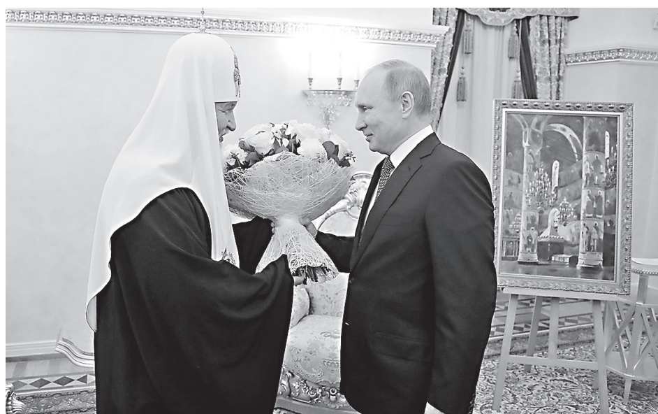
Владимир Владимирович Путин поздравляет Святейшего Патриарха Кирилла с 70-летием

События, подобного нынешнему, не было в России 228 лет — последний раз глава государства присутствовал на Соборе русской Церкви в 1689 году. Но тогда ни один из двух царей-соправителей, Петр и Иван, на Соборе не выступали по причине малолетства. Сама традиция церковных соборов целиком связана с государственной властью. Все великие Вселенские соборы созывались византийскими