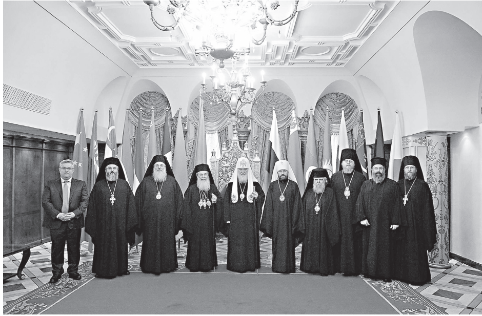
Встреча Святейшего Патриарха Кирилла с Блаженнейшим Патриархом Иерусалимским Феофилом III в рамках Архиерейского Собора в Москве

социальные сети — это такая же реальность нашего времени как телевидение или радио. Ошибкой будет пренебрегать этой реальностью.