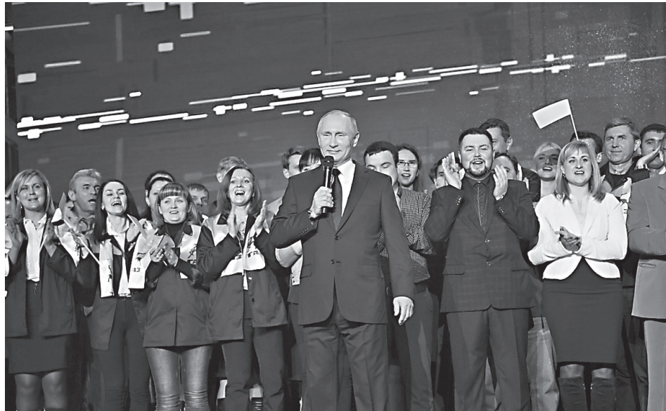
Президент России В.В. Путин во время посещения Горьковского автомобильного завода

ная Церковь, и в Армении, где практически нет русского населения). Заметим, что Путин пригласил этих архиепископов и специально встретился с ними. Единая Русская Православная Церковь это ведь и есть та главная, нерушимая скрепа, что держит единство русского мира вопреки всем развалам СССР и любым раздраям с той же Украиной.