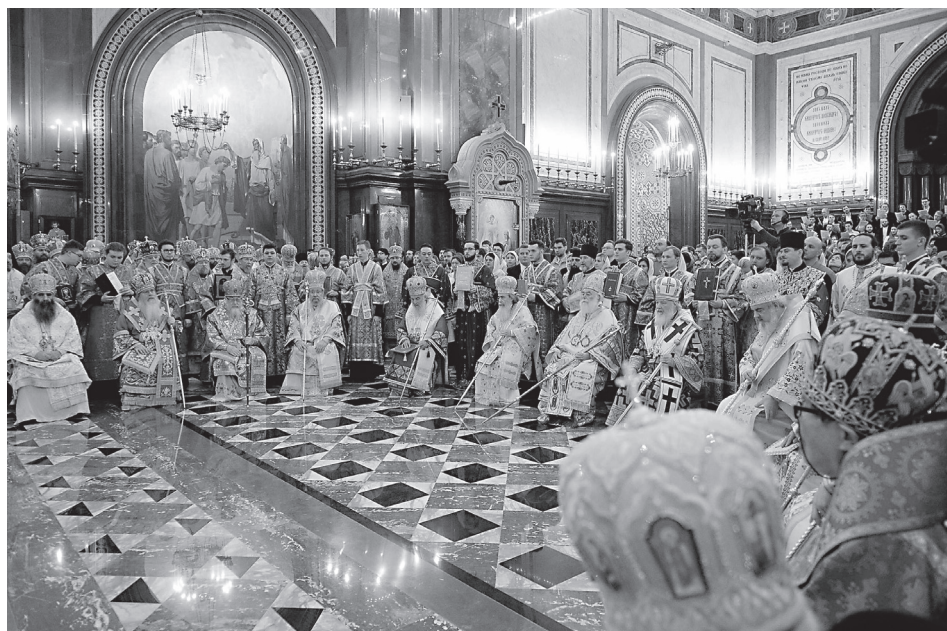
Праздничное богослужение в Храме Христа Спасителя

делом, показывать вечную новизну благовестия Христова, демонстрировать, что именно в следовании Христу — истинный протест, уход от трафаретного поведения, навязанного секулярным миром. Для молодежи, более чем для какой-либо другой возрастной группы, важна идея о том, что христианство — религия свободы, а не религия запретов, кроме запрета греха, и что те или иные предлагаемые христиану самоограничения нужны лишь потому, что помогают нам обрести полноту жизни и осознать, что есть подлинная любовь, которая не пресекается окончанием физической жизни, но переходит в вечность.