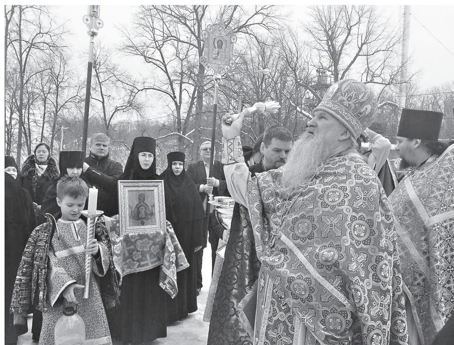
Во время крестного хода

Поэтому первую частичку мира, которую я могу преобразить и привести к Богу, это я сам. Все наши протесты, выступления должны быть не против коррупции и чего-то там еще. Они должны быть направлены против собственного греха. Вот против