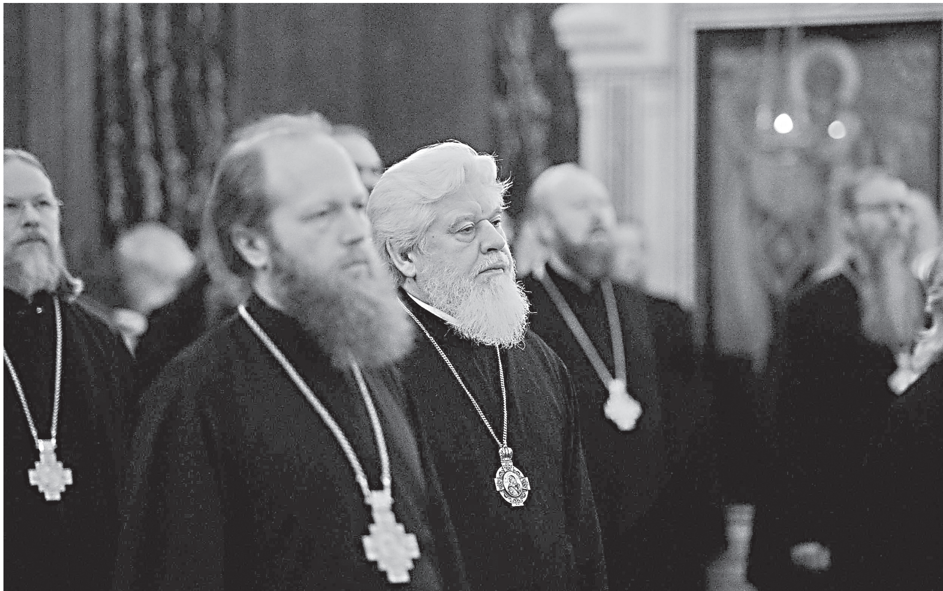
Участники Архиерейского Собора, проходящего в Москве 29 ноября - 2 декабря 2017 г.

В этом году мы вспоминаем начало, ровно век тому назад, гонений на Русскую Православную Церковь, которая в XX веке явила всему миру сонм мучеников и исповедников, чья кровь, по определению древнего апологета Тертуллиана, является «семенем христианства». Главное сокровище и наследие, переданное нам новомучениками и исповедниками Церкви Русской, — это их любовь ко Христу и к ближним, ради которых они положили свою душу (ср. Ин. 15, 13). Мы живем сегодня в совсем других условиях, намного более благоприятных. Но мы призваны следовать примеру новомучеников в их деятельной любви к Богу и людям. Наша любовь к самим новомученикам должна выражаться в сохранении живого свидетельства об их подвиге.