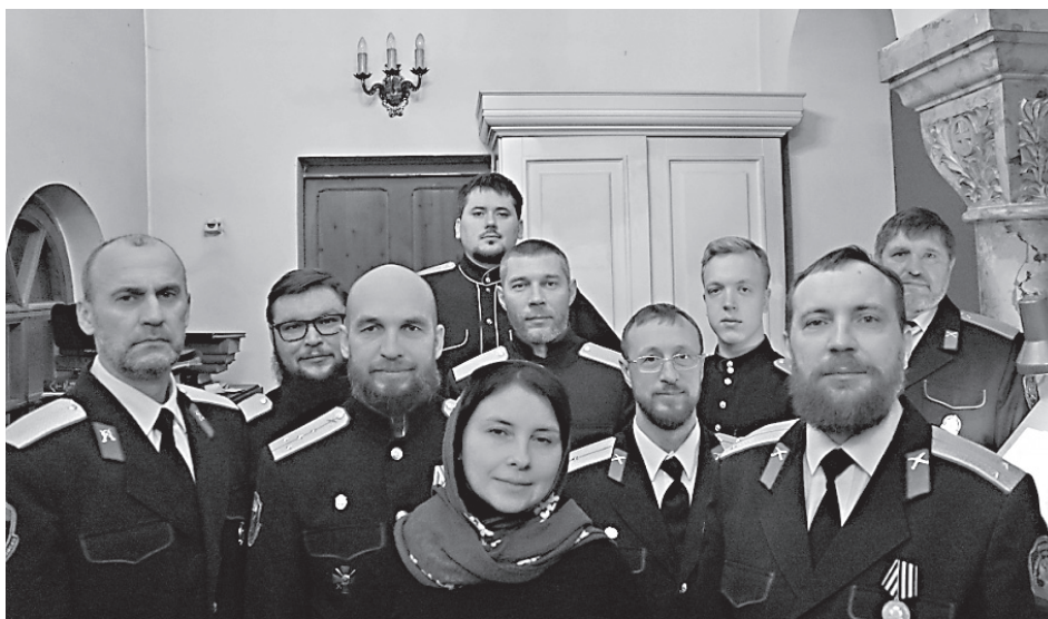
Хор «Волжские станичники»

Следует отметить, что выбор места для будущего храма был весьма смелым, поскольку среди москвичей Ходынское поле пользовалось дурной славой. Ещё свежа была память о трагедии, разыгравшейся 30 мая 1896 года, в день проведения на нём народных гуляний в честь коронации государя Николая II. За несколько дней до торжества было объявлено, что во время праздника намечена раздача сувениров и бесплатных угощений. Правительством Москвы было заготовлено для этого случая 400 тыс. кулчков, в каждом из которых находилась эмалированная кружка с императорским вензелем и некоторое количество сладостей и оре-