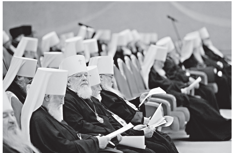
В зале церковных соборов

Единство же, являемое Церковью, пролегает поверх преходящих барьеров и разделений. Это единство вечное и вневременное, нетленное, всегда актуальное и никогда не устаревающее — единство, о котором сам Богочеловек Христос Иисус молился Своему Небесному Отцу. В свете этого в публичном