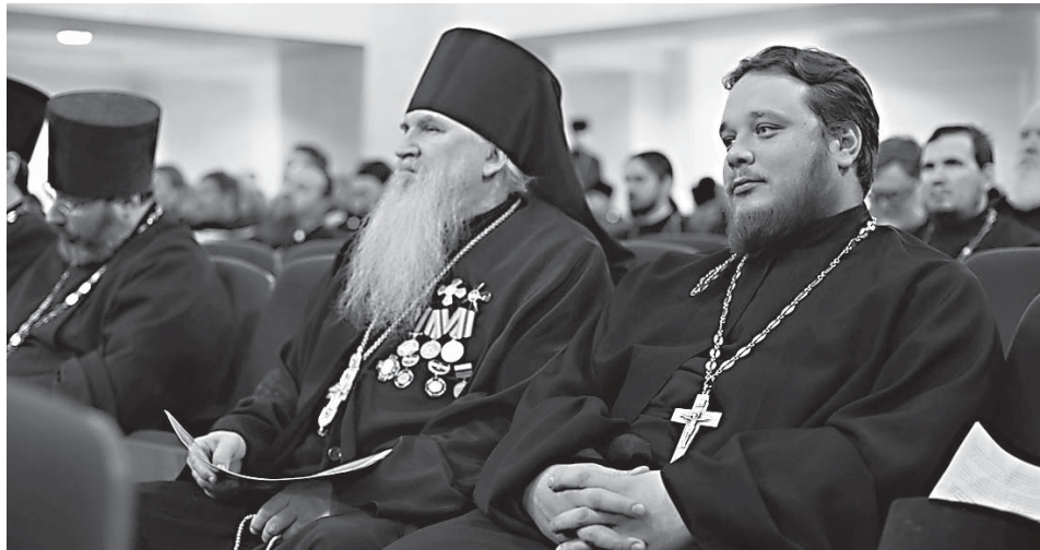
В зале заседания