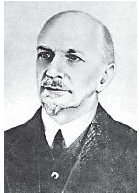
Иван Александрович Ильин

В нем гудение далеких колоколов и серебро ближних колокольчиков. В нем ласковые шорохи и хрусты. В нем травяные шелесты и вздохи. В нем клекот, и