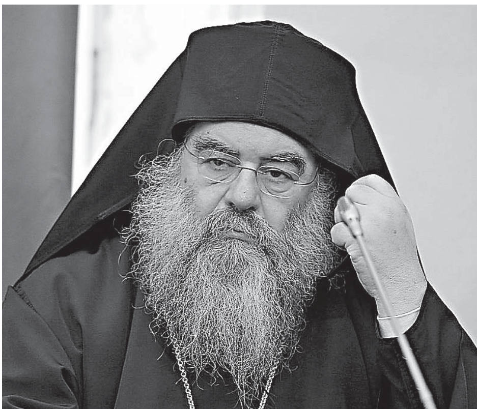
Митрополит Лимассольский Афанасий

И нам надо убедить другого – молодого человека, ребенка, юношу, – что если тебе что-то нравится, это