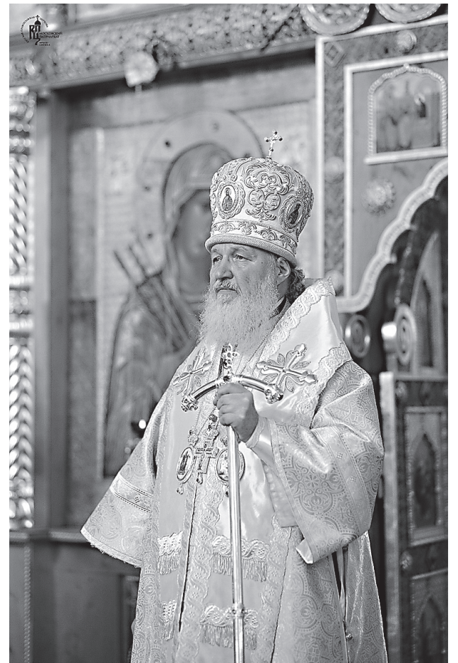
Патриарх Московский и всея Руси Кирилл

— Не всем, однако, хватило революции, — на гражданской войне,