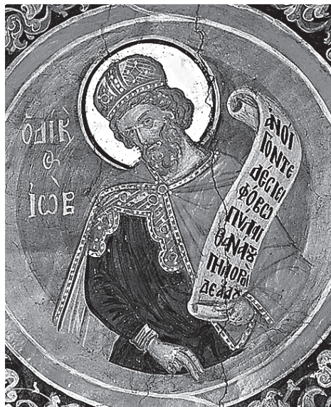
Св. Иов Многострадальный

Святейший Патриарх Кирилл ставит задачу увековечить память за Христа пострадавших в XX веке. А как это сделать? Прежде всего, службой и молитвой. В нашем Заволжском Свято-Ильинском женском монастыре освящен храм в честь священномученика Константина (Сухова), где мы совершаем все богослужения, связанные с новомучениками, с царственными страстотерпцами. Пересматривая синодики, ставим на первые места новомучеников и исповедников, чтобы им служить все-