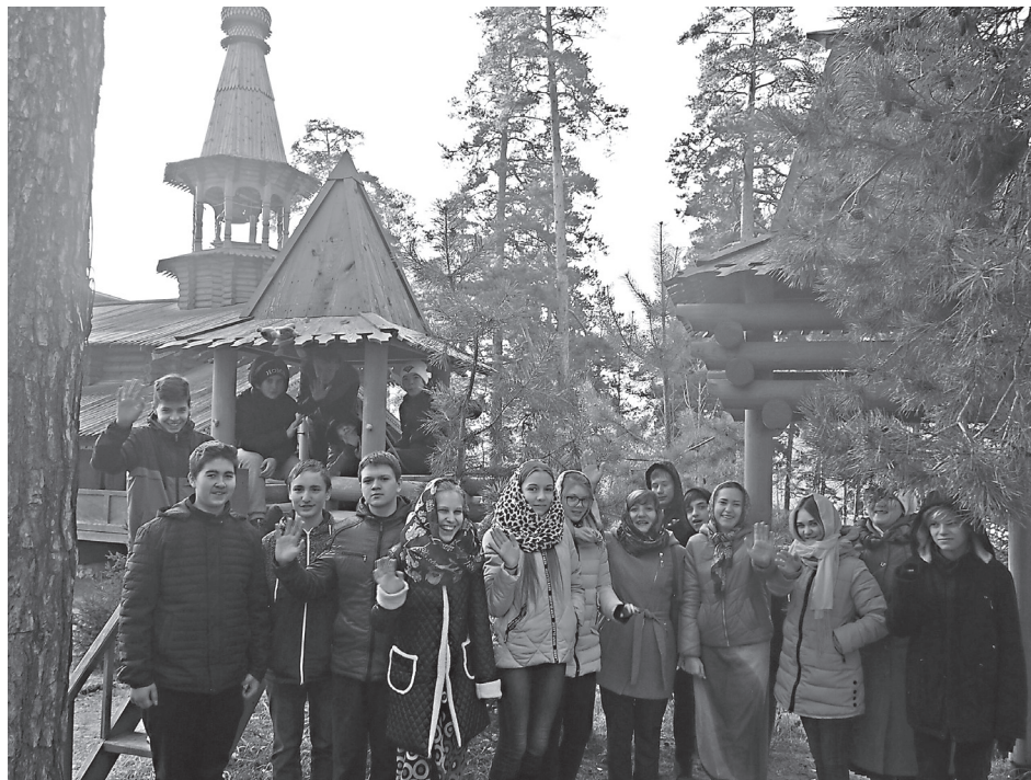
Паломники в поселке Прибрежном

Наш маршрут начинается с паломничества в поселок Прибрежный — в церковь святых Новомучеников и Исповедников Российских. Выходим из автобуса и оказываемся перед вну-