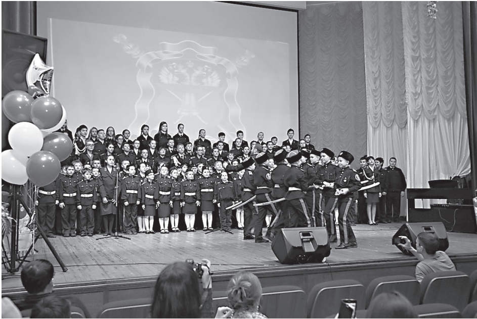
Выступают казацкие кадеты