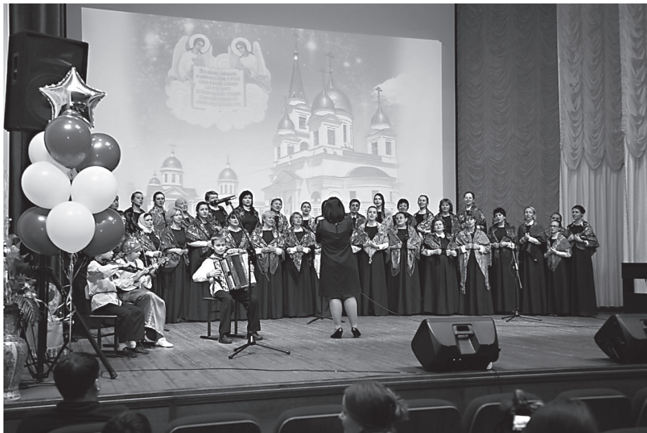
На сцене - хор «Союза православных женщин» Самары «Анастасия»