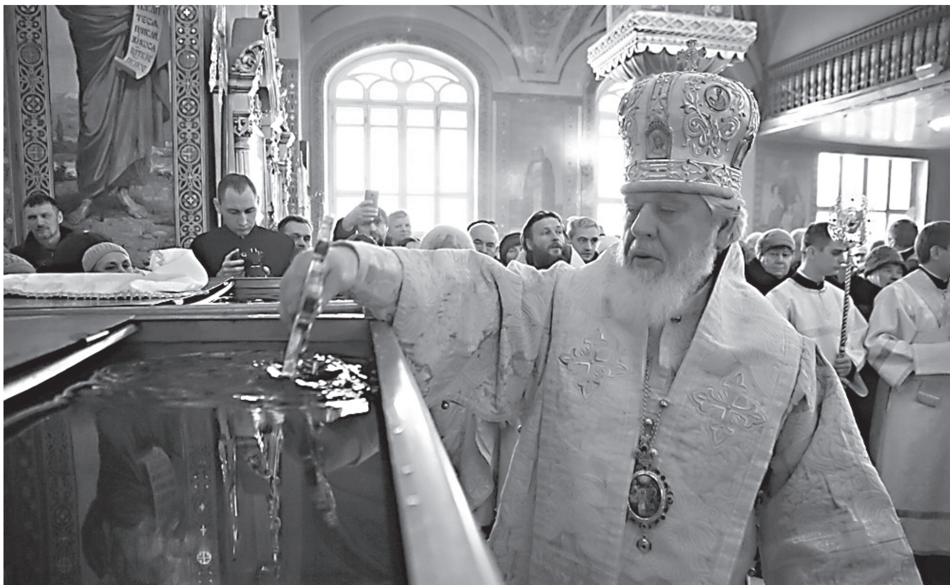
«Во Иордане крещающуся Тебе, Господи...»

Мы празднуем сегодня то, что апостол описал удивительными словами: велия благочестия тайна — Бог явился во плоти (см. 1 Тим. 3:16). В этом смысле праздник Богоявления и праздник Рождества по своему содержанию и духовному значению составляют единое целое. Мы празднуем пришествие в мир Спасителя, через Которого явилась благодать Божия всем человекам. А зримым проявлением этого явления Божественной благодати стало Крещение Христа Спасителя во Иордане, сошествие на Него Святого Духа.