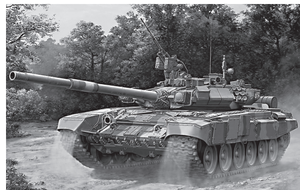
Основной боевой танк Т-90