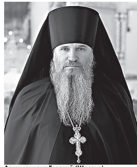
Архимандрит Георгий (Шестун)

XX век доказал, что есть в мире народ, который может сохранить и до конца через бесовскую ярость мира пронести свою веру. Идти по пути Христа на