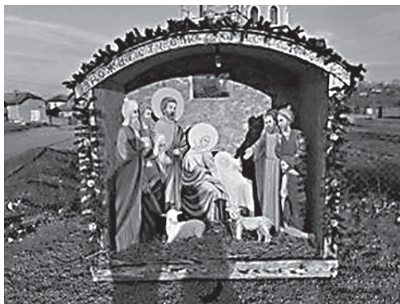
Вертеп возле храма

Апостол Павел пишет ученику Тимофею, предчувствуя свою близкую кончину. Если бы мы имели могилу