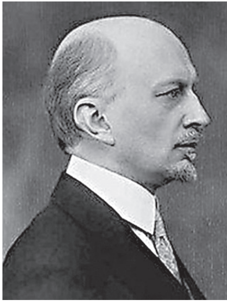
Иван Александрович Ильин