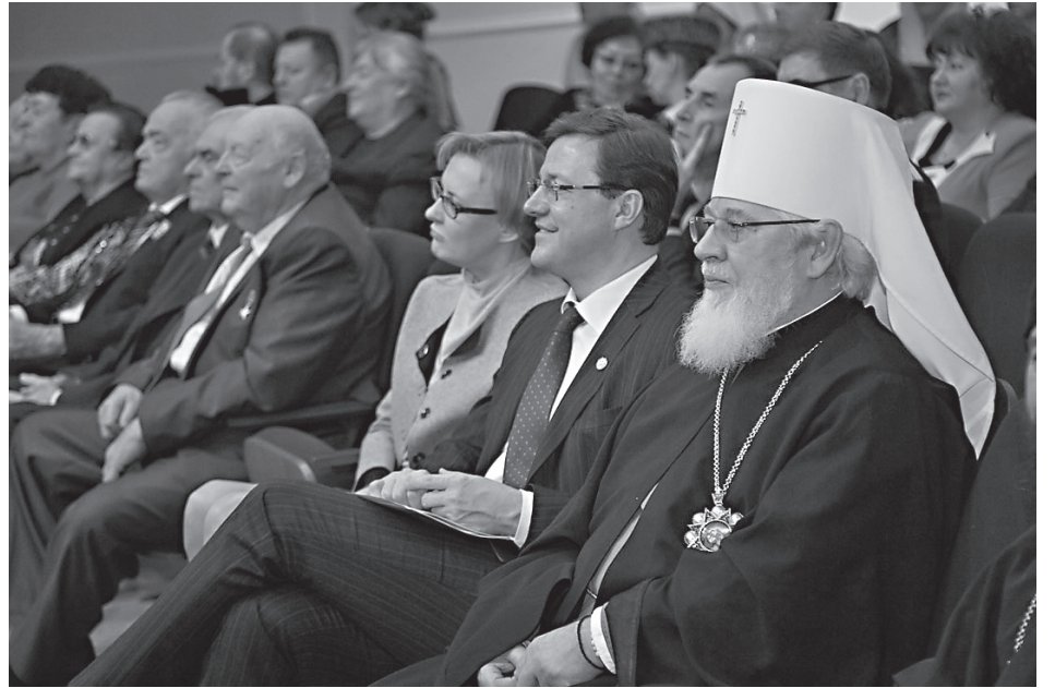
В зрительном зале

Другая проблема — помощь бездомным и малоимущим. Необходимо консолидировать работу по сбору продуктов питания. Мы проводим ее совместно с Народным фронтом, Елисавето-Варваринским сестричеством, Фондом культурного наследия, другими организациями. Финансирование этой работы следует осуществлять не только за счет бюджетных средств, но и привлекать доброты — частные строительные