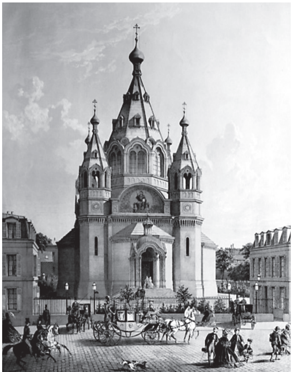
Собор Александра Невского в Париже

левой руки красовалось огромное позолоченное кольцо; на последнем же суставе безмянного... настоящее золотое... А чтобы выставить напоказ и другие драгоценности, он обнажил до самого плеча правую руку, украшенную золотым запястьем и еще скрепленным сверкающим бляхой браслетом из слоновой кости». Свои несметные богатства вольноотпущенник, или, что то же, либертин, Трималхион, по его собственному признанию, стяжал тем, что «четыренадцать лет по-женски был любезным» своему хозяину, который, будучи бездетным, в благодарность за услуги раба завещал ему свое состояние. Для тех, кто отвык от чтения, можно рекомендовать фильм Ф. Феллини, который так и называется «Сатирикон». Толчком к его созданию послужила режиссеру «сладкая жизнь» современных ему уже не либертинов, но либертарианцев.