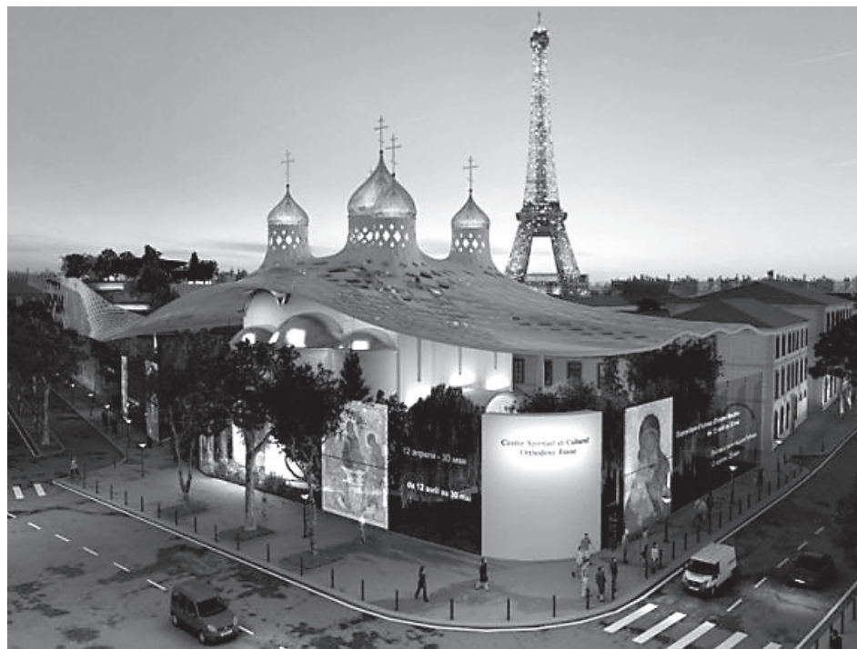
Проект Духовного и культурного Русского центра в Париже

В действительности, однако, силы, господствующие на Западе, отнюдь не склонны ставить христианство и «постхристианство» на одну доску. Те политики, которые правят в современной постхристианской Европе, бегут, если прибегнуть к известной поговорке, как от ладана, от всякой хотя бы и самой деликатной и робкой попытки обозначить исторически бесспорную преемственную связь «Европы», что в данном случае значит собственно Европейский Союз, со своим прошлым - с Европой христианской.