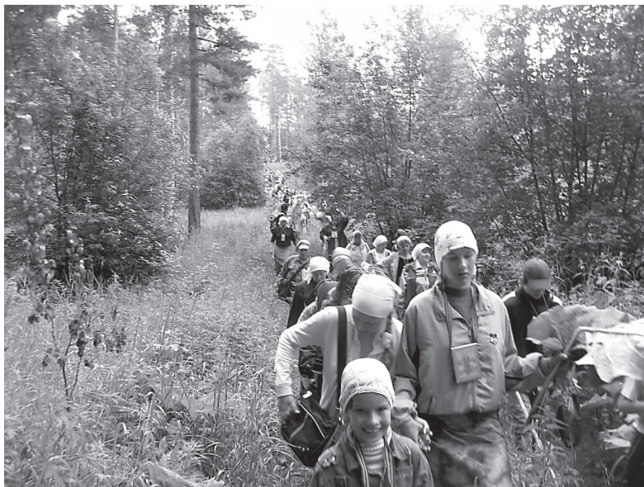
Лесами и полями

В Царевщине ко мне присоединяется подруга, подъехала из Самары. Со школы дружим, и вдруг узнаю, что у