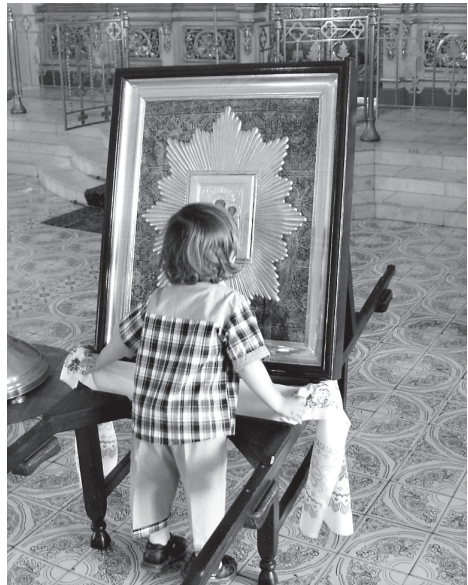
«Пресвятая Богородица, помогай нам!»

Всю ночь на святой источник сли ручейки народу – понимали, что завтра не успеем все одновременно туда попасть. Я где-то в пять утра пошла, свежо кругом, а вода в источнике теплая. И так каждый раз. Хоть осенью, хоть зимой – не ледяная она там. И всегда над дверями купальни птички поют. Вместе с нами прославляют Богородицу. Утром вокруг храма Пресвятой Тро-