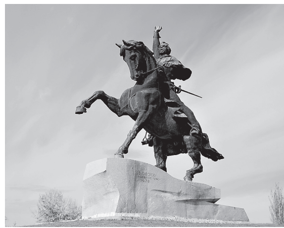
Памятник основателю города А. В. Суворову в Тирасполе

Действия будут нацелены на захват заложников среди мирных граждан и семей военнослужащих, на огневое воздействие по