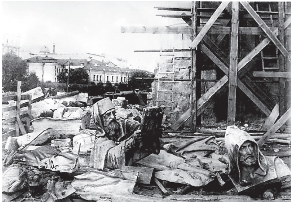
Плоды революции (после разрушения Храма Христа Спасителя)