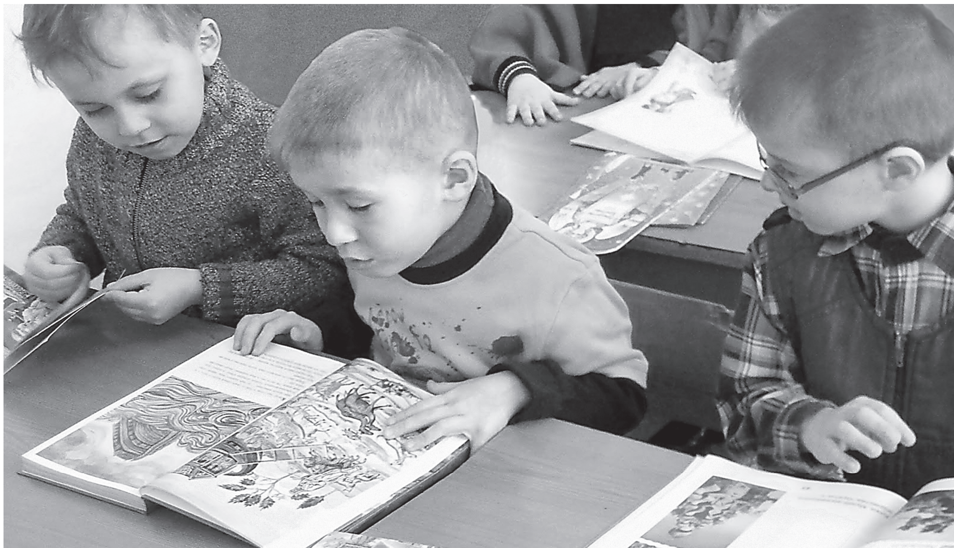
Сила духа - в правде слова

Значение литературы для развития нашей страны невозможно умалить. Русская духовная культура всегда была литературоцентрична. Конечно, это не значит, что у нас не развивались другие виды искусства, но тон задавался именно книжным словом. И в этой особенности нашей культуры – ее самобытная мощь. Человеческое общество способно существовать и развиваться только тогда, когда оно сохраняет наследие предшествующих поколений. Это наследие можно разделить на материальное и нематериальное. Каждый день мы пользуемся благами, созданными до нас: используем дороги и здания, живем в городах, отстроивших нашими предками. Эта материальная культура не только создает нашу среду обитания, но и дает нашему обществу основу для новых изобретений, предоставляя знания о технологиях и другую необходимую информацию для творчества. Ведь невозможно разработать, к примеру, новую модель автомобиля, не представляя устройство двигателя. Но есть и другой вид наследия. Это – наследие духовное. Нравственные ценности и идеалы, которые через века направляли наш народ по историческому пути, в особенности касающиеся мировоззрения русского человека и его национального самосознания, эти нравственные ценности и ориентиры были фундаментальными, основополагающими. Без них не было бы русской культуры, а в каком-то смысле – и русского человека и государства.