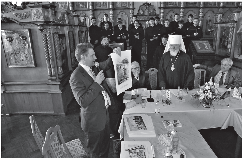
Дар Самарской епархии - 100 гравюр, посвященных истории болгарского народа

В нашей стране одновременно сейчас живут советские люди и русские люди. Думаю, что и у вас живут советские болгары и болгарские болгары. Они отличаются отношением к вере, к Православию. У нас очень много людей, которые говорят: «Я человек православный, но в церковь не хожу».