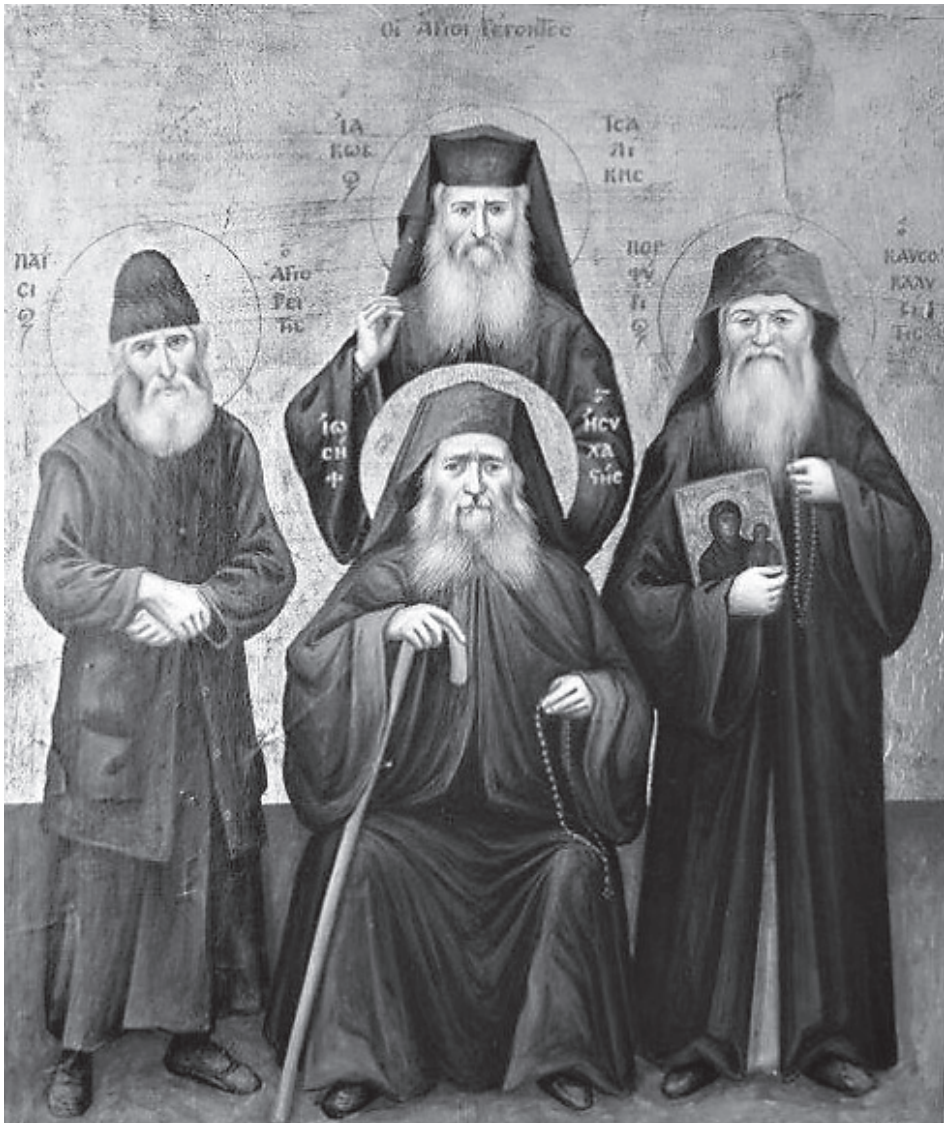
Старцы Паисий Святогорец, Иаков Цаликис (стоит), Иосиф Исихаст и Порфирий Кавсокаливит

чтобы привести людей в храм. Какова должна быть правильная миссия Церкви?