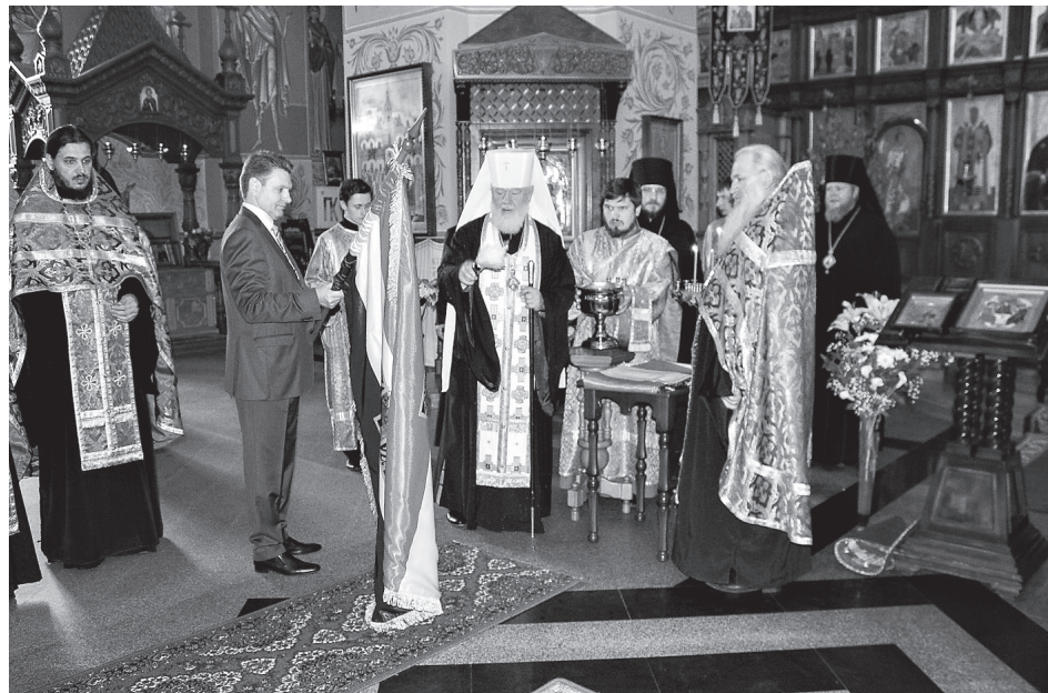
Освящение копии легендарного Самарского Знамени

- Мы знаем, что, используя какие-то понятия и слова, мы не всегда даем