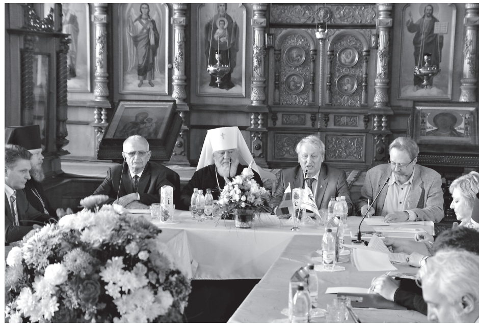
Участники круглого стола за работой

К чему я об этом заговорил? Потому что главное, что лежит в основе наших народов, это Православие и Христос Спаситель. А умереть за Христа Спасителя есть высшая добродетель и высшее предназначение христианского подвига, христианского мученичества. И произошла уникальная вещь: любовь между русским и болгарским народами, как, кстати говоря, и любовь русского народа к сербам, очень часто и даже в подавляющем большинстве случаев идет вразрез с политической ситуацией. То же самое произошло и после освобождения Болгарии, когда, мягко говоря, на болгарский престол пришли люди, не симпатизировавшие России. О чем сам болгарский народ сильно переживал. Ведь сколько потом было болгар в русской императорской армии, и генерал Радко Дмитриев, и многие другие, кто воспринимал, чувствовал Россию как свою вторую Родину. Эта политическая линия, враждебная России, которая возникала в русско-