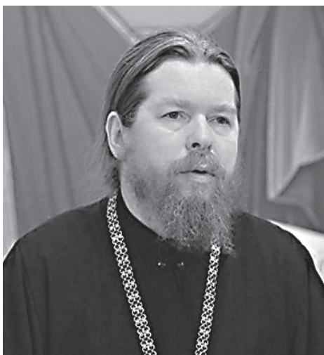
Епископ Егорьевский Тихон (Шевкунов)

Инициатива регулярно знакомить российских школьников с театральными постановками на основе произведений русских классиков связана с «удручающим знанием» учащимися отечественной литературы, заявил журналистам глава Патриаршего совета по культуре епископ Егорьевский Тихон (Шевкунов) по итогам заседания президиума Общества русской словесности, как сообщает РИА Новости.