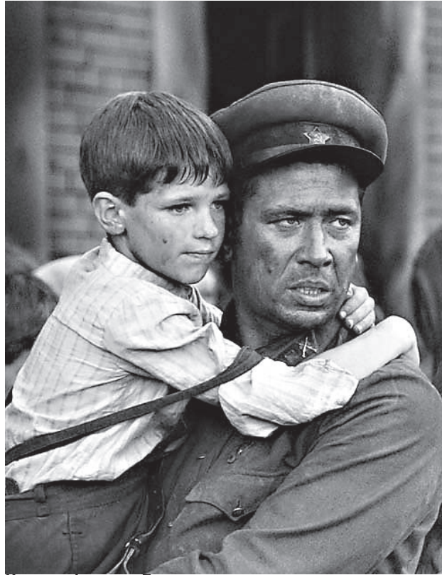
Кадр из фильма «Брестская крепость»

- Раньше у меня был страх перед детскими домами. Во мне серьезно засел советский стереотип: за детдомовским забором - забитые, больные, нелюдимые дети... Но, оказалось, по-человечески это такие же дети, как и все остальные. Только в тяжелых жизненных обстоятельствах. Стереотип нужно разбивать.