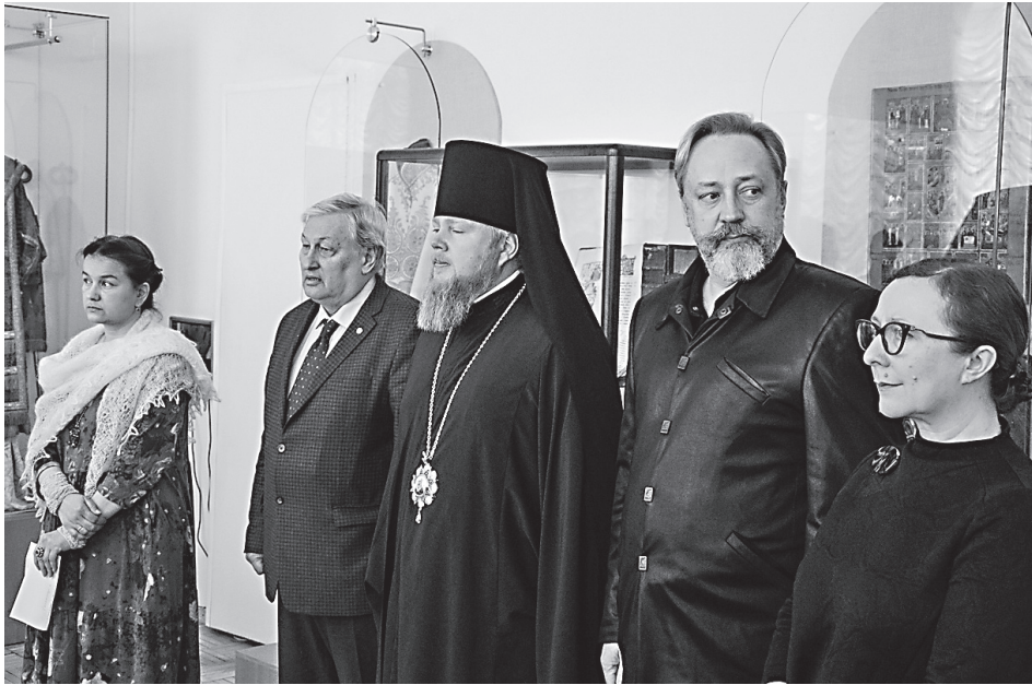
Открытие фотовыставки «Исход русских на Голгофу»

Вся сербская культура - это огромный вклад наших людей, ушедших из советской России. Весь центр старого Белграда построен нашими архитекторами, мы создали там целые отрасли естественных и гуманитарных наук. Не мы, мы ничего не создали, а те, кто ушел. Аналогичная ситуация в Болгарии, там тоже был цвет русской эмиграции. Даже балет в Сербии появился благодаря русским. Даже возродили там женское монашество. Представляете, 6 монахинь из Лесневского монастыря (православный монастырь во Франции, созданный русскими эмигрантами) получили в свое пользование монастырь, и после 500-летнего перерыва от них возродилось женское монашество. Что ни возьми, например, спорт, и волейболисты, и пловцы, и чемпионат Европы, мы подарили нашим цивилизационным конкурентам - 3 миллиона человек. И это считалось в порядке вещей. Но это же ужасно. На самом деле это безобразие.