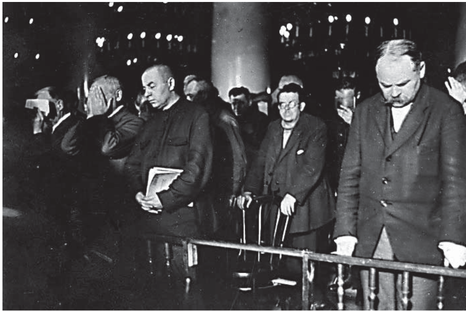
Обвиняемые в Шахтинском деле на процессе в Москве

К 90-летию начала Второго Русского Холокоста