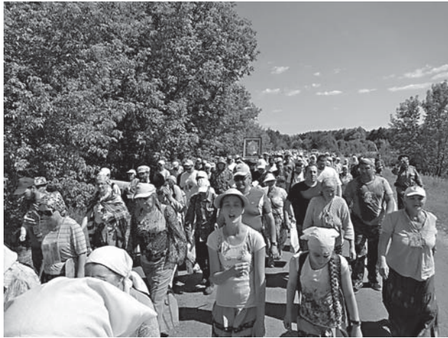
«Пресвятая Богородица, спаси нас!»