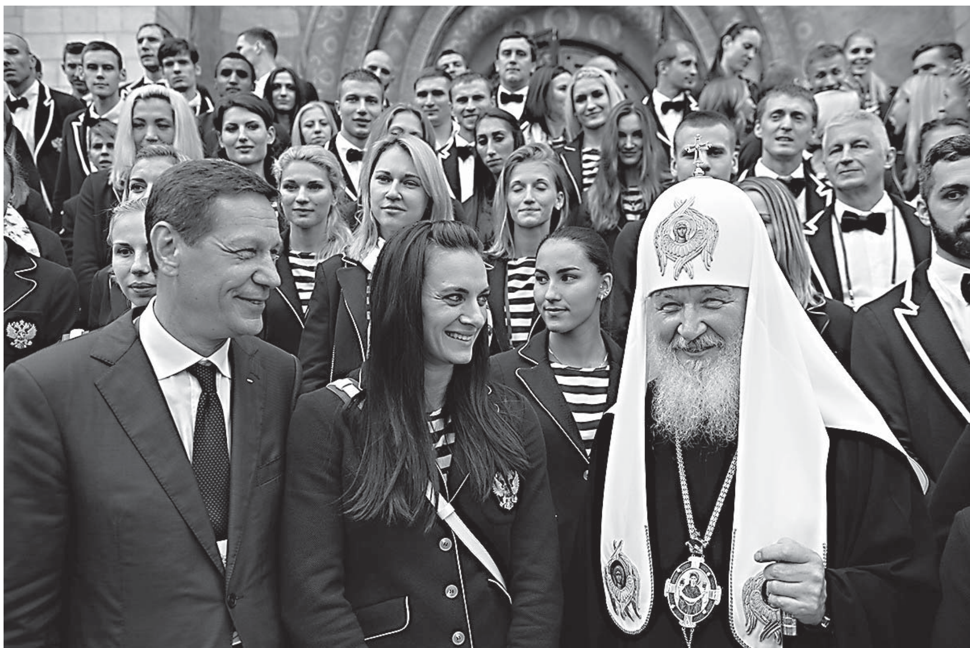
Патриарх Московский и всея Руси Кирилл во время встречи с российскими спортсменами

К онечно, главная тема, которая меня беспокоит и волнует, — это духовное состояние нашего общества, наших людей, особенно молодежи. Существуют замечательные примеры подлинно благородного поведения, проявления любви к Отечеству, силы, мужества. Но одновременно мы встречаемся, к сожалению, и с таким образом мысли и образом действий, с которым невозможно связывать никакие жизненные успехи, и такого рода образ мыслей, образ действий становится все более и более распространенным среди молодежи.