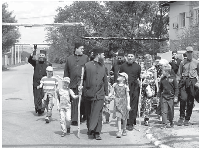
Три поколения паломников