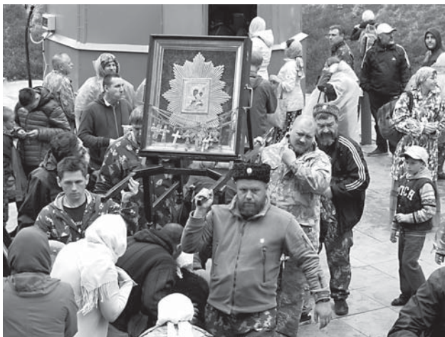
Надо же пройти под иконой