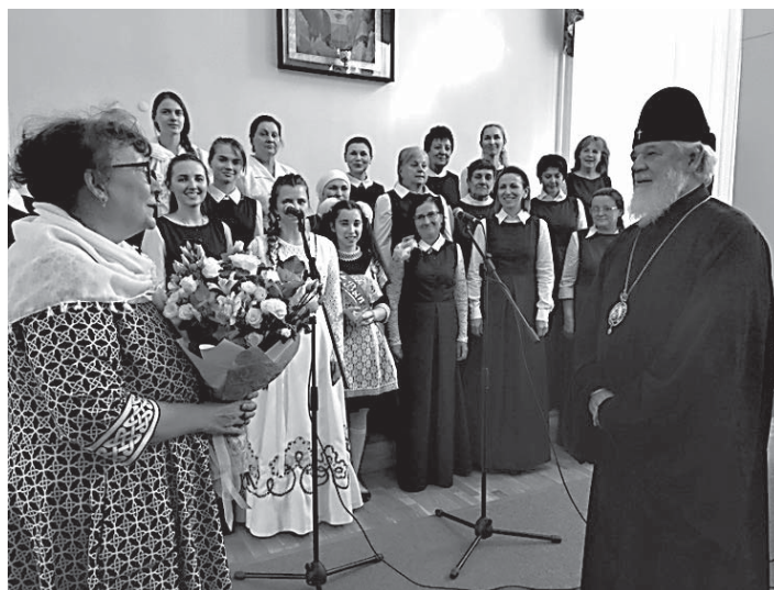
Цветы от православных женщин дорогому митрополиту Сергию

Затем общение продолжилось за совместным чаепитием.