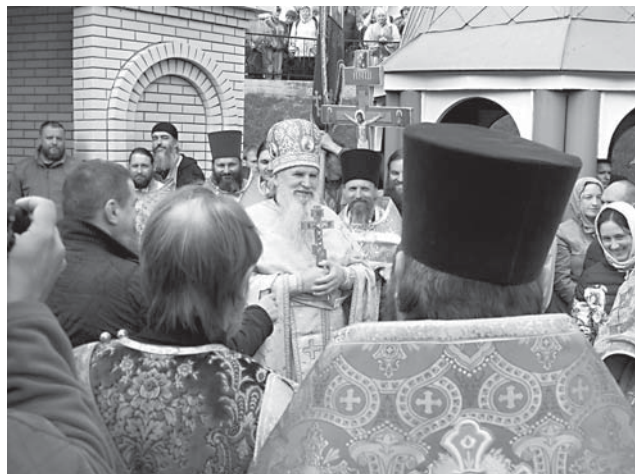
У святого источника

РАССКАЗ О ДВАДЦАТИ ПЕРВОМ КРЕСТНОМ ХОДЕ В СЕЛО ТАШЛА К ЧУДОТВОРНОЙ ИКОНЕ