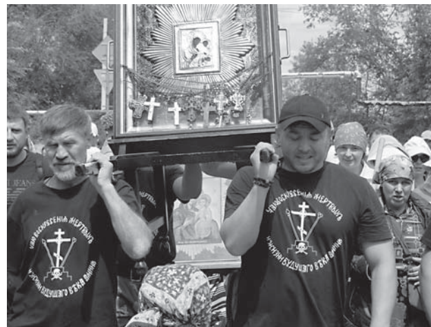
Казаки - впереди