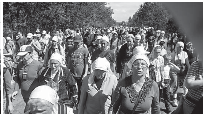
«Единым сердцем, едиными усть»...