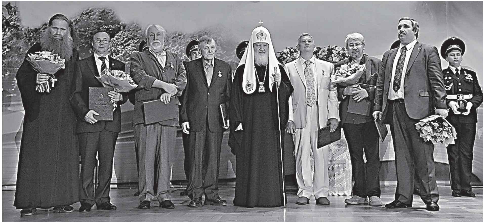
Святейший Патриарх Кирилл с лауреатами Патриаршей литературной премии им. святых равноапостольных Кирилла и Мефодия

пушкинского отчаяния. Поэт оказался в большой духовной беде, он потерял смысл жизни и уже почти потерял самого себя... Давным-давно, ещё будучи семинаристом, Василий признавался в одном из писем к отцу: «Иногда, один с моею скукою, ходя по обнажённому саду, погружаюсь я в мрачную задумчивость. И на всяком предмете, на который устремляется мысль моя, читаю слова мудрого: «Суета сует». Митрополит знал, что такое уныние, и, быв искушён сам, мог и искушаемому помочь.