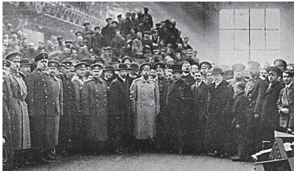
Государь Николай II на Путиловском заводе

При этом он, несомненно, блестяще владел материалом, решения принимались им сознательно и последовательно. Сейчас опубликованы Особые журналы Совета министров Российской империи. Это многотомное издание, где изложены решения по основным ключевым вопросам, принятые Советом министров в 1907-1917 годах. На документах стоит резолюция царя. Видно, что он их внимательно прочитал и в 90% случаев написал «Согласен» или «Согласен с мнением большинства». Это естественно, так как все решения готовила команда профессионалов, и они серьезно прорабатывались. Но есть ряд документов по важнейшим вопросам, где стоит резолю-