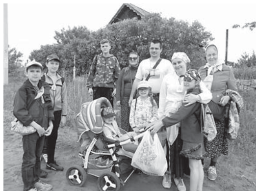
Одна большая семья