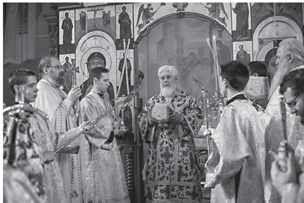
За Божественной литургией

Показался белый клубок Владыки. Он шел, благословляя окружающих его людей, к нему тянулись ветераны и молодые, генералы и студенты, простые труженики и облеченные властью. Мы тоже поспешили взять благословение нашего Архипастыря. Благословив нас, он остановился и стал неожиданно рассуждать: «Уваровская триада «Православие, самодержавие и народность» уже не отражает