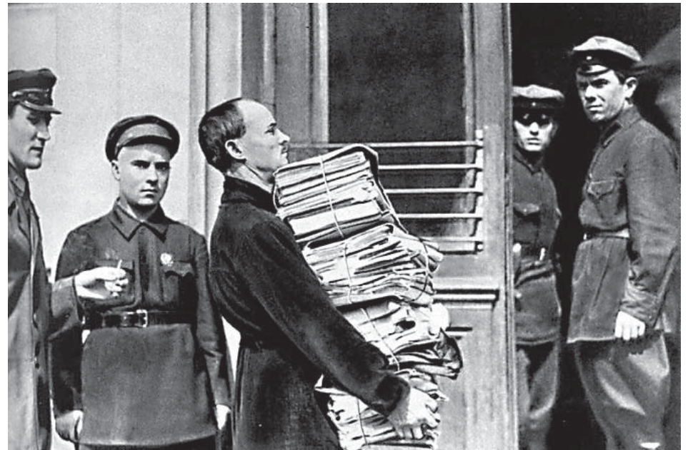
Доставка папок с документами по Шахтинскому делу на процесс

«Без Иванов Михайловичей с их чувством достоинства и долга всякое государство обречено на гибель изну-