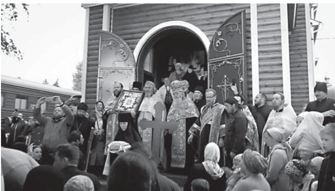
Последние метры пути. Встреча в Ташле