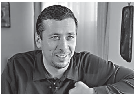
Актер Андрей Мерзликин

Собеседники затронули тему ценностей в творчестве. Андрей Мерзликин заявил о необходимости существования общей для всех системы ценностей. «Я оцениваю и жизнь, и творчество по одной системе координат. Если мы хотим быть вместе и называться обществом и государством или страной, и еще друг другу давать оценки и критерии, у нас должна быть единая