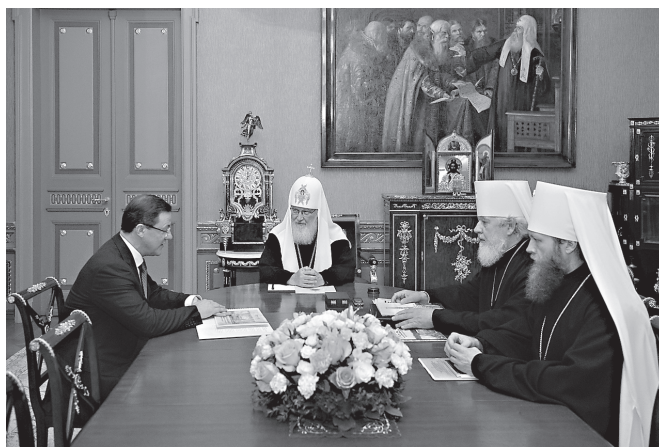
Самарские гости в Патриаршей резиденции

«Самарская митрополия занимает особое место в жизни Русской Православной Церкви, по всем показателям она выглядит достаточно хорошо — сильная митрополия, с развивающей-