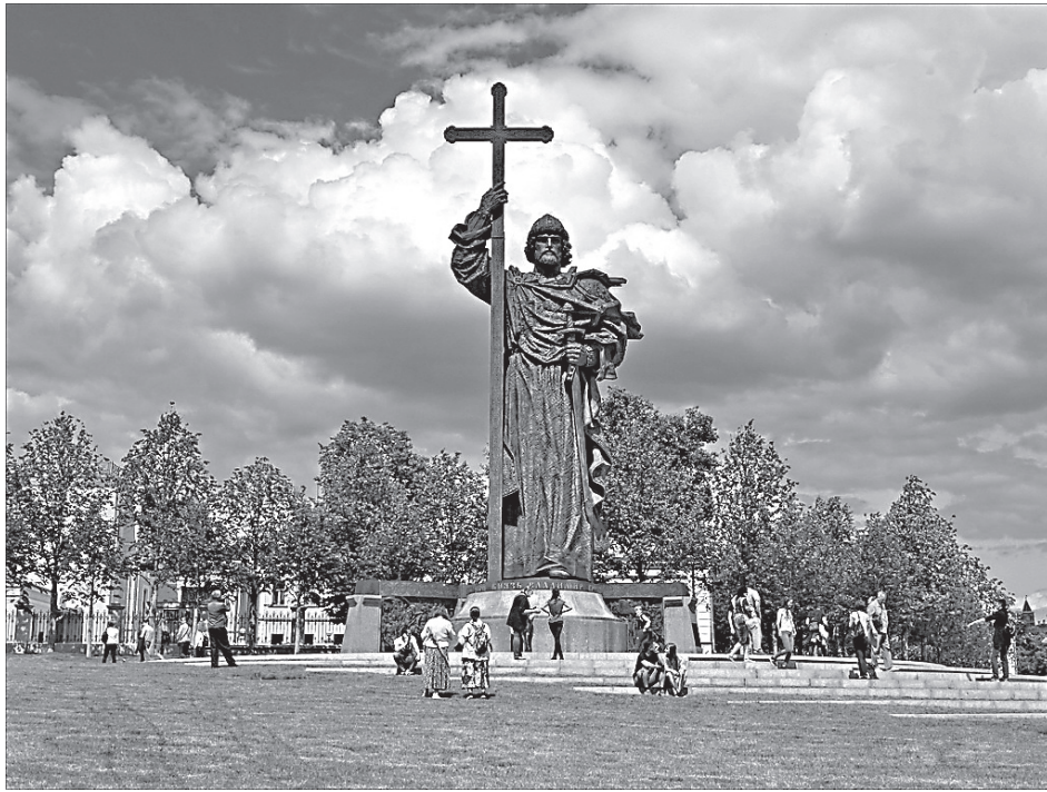
Памятник Великому князю Владимиру в Москве

В первом случае, власть в свои руки сразу же берут лидеры сопротивления,