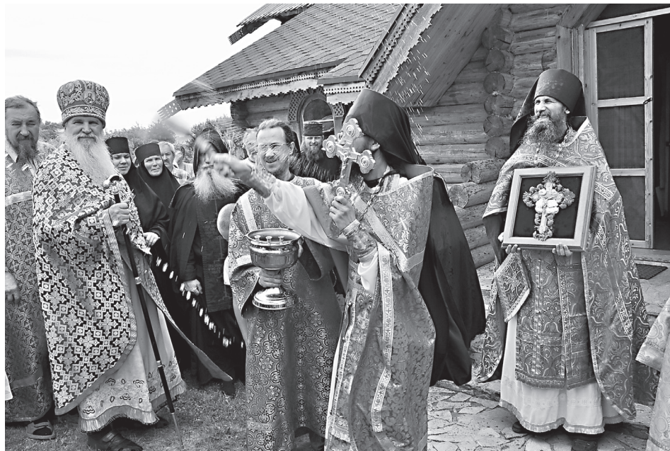
Праздничный крестный ход

Н ачало Успенского поста в Заволжском мужском монастыре в честь Честного и Животворящего Креста Господня венчается престольным праздником. Обитель находится на горе среди заповедной жигулевской природы вдали от городов и весей. Село Подгоры осталось внизу под горой, а город виднеется своими многоэтажками за Волгой и радуется сейчас отдаленностью мирских забот.