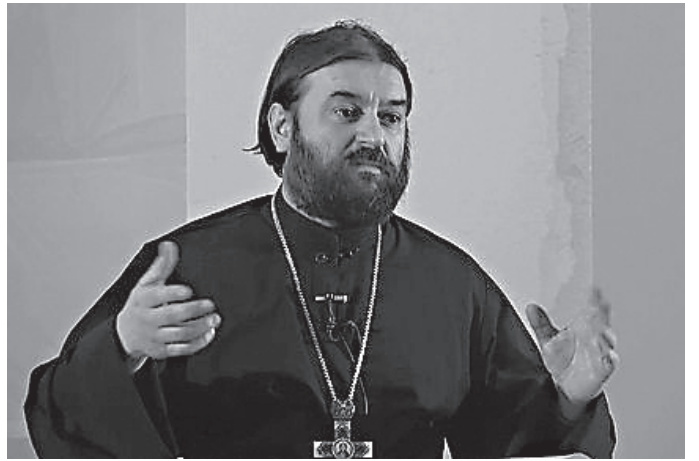
Протоиерей Андрей Ткачѳв

...Вот оно, святое, нежное, маленькое, греха не совершившее. Читай ему на ухо: «Верую во Единого Бога Отца Вседержителя...» Не жди, когда ему будет 25 лет, учи сейчас. Он ничего не поймет, но все запомнит. А когда вырастет, оно всё воскреснет у него в памяти. Те же евреи считают, что пока ребенок находится во чреве у мамы, Ангел девять месяцев читает ему Тору – страница за страницей. Потом ребенок рождается, Ангел бьёт его по лицу, и малыш