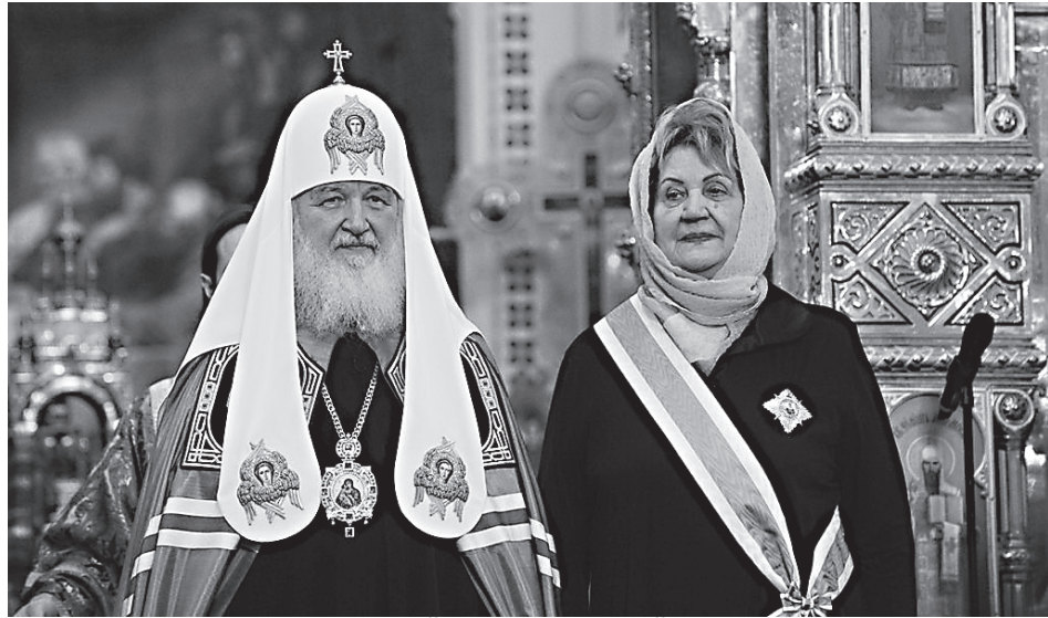
После награждения орденом Святой равноапостольной княгини Ольги I степени

которых только и возможна мирная и процветающая жизнь, или скатится на путь греха и саморазрушения.