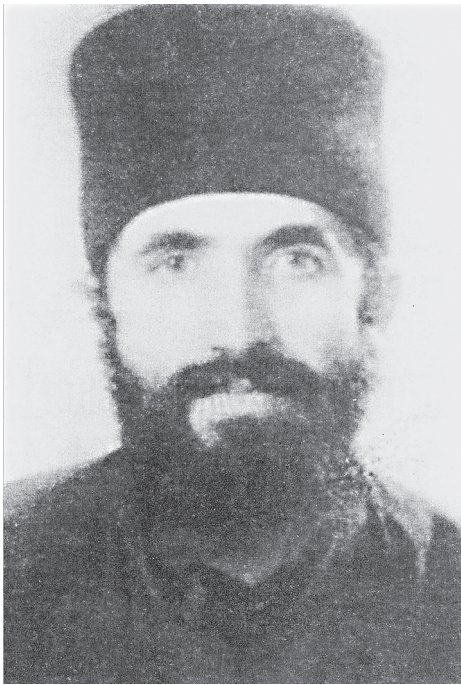
Старец Паисий Святогорец

- Прежде проси прощения у Бога за прегрешения, которые сотворила в течение дня, и уже потом думай о своей греховности в общем. Так ты смиря-