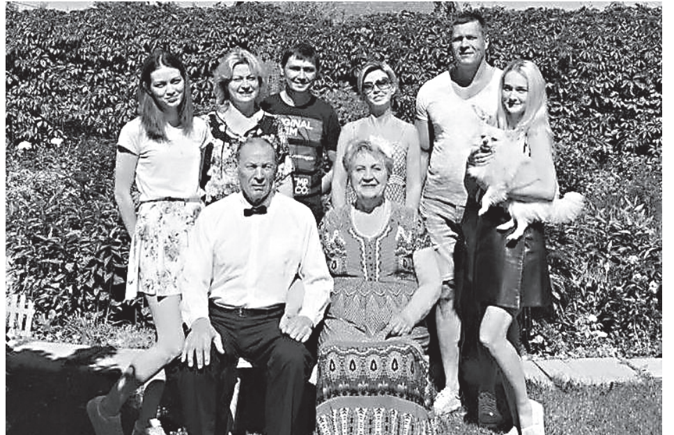
С детьми и внуками 15 июня 2018 г. в день 50-летия со дня свадьбы

— Православная женщина сегодня это не только матушки, игуменни, монахини, служительницы на приходах. Это и учителя, и ученые, и медицинские работники, государственные служащие, которые придерживаются в своей работе православных духовно-нравственных ценностей, посещают службы в храмах, сохраняют традиционную семью.