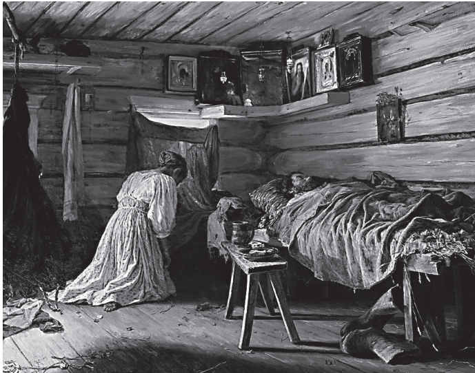
«Больной муж». Художник Василий Максимов

Может быть, потому, что сами мы в эти тяжелые моменты делаем что-то не так? Может быть, мы сами не идем туда, где эта поддержка обретается? Не хотим поднять даже малого духовного труда, ожидая, что подобное познание близости Господа должно быть нам дано как бы «на блюдечке с голубой каемочкой»? Ответ на этот вопрос ищем в Священном Писании.