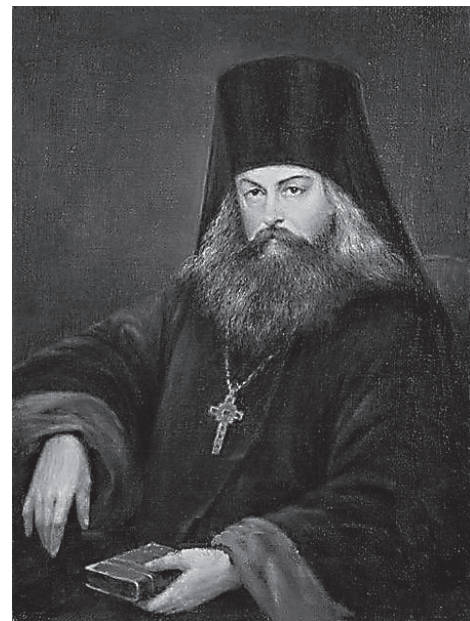
Святитель Игнатий (Брянчанинов)

Глубокие раны важны и нужны нашему религиозному опыту. Они для нас – наступившая возможность ощутить Бога и найти Его, «хотя Он и недалеко от каждого из нас» (Деян. 17, 27). Такая возможность определена Промыслом Божиим, коего свойство есть