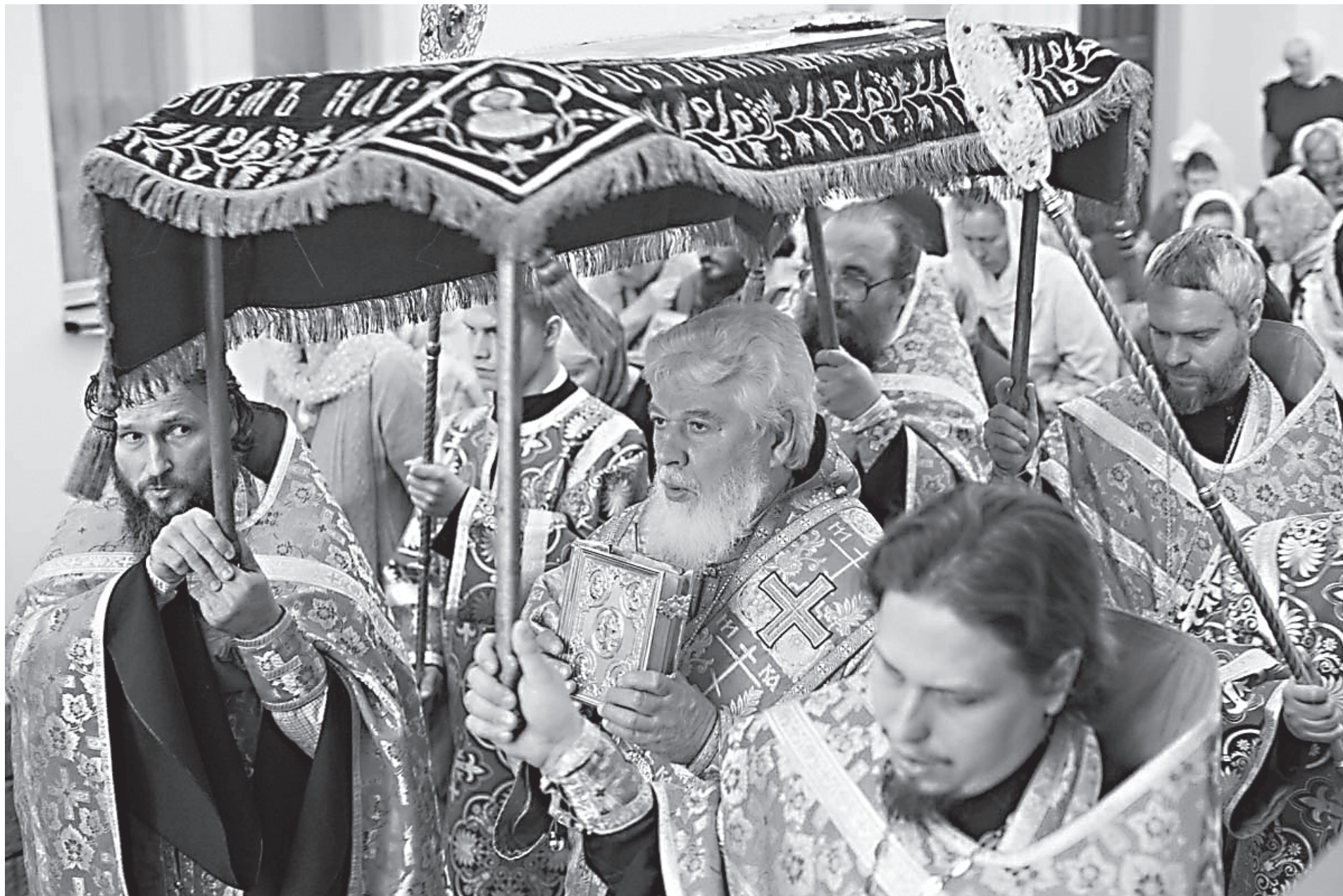
Утренняя служба погребения Пресвятой Богородицы в Покровском кафедральном соборе Самары

Мы знаем: ни материальные средства, ни даже военная мощь не способны по-настоящему уберечь страну, тем более не способны изменить народ наш к лучшему. Все, что с нами происходит и хорошего, и плохого, как говорит Священное Писание, происходит от человеческого сердца. Если люди, занимаясь политикой, этого не понимают, они совершают огромную ошибку.