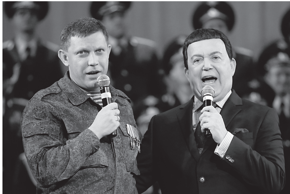
На концерте в Донецке

Захарченко был храбр, смел, решителен, прям. Возможно, ему в чем-то не хватало дипломатичности, но он к этому и не стремился. Он никогда не давал пустых обещаний и не растекался своей речью так, чтобы ни за что не отвечать. Говорил лаконично, но по существу. Его речь была для первого лица немного грубовата, но тверда, как груба и тверда скала. И люди узнавали в этом своё, родное, донбасское. Некоторые его ругали, но в большинстве уважали. Но больше всего просто любили. Потому что Захарченко никог-