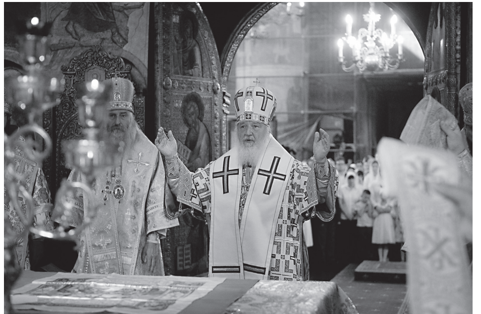
Святейший Патриарх Кирилл в Успенском соборе Кремля

Необходимо помнить: именно ощущение собственной ненужности, невостребованности зачастую толкает молодежь к поиску разнообразных форм активности, далеких от христианской нравственности. Чтобы оградить молодежь от разрушительного воздействия деструктивных субкультур, мы должны обеспечить молодым людям открытые альтернативные площадки для общения в христианском духе, которые сами по себе будут доказательством возможной жизни в православной вере и оставаться при этом полноправными и полноценными членами современного общества.