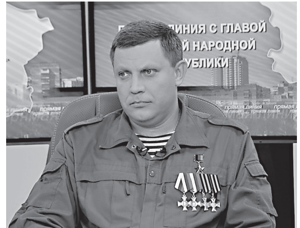
Александр Владимирович Захарченко