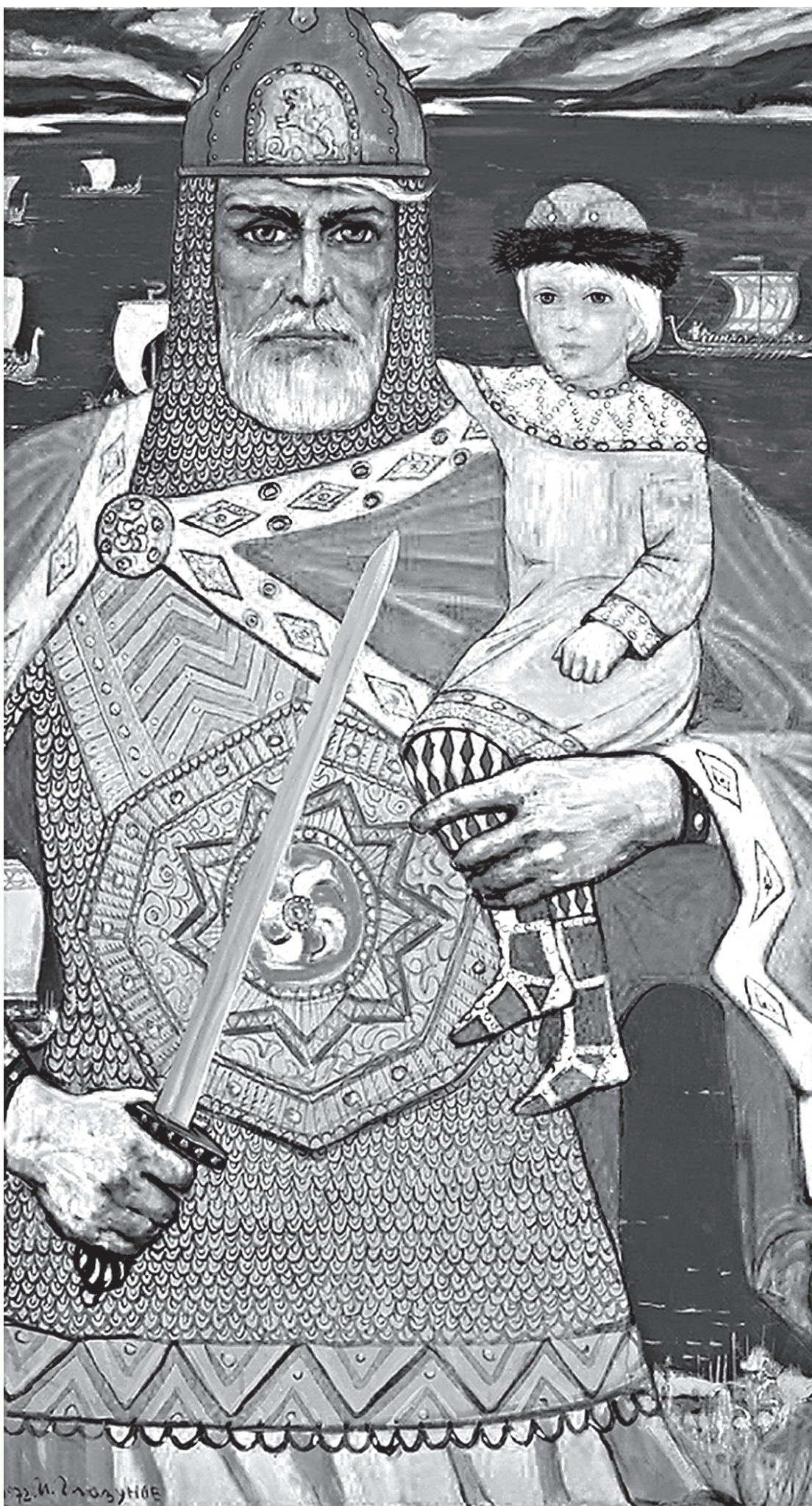
Князь Олег и Игорь, 1972 год, холст, масло

Усилиями князя Литовского западные епархии Русской Православной Церкви отторгаются от Москвы, — какие-то из них принимают унию, какие-то остаются православными, но им запрещено поминать имя митрополита Московского и всея Руси. И мы знаем, какой трудной была история западных русских епархий, находив-