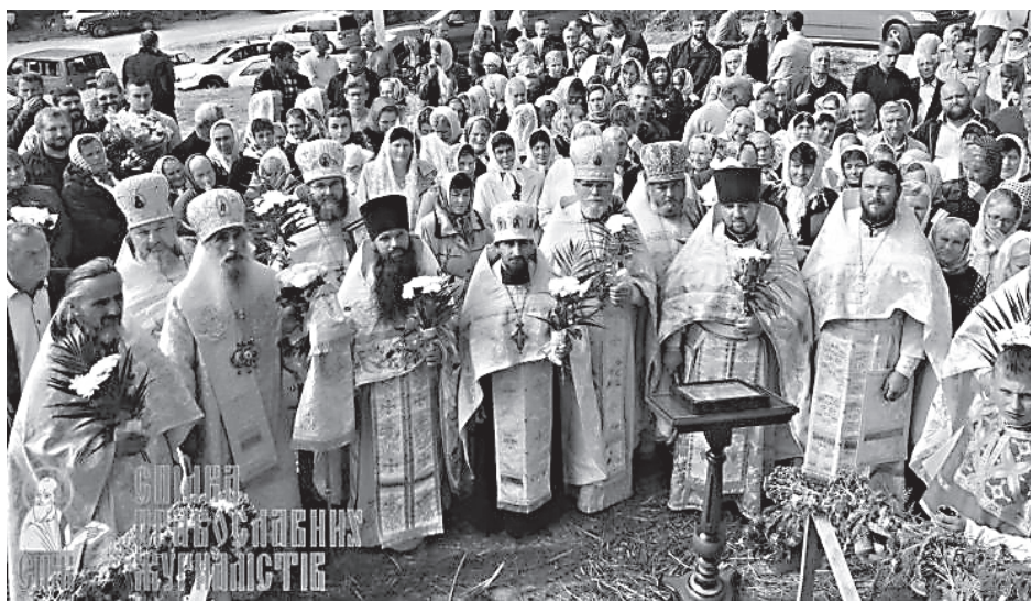
Участники Всеукраинского крестного хода за мир

Но мы закончим вот чем. Надо понять, что это некий тренд на канонизацию беззакония. То есть давайте