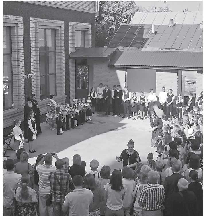
На торжественной линейке

- Нельзя срывать яблоко несозревшим. Все должно быть в свое время. Не вовремя сказанные наставления или «просвещение» в сфере взаимоотношений между мужчиной и женщиной могут сломать психику ребенка. Наша цель довести детей до окончания школы ребенком: мальчика - мальчиком, а девочку - девочкой. Нужно сохранить целомудрие в школе. Здесь мы тоже придерживаемся традиций и порядков, которые были раньше. Наши прадеды и деды были не глупее нас. Может быть, поэтому и сохранился народ, и победить нас трудно. В давние времена воспитание в этой сфере было однозначно строгое. Не дай Бог дочь начнет с кем-то встречаться или молодой человек обманет девушку. За это могли и побить очень здорово. И эта строгость необходима. Чтобы подготовить девочек к семейной жизни, мы их учим вышивать, ремонтировать одежду. А мальчики у нас строят, тоже что-то делают своими руками, приучаясь к мужскому труду.