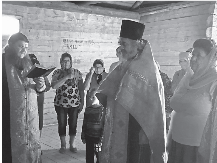
Во время молебна

Колокольцовцы благодарны жителям Красноармейского района и Самарской области, откликнувшимся