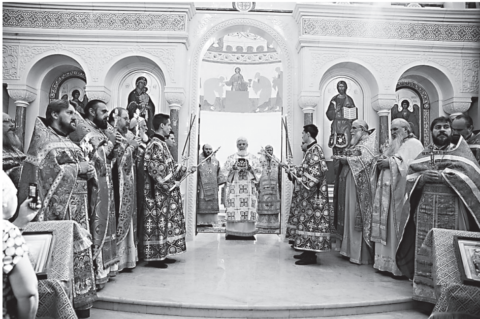
Первая Божественная литургия в Софийском соборе

23 сентября в новом величественном храме во имя Софии, Премудрости Божией была отслужена первая Литургия. Белокаменный собор вознес свой шатровый купол к небесам на живописном участке волжской набережной близ известной всем самарцам «Ладьи». Празднество было приурочено к торжествам в память 1030-летия Крещения Руси.