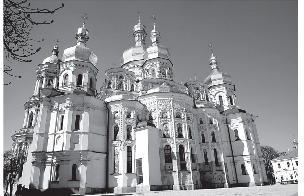
Свято-Успенский собор Киево-Печерской Лавры в Киеве