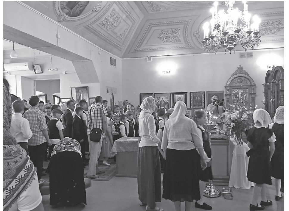
Учащие и учащиеся в домовою церкви Серафима Саровского

Сейчас усилиями активных прихожан построено рядом новое здание, которое дает возможность увеличивать количество учеников. Мы надеемся, что традиция благотворительности примет более широкие масштабы. И самое главное в этом деле - быть верующим человеком. Ведь в советское время было очень много замечательных, талантливых людей в мире науки, искусства и производства, но, в конце концов, многие их труды были напрасны. В наших делах и поступках мы