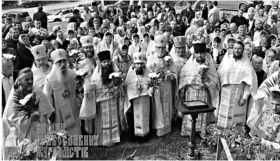
Участники Всеукраинского крестного хода за мир