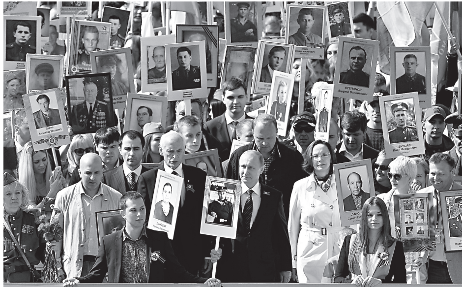
Безсмертный полк в Москве

Мы видим, как на Украине в конце уходящего года начинается гонение на Православную Церковь. Это похоже на первые годы советской власти, когда обновленцы пытались уничтожить Церковь с помощью чекистов. Сегодня на месте чекистов выступает украинское СБУ. Это все напоминает годы гонений на Церковь, когда обновленцам и чекистам отдавали храмы. Но в Москве храм Христа Спасителя и другие соборы стояли пустыми. А в храмы, которые сохранили верность Патриарху Тихону, войти нельзя было: народ на