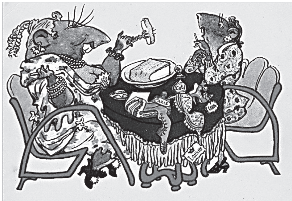
Иллюстрация к басне С. В. Михалкова «Две подруги»

канье я бы скорее отнесла к психиатрии, а не к литературе. Он же их строит как психопат — без остановки! Ну, есть, есть в этом что-то маниакальное.