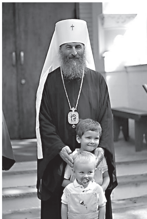
Блаженнейший Митрополит Киевский и всея Украины Онуфрий с юными прихожанами