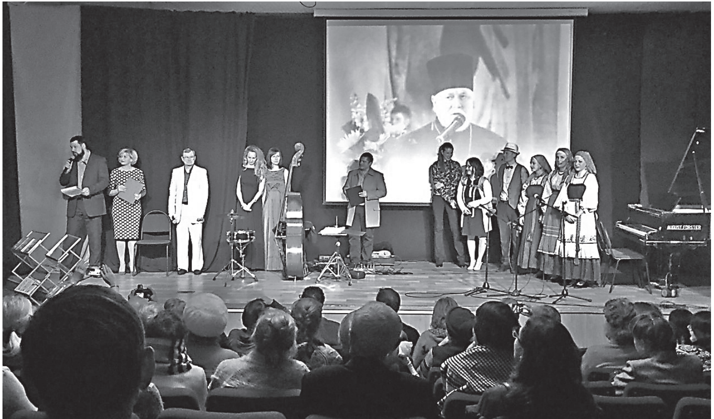
Во время благотворительного вечера

На вечере выступали священники и миряне, все говорили теплые слова в адрес отца Николая.