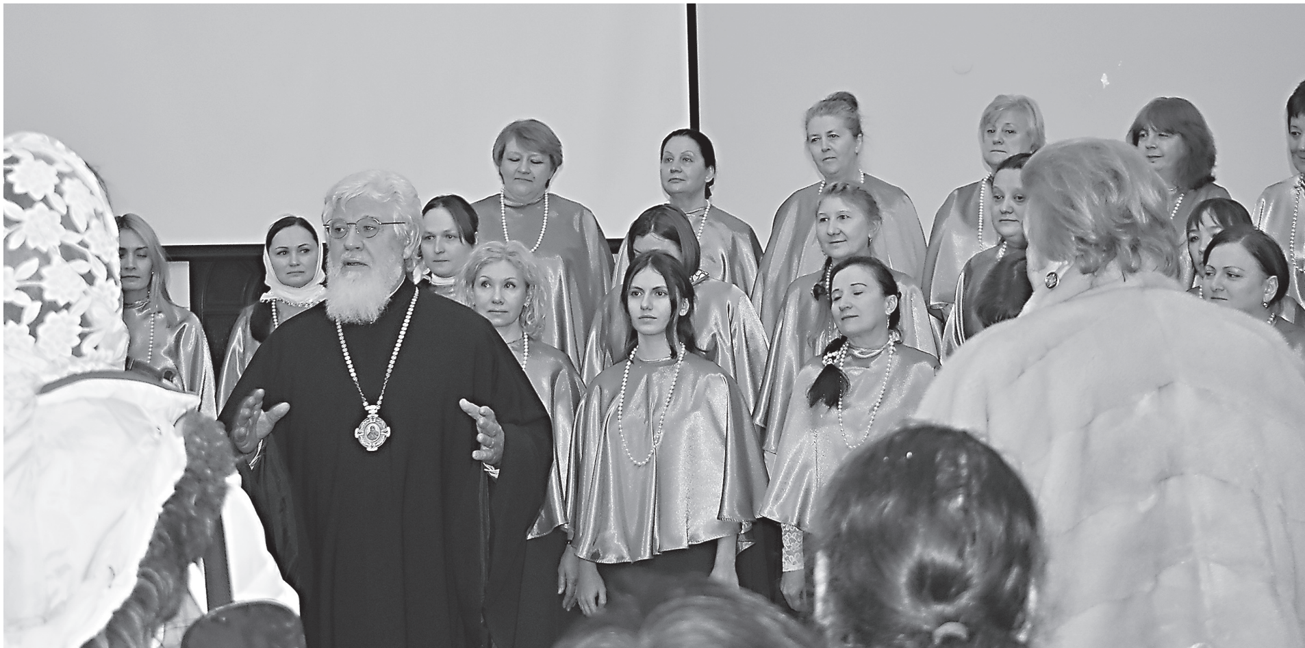
Слово митрополита Самарского и Тольяттинского Сергея перед православными женщинами Самарской губернии после выступления хора «Анастасия»

22 января, завершая череду Святых Рождественско-Крещенских праздников, что в народе зовут Святками, в Самарской духовной семинарии митрополит Самарский и Тольяттинский Сергей провел встречу с представителями регионального отделения «Союза православных женщин».