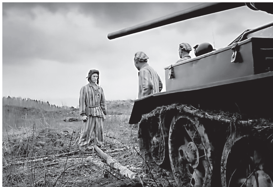
Кадр из фильма «Т-34»

Славяне – смешанный народ на основе низшей расы с каплями нашей крови, не способный к поддержанию порядка и к самоуправлению. Этот низкачественный человеческий материал сегодня так же не способен поддерживать порядок, как не был способен 700 или 800 лет назад, когда эти люди призывали варягов, когда они приглашали Рюриков. Мы, немцы, единственные в мире, кто хорошо относится к животным. Мы будем прилично относиться и к этим человеческим животным. Однако было бы преступлением перед собственной кровью заботиться о них и внушать им какие бы то ни было идеалы, и тем самым