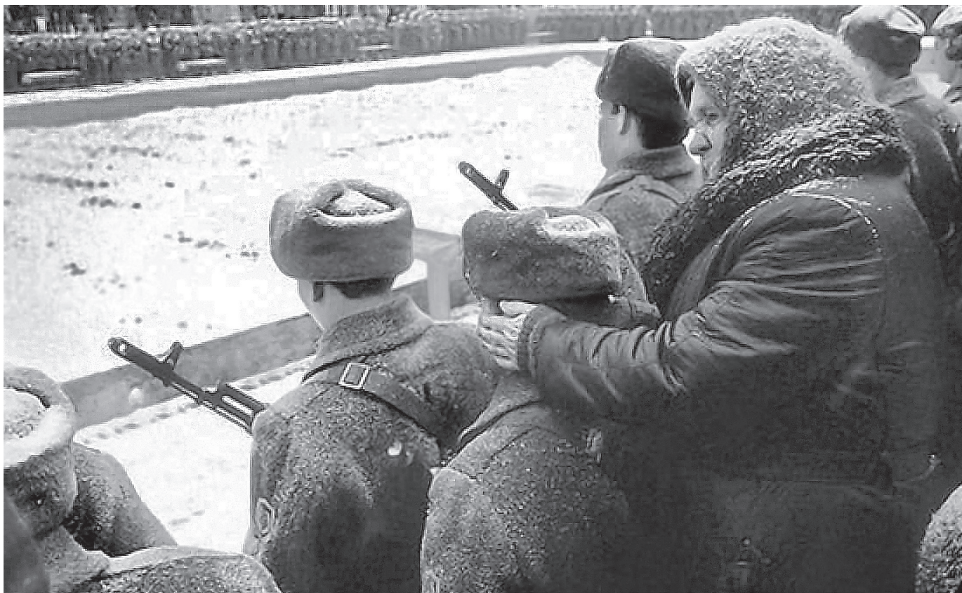
Забота моя такая

Н икто не может сказать, подобно евангельскому богачу: «Душа, ешь, пей, веселись»; никто не может сказать: «Мы достигли всего, что нужно было достичь, теперь и отдохнуть можно, и темпы сбавить». Мы не должны так говорить, потому что мы в самом начале духовного возрождения нашего народа. И хотя статистически большинство россиян говорят сегодня о своей принадлежности к православной вере, но статистическая принадлежность и реальное воцерковление – это разные вещи. И мы должны работать над тем, чтобы осуществлялось воцерковление нашего народа, чтобы люди умом и сердцем почувствовали, как важно быть с Богом, чтобы они почувствовали силу молитвы, чтобы они почувствовали, что молитва замыкает цепь, по которой осуществляется связь между ними и Богом. Когда такой яркий, сильный религиозный опыт станет достоянием большинства людей, тогда, я думаю, и можно будет говорить о реальном возрождении веры в нашем народе. А пока нужно трудиться и благодарить Бога за каждый этап, за каждый новый шаг, за каждый новый храм, за каждого человека, обратившегося ко Христу, пришедшего принять крещение и войти в Церковь Христову.