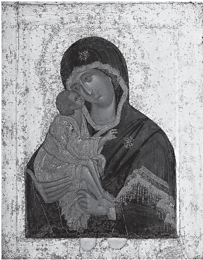
Икона Божией Матери «Донская»

Страшные нападения полчищ татарских, целых два столетия порабовавших Россию, казалось, должны были уничтожить не только ее могущество, но и самое бытие, но народ рус-