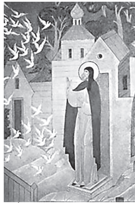
Видение Преподобным сонма белых птиц

Патриарх Филофей Коккинос - выдающийся иерарх Константинопольской Церкви, подвижник Святой Горы, постриженник и воспитанник Великой Афонской Лавры, сподвижник и защитник святителя Григория Паламы, причисливший его впоследствии, будучи уже патриархом, к лику святых. Изгнанный с престола, он вновь удалился на Святую Гору, откуда со временем опять призывается на патриаршью кафедру. Смерть принял он в новом изгнании и заточении. Патриарх Филофей известен тем, что пытался ввести (и ввел-таки) уставное единообразие во всей Греко-Восточной Церкви на основе универсального Иерусалимского Устава. Сознательными осуществителями его идеи на Руси стали святитель Алексей, митрополит Московский, и преподобный Сергий Радонежский. Троице-Сергиева Лавра становится тем, чем была доселе Лавра Киево-Печерская - центром духовно-