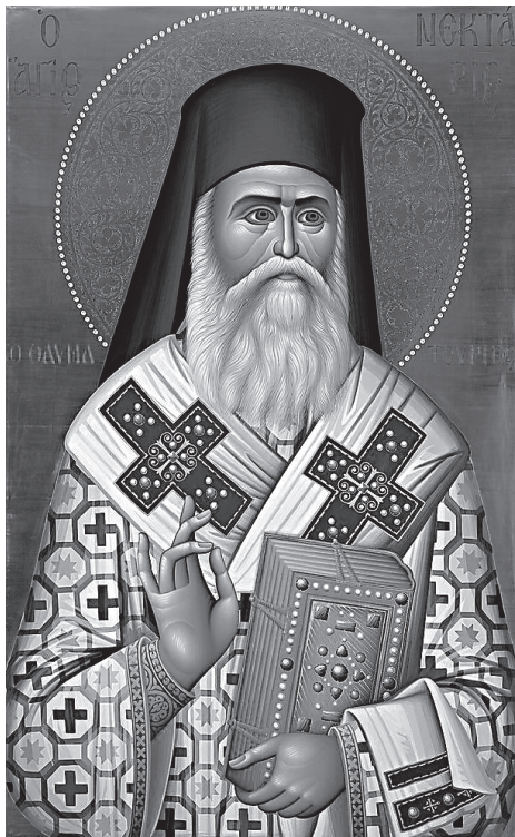
Свт. Нектарий Эгинский

«Имеющий чистое сердце является возлюбленным чадом Божиим. Дух Сына живет в его сердце, он получает всё, что просит, находит всё, что ищет,