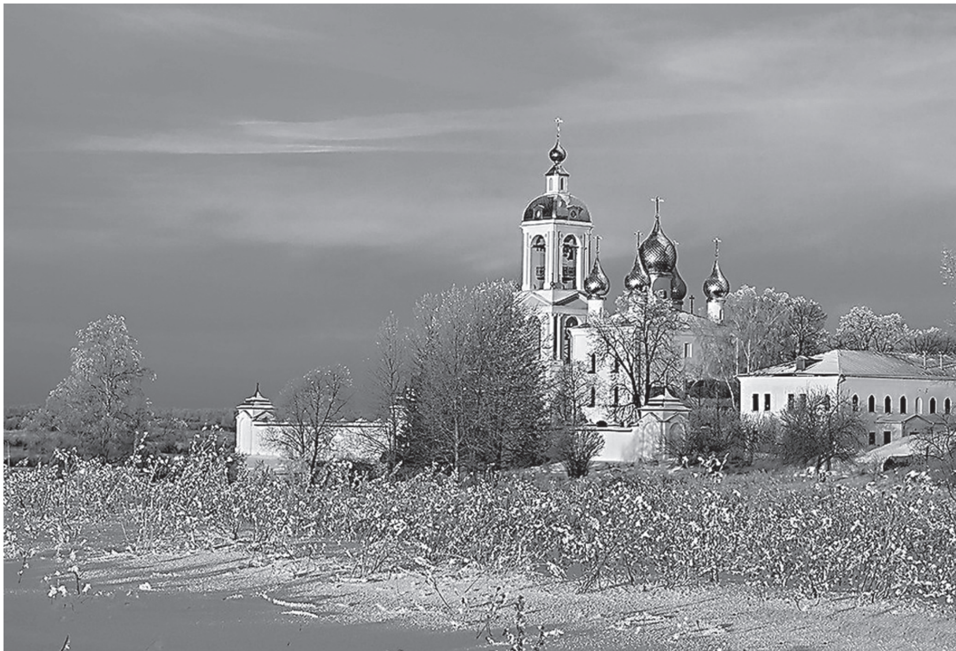
В преддверии Рождества Христова

Н ельзя сказать, чтобы богатство стало достоянием абсолютного большинства людей, в том числе в нашей стране, живут достаточно богато, причем многие из них являются православными христианами. К ним в первую очередь и обращены сегодняшние слова Господа.