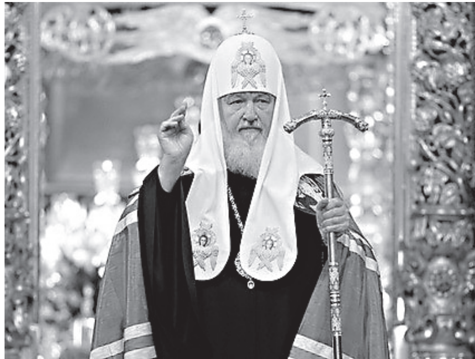
Святейший Патриарх Кирилл

На уровне Правительства и местных властей предпринимаются попытки лишить Украинскую Право-