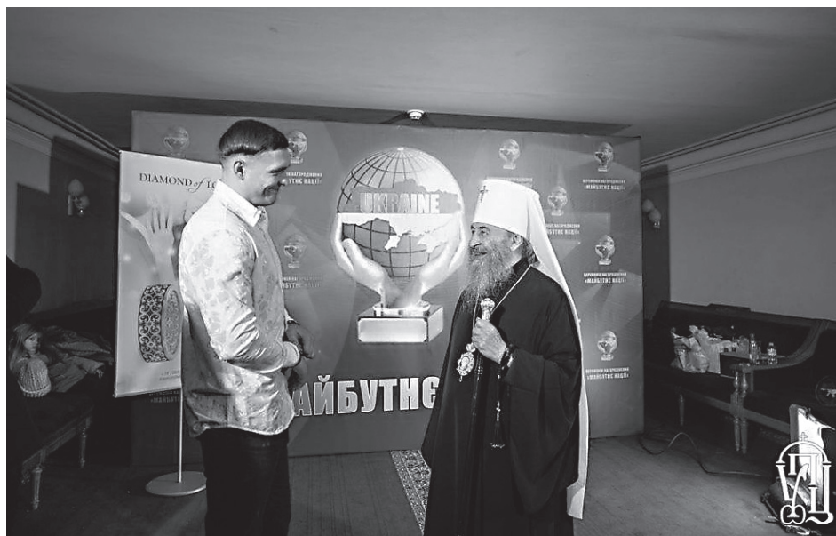
В рамках церемонии награждения «Будущее нации» абсолютный чемпион мира по профессиональному боксу Александр Усик получил из рук Предстоятеля УПЦ орден преподобного Ильи Муромца I степени

Разговор в студии в один прекрасный момент зашел о религии. Известный украинский боксер по традиции занял нейтральную позицию, аккуратно нивелировав значимость томоса и всей этой президентской аферы с объединением Церквей. Так, Усик отметил, что украинцам нужно внимательно почитать Библию и найти любовь в себе, чтобы измениться к лучшему. Этот процесс самопознания, так же как и поиск в себе любви к ближнему, по словам боксера, никак не зависит от того, дадут Украине пресловутый томос или нет. Всё зависит от самих украинцев, а автокефалия - это лишь игры политиков.