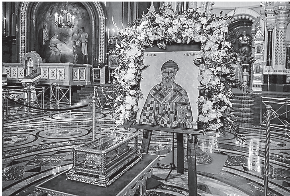
Мощи свт. Спиридона Тримифунтского в Храме Христа Спасителя в Москве

С днём памяти святителя Спиридона — 12 (25) декабря были связаны многочисленные народные приметы. Издревле русские люди называли его «поворотом» или «солнцеворотом». Этот день выпадает на время зимнего солнцестояния, когда наступают самые короткие дни и самые долгие ночи, затем дни начинают удлиняться. Про-