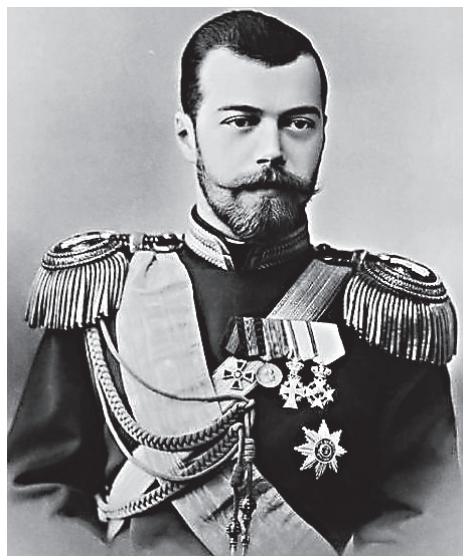
Император Николай II

Историк Петр Мультигули оценил поддержку жителями Мурманска смены названия аэропорта в честь последнего Императора.