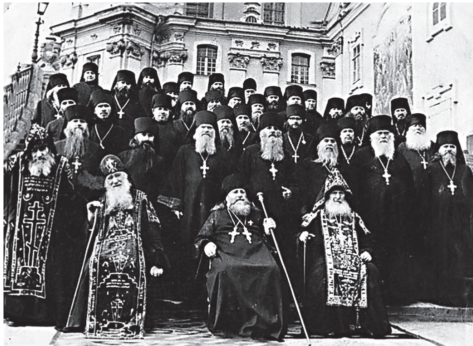
Почаевская братия 1960-х - исповедники времен хрущевских гонений

Той же (Евр. 13: 8). Мы не следуем за миром или против мира - мы следуем за Христом. Если мир хочет идти с нами: пожалуйста, мы очень рады! Если против нас - это дело мира. О каком мире речь? Об определенных сообществах - политических, религиозных. Но из любого сообщества можно выйти и сказать: «Господи, прости меня! Я согрешил и хочу каяться, хочу исправляться, чтобы во веки веков быть с Тобой, быть христианином настоящим». И дай Бог, чтобы инициаторы этих идей с ЕПЦ поняли свое заблуждение и раскаялись в своих инициативах.