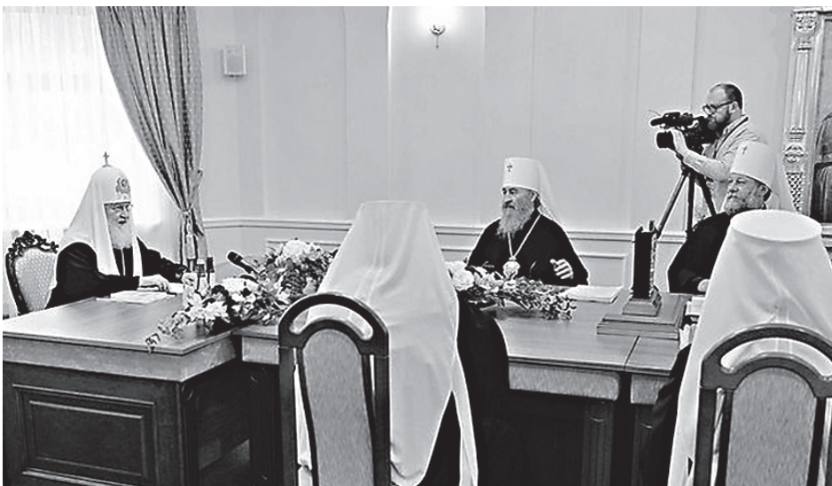
Во время заседания Священного Синода в Минске

Несмотря на неоднократные призывы к покаянию, после лишения архи-