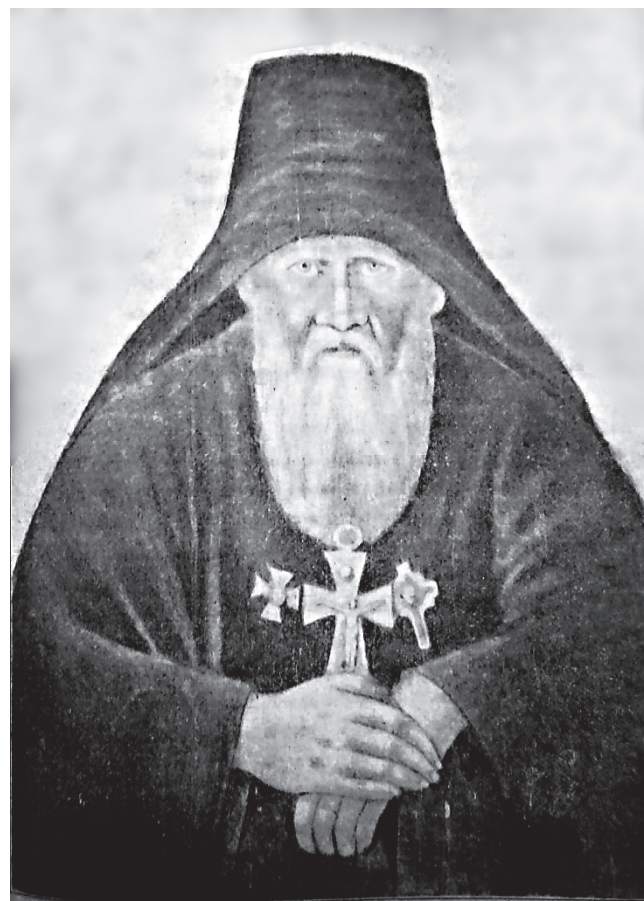
Архимандрит Феофан Новозерский

Малые грехи, которые мы поделаем в надежде на милость Божию, эти-то грехи и тяжки; если ты грешишь в разуме, то есть говоришь: я согрешу теперь и после покаюсь, то это тяжелее.