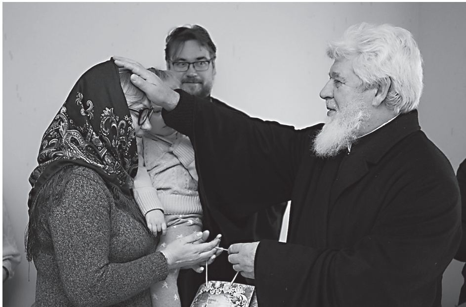
Митрополит Самарский и Сызранский во время посещения социальной гостиницы 8 января 2019 г

«Мудрость, Слово и Сила, Сын сый Отчий и сияние, Христос Бог.....вочеловечя обновил есть нас ...» (из 3-го тропаря 1-й песни Рождественского канона)