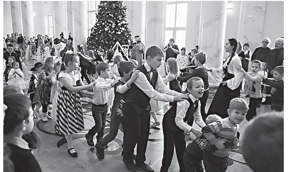
Митрополичья благотворительная елка в Самарском академическом театре оперы и балета 9 января 2019 г

данием взаимоуважения и понимания между людьми разных национальностей и вероисповеданий, населяющих богохранимую Самарскую землю. Наш высокий долг и священная обязанность как истинных последователей Христовых - всемерно противостоять злу добром. «Не будь побежден злом, но побеждай зло добром», - призывал в свое время святой апостол Павел (Рим.12,21). И, следуя ему, мы постоянно призываем наших клириков и мирян всемерно противостоять религиозному экстремизму, национальной и конфессиональной розни словами и делами евангельской любви и добра, которые принес в мир «...рождающийся в яслях Богомладенец».