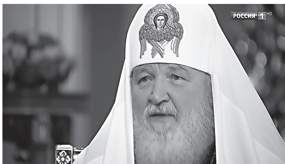
Патриарх Московский и всея Руси Кирилл

— Такой риск актуален всегда. Много зависит от машиниста, очень многое. Представьте себе, если бы в ту революционную эпоху были во главе России машинисты, способные с ней справиться. Аналоги в XIX столетии были, когда верховные машинисты России справились с очень сильными вызовами, в том числе направленными на разрушение российской государственности. Поэтому очень многое зависит от тех людей, на которых возложена полная ответственность за судьбу страны, за судьбу народа. Это не только те, кто олицетворяет высшую власть, не только один какой-то человек, — это вообще государственная элита. От воспитания этой элиты, от ее патриотизма и зависит уровень ответственности за все то, что происходит в стране. Снова можно сорваться с пути, если машинисты будут развивать слишком большую скорость на поворотах, либо если машинисты не