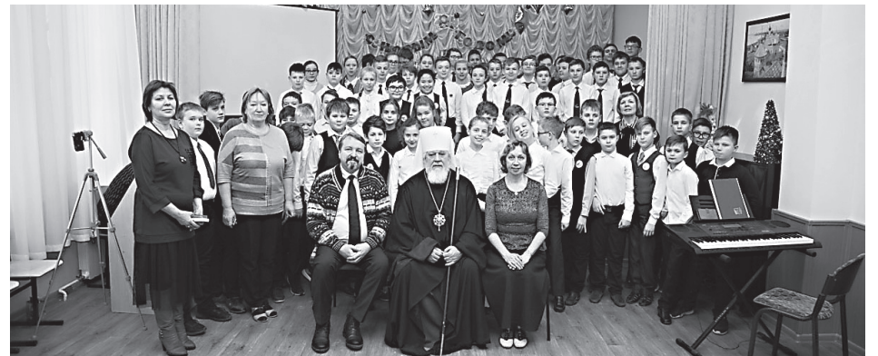
Рождественская встреча с детьми в Самарском техническом лицее