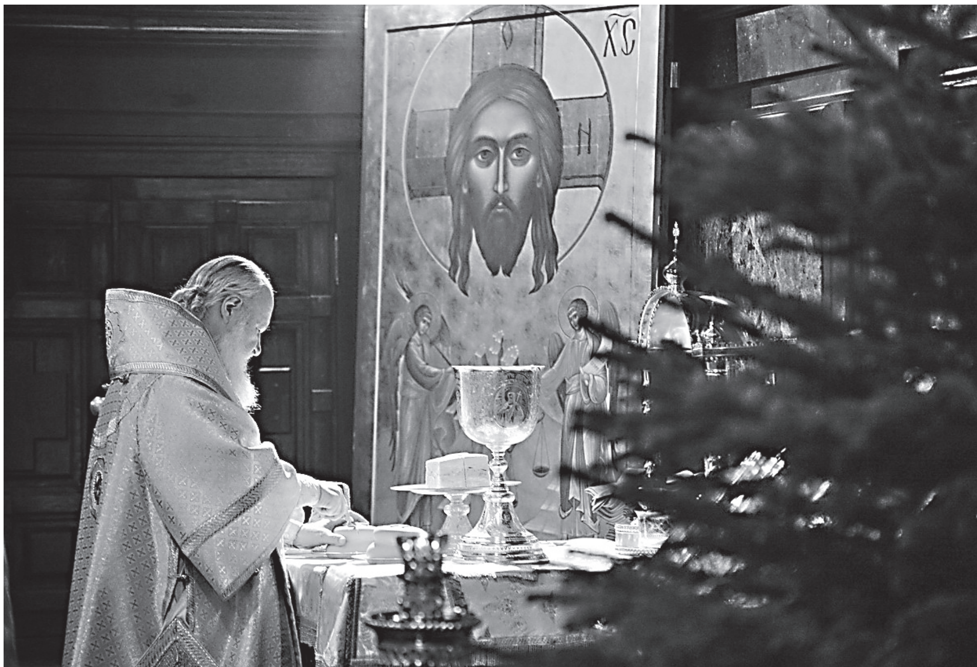
В Рождественскую ночь

Н ыне, как и вифлеемские пастухи две тысячи лет назад, мы с радостью и умилением внимаем торжествующему ангельскому гласу: «Слава в вышних Богу, и на земли мир, в человецех благоволение!» (Лк. 2:14). Слыша эти дивные слова, наше сердце обретает утешение и преисполняется благодарности Создателю. Сам Господь Вседержитель, Бог крепкий и Отец вечности (Ис. 9:6) снисходит к нам и рождается в мир простым человеком. Сбывается пророчество царя-псалмопевца, Духом Святым возвестившего: милость и истина встретятся, правда и мир облобызуются; истина воссияет от земли и правда с небес явится (Пс. 84:11-12). И вот свершилось: Младенец родился нам — Сын дан нам (Ис. 9:6), дабы всякий верующий в Него не погиб, но имел жизнь вечную (Ин. 3:16).