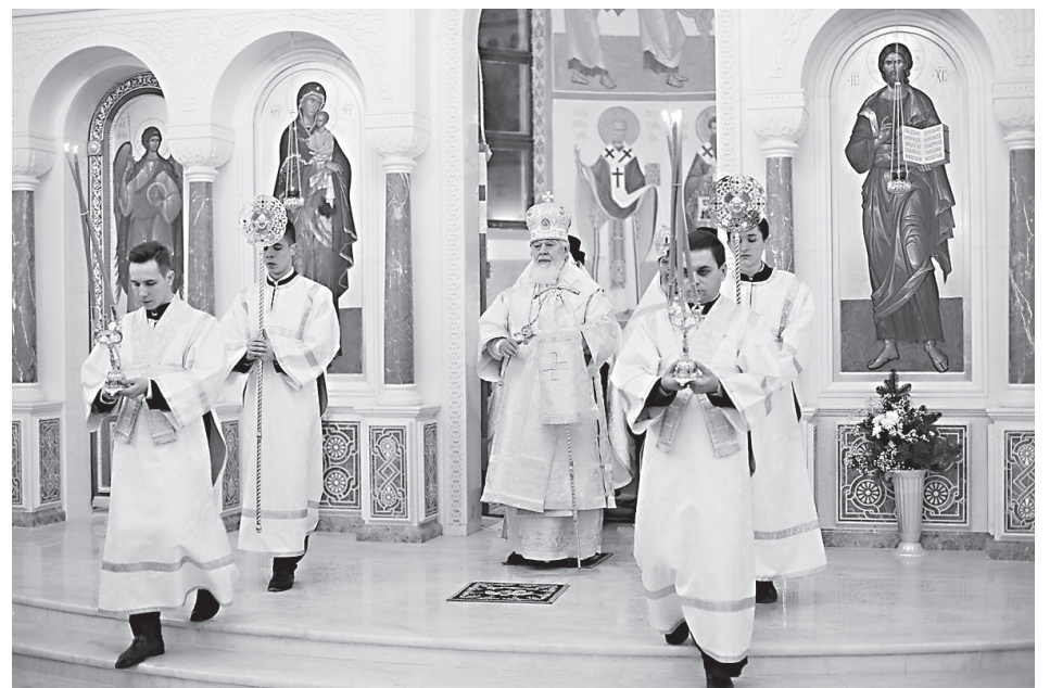
Рождественское богослужение в Софийском соборе г. Самары

С той Рождественской ночи, от которой нас отделяет 2018 лет, всех христиан мира объединяет надежда на духовное возрождение на земле благодати Божией. Ангельский гимн, возвестивший о мире на земле, является для всех нас призывом трудиться над сози-