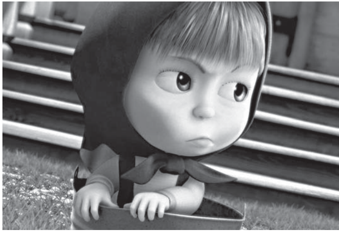
Кадр из современного мультсериала «Маша и медведь»