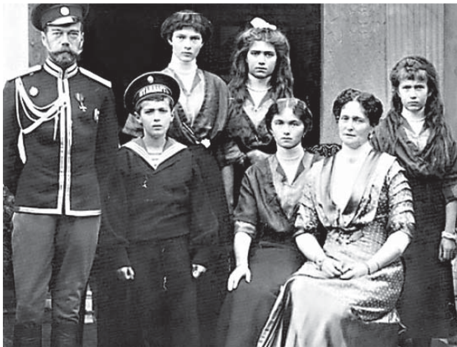
Семья последнего русского Императора в заключении в Омске