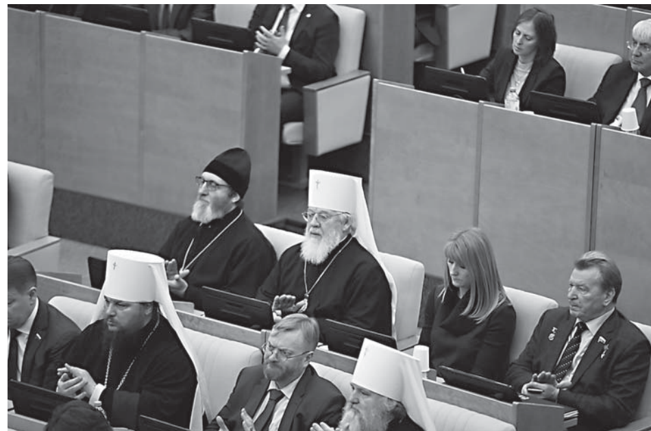
Во время VII Рождественских Парламентских встреч, состоявшихся в Государственной Думе ФС РФ в рамках XXVII Международных Рождественских чтений

Митрополит Екатеринбургский и Верхотурский Кирилл акцентировал внимание на необходимости законодательного расширения возможности православным общинам включаться в сферу социальной работы. Он отметил, что множество наших соотечественников «не всегда могут принадлежать к какой-то религиозной общине, но когда они видят дело, то приходят и в процессе этого дела становятся людьми верующими и осознанно творящими добро».