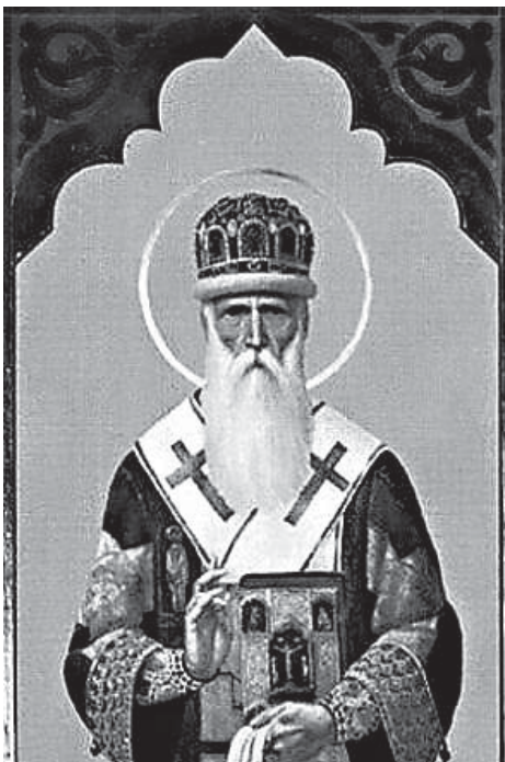
Святитель Вассиан (Рыло), архиепископ Ростовский

Русских людей из русских дружин, вышедших на Куликово поле, воспитывали, их волю ковали. Византийский патриарх исихаст Филофей Коккин занимался духовным окормлением князей, он молился о Руси и возлагал на нее свои надежды, переписывался с Преподобным Сергием Радонежским. Святого благоверного князя Дмитрия Донского растил и воспитывал святитель Алексей Московский. А со стороны Литвы помогал русским в период решающего сражения с Мамаем другой будущий святитель - Киприан. Преподобный Сергей Радонежский вдохновил дружины, послав своих иноков и бывших воинов-бояр Пересвета и Ослябя на Куликово поле. А Московский князь Иван Калита своей мудрой политикой дал вырасти на русской земле нескольким поколениям людей, не видевшим татарского разорения и не имевшим перед ними страха, унаследованного с детства. Потомки этих людей и вступили в сражение на поле Куликовом.