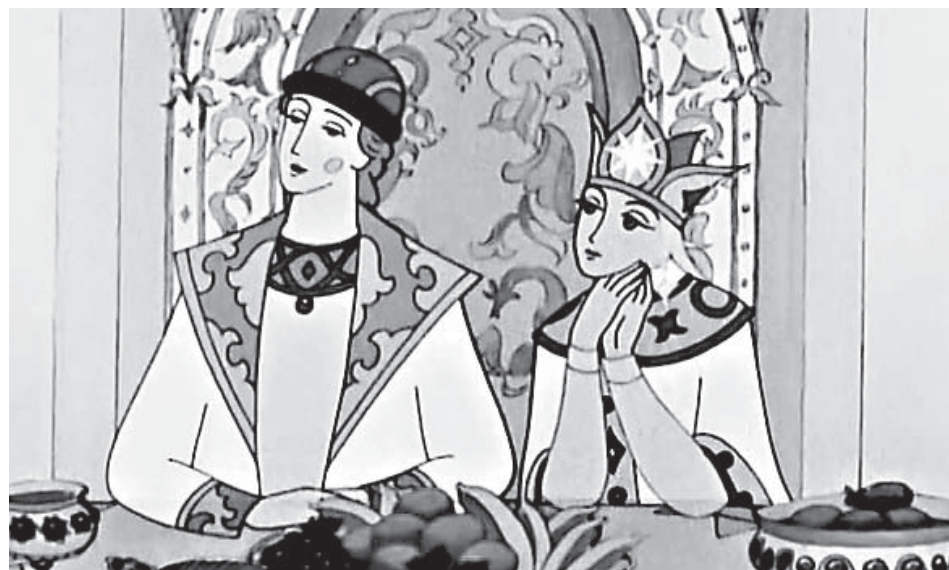
Кадр из советского мультфильма «Сказка о Царе Салтане»

рассказывать о том, что было в диафильме более подробно, потому что произведения эти ей были хорошо знакомы и прибавляла к ним воспитательные выводы.