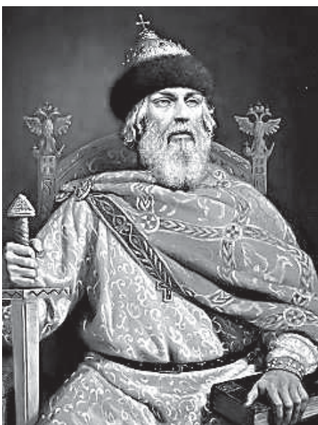
Великий князь Владимир Мономах

Здесь же интересно отметить, что понятие династичности явилось на Руси раньше, чем понятие единовластия. Верховная власть над Русской Землёй принадлежала династии, роду Рюрика, в