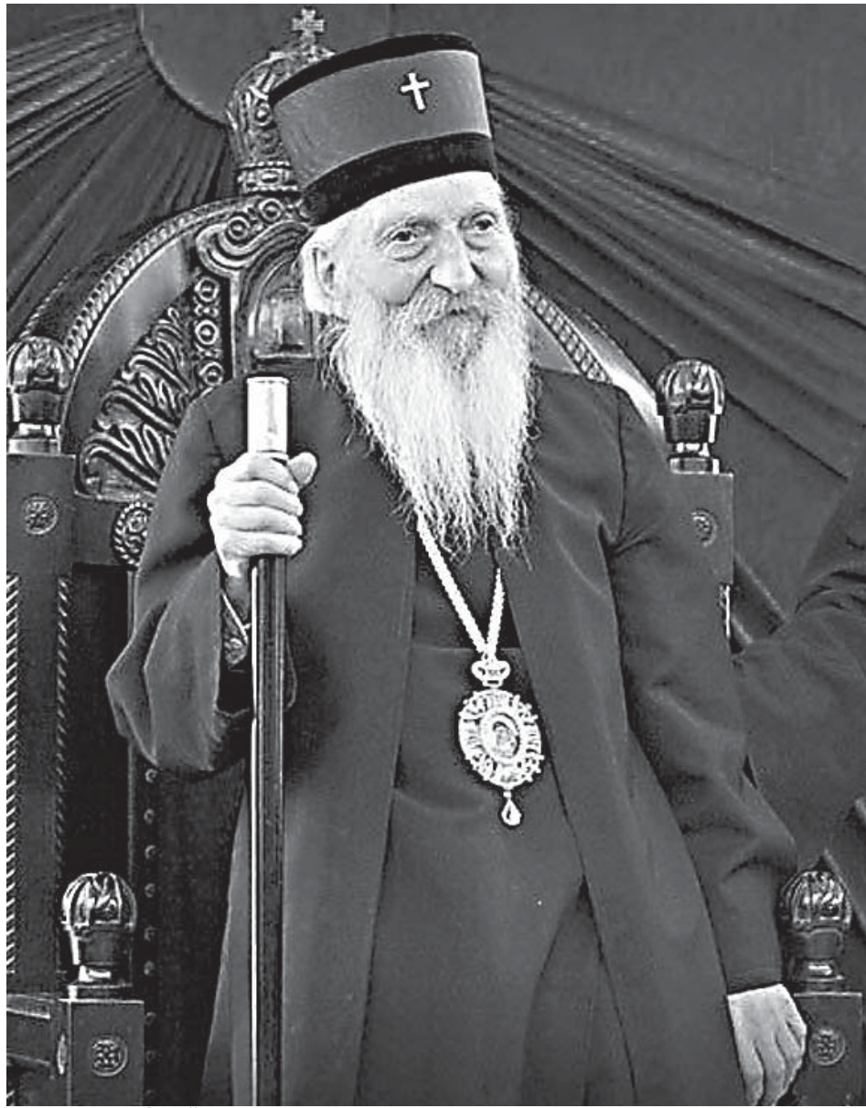
Патриарх Сербский Павел