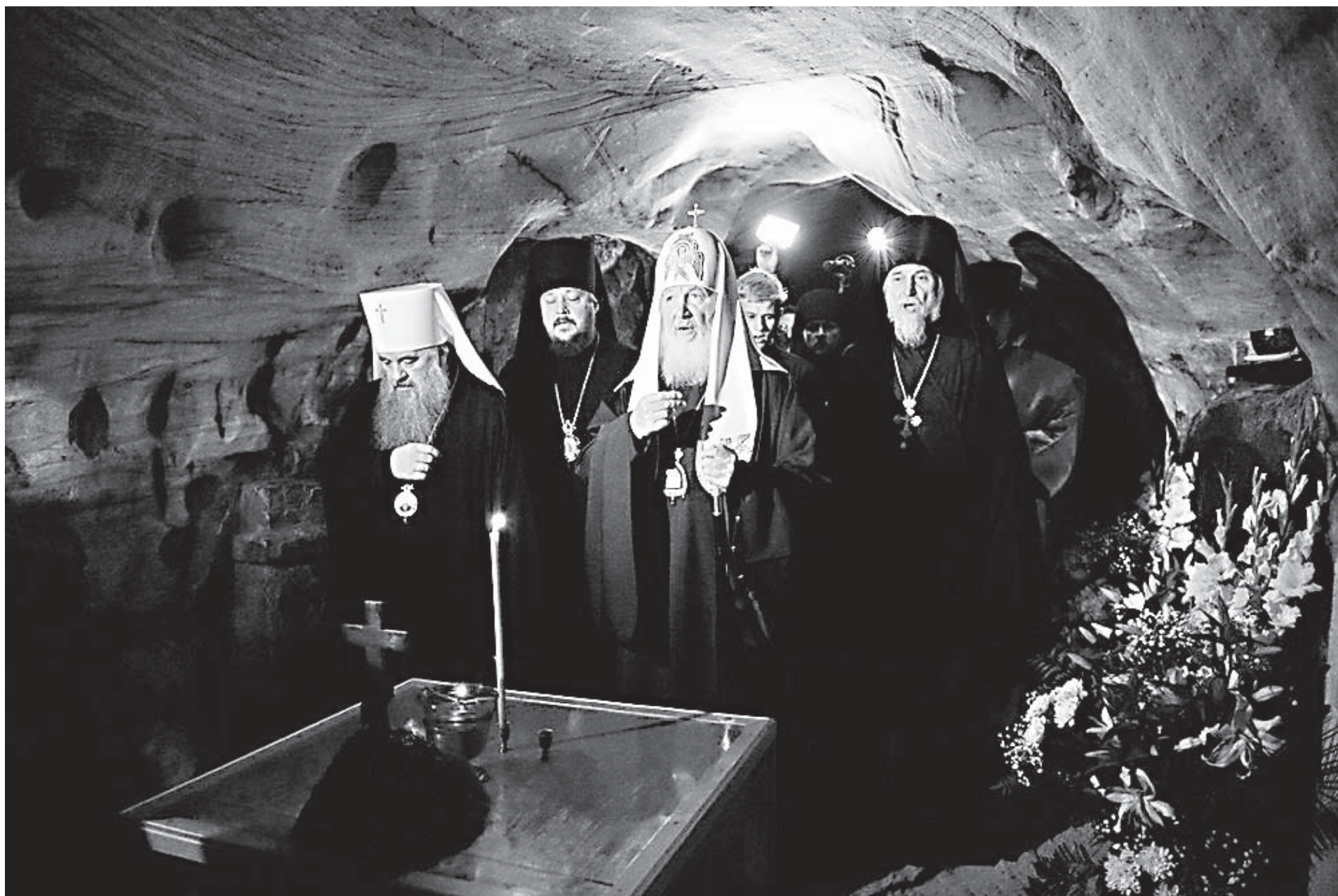
Святейший Патриарх Московский и всея Руси Кирилл во время литии в Богом зданных пещерах Псково-Печерского мужского монастыря

С уществует грех, который мы и грехом не всегда считаем, — он называется осуждением. Мы осуждаем постоянно — коллег по работе, членов своей семьи, знакомых, соседей. Иногда мы подвергаем людей справедливой критике за их неправильные действия, но чаще всего в осуждении нет рациональной оценки или глубокого анализа. Как правило, мы свой негатив, свое тяжелое состояние выплескиваем на другого. Нам хочется быть непременно лучше, чем он. И в каждом осуждении есть наше превозношение над тем, кого мы осуждаем <...>