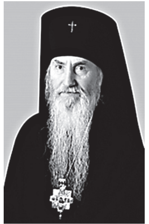
Архиепископ Берлинский и Германский Марк

С болью в сердце мы решили приостановить сотрудничество представителей нашей епархии во всех органах Ассамблеи православных епископов в Германии, в которых председательствуют подчиняющиеся Константинопольскому патриархату священнослужители. В частности, временно больше не будут посылаться представители в