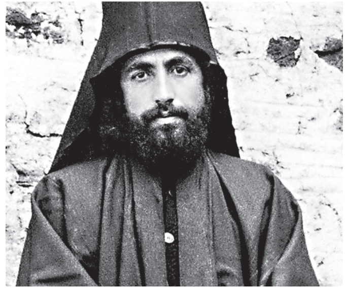
Прп. Паисий Святогорец в молодости

Одним из проявлений любви старца было благоговение к Богу и святыне: это проявлялось в том, как он молился, как прикладывался к иконам, как принимал из священнических рук антидор, пил святую воду, причащался, нес икону во время