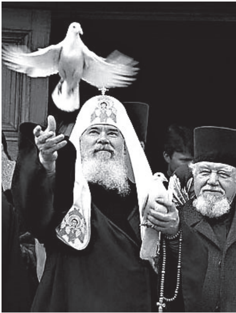
Святейший Патриарх Московский и всея Руси Алексий II