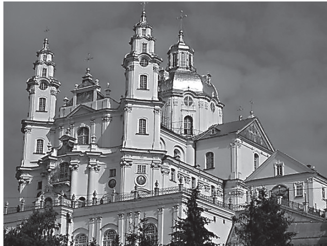
Свято-Успенская Почаевская Лавра

Бодрые заявления сторонников автокефального проекта, что, отказавшись признать действия Константинополя, «Москва ушла в раскол» и «изолировала себя от мирового Православия», оказались принятым желаемого за действительное — как и более сдержанные прогнозы относительно раскола мирового Православия по этническим линиям — на греков и славян. Многие