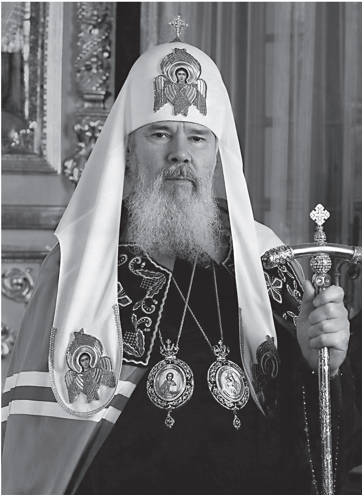
Приснопоминаемый Святейший Патриарх Московский и всея Руси Алексий II

Христианство говорит, что человек приходит в мир для того, чтобы после него мир стал хоть чуть-чуть светлее и добрее. Христианство говорит, что человек приходит в мир, чтобы дарить, а не чтобы потреблять. И прежде всего человек должен дарить самого себя. Боюсь, что сегодня человек воспитывается так, что он воспринимает самого себя как некое единое «чувствительное», услаждению которого должен служить весь окружающий мир. Я должен предупредить, что христианство иначе видит место человека в ином. Вспомните Распятого Христа, вспомните, как Он возлюбил мир. Или вспомните слова Пастернака о человеческой жизни: «Жизнь