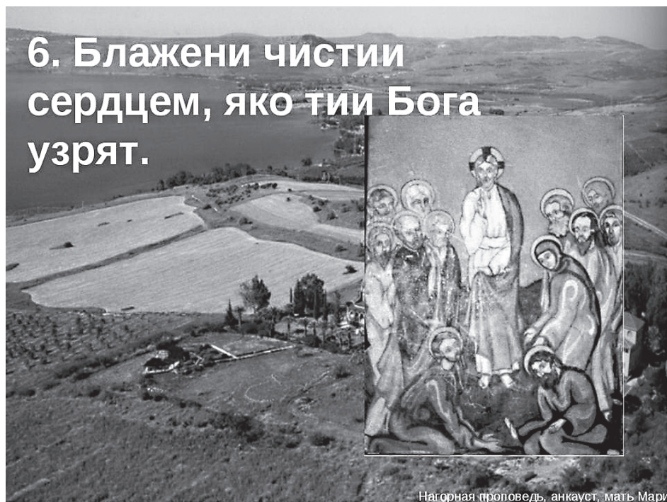
Нагорная проповедь, анкаует, мать Марии

сердца. Когда кто-то сердцем сострадает терпящему трудности и помогает ему во имя милостивого Господа, тогда милость его проистекает из чистого источника и имеет высокую цену на наших ангельских небесах. Таких в народе называют милостивыми и милосердными. Они всегда принимают чужую боль как свою собственную.