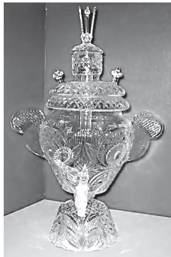
Хрустальный самовар, из которого Петр I угощал чаем заморских гостей

На рассвете, когда рабочими Петергофской гранильной фабрики кресты были сняты, их, чтобы скрыть следы преступления, чекисты повели расстреливать. У одного из участников акции неожиданно горлом пошла кровь. Туберкулез — обычное явление того времени, но кровь текла неукротимым потоком, пока революционер