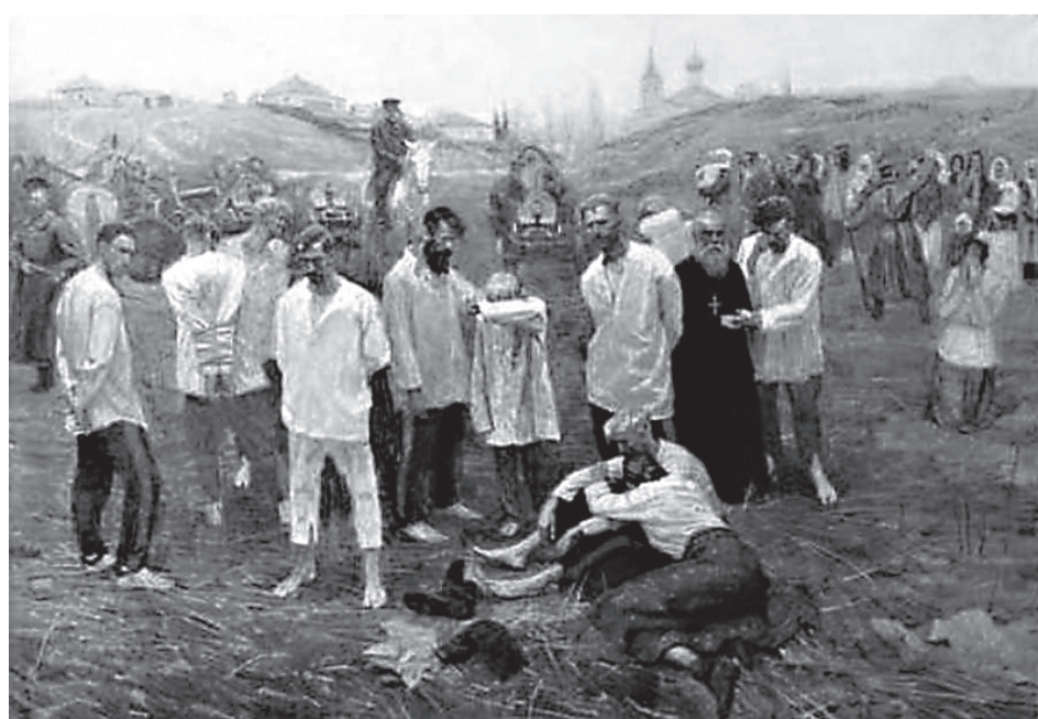
Расказачивание и раскулачивание казаков в 20-е годы

Член БОНВ уголовник П.З. Ермаков в 1907 г. убил полицейского и отрезал ему голову. В том же году он совершил вооруженное ограбление транспорта с деньгами. В июле 1917 г. Ермаков станет одним из соучастников убийства Царской Семьи. Боевики БОНВ получали весьма неплохое «жалование»: ежемесячно по 150 р. на полном содержании. Безусловно, что в это время Свердлов действовал самостоятельно от большевиков, которые в революцию 1905 г. практически не имели своих боевых организаций.