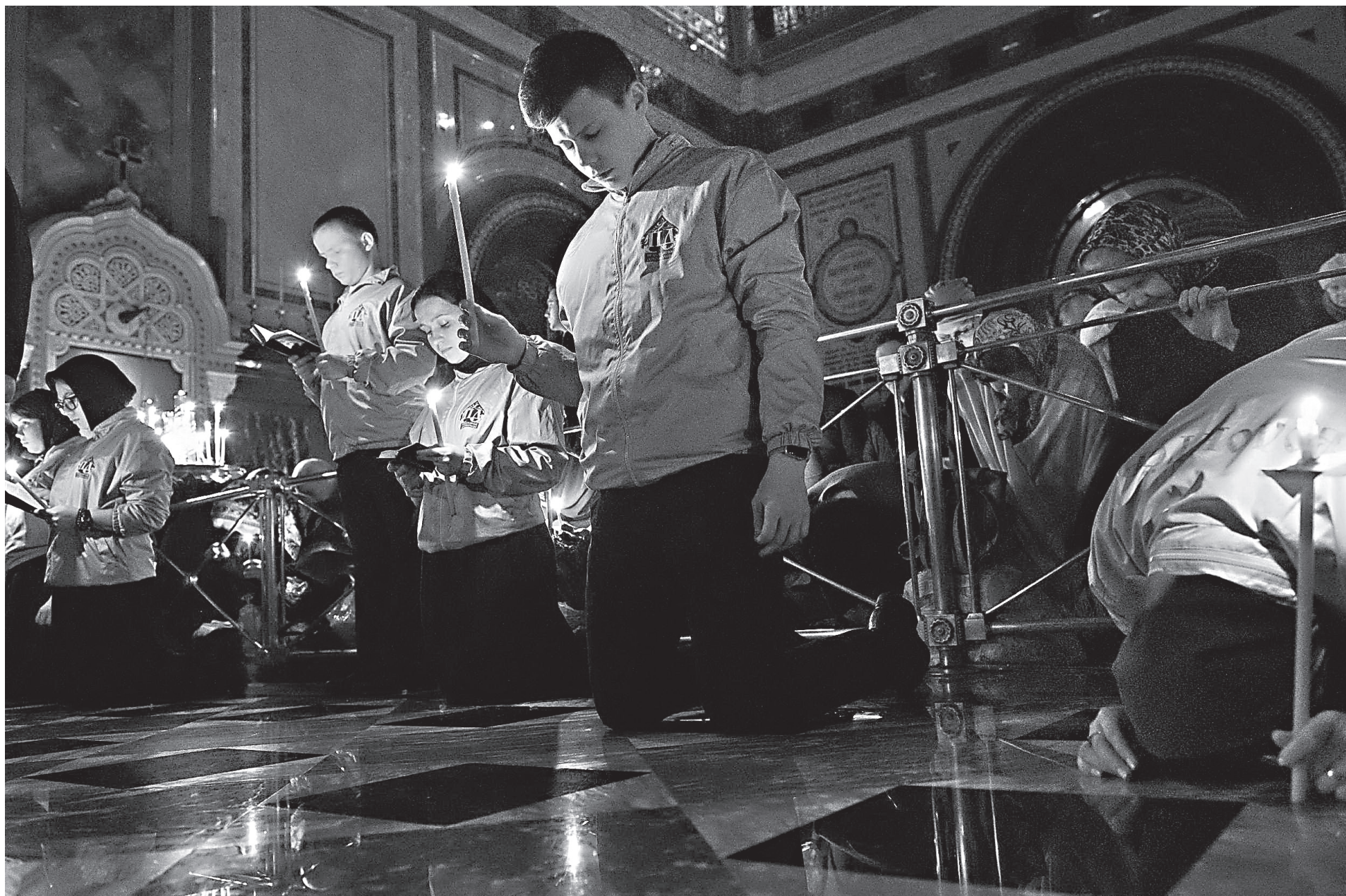
«Господи и Владыко живота моего!..»

С егодня — последнее воскресенье перед Великим постом, наполненное очень важным смыслом. Всеобъемлющий смысл этого дня — покаяние, прощение грехов. Собственно говоря, все предстоящее нам великопостное поприще посвящено теме преодоления греха в человеке. И если мы в течение поста не меняемся к лучшему, то напрасно трудимся, напрасно молились, напрасно постились, потому что и пост, и молитва обретают смысл только тогда, когда есть результат. Это не означает, что мы должны прекратить поститься и молиться, если не чувствуем результат. Совсем не так! Это означает, что если мы не чувствуем результат, то должны осознать: в нашей жизни происходит что-то неправильное, хотя мы совершаем молитву и ограничиваем себя в пище. И для того чтобы подчеркнуть духовное измерение поста как важнейшее, нам и предлагается в последний день перед Великим постом испросить друг у друга прощения и еще раз осознать, что без прощения нет спасения.