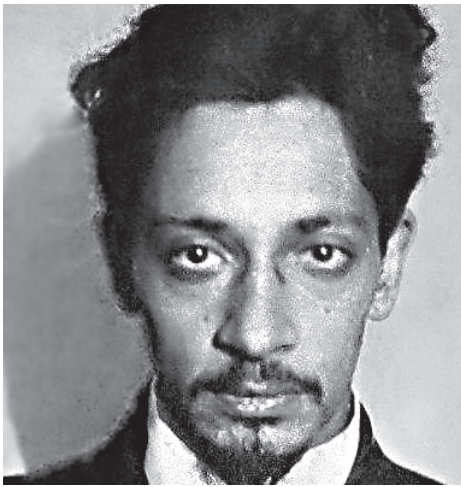
Пламенный русофоб Я. М. Свердлов

Именно в те дни, под руководством Свердлова и Дзержинского был развязан чудовищный террор против русского народа, названный им «красным террором». Он был введен официальным декретом от 5 сентября 1918 г. Для осуществления в жизнь этого декрета были созданы специальные карающие органы Всероссийской чрезвычайной комиссии (ВЧК). Руководство большевистского правительства и ВЧК не просто поощряли политику террора, но требовали его внедрения от своих сотрудников. Причем следует отметить, что форма этого террора носила прежде всего не защиту от врагов, а массового геноцида в отношении тех или иных слоев населения и социальных групп. Свердлов и его подельники несут прямую ответственность за массовые убийства ни в чем не повинных людей, расказачивание, за чудовищные издевательства и пытки, в том числе над женщинами и детьми, за организацию концлагерей, за глумление над православными святынями, уничтожением духовенства. Число жертв Красного террора при таком подходе оценивается до 2 млн. человек. Одним из самых страшных преступлений Свердлова большевистской верхушки стало так называемое «расказачивание», проведенное в отношении Донского, Кубанского и Терского казачества. Пик геноцида казаков пришелся на 1919 г., оформившись печально известной директивой Оргбюро ЦК ВКП(б) 24 января 1919 г., подписанной Янкелем Свердловым: «Необходимо, учитывая опыт граждан-