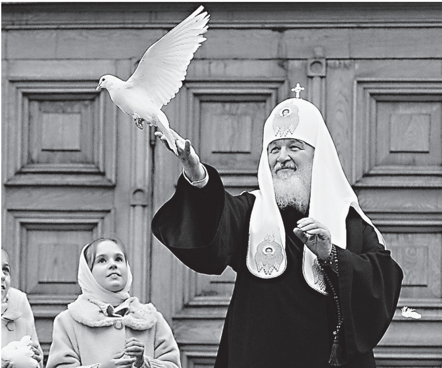
«Днесь спасения нашего главизна...»

Э тот праздник связан с неким торжественным событием, но по сути своей — с трагическими обстоятельствами. Он помогает нам очень многое понять. Понять, в чем состоит миссия Бога в мире, которую осуществляет Церковь, — и к чему устремляются мысли людей, в чем большинство людей видит спасение. Между этими двумя реальностями есть нечто, что вызывает недоумение — в первую очередь у тех, кто не способен проникнуть в смысл и силу слов Божиих.