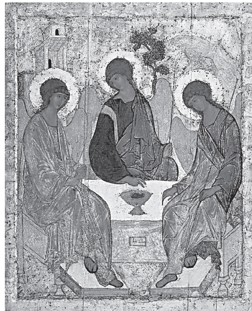
Икона Святой Троицы Андрея Рублева

сути, не меняя каноны, не внося ничего разрушающего, открывает нам новые смыслы. Иногда люди думают, что надо что-то поменять, надо разрушить старое и на этом построить новое. Рублев делает совершенно иначе. Он делает роспись узнаваемого, традиционную, но тем не менее вносит такие нюансы, именно богословские нюансы, через которые показывает глубину изображаемого смысла.