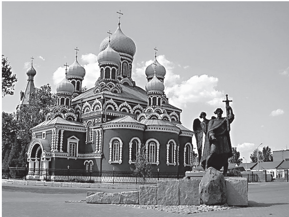
Воскресенский собор в городе Борисове

В этом же году в Костроме уничтожили памятник Ивану Сусанину, крестьянину, спасшему от гибели избранного на русский престол Михаила Феодоровича Романова. В Москве Скобелевская площадь была переименована в Советскую, в Костроме