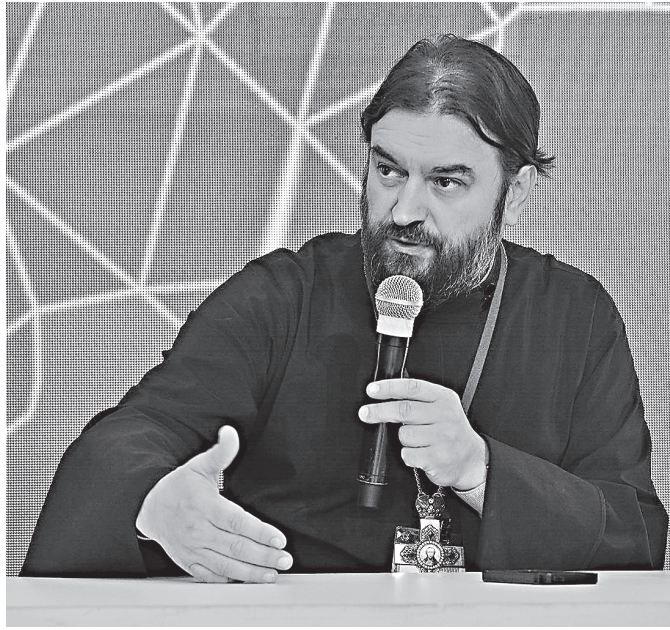
Протоиерей Андрей Ткачев

Может, вы скажете, что так и надо. А я так не скажу. И что можно уводить чужого мужика из семьи, потому что время даму уже поджало и ей не до принципов, – тоже не скажу. И что можно мужчине жить на два дома, давая временами любовнице деньги на аборт, – не скажу. И что спать с человеком можно раньше, чем успеешь узнать имя той (того), с кем проснулся (проснулась) утром, – не скажу. И хотя это творится сплошь и рядом, множествен-