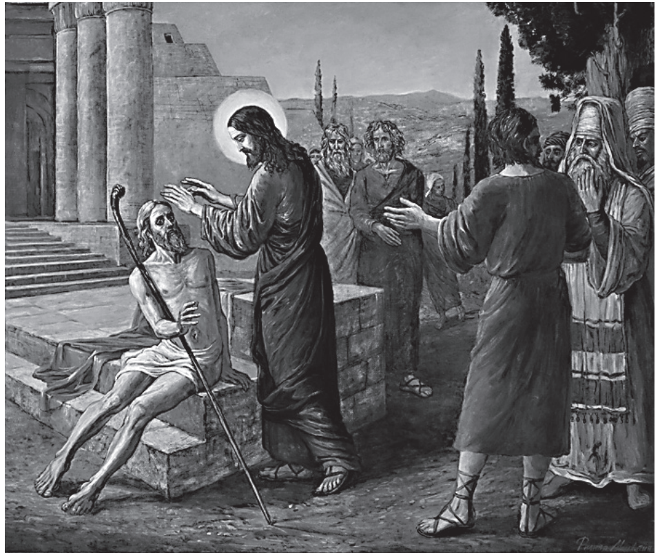
«И проходя, Он увидел человека, слепого от рождения»

Оказывается, иногда и болезнь превращается в радость, когда не дает нам попасть в беду. Сейчас нам навязывают идею, что возраст ничему не помеха. Человек в возрасте часто не думает, что он уже не все может себе позволить. У нас любят говорить, что душа всегда молода. Да, водитель-то всегда молодой, а машина-то старая, и если он начнет гонять на этой машине, она разобьется. Поэтому Господь и останавливает: «Нельзя тебе так, вот тебе немощь. Давай, живи уже разумно, потихонечку».