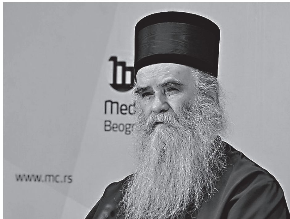
Митрополит Черногорский и Приморский Амфилохий (Радович)

Утром 2 апреля сотни местных жителей собрались на площадке у бетонной крестильни в виде беседки с крестом. Усиленные наряды полиции в тяжелой экипировке были размещены на подходах к площадке с крестильней, а также подошли на катере с моря. После переговоров с приходским священником сотрудники правоохранительных органов спокойно покинули место, граждане начали круглосуточное дежурство.