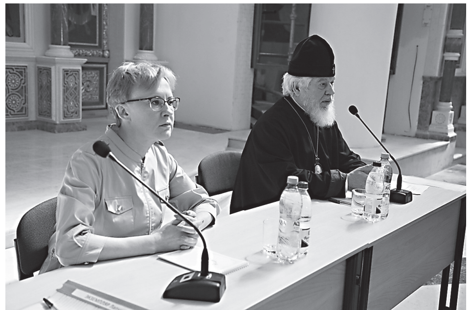
В Софийском соборе Самары

В среди 5-й седмицы Великого поста в Софийском соборе Самары состоялась рабочая встреча настоятелей храмов города с руководством администрации областного центра.