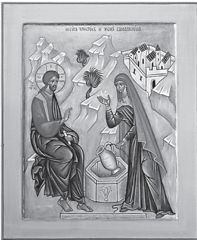
Иисус Христос и самарянка у колодца Иакова