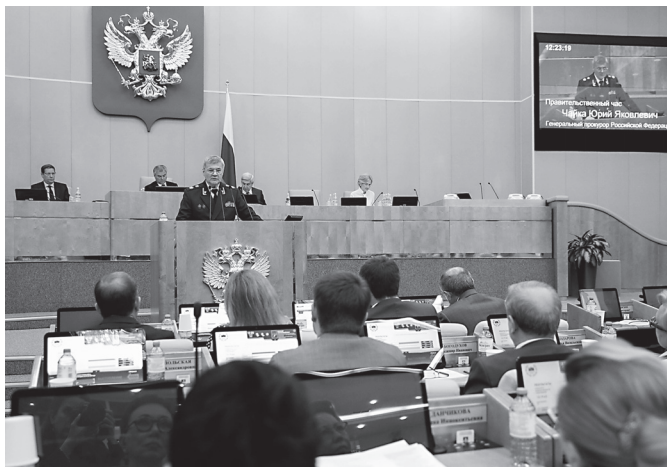
Генпрокурор РФ Юрий Яковлевич Чайка выступает в Государственной думе

Еще один вопрос повышенной социальной значимости, о котором подробно рассказал Юрий Чайка, — обеспечение законности в сфере долевого строительства жилья. «Принимаемые совместно с органами государственной власти меры приносят результаты. Ситуация постепенно меняется. Так, в 2018