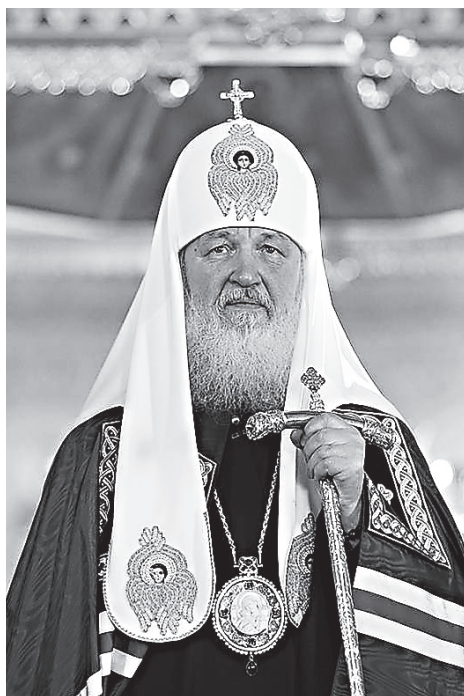
Патриарх Московский и всея Руси Кирилл

– У нас было достаточно продуктивное взаимодействие с 2000 по 2005 год, я при-