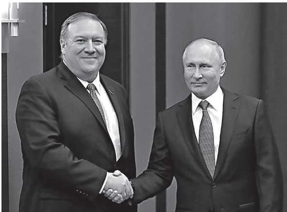
Начало встречи Президента РФ В.В. Путина и госсекретаря США М. Помпео

Зачем же летел в Сочи госсекретарь? Явно не для того, чтобы вести бесплодные