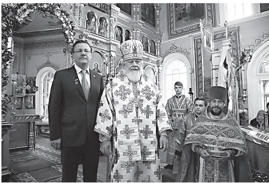
Соработничество на благо народа