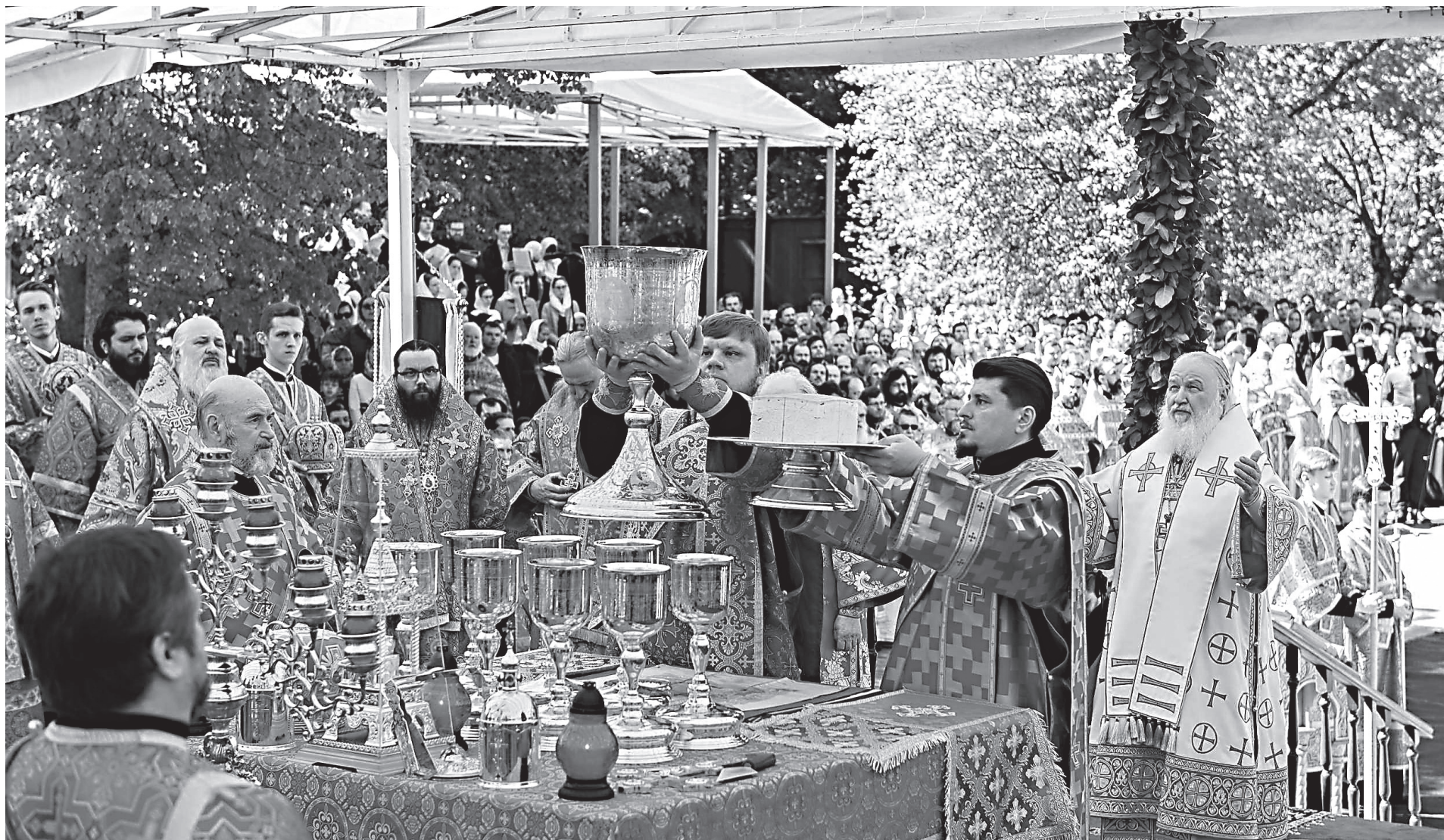
«Святые новомученики Российские, молитесь Бога о нас!» Божественная литургия под открытым небом на Бутовском полигоне — месте массовых расстрелов и захоронения жертв политических репрессий

С егодня мы переживаем особый период, когда наше общество выходит из состояния, которое можно назвать состоянием межвременья, неопределенности, нестабильности. Оно началось в 90-е годы, но по милости Божией народ наш, общество наше практически преодолело остатки той напряженности, которая была порождена исторической турбулентностью, всем тем, что произошло с нашим народом и страной в 90-е годы. И главный вопрос заключается в том, сможет ли сегодня общество опереться на незыблемые основания, которые способны превратить нацию в единое целое, сможет ли ясно сформулировать ценности, идеалы, установления, которые определяют историческую идентичность и историческую самобытность. Задача осложняется тем, что история России полна зигзагов, трагедий, испытаний, прерванных традиций. Вот почему мне показалось правильным, чтобы сборник этих текстов получил название «Диалог с историей».