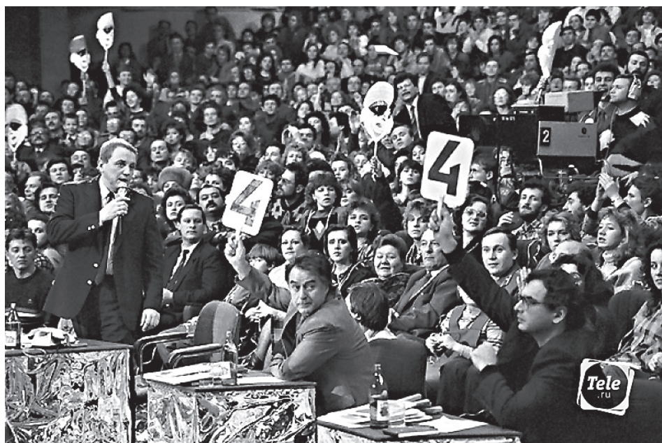
КВН в начале пути

статье тогдашнего уголовного кодекса (незаконные операции с валютой и драгоценными камнями). Это дело получило настолько громкий резонанс, что с самого верха поступило распоряжение прикрыть «рассадник как таковой», и КВН закрыли.