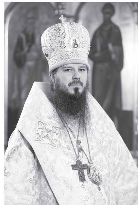
Епископ Тольяттинский и Жигулевский Нестор

18 августа 2010 г. назначен и.о. наместника Преображенского монастыря г. Пензы.