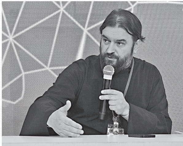
Протоиерей Андрей Ткачев

У тебя нет времени или сил пойти на всенощную. Согласен. Но прочесть по памяти «Помилуй мя, Боже» посреди ежедневных трудов у тебя всегда есть и время, и силы. Дело только за желанием. Вот это желание и нужно возбуждать в душах человеческих, напоминая и уча, что призы-