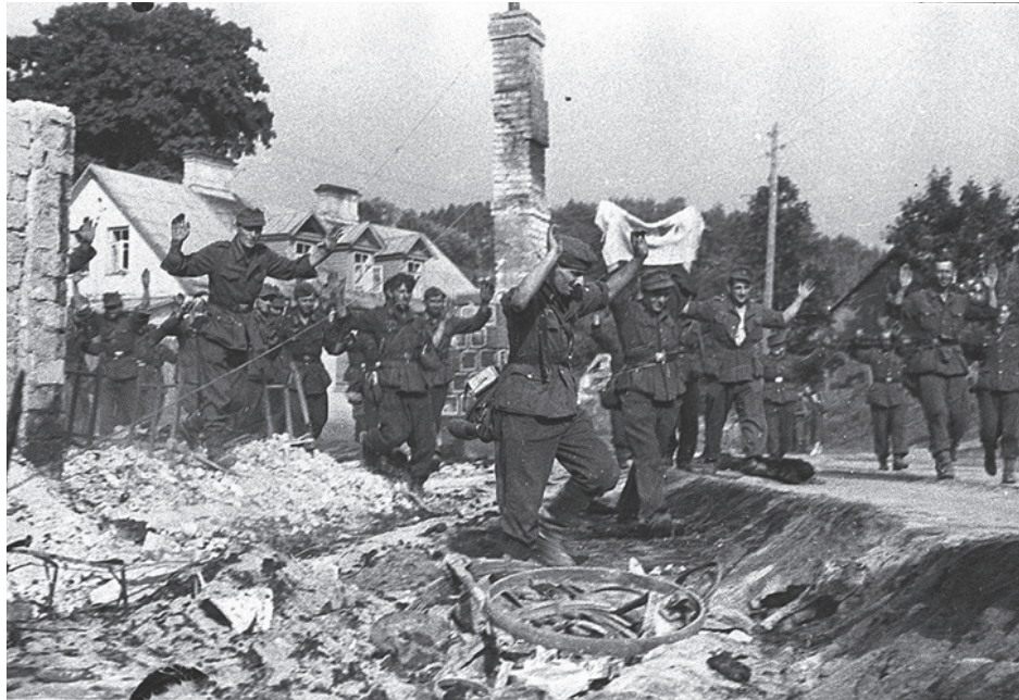
Вильнюс. Группа немецких солдат сдается в плен

На Крымской конференции в феврале 1945 года Черчилль выразил «глубокую благодарность и восхищение той мощью, которая была продемонстрирована Красной Армией в ее наступлении».