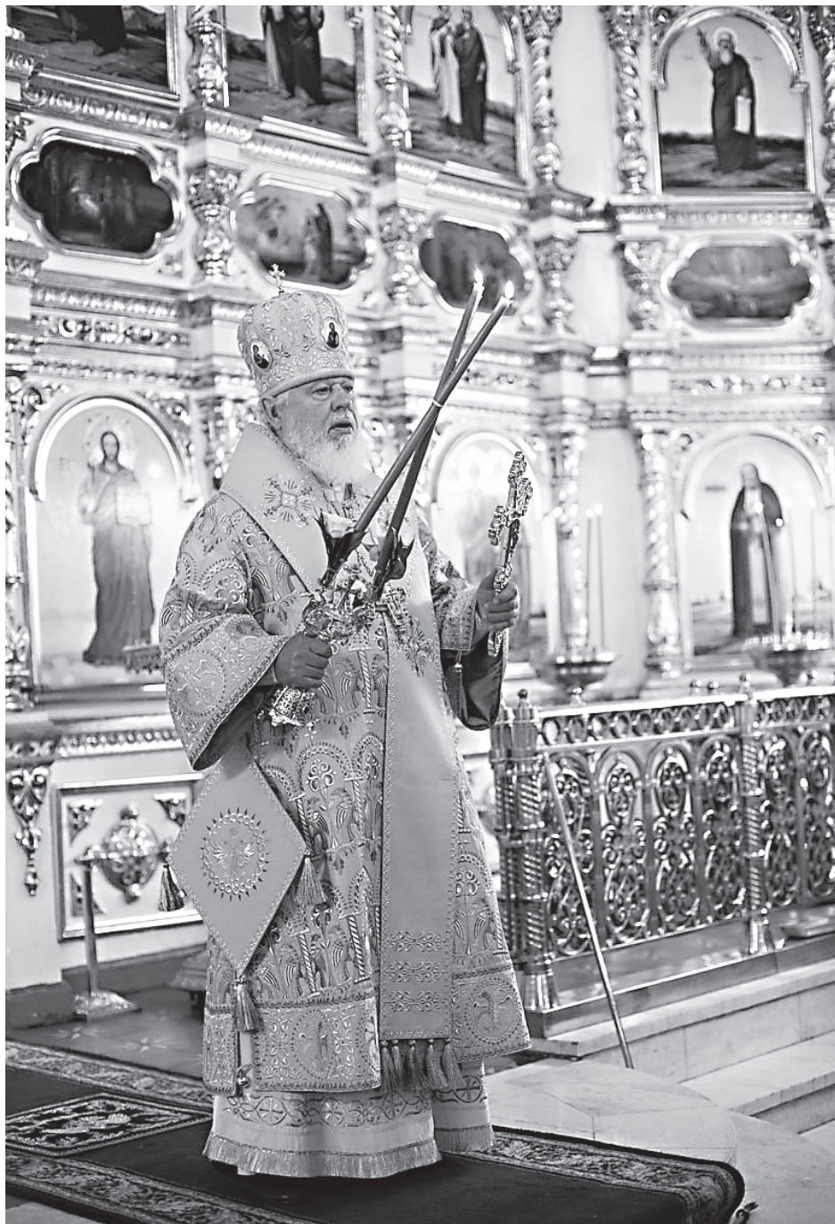
Митрополит Самарский и Новокуйбышевский Сергей, Глава Самарской митрополии

В 1993 г. приглашен певчим в церковь Рождества Пресвятой Богороди-