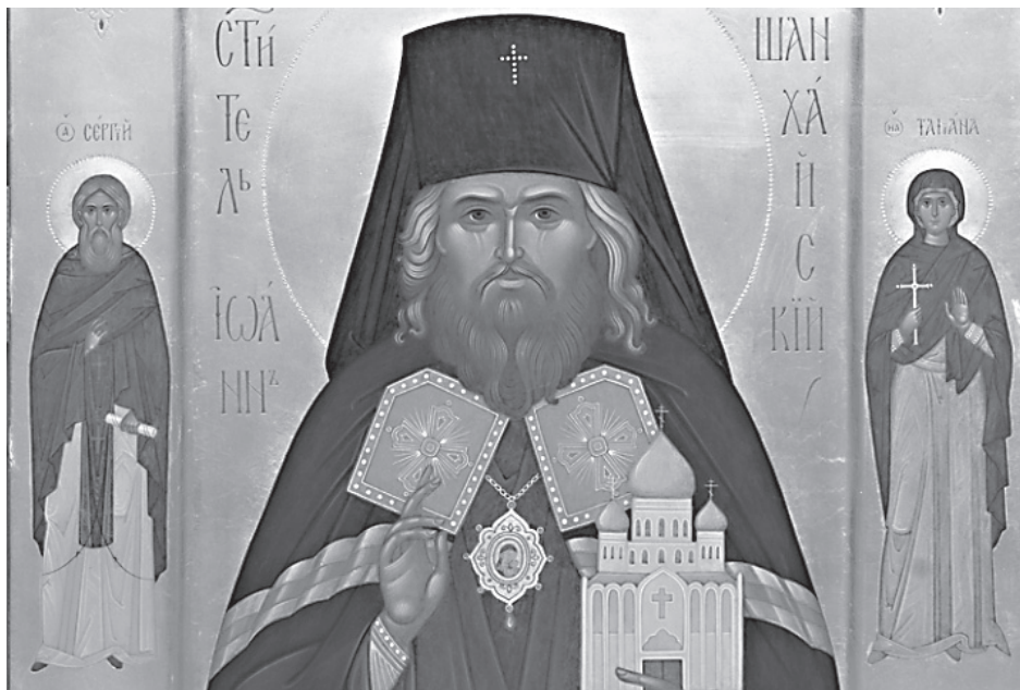
Святитель Иоанн (Максимович)

Молодой Владыка любил посещать больных и делал это ежедневно, принимая исповедь и приобщая их Святым Тайнам. Если состояние больного становилось критическим, Владыка приходил к нему в любой час дня или ночи и долго молился у его постели. Известны многочисленные случаи исцеления безнадежно больных по молитвам святителя Иоанна.