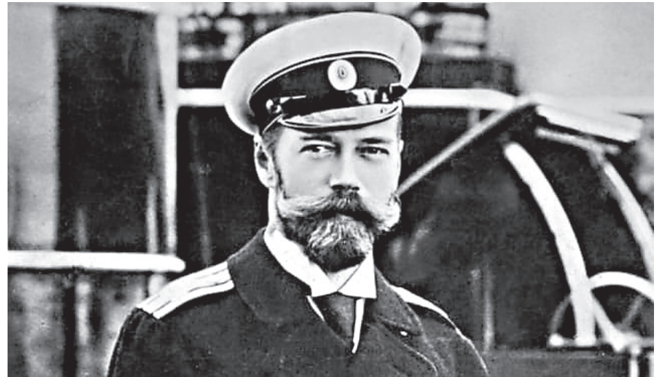
Император Николай II в морской форме

Вы помните повесть Б. Васильева «А зори здесь тихие»? Помните, что защищали девушки? А защищали они Кировскую железную дорогу,