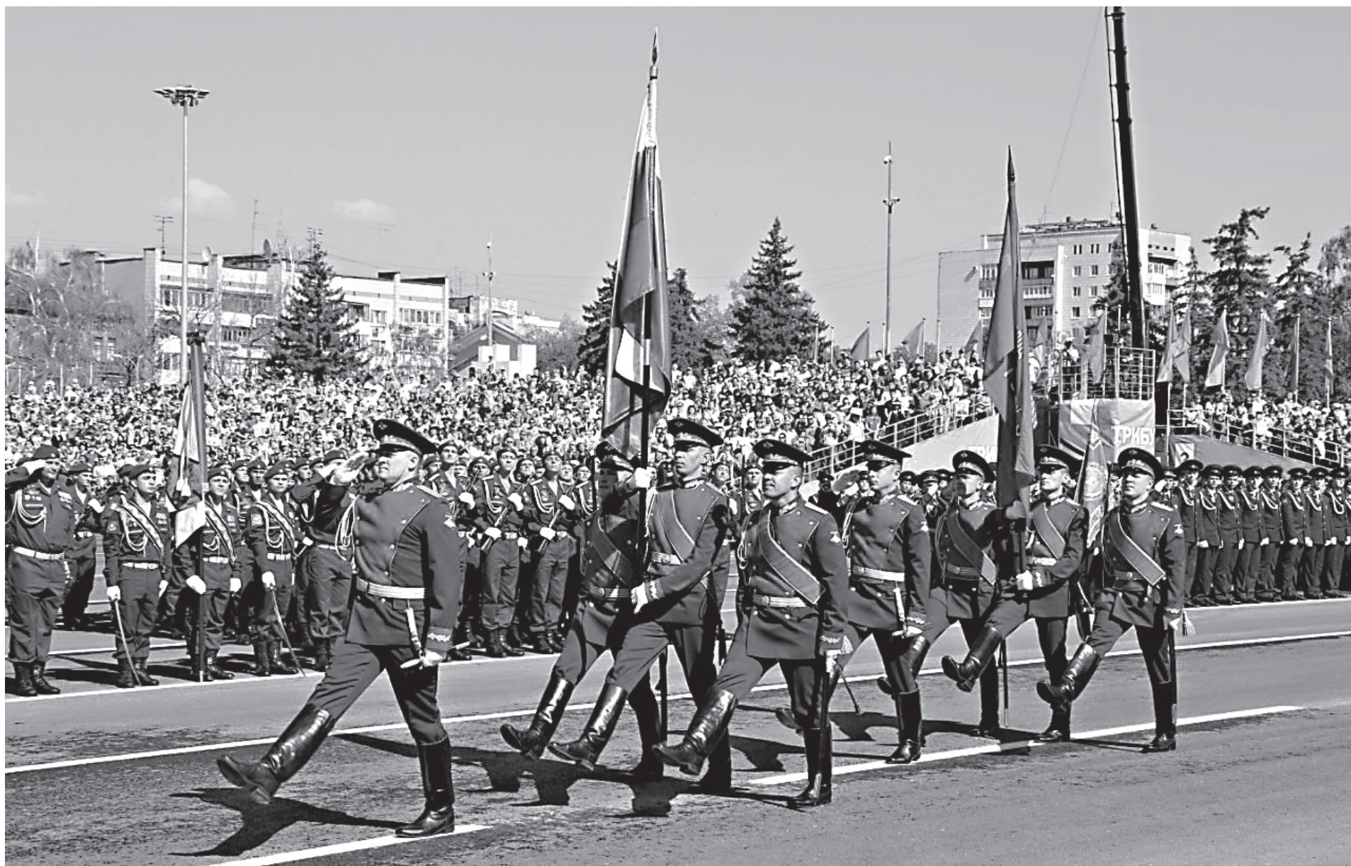
Парад Победы, Самара, 9 мая 2019 года

8 мая 2019 года, в канун 74-й годовщины Победы в Великой Отечественной войне, Святейший Патриарх Московский и всея Руси Кирилл возложил венок к могиле Неизвестного солдата в Александровском саду у Кремлевской стены.