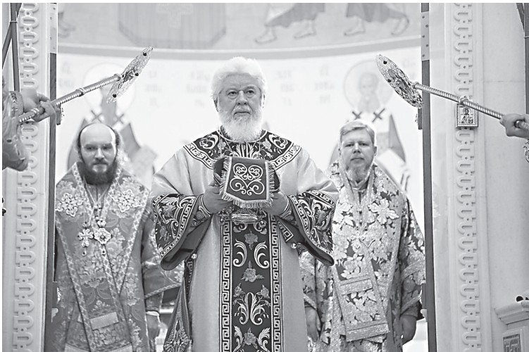
Во время праздничной Божественной литургии