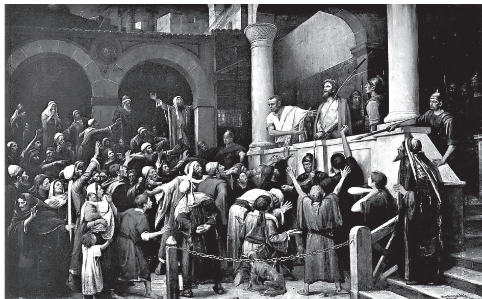
Толпа отвечает Пилату: «Распни Его!»

В дни перед Святой Пасхой, когда распятый Христос воскрес из мёртвых, Слово Божие по этому вопросу должно быть более близко любому человеческому сердцу. Библейское же учение о власти прозрачно и понятно.