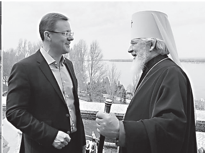
У входа в Софийский собор г. Самары

5 мая, в Неделю апостола Фомы, в Софийском соборе областной столицы состоялось праздничное богослужение и прошли торжества по случаю 30-летия со дня архиерейской хиротонии митрополита Самарского и Тольяттинского Сергия.